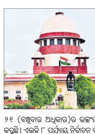
୨୧ (ବଞ୍ଚିବାର ଅଧିକାର)ର ଉଲ୍ଲଙ୍ଘନ କରୁଛି। ଏଭଳି ୮ ପର୍ଯ୍ୟାୟ ନିର୍ବାଚନ ବନ୍ଦ