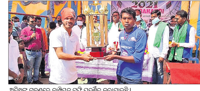
ଅତିଥିଙ୍କ ଗହଣରେ ଗାନ୍ଧୀସ୍ତମ୍ଭ ଗ୍ରହଣ କରାଯାଇଛି।