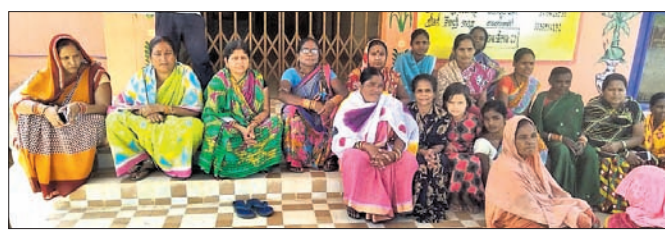
ପଞ୍ଚ ହାତ୍ତସରେ ତାଲା ପକାଇ ଧାରଣା ଦେଇଥିବା ମହିଳାମାନେ। ନାୟକ, ଡକ୍ଟରୀଗୁଡ଼ା ସରପଞ୍ଚ ଅଧିକା ମାଝି, ଡାକ୍ତରୀ ବିଧାୟକ ମନୋହର ରକ୍ଷାକାର୍ଯ୍ୟ ଜଣାଇଥିଲେ ମଧ୍ୟ କିଛି ସୁଧା ମିଳିନାହିଁ। ଏବେ ବି ଏଠାରେ ପାଣି ସମସ୍ୟା ଦେଖାଦେଉଛି। ବାରମ୍ବାର ଅତିଥିମାନଙ୍କୁ ନିରାପତ୍ତରେ ସମାଧାନ ନ ହେବାରୁ ରକ୍ଷାକାର୍ଯ୍ୟ ଜଣାଇଥିଲେ ମଧ୍ୟ କିଛି ସୁଧା ମିଳିନାହିଁ। ଏବେ ବି ଏଠାରେ ପାଣି ସମସ୍ୟା ଦେଖାଦେଉଛି।

ନବରଙ୍ଗପୁର ଜିଲ୍ଲା ଡାକ୍ତରୀ ଲୁକ ଅଧିକ ଡକ୍ଟରୀଗୁଡ଼ା ପଞ୍ଚ ହାତ୍ତସରେ ପାଣି ସମସ୍ୟା ଲାଗି ରହିଛି। ଏହାର ସମାଧାନ ଦାବି କରି ପଞ୍ଚାୟତର ବିଜ୍ଞାନ ଶାଖାରେ ପଦଯାତ୍ରା ପ୍ରସ୍ତୁତ କରାଯାଇଛି। ଏହା ଉପରେ ସମାଧାନ ଦାବି କରି ପଞ୍ଚାୟତର ବିଜ୍ଞାନ ଶାଖାରେ ପଦଯାତ୍ରା ପ୍ରସ୍ତୁତ କରାଯାଇଛି। ଏହା ଉପରେ ସମାଧାନ ଦାବି କରି ପଞ୍ଚାୟତର ବିଜ୍ଞାନ ଶାଖାରେ ପଦଯାତ୍ରା ପ୍ରସ୍ତୁତ କରାଯାଇଛି।