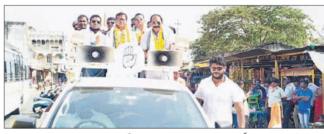
ଶୋଭାଯାତ୍ରାରେ କୋରାପୁଟ ଏମ୍ପିଙ୍କ ସହ କଂଗ୍ରେସ ନେତା ଓ କର୍ମୀମାନେ।