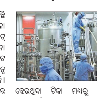
ହେଉଥିବା ଟିକା ମଧ୍ୟରୁ ଭାରତ ୬୦ ପ୍ରତିଶତରୁ ଅଧିକ ଉତ୍ପାଦନ କରୁଥିବାବେଳେ ଚାଇନିଜ୍ ହ୍ୟାକ୍ ଗୁପ୍ତ

ଚାଇନା ସମର୍ଥନ ହ୍ୟାକର୍ସ ଗୁପ୍ତ ଗତି କିଛି ସମ୍ପ୍ରାହରେ ଭାରତରେ କରୋନା ଟିକା ପ୍ରସ୍ତୁତକାରୀ କମ୍ପାନୀ ସିରମ୍ ଇନଷ୍ଟିଚ୍ୟୁଟ୍ ଓ ଭାରତ ବାୟୋଟେକ୍‌ର ସୂଚନା ପ୍ରସ୍ତୁତି (ଆଇଟି) ସିଷ୍ଟମକୁ ଚାର୍ଜେଜ୍ କରିଥିବା ସାଇବର ଇଞ୍ଜିନିୟର ଫାର୍ମି ସାଇଫାର୍ମି ପକ୍ଷରୁ କୁହାଯାଇଛି। ଉଭୟ ଚାଇନା ଓ ଭାରତ ବିଭିନ୍ନ ଦେଶକୁ କରୋନା ଟିକା ପଠାଇଛନ୍ତି। ବିଶ୍ୱର ବିଭିନ୍ନ ଦେଶକୁ ଯୋଗାଣ