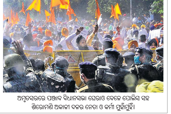
ଅନୁପସରରେ ପଞ୍ଚାବ ବିଧାନସଭା ଘେରାଓ ବେନେ ପୋଲିସ୍ ସହ ଶିରୋମଣି ଅକାଳୀ ଦଳର ନେତା ଓ କର୍ମୀ ମୁହାଁମୁହିଁ

ମ୍ୟାନ୍‌ମାର ସୈନ୍ୟବାହିନୀ ଗତ ଫେବୃଆରୀ ୧ରେ ସାମରିକ ବିଦ୍ରୋହ ବଳରେ ଅର୍ଦ୍ଧ ସାନ୍ ସ୍ତ୍ରୀ ଟୀଙ୍କ ଗଣତାନ୍ତ୍ରିକ ସରକାରକୁ ହଟାଇ କ୍ଷମତା ଦଖଲ କରିଥିଲା। ଏହାର ମାଧ୍ୟମରେ ସ୍ତ୍ରୀ ଟୀ ଏକ ବିଦେଶୀ ଖ୍ରୀଷ୍ଟିକ ମାମଲାରେ ସୋମବାର ଭିଡିଓ ଲିଫ୍ କରିଆରେ ଅଦାଲତରେ ହାଜର ହୋଇଛନ୍ତି।