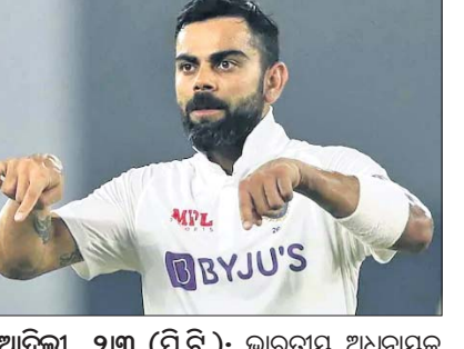
ନୂଆଦିଲ୍ଲୀ, ୨୩ (ପି.ଟି.): ଭାରତୀୟ ଅଧିନାୟକ ବିରାଟ କୋହଲି ହେଉଛନ୍ତି ପ୍ରଥମ କ୍ରିକେଟର, ଯାହାଙ୍କର ସୋସିଆଲ ମିଡ଼ିଆ ପ୍ଲାଟଫର୍ମ ଇନ୍‌ଷ୍ଟାଗ୍ରାମରେ ଅନୁସରଣକାରୀଙ୍କ ସଂଖ୍ୟା ପ୍ରାୟ ୧୦୦ ନିୟୁତ । ଅନ୍ତର୍ଜାତୀୟ କ୍ରିକେଟ୍ ପରିଷଦ (ଆଇସିସି) ପକ୍ଷରୁ ଏକ ରୁଜୁରେ ଏ ବିଷୟ ଜଣାଯାଇଛି । ଏସିଆ-ପ୍ୟାସିଫିକ୍ ଅଞ୍ଚଳରେ ଏହି ସଫଳତା ହାସଲ କରିବାରେ ୩୨ବର୍ଷୀୟ କୋହଲି ହେଉଛନ୍ତି ପ୍ରଥମ ବ୍ୟକ୍ତି । ପୁନଶ୍ଚ ଇନ୍‌ଷ୍ଟାଗ୍ରାମରେ ଅଧିକ ଅନୁସରଣକାରୀ ଥିବା କ୍ରୀଡ଼ାବିତ୍ ତାଲିକାରେ କୋହଲି ଚତୁର୍ଥ ସ୍ଥାନ ଅଧିକାର କରିଛନ୍ତି । ପର୍ତ୍ତୁଗାଲ ଫୁଟବଲ ଷ୍ଟାର କ୍ରିଷ୍ଟିଆନୋ ରୋନାଲ୍ଡୋ ୨୬୫ ନିୟୁତ ଅନୁସରଣକାରୀଙ୍କ ସହ ତାଲିକାର ପ୍ରଥମ ସ୍ଥାନରେ ଅଛନ୍ତି । ଦ୍ଵିତୀୟ ଓ ତୃତୀୟ ସ୍ଥାନରେ ରହିଥିବା ଆଜେନ୍ସିନା ଫୁଟବଲ ଅଧିନାୟକ ତଥା ଏସିଏ ବାସିଲୋନା କିୟନ୍‌ଜା ଲିଓନେଲ ମେସି