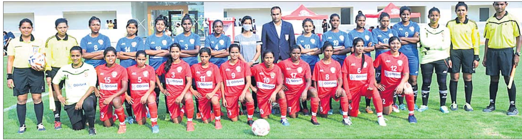
ଓଡ଼ିଶା ଓମେନ୍ସ ଲିଗ୍ ମଙ୍ଗଳବାର ମ୍ୟାଚ ପୂର୍ବରୁ ଇଷ୍ଟକୋଷ୍ଠ ରେଲଡେ ଓ ଓଜିପି କ୍ଲବର ଖେଳାଳିମାନେ ଅତିଥି ଓ ଅତିଥିଆଳଙ୍କ ସହ ।