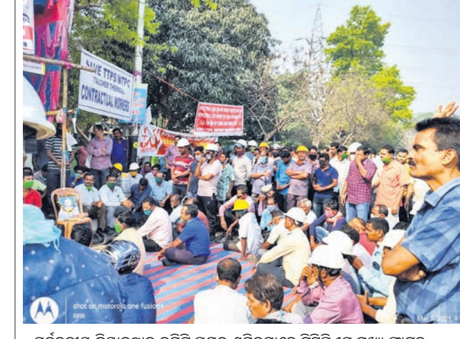
ସର୍ବବଳୀୟ କ୍ରିୟାବୃତ୍ତୀନ କରି ପକ୍ଷରୁ ଶ୍ରମିକମାନେ ଟିପିଏସ୍ ପୁଷ୍ପ ଫାଟକ ସମ୍ମୁଖରେ ଗଣଧାରଣା ଦେଇଛନ୍ତି।

ତାଳଚେର, ୫ମା(ନି.ପ୍ର.) ଉପାଦାନ କ୍ଷମତା ବିଶିଷ୍ଟ ୨ଟି ଯୁନିଟ୍ ସ୍ଥାପନ ଦାବିରେ ଗତ ୧୩ ଦିନ ହେଲା ସର୍ବବଳୀୟ କ୍ରିୟାବୃତ୍ତୀନ କରି ପକ୍ଷରୁ ପୁଷ୍ପ ଫାଟକ ସମ୍ମୁଖରେ ଶ୍ରମିକମାନେ ଗଣଧାରଣା ଦେଇଥିଲେ ମଧ୍ୟ କର୍ତ୍ତୃପକ୍ଷଙ୍କ ପକ୍ଷରୁ କୌଣସି ଆଶ୍ୱାସନା ଦିଆଯାଇ ନାହିଁ। ଏପରି କି ନୀରବ ରହିଥିବାରୁ ଏହି ପୁଷ୍ପ ବନ୍ଦ ହୋଇଯିବା ନେଇ ଆଶଙ୍କା ପ୍ରକାଶ ପାଇଛି। ଫଳରେ ଟିପିଏସ୍ କର୍ମଚାରୀ, ଆନ୍ଦୋଳନଶୀଳ ଶ୍ରମିକମାନଙ୍କ ମଧ୍ୟରେ ହତଶାଭାବ ଦେଖାଦେଇଛି। ପୁଷ୍ପ ଚାଲୁ ରଖିବା ଓ ଫେବ-୩ରେ ୧୩୨୦ ମେଡାଫାଟ୍