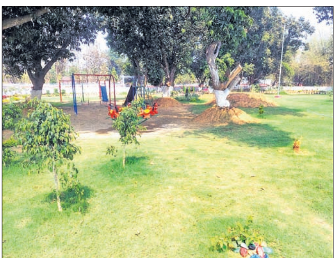
ବିକଶିତ କରାଯାଇଥିବା ଗ୍ରାମୀଣ ପାର୍କ ।