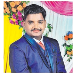
ଜୀବନକର୍ମ ରାଜତରାୟ ଶୁଭ କରୁଥିବା ଅବସରରେ ହାର୍ଡିକ ଅଭିନନ୍ଦନ ଓ ଶୁଭେଚ୍ଛା ପ୍ରକୃତ କରାଯାଉଥିବା ବ୍ୟୟକୁ ଜୀବନର ତଲାସକୁ କୁଣ୍ଠିତ ହେଉ ।

ନିୟମ ଅନୁଯାୟୀ, ୫୦ ଭିତରେ ଅତିଥିଙ୍କୁ ସାଙ୍ଗରେ ନେଇଥିଲେ । ଓଟ ସଦର ପାଇଁ ତାଙ୍କୁ ୧୨୦୦୦ ଟଙ୍କା ଦେବାକୁ ପଡ଼ିଛି ।