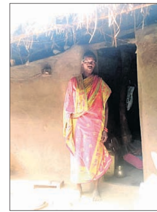
ପଙ୍କା ଘର ଯୋଜନାକୁ ବର୍ଷ ଧରି ଧରି ରହିଛନ୍ତି ଗ୍ରାମର ଜଣେ ଗରିବ ମହିଳା।

ହାତଉଛନ୍ତି ବହୁ ଗରିବ ହିତାଧିକାରୀଙ୍କୁ ପଙ୍କା ଘର ଖଣ୍ଡିତ ପାଇଁ ବର୍ଷ ବର୍ଷ ଧରି ଅପେକ୍ଷା କରୁଥିବା ବେଳେ ପଛରେ ଆବେଦନ କରି