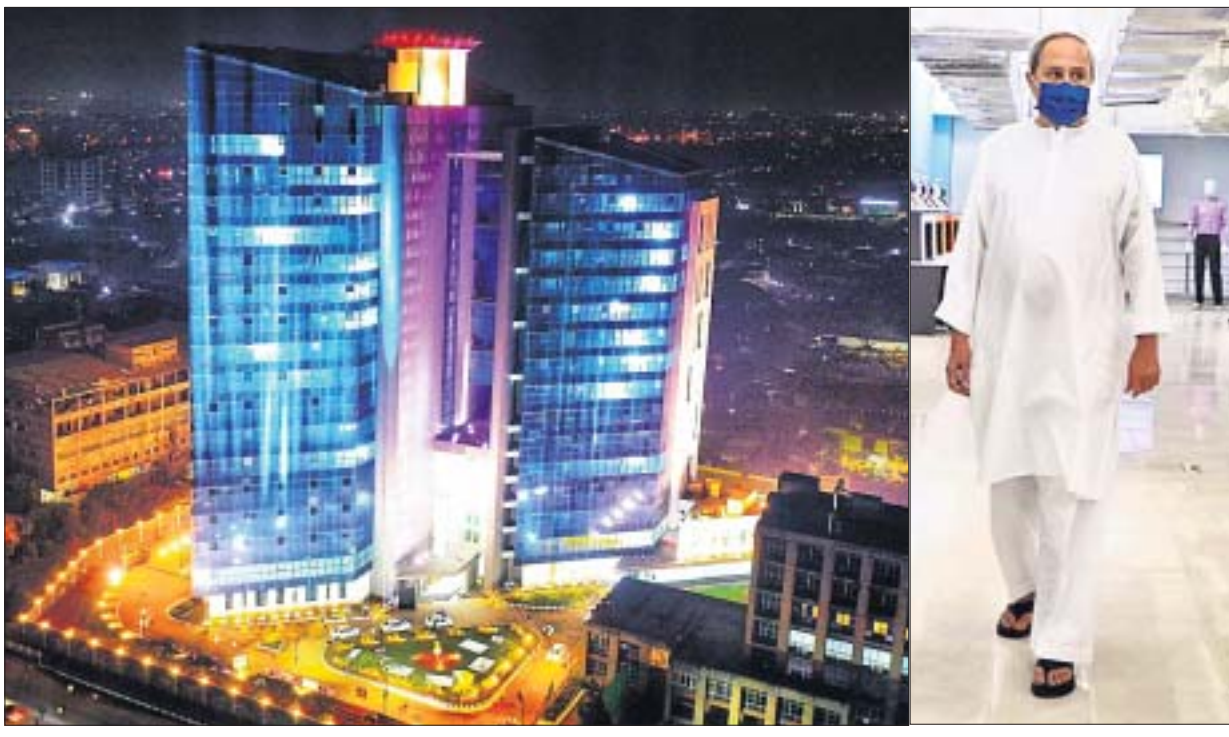
ମୁଖ୍ୟମନ୍ତ୍ରୀ ନବୀନ ପଟ୍ଟନାୟକଙ୍କ ଦ୍ଵାରା ଶୁକ୍ରବାର ଉଦ୍‌ଘାଟିତ ହୋଇଥିବା ବିଶ୍ଵ ଦକ୍ଷତା କେନ୍ଦ୍ର ।