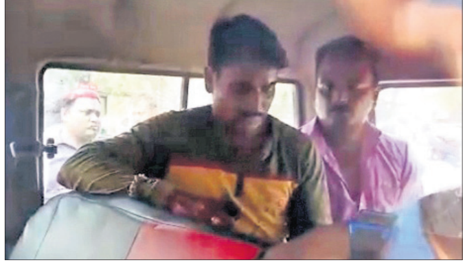
ଦୁଇ ଅଭିଯୁକ୍ତଙ୍କୁ ପୋଲିସ ଭ୍ୟାନରେ ନିଆଯାଇଛି।