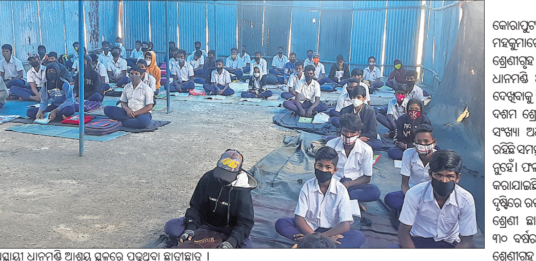
ଅସ୍ଥାୟୀ ଧାନମଣ୍ଡି ଆଗ୍ରୟ ସ୍ଥଳରେ ପଢୁଥିବା ଛାତ୍ରଛାତ୍ରୀମାନେ।

କୋରାପୁଟ ଜିଲା କୁନ୍ତୁରା ବ୍ଲକ ଉତ୍ତରପାଞ୍ଚିଶା ପଞ୍ଚାୟତ ସଦର ମହକୁମାରେ ଥିବା ଅନନ୍ତ ବିଦ୍ୟାଳୟରେ ଛାତ୍ରଛାତ୍ରୀମାନେ ଶ୍ରେଣୀଗୃହ ଅଭାବରୁ ବିଦ୍ୟାଳୟ ସମ୍ମୁଖରେ ଥିବା ଅସ୍ଥାୟୀ ଧାନମଣ୍ଡି ଆଗ୍ରୟସ୍ଥଳରେ ବସି ପାଠ ପଢୁଥିବା ଶିନିଦାର ଦେଖିବାକୁ ମିଳିଛି। ବିଦ୍ୟାଳୟରେ ନବମ ଶ୍ରେଣୀର ୧୬୭ ଓ ଦଶମ ଶ୍ରେଣୀର ୧୯୬ ଛାତ୍ରଛାତ୍ରୀ ରହିଛନ୍ତି।