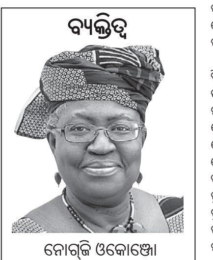
ବ୍ୟକ୍ତିତ୍ୱ ନୋଗ୍‌ଜି ଓକୋଖୋ

ଗାଁ ଉଠିଲେ ଲୋକେ ବୋକୋ ହାରାମ୍ ଚିତ୍ର ଆଖିଆଗକୁ ଆଣୁଛନ୍ତି। ଏହି ଉଗ୍ରପଦା ଗୋଷ୍ଠୀ ଅପହରଣ ଓ ହତ୍ୟା ଘଟଣା ନାଜକେରିଆ ଭାବପୂର୍ଣ୍ଣକୁ ବିଶ୍ୱସ୍ତରରେ ଶୁଣୁ କରିଆସିଛି। ହେଲେ ଏବେ ନାଜକେରିଆ ତା'ର ଜଣେ ପ୍ରତିଭାମୟୀଙ୍କ ପାଇଁ ସକାରାତ୍ମକ ଭାବେ ବିଶ୍ୱ ନଜରକୁ ଆସିଛି। ନୋଗ୍‌ଜି ଓକୋଖୋ ଇଫ୍ରେଲ ବିଶ୍ୱ ବାଣିଜ୍ୟ ସଙ୍ଗଠନ (ଡକ୍‌ସିଠିଓ)ର ମହାନିର୍ଦ୍ଦେଶକ ବା ମୁଖ୍ୟ ଭାବେ ୧ ମାର୍ଚ୍ଚ ୨୦୧୧ରେ ନିଯୁକ୍ତ ହେବା ପରେ ସେ ନିଜ ଦେଶକୁ ଗର୍ବିତ କରାଇଛନ୍ତି। ଏଥିସହ ସେ ପ୍ରଥମ ମହିଳା ଏବଂ ପ୍ରଥମ ଆଫ୍ରିକୀୟ ଭାବେ ଏହି ବିଶ୍ୱ ସଙ୍ଗଠନର ବାୟିତ୍ୱ ନେଇଥିବାରୁ ତାଙ୍କ ବ୍ୟକ୍ତିତ୍ୱ ଯୁବପିଢ଼ିଙ୍କୁ ଆକର୍ଷିତ କରିଛି। ଦେଶଗୁଡ଼ିକ ମଧ୍ୟରେ ଅନ୍ତର୍ଜାତୀୟ ବାଣିଜ୍ୟିକ ନିୟନ୍ତ୍ରଣ କରୁଥିବା ସଂସ୍ଥା ହେଉଛି ବିଶ୍ୱ ବାଣିଜ୍ୟ ସଙ୍ଗଠନ (ଡକ୍‌ସିଠିଓ)। ୧୬୪ ଦେଶ ପ୍ରତିନିଧିତ୍ୱ କରୁଥିବା ଏହି ଅନ୍ତର୍ଜାତୀୟ ସଙ୍ଗଠନ ବାଣିଜ୍ୟିକ ପ୍ରସଙ୍ଗ ନେଇ ବିଶ୍ୱ ସ୍ତରରେ ଉତ୍ତୁପାତ ଫଡ଼କୁ ପ୍ରାଣିତ କରିବା ସହ ଏ ସଂସ୍କ୍ରାନ୍ତ କାରବାର ସୁଗମ କରିବା ବିଗରେ ପ୍ରୟାସରେ। ଏଭଳି ଏକ ସଙ୍ଗଠନର ବାୟିତ୍ୱ ଜଣେ ମହିଳାଙ୍କ ଉପରେ ନ୍ୟସ୍ତ କରାଯିବା ସୁଚାରୁ ଦେଖି, ସେ ସେହି ପଦବା ପାଇଁ ନିଜକୁ ସେତିକି ମାତ୍ରାରେ ଯୋଗ୍ୟ କରିପାରିଛନ୍ତି। ୧୯୫୪ରେ ନୋଗ୍‌ଜି ନାଜକେରିଆର ତେଜନା ରାଜ୍ୟର ଓଡ଼ିଶା-ଉତ୍ତୁପାତରେ ଜନ୍ମଗ୍ରହଣ କରିଥିଲେ। ପିତା ପ୍ରଦେସର ବୁଦ୍ଧ୍ୟାଳୀ ଓକୋଖୋ ଓବାହାଲ ରୟାଲ ପାମିଲିର ଓବି (ରାଜା) ଥିଲେ। ନୋଗ୍‌ଜି ଏନୁରୁଦ୍ଧିତ କ୍ୟୁବ୍ ସ୍କୁଲ ଓ ପରେ ଇବାଦାନୁର ଇଣ୍ଡିଆନାଶାଳା ସ୍କୁଲରୁ ଶିକ୍ଷା ଗ୍ରହଣ