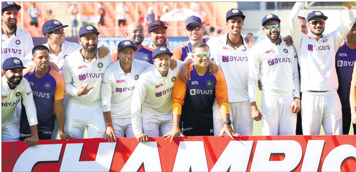
ସିରିଜ ବିଜୟୀ ଭାରତୀୟ ଦଳର ଖେଳାଳିମାନେ। ଚୁପ୍ଟି ସହ ଅଧିନାୟକ ବିରାଟ କୋହଲି।

ନଗର ମୋଦି କ୍ଷୁଦ୍ରମତରେ ଅନୁଷ୍ଠିତ ଚତୁର୍ଥ କ୍ରିକେଟ ଚେଷ୍ଟା ମ୍ୟାଚରେ ଭାରତ ଶନିବାର ଏକ ଇନିଂସ ଓ ୨୫ ରନରେ ଭ୍ରମଣକାରୀ ଇଂଲଣ୍ଡ ପରାସ୍ତ କରିଛି। ଉଦ୍‌ଘାଟନ ଅଣ୍ଟିନ ଓ ଅକ୍ଷର ପଟେଲଙ୍କ ଶ୍ରେଣୀ ଯୋଡ଼ି ଇଂଲଣ୍ଡର ବ୍ୟାଟିଂ ଲାଇନ୍‌ର ବିପର୍ଯ୍ୟୟ ଘଟାଇ ଭାରତକୁ ଏହି ସଫଳତା ପ୍ରଦାନ କରିଛନ୍ତି। ମାତ୍ର ଅଭେଦ ଦିନରେ ଭାରତ ବିଜୟୀ ହୋଇଛି। ଏଥିପରେ ୪ ମ୍ୟାଚ୍ ବିଶିଷ୍ଟ ଏହି ସିରିଜରେ ଭାରତ ୩-୧ରେ ବିଜୟୀ ହୋଇଛି। ଏହି ସିରିଜ ବିଜୟ ଭାରତ ପାଇଁ ବେଶ୍ ଉପଯୋଗୀ ସାବ୍ୟସ୍ତ ହୋଇଛି। ଏଥିପରେ ଭାରତ ଆଗାମୀ ଚୁନାବଳରେ ଖେଳାୟିତାଙ୍କୁ ଥିବା ବିଶ୍ୱ ଚେଷ୍ଟା ଚାମ୍ପିୟନଶିପ (ଡବ୍ଲ୍ୟୁଟିସି) ଫାଇନାଲରେ ଚାଲିଯିବାର ସୁଯୋଗ ମିଳିବ। ପ୍ରଥମ ଇନିଂସରେ ୬ ନମ୍ବରରେ ବ୍ୟାଟିଂ କରିବାକୁ ଆସି ୧୦୧ ରନର ଲକ୍ଷ୍ୟ ଠାଆ ହେବାକୁ ଇଂଲଣ୍ଡ ଖେଳିବା ସହ ୨ଟି କ୍ୟାଚ୍ ନେଇ ଓ