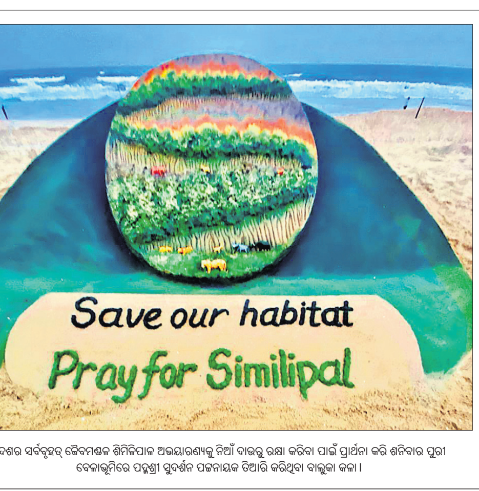
ଦେଶର ସର୍ବବୃହତ୍ ଜୈବବିଭିନ୍ନତା ଅଭୟାରଣ୍ୟକୁ ନିଆଁ ଭାଉଁଟ ରକ୍ଷା କରିବା ପାଇଁ ପ୍ରାର୍ଥନା କରି ଶନିବାର ପୁରୀ ବେଳାଭୂମିରେ ପଦ୍ମଶ୍ରୀ ସୁବର୍ଣ୍ଣ ପଦ୍ମାୟକ ତିଆରି କରିଥିବା ବାଲୁକା କଳା।

ଭୋପାଳ, ୬ମାର୍ଚ୍ଚ: ମଧ୍ୟପ୍ରଦେଶ ମୁଖ୍ୟମନ୍ତ୍ରୀ ଶିବରାଜ ସିଂ ଚୌହାନ ଶୁକ୍ରବାର ବ୍ୟାପମ ସ୍ଵୀକାର ପରିଚାଳିତ ନିମ୍ନଲିଖିତ ପରୀକ୍ଷାରେ ଦୁର୍ନୀତି ଅଭିଯୋଗର ତଦନ୍ତ ପାଇଁ ନିର୍ଦ୍ଦେଶ ଦେଇଛନ୍ତି।