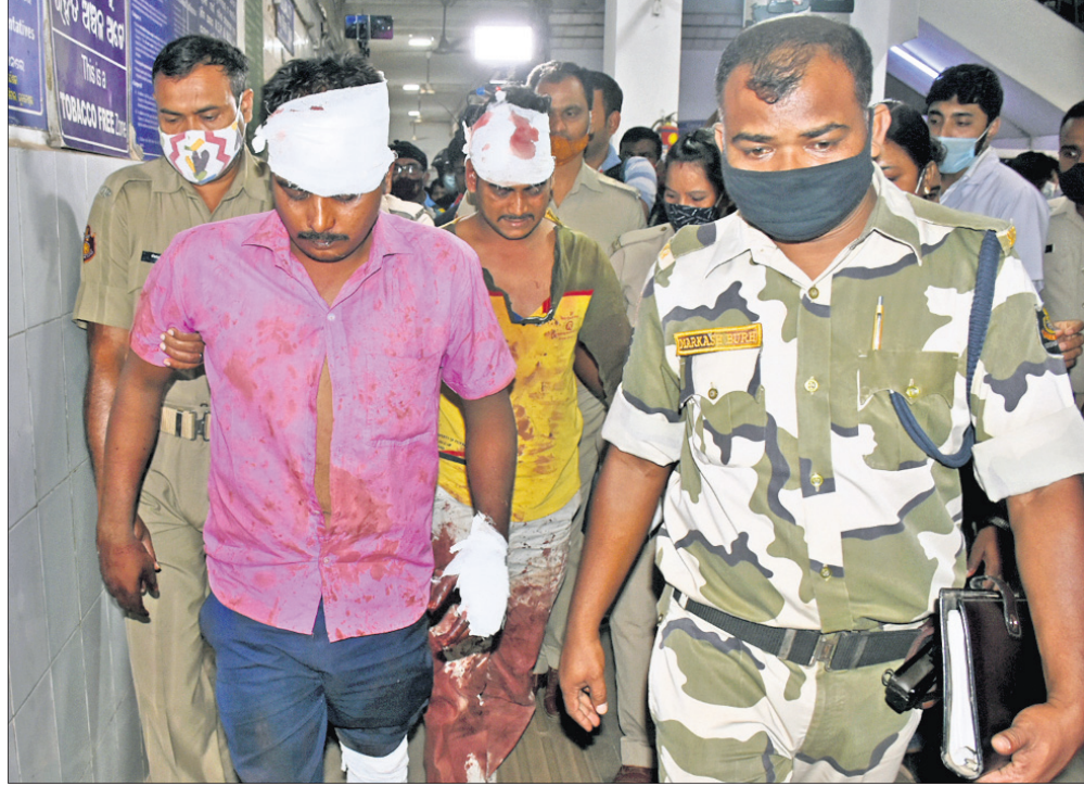
ଉତ୍ତମ ଲୋକଙ୍କ ଆକ୍ରମଣର ଶିକାର ହୋଇ ଆହତ ହୋଇଥିବା ଦୁଇ ଅଭିଯୁକ୍ତଙ୍କ ଚିକିତ୍ସା ପରେ ପୋଲିସ ନେଉଛି।