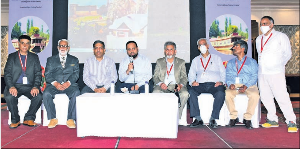
ଜମ୍ବୁ କଣ୍ଠାର ପର୍ଯ୍ୟଟନ ବିଭାଗ ପକ୍ଷରୁ ଭୁବନେଶ୍ୱରଠାରେ ଶନିବାର ଆୟୋଜିତ ରୋଡ୍ ଶୋ' ସମ୍ପର୍କରେ ସୂଚନା ଦିଆଯାଇଛି।

ସୂଚନା ଦେଇଛନ୍ତି। ପୂର୍ବରୁ ଗୁଲମାର୍ଗ ଅହଙ୍କଦାବାଦଠାରେ ଏପରି ରୋଡ୍ ଶୋ ଆୟୋଜିତ ହୋଇଥିଲା। ଆଗକୁ ବେଙ୍ଗାଲୁରୁ, ଭୋପାଳ, ଭରୋର, ଚେନ୍ନାଇ, ରାୟପୁର, ମୁମ୍ବାଇ, ନ୍ୟୁଆଦିଲ୍ଲୀ, କୋଚିନ, ବାରଣାସୀ, ନାଗପୁର ଆଦି ସହରରେ ଏହି କାର୍ଯ୍ୟକ୍ରମ ଆୟୋଜିତ ହେବ। କଣ୍ଠାର ପ୍ରତି ରହିଥିବା ଭୟ ଦୂର କରି ରାଜ୍ୟର ପର୍ଯ୍ୟଟନର ପ୍ରଚାର ପ୍ରସାର ପାଇଁ ଏଭଳି କାର୍ଯ୍ୟକ୍ରମର ପୁଷ୍ଟି ଉଦ୍ଦେଶ୍ୟ ବୋଲି ସେ କହିଛନ୍ତି।