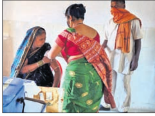
ଚିତ୍ରକୋଣ୍ଡା, ୩୩(ଡି.ଏନ୍.ଏ.)- ମାଲକାନଗିରି ଜିଲା ଚିତ୍ରକୋଣ୍ଡା ଉପଖଣ୍ଡ ଚିକିତ୍ସାଳୟରେ ଅଞ୍ଚଳ ବରିଷ୍ଠ ନାଗରିକମାନଙ୍କୁ ଶିନିଦାର କୋଭିଡ୍ ଟିକା ପ୍ରଦାନ କରାଯାଇଛି।

ଚିତ୍ରକୋଣ୍ଡା, ୩୩(ଡି.ଏନ୍.ଏ.)- ମାଲକାନଗିରି ଜିଲା ଚିତ୍ରକୋଣ୍ଡା ଉପଖଣ୍ଡ ଚିକିତ୍ସାଳୟରେ ଅଞ୍ଚଳ ବରିଷ୍ଠ ନାଗରିକମାନଙ୍କୁ ଶିନିଦାର କୋଭିଡ୍ ଟିକା ପ୍ରଦାନ କରାଯାଇଛି। ଏଥିପାଇଁ ଚିତ୍ରକୋଣ୍ଡା ତାଲୁକାସ୍ତରୀଣ ଏକ ସ୍ୱତନ୍ତ୍ର କକ୍ଷରେ ବ୍ୟବସ୍ଥା କରାଯାଇଥିଲା।