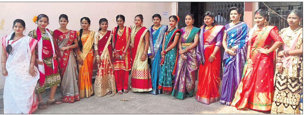
ପାରମ୍ପରିକ ବେଶଭୂଷା ପ୍ରଦର୍ଶନରେ ଅଂଶ ଗ୍ରହଣ କରିଥିବା ଛାତ୍ରୀମାନେ।

କମ୍ପ୍ୟୁଟର, ୩୩(ନି.ପ୍ର.)- ଏକ ଭର୍ଚୁଆଲ ଯୁବକମାନଙ୍କ ଆୟୋଜିତ ବର୍ତ୍ତମାନ ଲିଭର୍ ଆୟୋଜିତ ଏକ ପ୍ରତିଯୋଗିତା-୨୦୨୧ ଅବସରରେ ପ୍ରଧାନମନ୍ତ୍ରୀ ନରେନ୍ଦ୍ର ମୋଦିଙ୍କୁ ସେବାପ୍ରସ୍ତୁତ ଚେଷ୍ଟା କରିବା ଏବଂ ପରିବେଶ ନେତୃତ୍ୱ ପ୍ରଦାନରେ ପୁରସ୍କୃତ କରାଯାଇଛି।