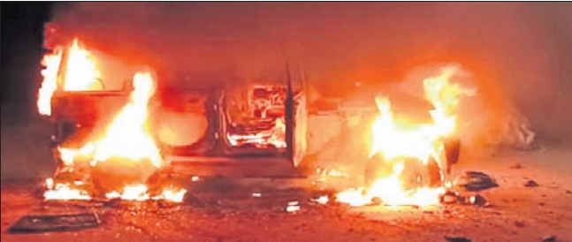
ଚଞ୍ଚିଶୋଳ, (ଡି.ଏଚ୍.ଏ.) / ଯାକପୁର ଅଫିସ୍, ୬।୩

ଯାକପୁର ଜିଲ୍ଲା ବାଲିଚନ୍ଦ୍ରପୁର ଥାନା ଅନ୍ତର୍ଗତ ପଣସୁଆରେ ଶନିବାର ସନ୍ଧ୍ୟାରେ ପୂର୍ବ ଶତ୍ରୁତାକୁ କେନ୍ଦ୍ରକରି ଘଟିଛି ଗୋଷ୍ଠୀ ସଂଘର୍ଷ, ଯାହା ପୋଲିସ ପାଇଁ ମହଙ୍ଗା ପଡ଼ିଛି । ଗୋଷ୍ଠୀ ସଂଘର୍ଷ ଭୟଙ୍କର ରୂପାନ୍ତରଣ କରିଥିବାବେଳେ ଉତ୍ତମ ଲୋକେ ୨ଟି ପୋଲିସ୍ ଭ୍ୟାନକୁ କାଟି ଦେଇଛନ୍ତି । ଏପରି କି ପୋଲିସ କର୍ମଚାରୀମାନେ