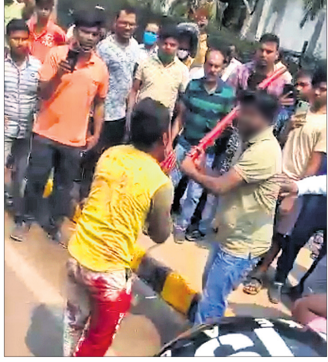
ଆକ୍ରମଣକାରୀଙ୍କୁ ଉତ୍ତମ ଲୋକେ ମାଡ଼ ମାଉଛନ୍ତି।

ଅପରାଧୀ ଓ ଅପରାଧର ଚରାଭୁଜ୍ ପାଲଟିଛି ରାଜଧାନୀ। ଦିନକୁ ଦିନ ହତ୍ୟା ଓ ଅନ୍ୟାନ୍ୟ ଆପରାଧକାରୀ କାର୍ଯ୍ୟକଳାପ ବଢ଼ିବାରେ ଲାଗିଛି। ଅପରାଧୀଙ୍କୁ ପୋଲିସର ଭୟ ଥିବା ଭଳି ମନେ ହେଉନାହିଁ। ସର୍ବ ସମ୍ମୁଖରେ ବିବାଲୋକରେ ଘଟାଇଛନ୍ତି ଅପରାଧ। ଅତିଷ୍ଠ ସହରବାସୀଙ୍କ ମନରେ କ୍ରୋଧର ନିଆଁ ଜଳିବାରେ ଲାଗିଛି, ଯେଉଁଠିପାଇଁ କେତେକ ଲୋକ ଆଇନକୁ ହାତକୁ ନେବାକୁ ମଧ୍ୟ ପଛଘୁଲିନାହାନ୍ତି, ଯାହାର କଳ୍ପନା ଉଦାହରଣ ଦେଖିବାକୁ ମିଳିଛି ଶନିବାର ନୟାପଲ୍ଲୀ ଥାନା ଅଞ୍ଚଳରେ ଘଟିଥିବା ହତ୍ୟାକାଣ୍ଡରେ। ହତ୍ୟାକାରୀ ଅଭିଯୁକ୍ତଙ୍କୁ ପୋଲିସ ପିସିଆର ଭ୍ୟାନରେ ବସିଥିଲେ ମଧ୍ୟ ଘାତୀୟ ଲୋକଙ୍କ ଆକ୍ରୋଶର ଶିକାର ହୋଇଛନ୍ତି। ହତ୍ୟାକାରୀଙ୍କୁ ଏମିତି ନୁହେଁ, ଏମାନଙ୍କୁ ଆମେ ଦଣ୍ଡ ଦେବୁ ବୋଲି କହି ପୋଲିସ ଭ୍ୟାନ କାଟି ଭାଙ୍ଗି ଅଭିଯୁକ୍ତଙ୍କୁ ଗାଡ଼ିରୁ ବାହାରକୁ ଚାଣି ଆଣିଥିଲେ। ଏହାପରେ ଲୋକଙ୍କ ମନରେ ଥିବା ସମସ୍ତ ଆକ୍ରୋଶ ବାହାରକୁ ଆସିଥିଲା। ଅଭିଯୁକ୍ତଙ୍କୁ ରାସ୍ତାରେ ଗୋଡ଼େଇ ଗୋଡ଼େଇ ନିର୍ଧମ ଛେଡ଼ିଥିଲେ। ପୁଷ୍ଟିକ ପାଇପରେ ବାଡ଼େଇ ଅଭିଯୁକ୍ତଙ୍କୁ ଲହୁ ଲୁହାଣ କରିଥିବା ଦେଖିବାକୁ ମିଳିଥିଲା।