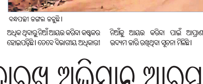
ବନ୍ଧୁପଲ୍ଲୀ ଜଙ୍ଗଲରେ ନିଆଁ ଲାଗି ଗଛ ଜଳିଗଲା।

ବନ୍ଧୁପଲ୍ଲୀ ଜଙ୍ଗଲରେ ନିଆଁ ଲାଗି ଗଛ ଜଳିଗଲା। ବନ୍ଧୁପଲ୍ଲୀ ଜଙ୍ଗଲରେ ନିଆଁ ଲାଗି ଗଛ ଜଳିଗଲା।