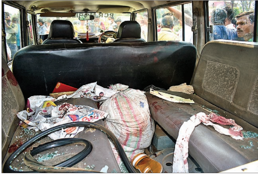
ଉତ୍ତମ ଲୋକଙ୍କ ଦ୍ୱାରା ଭାଙ୍ଗିରୁଜି ଯାଇଥିବା ପିସିଆର ଭ୍ୟାନ।