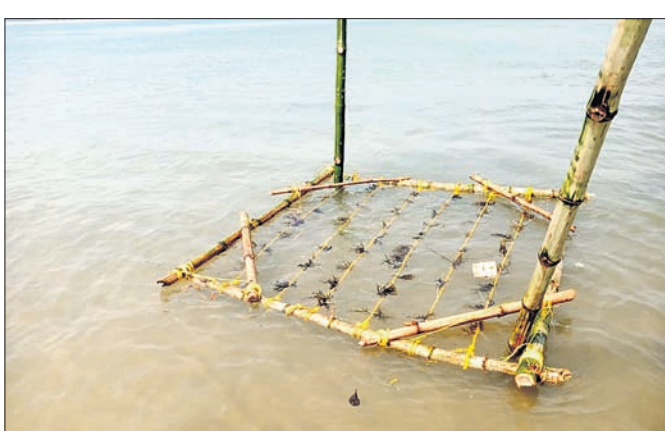
ମହାନଦୀ ମୁହାଣରେ ଶୈବାଳ ଚାଷ କରାଯାଇଛି।

ପାରାଦୀପ, ୬ମାର୍ଚ୍ଚ (ସ୍ଵ.ପ୍ର.): ପାରାଦୀପ ସମେତ ଓଡ଼ିଶାର ୪ ସ୍ଥାନରେ ସମୁଦ୍ର ସେଇ ପ୍ରଥମ କରି ସାମୁଦ୍ରିକ ଶୈବାଳ ଚାଷ ଆରମ୍ଭ ହୋଇଛି।