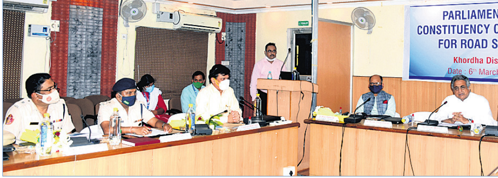
ଜମେକ ପରିସରରେ ଶନିବାର ସଡ଼କ ଦୁର୍ଘଟଣା ସଂସଦୀୟ କମିଟି ବୈଠକରେ ଉପସ୍ଥିତ ଏମ୍ପି ଓ ବରିଷ୍ଠ ଅଧିକାରୀମାନେ।

ସଡ଼କ ଦୁର୍ଘଟଣା ଚିନ୍ତାର କାରଣ ହୋଇଛି। ରାଜ୍ୟରେ ଏହି ହାର ଦିନକୁ ଦିନ ବଢ଼ି ଚାଲିଛି। ଗତ ଦୁଇ ବର୍ଷରେ କେବଳ ଖୋର୍ଦ୍ଧା ଜିଲ୍ଲାରେ ୫୦୦ ଡ୍ରାଇଭିଂ ଲାଇସେନ୍ସ ଧାରୀଙ୍କୁ ବେପରୁଆ ଗାଡ଼ି ଚାଳନା ଯୋଗୁ ଅଧିକାଂଶ ଡ୍ରାଇଭିଂ ଲାଇସେନ୍ସ ହୋଇଛି।