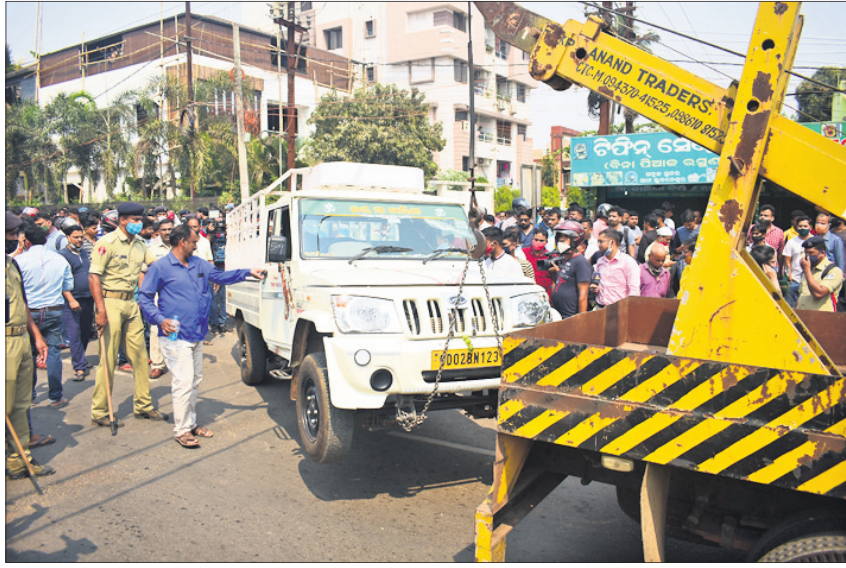
ପିକଅପ୍ ଭ୍ୟାନକୁ ପୋଲିସ ଗୋଟୋନ ଲଗାଇ ନେଉଛି।