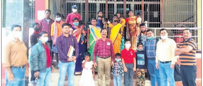
କୋରାପୁଟରୁ ହୃଦ୍‌ରୋଗ ପରୀକ୍ଷା ପାଇଁ ୧୦ ଶିଶୁ ଗଲେ କ୍ୟାମ୍ପିଙ୍ଗ୍ ହସପିଟାଲ।

ରାଷ୍ଟ୍ରୀୟ ବାଲ ସ୍ୱାସ୍ଥ୍ୟ କ୍ୟାମ୍ପିଙ୍ଗ୍ (ଆରବିଏସକେ) କ୍ରିଆରେ କୋରାପୁଟ ଜିଲାର ୧୦ ଜଣ ଶିଶୁଙ୍କୁ ହୃଦ୍‌ରୋଗ ପରୀକ୍ଷା ପାଇଁ ହସପିଟାଲକୁ ପଠାଯାଇଛି।