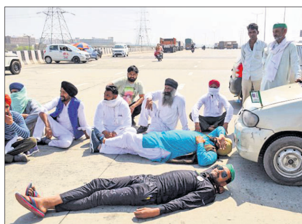
ଗାଜିଆବାଦ୍‌ଠାରେ ଚାଷୀମାନେ ରାଜପଥ ଅବରୋଧ କରିଛନ୍ତି।

କେନ୍ଦ୍ରର ନୂଆ କୃଷି ଆଇନ ବିରୋଧରେ ଦିଲ୍ଲୀ ସୀମାରେ ଚାଲିଥିବା ଚାଷୀ ଆନ୍ଦୋଳନକୁ ଶନିବାର ୧୦୦ ଦିନ ପୂରିଛି। ଏହି ଅବସରରେ ଚାଷୀମାନେ କୁଣ୍ଡଳି-ମାନେସାର-ପଲ୍‌ଓ (କେଏମ୍‌ପି) ଏକ୍ସପ୍ରେସ୍‌କୁ ଅବରୋଧ କରିଥିଲେ। କୃଷି ଆଇନ ବିରୋଧରେ ଆନ୍ଦୋଳନକୁ କୋର୍ଟଦ୍ୱାରା କରିବା ଲାଗି ଏକ୍ସପ୍ରେସ୍‌ରେ ବନ୍ଦ କରିବାକୁ ନିଷ୍ପତ୍ତି ନିଆଯାଇଥିଲା। ହଜାର ହଜାର ଚାଷୀ ୪ ଘଣ୍ଟା ରାତ୍ରି ଅବରୋଧ କରିଥିଲେ।