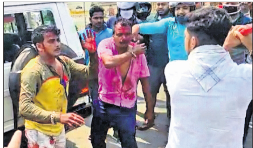
ଅଭିଯୁକ୍ତ ଦୁଇ ଭାଇଙ୍କୁ ଉତ୍ତମ ଲୋକେ ମାଡ଼ ମାରୁଥିବାବେଳେ ଦୃଶ୍ୟ ।

କର୍ତ୍ତବ୍ୟ ପାଳନରେ ଅବହେଳା, ଲାଞ୍ଚ ନେଇ ପାତରଅନ୍ତର, ଅସହାୟଙ୍କୁ ନାଲିଆଖି ଯୋଗୁ ପୋଲିସ୍ ଉପରୁ ଲୋକଙ୍କ ଆଶ୍ରା ତୁଟିଯାଇଛି । ଏଭଳି ସ୍ଥିତିର ଫାଇଦା ଉଠାଇ ଅସାଧାରଣ ବ୍ୟକ୍ତିମାନେ ଦିନକୁଦିନରେ ରାସ୍ତା ଉପରେ ଲୋକଙ୍କୁ ଗୋଡ଼ାଇ ହତ୍ୟା କରୁଥିବା ରାଜ୍ୟର ବିଭିନ୍ନ ସ୍ଥାନରେ ଦେଖିବାକୁ ମିଳୁଛି । ସାଧାରଣ ଲୋକେ ପୋଲିସର ନିଷ୍ପତ୍ତିକୁ ଅନୁଭବ କରି ଆଇନ ହାତକୁ ନେବାକୁ ବାଧ୍ୟ ହେଉଛନ୍ତି, ଯାହାର ଚିତ୍ର ଶନିବାର ଦେଖିବାକୁ ମିଳିଛି ରାଜଧାନୀ ଭୁବନେଶ୍ୱର ଛାତି ଉପରେ । ଚଳନ୍ତା ଗାଡ଼ିରେ ଦୁଇଭାଇ ଜଣେ ଯୁବକଙ୍କୁ ହତ୍ୟା କରିବା ଘଟଣା କେବଳ ଛାତି ଥରାଇ ଦେଇ ନ ଥିଲା, ବରଂ ସ୍ଥାନୀୟ ଲୋକଙ୍କୁ ବ୍ୟତିବ୍ୟସ୍ତ କରିଦେଇଥିଲା । ଉତ୍ତମ ଲୋକମାନେ ଅଭିଯୁକ୍ତ ଦୁଇଭାଇଙ୍କୁ ରାସ୍ତାରେ ନିଷ୍ପତ୍ତ ମାଡ଼ ମାରିଥିଲେ । ଏହି ଘଟଣାରେ ରାଜଧାନୀ ପୋଲିସ ନୀରବଦ୍ରଷ୍ଟା ସାଜିଥିବା ବେଳେ ଯାକପୁର ଜିଲ୍ଲାରେ ଏକ ଗୋଷ୍ଠୀ ସଂଘର୍ଷ ସମୟରେ ପୋଲିସ୍ ଅସହାୟ ହୋଇପଡ଼ିଥିବା ଦେଖିବାକୁ ମିଳିଛି । ଉତ୍ତମ ଲୋକେ ପୋଲିସ୍ ଭ୍ୟାନ ପୋଡ଼ିବା ସହ କର୍ମଚାରୀମାନଙ୍କୁ ନିଷ୍ପତ୍ତ ମାଡ଼ ମାରିଥିଲେ । ଏସବୁ ଘଟଣାକୁ ସ୍ପଷ୍ଟ ହେଉଛି ଯେ, ପୋଲିସର ଚରିତ୍ର ନ ବଦଳିବା ପର୍ଯ୍ୟନ୍ତ ବାରମ୍ବାର ସର୍ବ ସମ୍ମୁଖରେ ଅପରାଧ ଘଟିବା ସହ ଲୋକେ ଆଇନ ହାତକୁ ନେବାକୁ ବାଧ୍ୟ ହେଉଥିବେ ।