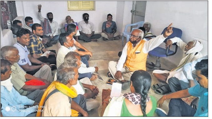
ନୟାଗଡ଼ ଉପଜିଲ୍ଲାପାଳଙ୍କ କାର୍ଯ୍ୟାଳୟ ସମ୍ମୁଖରେ ଗାଷୀ ଧାରଣା।