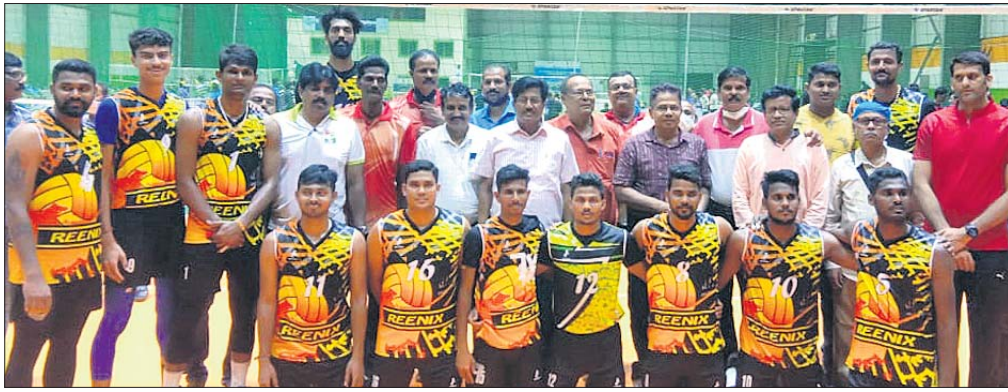
ନକ୍ସାଉତ୍ତର ପ୍ରଦେଶ କରିଥିବା ଓଡ଼ିଶା ଦଳର ଖେଳାଳିମାନେ କର୍ମକର୍ତ୍ତାଙ୍କ ସହ।