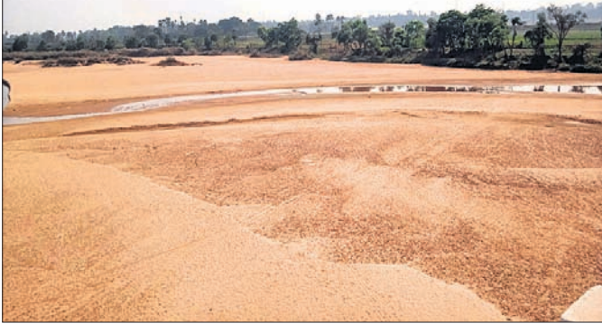
କାର୍ଯ୍ୟ ନଦୀ ଶୁଖିଯାଇଛି।