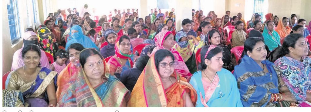
ନିଶାପୁତ୍ରି ଅଭିଯାନ ସଭାରେ ଯୋଗ ଦେଇଥିବା ମହିଳାମାନେ।