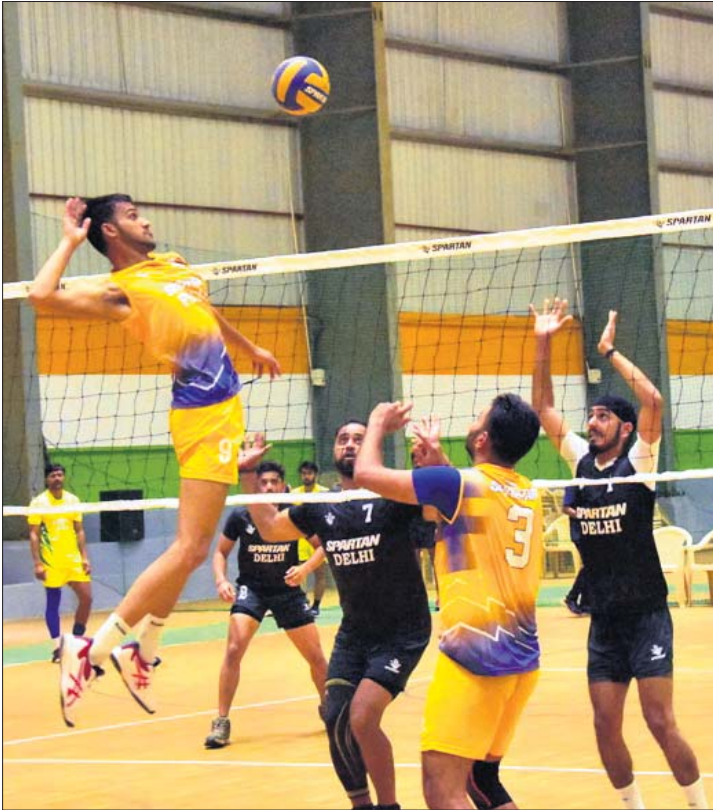
ପଞ୍ଜାବ ଓ ଦିଲ୍ଲୀ ମଧ୍ୟରେ ଅନୁଷ୍ଠିତ ଭଲିବଲ୍ ମ୍ୟାଚ୍ରେ ଏକ ସଂଘର୍ଷପୂର୍ଣ୍ଣ ପୂର୍ଣ୍ଣା।

ଓଡ଼ିଶା ମହିଳା ଦଳ କ୍ରମାଗତ ୩ ମ୍ୟାଚ୍ ଜିତିବାର ଯୋଗ୍ୟତା ପାଇଛି। ପ୍ରଥମ ମ୍ୟାଚରେ ରାଜସ୍ଥାନଠାରୁ ହାରି ଅଭିମାନ ଆରମ୍ଭ କରିଥିବା ଓଡ଼ିଶା ପରବର୍ତ୍ତୀ ୨ଟି ମ୍ୟାଚରେ ଯଥାକ୍ରମେ ମଣିପୁର ଓ ଛତିଶଗଡ଼କୁ ପରାସ୍ତ କରିଥିବାବେଳେ ଯୋଗଦାନ ଆସାମକୁ ହରାଇ ବିଜୟରେ ହାସଲ କରିଛି। ଗୁରୁ 'ସି' ମ୍ୟାଚରେ ଓଡ଼ିଶା ୨୫-୧୫, ୨୫-୧୫, ୨୫-୦୭ ପଏଣ୍ଟରେ ବିଜୟୀ ହୋଇଥିଲା।