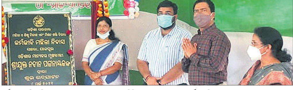
କର୍ମଜୀବୀ ମହିଳା ନିବାସକୁ ମୁଖ୍ୟମନ୍ତ୍ରୀ ନବୀନ ପଟ୍ଟନାୟକ ଭିତିଓ କନଫରେନ୍ସରେ ଲୋକାର୍ପିତ କରିବା ଅବସରରେ।