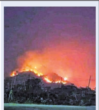
■ କିଛି ସ୍ଥାନରେ ଲୋକେ ଲଗାଇଛନ୍ତି ଜଙ୍ଗଲ ମନୁ। ■ ଦୃଢ଼ କାର୍ଯ୍ୟାନୁଷ୍ଠାନ ନିର୍ଦ୍ଦେଶ