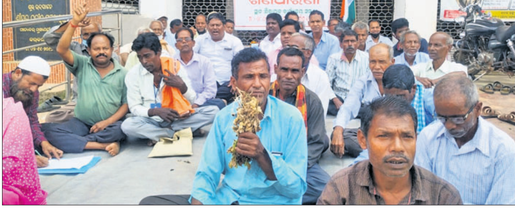
ଜିଲ୍ଲାପାଳଙ୍କ କାର୍ଯ୍ୟାଳୟ ସମ୍ମୁଖରେ ଧାରଣାରତ ନବନିର୍ମାଣ କୃଷକ ସଙ୍ଗଠନର କର୍ମକର୍ମୀ।

ବ୍ୟାଟି କରି ନିର୍ଦ୍ଧାରିତ ୨୦ ଓଭରରେ ୬ ଉଇକେଟ ହରାଇ ୧୬୭ ରନ ସଂଗ୍ରହ କରିଥିଲା। ଜିଲ୍ଲାଲେଲା ଦଳ ୯ ଓଭରରେ ସମସ୍ତ ଉଇକେଟ ହରାଇ ୧୩୨ ରନ ହୋଇଛି। ଏହି ଦଳ ଟ୍ରେ କିଟି ପ୍ରଥମେ