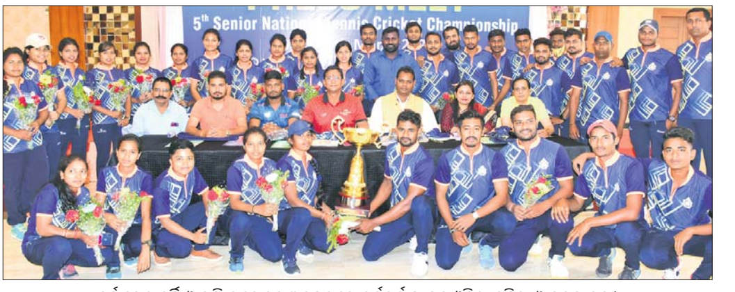
ଚୁର୍ଣ୍ଣମେଣ୍ଟ ଜର୍ସି ଓ ଟ୍ରଫି ଉନ୍ମୋଚନ ଅବସରରେ କର୍ମକର୍ତ୍ତାଙ୍କ ସହ ଓଡ଼ିଶା ମହିଳା ଓ ପୁରୁଷ ଦଳ।

ଓଡ଼ିଶା ରାଜ୍ୟ ଚେନିସ୍ କ୍ରିକେଟ୍ ଆସୋସିଏଶନ ଆନୁକୁଲ୍ୟରେ ୫ମ ଜାତୀୟ ବିନିୟମ ଚେନିସ୍ କ୍ରିକେଟ୍ ଚାମ୍ପିୟନସିପ୍ ଚଳିତମାସ ୯ରୁ ୩୦ରେ ଆରମ୍ଭ ହେବାକୁ ଯାଉଛି। ଚେନିସ୍ କ୍ରିକେଟ୍ ଆସୋସିଏଶନ ଅଫ୍ ଇଣ୍ଡିଆ ବାହାରିବା ଅନେକ ଉଦାହରଣ ରହିଛି ଏବଂ ପ୍ରତିଯୋଗିତା ୧୪ ତାରିଖରେ ଶେଷ ହେବ। ୧୦ ତାରିଖରେ ଉଦ୍‌ଘାଟନା ସମାରୋହ ପରେ ପ୍ରଥମ ରାଉଣ୍ଡ ମ୍ୟାଚ ଆରମ୍ଭ ହେବ। ପ୍ରତିଯୋଗିତାର ଉଭୟ ମହିଳା ଓ ପୁରୁଷ ବିଭାଗରେ ୨୫ଟି ରାଜ୍ୟ/ୟୁନିଟ୍‌କୁ ପାଖାପାଖି ୪୦୦ ଖେଳାଳି ଓ ୧୦୦ ଅଫିସିଆଲ୍, କୋଚ୍, ମ୍ୟାନେଜର ଯୋଗଦେବେ। ଆୟୋଜକ ଓଡ଼ିଶା ବ୍ୟତୀତ ଯେଉଁ ଯୁନିଟ୍ ଏବଂ ରାଜ୍ୟ ଦଳ ଏଥିରେ ଅଂଶଗ୍ରହଣ କରିବାକୁ ସମ୍ମତ ଜଣାଇଛନ୍ତି ସେଗୁଡ଼ିକ ହେଲେ ଖଡ଼ଖଣ୍ଡ, ଛତିଶଗଡ଼, ପଣ୍ଡିଚବଜ୍ର, ଆସାମ, ତେଲେଙ୍ଗାନା, ଅରୁଣାଚଳ ପ୍ରଦେଶ, ତ୍ରିପୁରା, ବିହାର, ଆନ୍ଧ୍ର ପ୍ରଦେଶ, ମଧ୍ୟପ୍ରଦେଶ, କେରଳ, ଲାକ୍ଷାଦୀପ, ତାମିଲନାଡୁ, ମହାରାଷ୍ଟ୍ର, ସାତ୍ରା ନଗର ଆଞ୍ଚ ହାବେଳି, ତାମିଲ ଆଞ୍ଚ ଡିଭି, ରାଜସ୍ଥାନ, ଦିବର୍ତ୍ତ, ମୁୟାଲ, ଜମ୍ମୁ-କଶ୍ମୀର, କର୍ନାଟକ, ଉତ୍ତର ପ୍ରଦେଶ, ଉତ୍ତରାଖଣ୍ଡ, ହରିୟାଣା, ଗୁଜରାଟ, ପୁଡୁଚେରୀ, ପଞ୍ଜାବ, ଚଣ୍ଡିଗଡ଼, ହିମାଚଳ