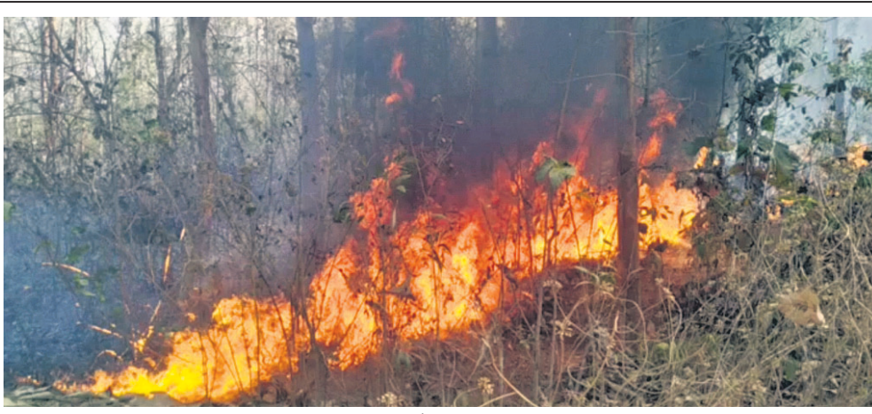
ମୟୂରଭଞ୍ଜ ଜିଲ୍ଲା ବାଲିରିପୋଷି ରେଞ୍ଜ ଅଞ୍ଚଳରେ ଲାଗିଥିବା ନିଆଁ।