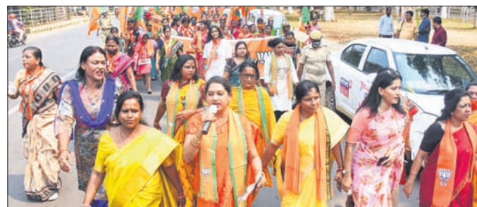
ଅନ୍ତର୍ଜାତୀୟ ମହିଳା ଦିବସରେ ବିଜେଡି ବିରୋଧରେ ଭାଙ୍ଗିପାର ଶୋଭାଯାତ୍ରା।

ଗତ ୨୧ବର୍ଷ ଶାସନ କାଳରେ ରାଜ୍ୟରେ କେତେକ ମହିଳାଙ୍କ କୋଳ ଖାଲି ହୋଇଛି ଏବଂ କେତେ ନାବାଳିକା ବଳାକାର ଓ ହତ୍ୟାର ଶିକାର ହୋଇଛନ୍ତି। ଦାଦନ ଖର୍ଚ୍ଚକୁ କେତେ ଲକ୍ଷ ଓଡ଼ିଆ ବାହାରକୁ ଯାଇଛନ୍ତି ଏବଂ ଏହି କାରଣରୁ କେତେ ମା'ଙ୍କ ଆଖିରୁ ଲୁହ ଝରେ, ସ୍ଵୟଂ ସହାୟକ ଗୋଷ୍ଠୀ କେବଳ ଦଳାୟ ଆଧାରରେ ହୋଇଛି ନା ସାଧାରଣ ମହିଳାଙ୍କୁ ନେଇ ଗଠନ ହୋଇଛି, ସ୍ଵୟଂ କେବଳ ଭୋଟବ୍ୟାଙ୍କ ନୁହେଁ କି ବୋଲି ଏମିତି କେତେକ ପ୍ରଶ୍ନ ପଚାରି ଶାସକ ବିଜେଡିକୁ ଭାଙ୍ଗିବା ମହିଳା ସଭାରେ ପ୍ରଶ୍ନ ପଚାରିବା ଗର୍ବେତ କରିଛନ୍ତି। ଭାଙ୍ଗିବା ପକ୍ଷରୁ ଆୟୋଜିତ ଆନ୍ତର୍ଜାତୀୟ ମହିଳା ଦିବସରେ ସ୍ମୃତି କହିଛନ୍ତି, ଦୀର୍ଘ ୨୧ ବର୍ଷର ଶାସନ