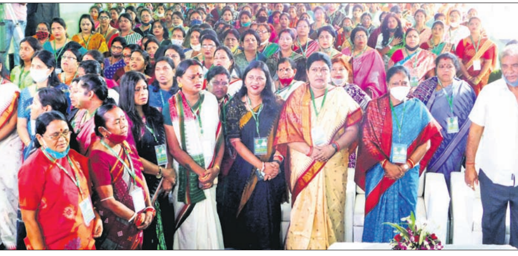
ବିଜେଡି କାର୍ଯ୍ୟାଳୟରେ ଅନ୍ତର୍ଜାତୀୟ ମହିଳା ଦିବସ ପାଳିତ।