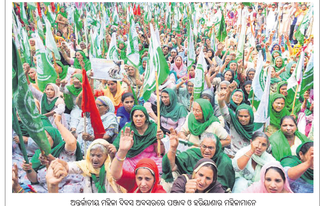
ଅନ୍ତର୍ଜାତୀୟ ମହିଳା ଦିବସ ଅବସରରେ ପଞ୍ଜାବ ଓ ହରିୟାଣାର ମହିଳାମାନେ ଦିଲ୍ଲୀର ଚିତ୍ତୁ ସାମାଜିକ ଚାଲିଥିବା ଚାଷୀ ଆନ୍ଦୋଳନରେ ସାମିଲ ହୋଇଛନ୍ତି।