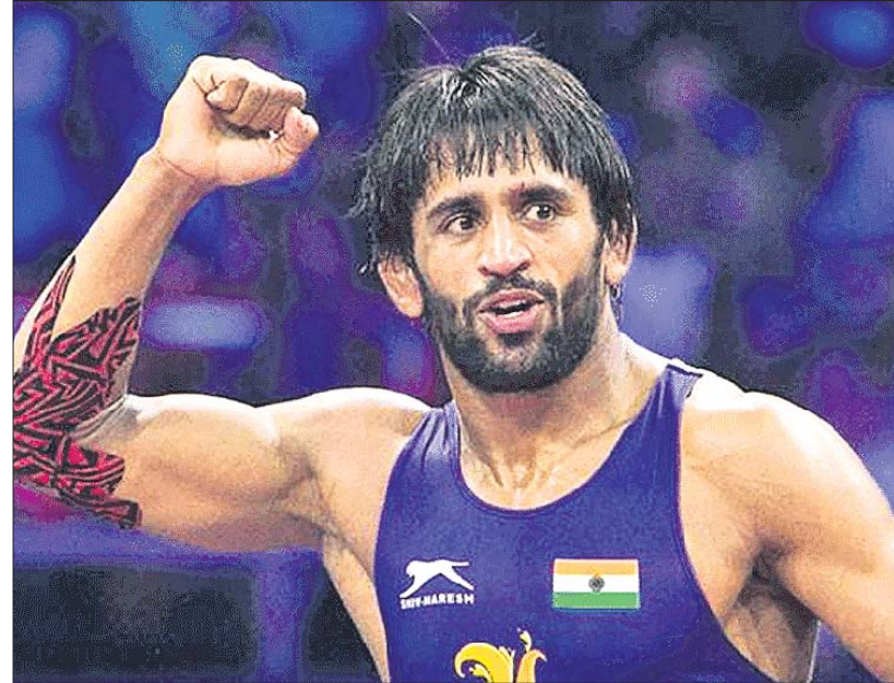
ଭାରତୀୟ ରେସ୍‌ଲର ବଜରଙ୍ଗ ପୁନିଆ।

ରୋମ୍, ୮ମା (ପି.ଟି.): ଆସନ୍ତା ଅଲିମ୍ପିକ୍‌ସରେ ଭାଗ ନେବାକୁଥିବା ଭାରତୀୟ ରେସ୍‌ଲର ବଜରଙ୍ଗ ପୁନିଆ ଏଠାରେ ଚାଲିଥିବା ମାଟେଓ ପେଲିକୋନ୍ ର୍ୟାକିଙ୍ଗ୍ ସିରିଜ ଇଭେଣ୍ଟରେ ସର୍ଣ୍ଣ ପଦକ ଜିତିବା ସହ ତାଙ୍କ ଟାଇଟଲ ବଜାଇ ରଖିଛନ୍ତି। ୬୫ କେଜି ଶ୍ରେଣୀ ଫାଇନାଲରେ ସେ ମଙ୍ଗୋଲିଆର ଚୁଲଗା ଟୁରୁର ଓଡିରୁ ହରାଇ ଦେଇଛନ୍ତି। ତାଙ୍କର ଏହି ପ୍ରଦର୍ଶନ ପାଇଁ ସେ ବିଶ୍ୱର ର୍ୟାକିଙ୍ଗର ନୟର ଓଁ ନ୍ୟାକିଙ୍ଗ୍ ପେରିଓଡିକ୍ କରୋନା ମହାମାରୀ ଯୋଗୁ ୧୧ ବର୍ଷ ତ୍ରେକ୍ ପରେ ପ୍ରତିଯୋଗିତାକୁ ଫେରିଥିବା ୨୭ ବର୍ଷର ବଜରଙ୍ଗଲୁ ଲେଉଟିଫରେ ଉନ୍ନତି ପରିଲକ୍ଷିତ ହୋଇଥିଲା। ଏକ୍ସେସ୍‌ସେନ୍ସ ଆହୁରି ଉନ୍ନତ ଆଶିବାକୁ ପଡ଼ିବ