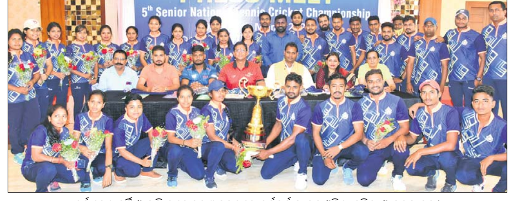
ଚୁର୍ଣ୍ଣମେଣ୍ଟ୍ ଜର୍ସି ଓ ଟ୍ରଫି ଉନ୍ମୋଚନ ଅବସରରେ କର୍ମକର୍ତ୍ତାଙ୍କ ସହ ଓଡ଼ିଶା ମହିଳା ଓ ପୁରୁଷ ଦଳ।

ଓଡ଼ିଶା ରାଜ୍ୟ ଚେନିସ୍ କ୍ରିକେଟ ଆସୋସିଏଶନ ଆନୁକୁଲ୍ୟରେ ୫ମ ଜାତୀୟ ବିନିୟମ ଚେନିସ୍ କ୍ରିକେଟ ଚାମ୍ପିୟନସିପ୍ ଚଳିତମାସ ୯ରୁ ୩୦ତମ ଆରମ୍ଭ ହେବାକୁ ଯାଉଛି। ଚେନିସ୍ କ୍ରିକେଟ ଆସୋସିଏଶନ ଅଫ୍ ଇଣ୍ଡିଆ ଆନୁମୋଦନକ୍ରମେ ହେବାକୁ ଯାଉଥିବା ଏହି ପ୍ରତିଯୋଗିତା ୧୪ ତାରିଖରେ ଶେଷ ହେବ। ୧୦ ତାରିଖରେ ଉଦ୍‌ଘାଟନା ସମାରୋହ ପରେ ପ୍ରଥମ ରାଉଣ୍ଡ ମ୍ୟାଚ ଆରମ୍ଭ ହେବ। ପ୍ରତିଯୋଗିତାର ଉତ୍ତମ ମହିଳା ଓ ପୁରୁଷ ବିଭାଗରେ ୨୫ଟି ରାଜ୍ୟ/ୟୁନିଟ୍‌କୁ ପାଖାପାଖି ୪୦୦ ଖେଳାଳି ଏବଂ ୧୦୦ ଅଫିସିଆଲ୍, କୋଚ୍, ମ୍ୟାନେଜର ଯୋଗଦେବେ। ଆୟୋଜକ ଓଡ଼ିଶା ବ୍ୟତୀତ ଯେଉଁ ଯୁନିଟ୍ ଏବଂ ରାଜ୍ୟ ଦଳ ଏଥିରେ ଅଂଶଗ୍ରହଣ କରିବାକୁ ସମ୍ମତ ଜଣାଇଛନ୍ତି ସେଗୁଡ଼ିକ ହେଲେ ଖଡ଼ଖଣ୍ଡ, ଛତିଶଗଡ଼, ପଶ୍ଚିମବଙ୍ଗ, ଆସାମ, ତେଲଙ୍ଗାନା, ଅରୁଣାଚଳ ପ୍ରଦେଶ, ତ୍ରିପୁରା, ବିହାର, ଆନ୍ଧ୍ର ପ୍ରଦେଶ, ମଧ୍ୟପ୍ରଦେଶ, କେରଳ, ଲାକ୍ଷାଦୀପ, ତାମିଲନାଡୁ, ମହାରାଷ୍ଟ୍ର, ସାତ୍ରା ନଗର ଆଞ୍ଚଳିକ ହାବେଲି, ତାମିଲ ଆଞ୍ଚଳିକ, ରାଜସ୍ଥାନ, ଦିବର୍ତ୍ତ, ମୁୟାଲ, ଜମ୍ମୁ-କଶ୍ମୀର, କର୍ନାଟକ, ଉତ୍ତର ପ୍ରଦେଶ, ଉତ୍ତରାଖଣ୍ଡ, ହରିୟାଣା, ଗୁଜରାଟ, ପୁଡୁଚେରୀ, ପଞ୍ଜାବ, ଚଣ୍ଡିଗଡ଼, ହିମାଚଳ