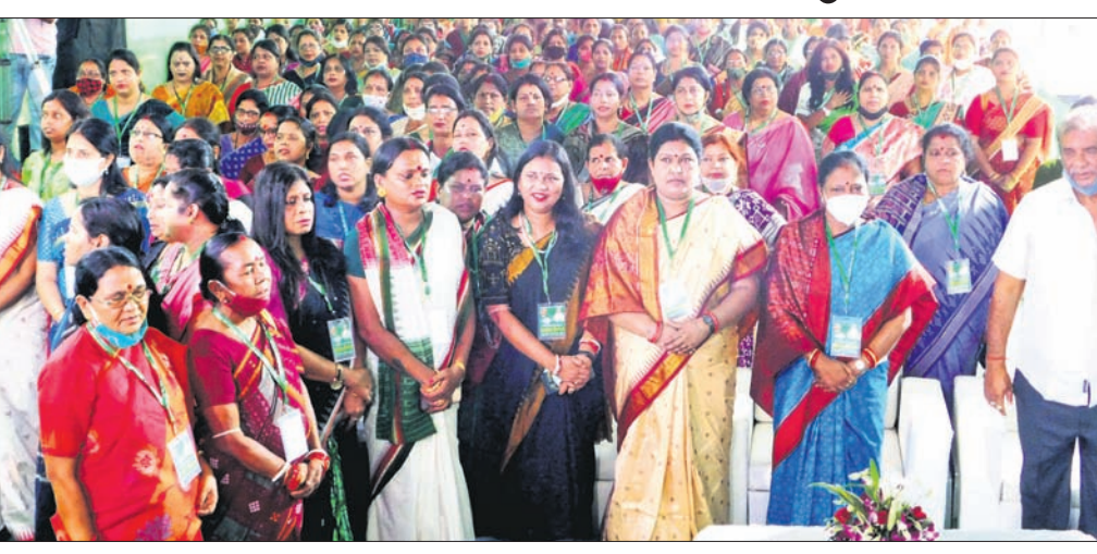
ବିଜେଡି କାର୍ଯ୍ୟାଳୟରେ ଅନ୍ତର୍ଜାତୀୟ ମହିଳା ଦିବସ ପାଳିତ।