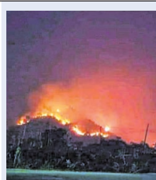
କିଛି ସ୍ଥାନରେ ଲୋକେ ଲଗାଇଛନ୍ତି ଜଙ୍ଗଲ ମଲ୍ଚା। ଦୃଢ଼ କାର୍ଯ୍ୟାନୁଷ୍ଠାନ ନିର୍ଦ୍ଦେଶ