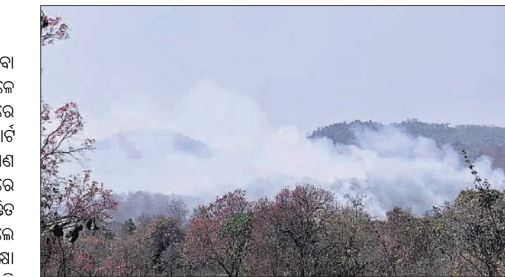
ଶିମିଳିପାଳକୁ ବାହାରୁ ଥିବା ଧୂଆଁ।

ଶିମିଳିପାଳ ଅଭୟାରଣ୍ୟରେ ଲାଗିଥିବା ନିଆଁ ଅଣାୟତ୍ତ ହୋଇଥିବା ବେଳେ ଦିନକୁ ଦିନ ଏହା ବୃଦ୍ଧି ପାଇବାରେ ଲାଗିଛି। ନାସା ପକ୍ଷରୁ ପ୍ରବନ୍ଧ ରିପୋର୍ଟ ଅନୁଯାୟୀ ଶିମିଳିପାଳ ବ୍ୟାଘ୍ର ସଂରକ୍ଷଣ ଅଞ୍ଚଳର କୋର ଓ ବଫର ଅଞ୍ଚଳରେ ନିଆଁ ବୃଦ୍ଧି ପାଇବାରେ ଲାଗିଛି। ସୁଚିତ ପଦକ୍ଷେପ ଗ୍ରହଣ କରା ନ ଗଲେ ଅଭୟାରଣ୍ୟ ଓ ଜୀବଜନ୍ତୁଙ୍କୁ ସୁରକ୍ଷା ଦେବା କଷ୍ଟକର ହୋଇପଡ଼ିବ ବୋଲି ମତପ୍ରକାଶ ପାଉଛି। ଶିମିଳିପାଳ ନିର୍ଦ୍ଦେଶ ଥିବା ବ୍ୟାଘ୍ର ସଂରକ୍ଷଣ ପ୍ରକଳ୍ପ ଅଞ୍ଚଳର ଚଢ଼ା, ବରେହିପାଣି, ଉତ୍ତମ, କବାଟପାଲ ଓ ସାଉଥର ବେଦପୁର, ପାଟବିଲ୍, କାଞ୍ଜଭେନ୍ଦୁ, ସାହୁଆ, ପୋଡ଼ାଡ଼ିହା, ଭଞ୍ଜବଦା, ବାରହାକାମୁଡ଼ା, ନଅଁଶା, ସାଉଥରେ ଥିବା ମହାବୀରମାଳ, ବଡ଼ଗାଁ, ପିଠାବଟା, ଭୁଞ୍ଜୁରା, ଚାଳବନ୍ଧ, ଗୁରୁଗୁଡ଼ିଆ, ରୁଧୁଆଣି, କରଞ୍ଜିଆ, ବରେହିପାଣି, କେନ୍ଦୁଝର ଓ ଠାକୁରମୁଣ୍ଡା ରେଞ୍ଜର ୪୦ରୁ ଉର୍ଦ୍ଧ୍ୱ ସ୍ଥାନରେ ନିଆଁ ଜଳୁଛି। ବିଭାଗ ପକ୍ଷରୁ ନିଆଁକୁ ଆୟତ କରିବା ପାଇଁ ପ୍ରୟାସ କାରି ରହିଥିବା ବେଳେ