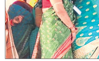
ମହିଳା ସମାବେଶରେ ଯୋଗଦେଇଥିବା ଭାଜପାର ନେତୃମଣ୍ଡଳୀ ।