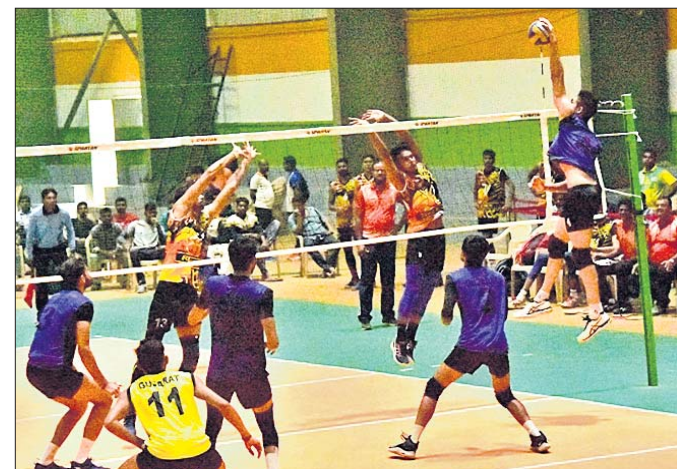
ଓଡ଼ିଶା ଓ ଚୁକ୍କରାଟ ମଧ୍ୟରେ ଅନୁଷ୍ଠିତ ମ୍ୟାଚ୍‌ର ଏକ ସଂଘର୍ଷପୂର୍ଣ୍ଣ ମୁହୂର୍ତ୍ତ ।

କିରୁ ବିଜୁ ପଟ୍ଟନାୟକ ଇନ୍‌ଡୋର ଷ୍ଟାଡିୟମରେ ଚାଲିଥିବା ୬୯ତମ କ୍ରୀଡ଼ା ସମିତିର ଭଲିବଲ୍ ଚାମ୍ପିୟନଶିପ୍‌ର ଲିଗ୍ ଫର୍ମାୟରେ ଚମତ୍କାର ପ୍ରଦର୍ଶନ କରି ଅପରାଜେୟ ରହିଥିବା ଓଡ଼ିଶା ପୁରୁଷ ଦଳର ଅଭିଯାନ ଘୋ-ଅପ୍‌ରୁ ଶେଷ ହୋଇଯାଇଛି । ନିଜ ପ୍ରଥମ ୫ ମ୍ୟାଚରେ ଛତିଶଗଡ଼, ଲଦାଖ, ଚଣ୍ଡିଗଡ଼, ଦିଲ୍ଲୀ ଏବଂ ଉତ୍ତରାଖଣ୍ଡ ପ୍ରଦେଶକୁ ହରାଇ ଦୀର୍ଘ ୨୬ ବର୍ଷ ବ୍ୟବଧାନରେ ନ୍ୟୁଆଇରେ ପ୍ରବେଶ କରିଥିବା ଓଡ଼ିଶା ମଙ୍ଗଳବାର ଅନୁଷ୍ଠିତ ଘୋ-ଅପ୍‌ରେ ଚୁକ୍କରାଟାକୁ ୦-୩ ସେଟ୍‌ରେ ପରାଜିତ ହୋଇଛି । ଲକ୍ଷ୍ଣୋ ପ୍ରଦର୍ଶନ କରିଥିଲେ ହେଁ ଦଳ ୨୩-୨୫, ୨୩-୨୫ ଓ ୨୩-୨୫ ଫର୍ମାୟରେ ହାରିଯାଇଛି । ଅନ୍ୟ ଘୋ-ଅପ୍ ମ୍ୟାଚରେ ଆନ୍ଧ୍ରପ୍ରଦେଶ ୩-୨(୧୯-୨୫, ୨୫-୨୩, ୨୫-୨୨, ୨୦-୨୫, ୧୬-୧୪) ସେଟ୍‌ରେ ମହାରାଷ୍ଟ୍ରକୁ ହରାଇ ଭୁବନେଶ୍ୱରରେ ପ୍ରବେଶ କରିଥିଲା । ତେବେ ଭୁବନେଶ୍ୱରରେ ଏହି ଦୁଇ ଦଳ ପରାଜିତ ହୋଇ ବିବାହ ନେଇଛନ୍ତି । ଏହି ଫର୍ମାୟରେ ରାଜସ୍ଥାନ ୩-୦(୨୫-୧୭, ୨୫-୨୧)ରେ ଆନ୍ଧ୍ରପ୍ରଦେଶ ୧୯-୧୯, ୨୫-୧୮) ସେଟ୍‌ରେ ହରାଇ ଭୁବନେଶ୍ୱରରେ ପ୍ରବେଶ କରିଛି । ମହିଳା ବିଭାଗ ଘୋ-ଅପ୍‌ରେ କର୍ନାଟକ ୩-୦(୨୫-୧୯, ୨୫-୧୧, ୨୫-୨୧) ସେଟ୍‌ରେ ରାଜସ୍ଥାନ ଏବଂ ଚଣ୍ଡିଗଡ଼ ୩-୦(୨୫-୨୪, ୨୫-୨୩, ୨୫-୧୮) ସେଟ୍‌ରେ ଚୁକ୍କରାଟକୁ ପରାସ୍ତ କରି ଭୁବନେଶ୍ୱରରେ ପ୍ରବେଶ କରିଥିଲା । ପରେ ଭୁବନେଶ୍ୱର ଫର୍ମାୟରେ କର୍ନାଟକ ୩-୦ରେ ଚାମ୍ପିୟନାନ୍ତୁ ଏବଂ ଚଣ୍ଡିଗଡ଼ ୩-୦ରେ ହରିୟାଣାକୁ ପରାସ୍ତ କରି ଭୁବନେଶ୍ୱର ଫାଇନାଲରେ ପ୍ରବେଶ କରିଛି । ଭୁବନେଶ୍ୱର ଫାଇନାଲରେ ପ୍ରବେଶ କରିଥିବା ଦଳକୁ ଓଡ଼ିଶା ଭୁବନେଶ୍ୱରରେ ପ୍ରବେଶ କରିଛି ।