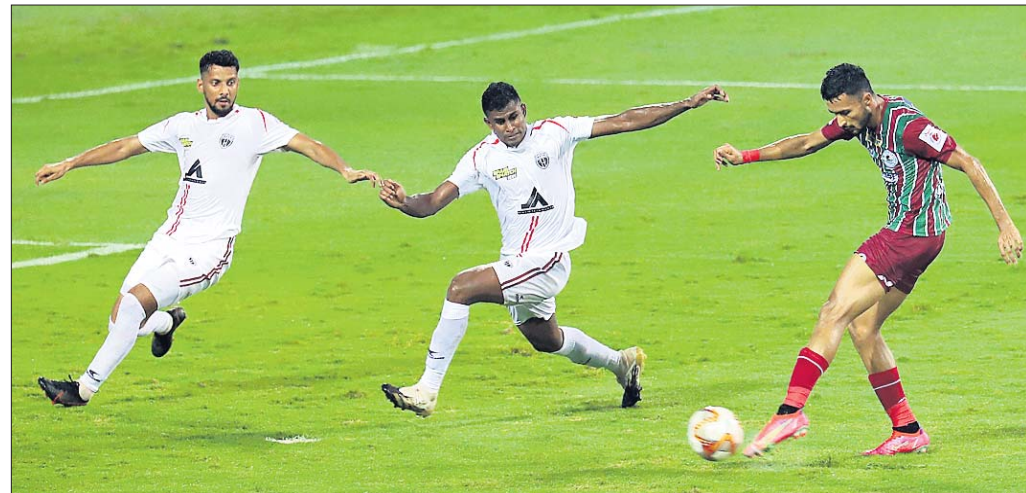
ନର୍ଥଇଷ୍ଟ ମୁମ୍ବାଇଚେଡ଼ ଓ ଏଟିକେ ମୋହନ ବାଗାନ ମଧ୍ୟରେ ଅନୁଷ୍ଠିତ ମ୍ୟାଚ୍ ।