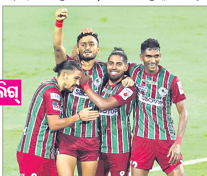
ଏଟିକେ ମୋହନ ବାଗାନର ବିଜୟରେ ଉଲ୍‌ସିତ ଖେଳାଳିମାନେ ।