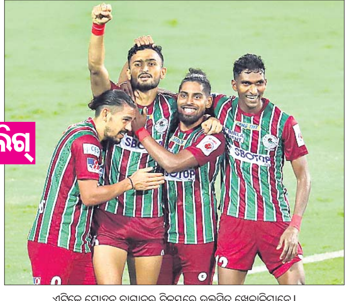
ଏଟିକେ ମୋହନ ବାଗାନର ବିଜୟରେ ଉଲ୍ଲାସିତ ଖେଳାଳିମାନେ।