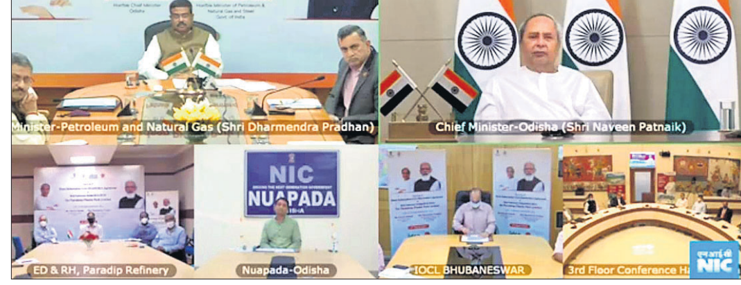
ମୁଖ୍ୟମନ୍ତ୍ରୀ-ପେଟ୍ରୋଲିୟମ ଓ ପ୍ରାକୃତିକ ଗ୍ୟାସ୍ (ଶ୍ରୀ ଧର୍ମେନ୍ଦ୍ର ପ୍ରଧାନ)

ରାଜ୍ୟ ସରକାର ତାଉନ୍ଦିନି ପ୍ଲାଷ୍ଟିକ ଇଣ୍ଡଷ୍ଟ୍ରି ପାଇଁ ପାରାଦୀପଠାରେ ଏକ ଶିଳ୍ପ ପାର୍କ ବିକାଶ କରୁଛନ୍ତି। ପାରାଦୀପଠାରେ ହେବାକୁ ଥିବା ଏହି ପ୍ଲାଷ୍ଟିକ ପାର୍କ ବିକାଶ ରାଜ୍ୟ ଓ କେନ୍ଦ୍ର ସହଭାଗିତାରେ ହେବ। ଏ ନେଇ ମଙ୍ଗଳବାର ଭର୍ଚୁଆଲ ପ୍ଲଟଫର୍ମ କ୍ରିଆରେ ମୁଖ୍ୟମନ୍ତ୍ରୀ ନବୀନ ପଟ୍ଟନାୟକ ଏବଂ କେନ୍ଦ୍ର ପେଟ୍ରୋଲିୟମ ମନ୍ତ୍ରୀ ଧର୍ମେନ୍ଦ୍ର ପ୍ରଧାନଙ୍କ ଉପସ୍ଥିତିରେ ଇଡିକୋ ଏବଂ ଭାରତୀୟ ଟେଲ ନିଗମ(ଆଇଓସିଏଲ) ମଧ୍ୟରେ ଗୁଠାମଣାପତ୍ର (ଏମ୍.ଓ.ସି.) ସ୍ୱାକ୍ଷର ହୋଇଛି। ଏହି ଅବସରରେ ମୁଖ୍ୟମନ୍ତ୍ରୀ କହିଛନ୍ତି, ଆଇଓସିଏଲ ଦ୍ୱାରା ଓଡ଼ିଶାରେ କରାଯାଉଥିବା ପେଟ୍ରୋଲିୟମ ଓ ପେଟ୍ରୋକେମିକାଲ ପୁଞ୍ଜିନିବେଶରେ ରାଜ୍ୟ ସରକାର ସମସ୍ତପ୍ରକାର ସହଯୋଗ ଯୋଗାଇ ଦେଉଛନ୍ତି। ଓଡ଼ିଶାର ପଲିମର୍ ତାଉନ୍ଦିନି ଇଣ୍ଡଷ୍ଟ୍ରି ପାଇଁ ପାରାଦୀପ ପ୍ଲାଷ୍ଟିକ ପାର୍କ ଭିତ୍ତିଭୂମି ଯୋଗାଇଦେବା ଓଡ଼ିଶାରେ ସୁବିକାମୟ କରାଯାଇଛି। ଓଡ଼ିଶାରେ ପଲିମର୍ ତାଉନ୍ଦିନି ଶିଳ୍ପ ପାଇଁ ଆଇଓସିଏଲ ମଧ୍ୟ ଗୁରୁତ୍ୱପୂର୍ଣ୍ଣ ଭୂମିକା ନିର୍ବାହ କରିବା ଆବଶ୍ୟକ। ରାଜ୍ୟରେ ପେଟ୍ରୋକେମିକାଲ ଶିଳ୍ପ ବିକାଶ କ୍ଷେତ୍ରରେ ପ୍ଲାଷ୍ଟିକ ପାର୍କ ଆବଶ୍ୟକ ସହାୟତା କରିବ ବୋଲି ମୁଖ୍ୟମନ୍ତ୍ରୀ ଆଶାବ୍ୟକ୍ତ କରିଛନ୍ତି। ମୁଖ୍ୟମନ୍ତ୍ରୀ ପାର୍କର ସଫଳତା କାମନା କରିବା ସହ ରାଜ୍ୟ ସରକାର ଏ ଦିଗରେ ଆଇଓସିଏଲକୁ ସମସ୍ତ ସହାୟତା ଯୋଗାଇଦେବେ ବୋଲି କହିଛନ୍ତି। ଏହି ଅବସରରେ କେନ୍ଦ୍ରମନ୍ତ୍ରୀ ଧର୍ମେନ୍ଦ୍ର