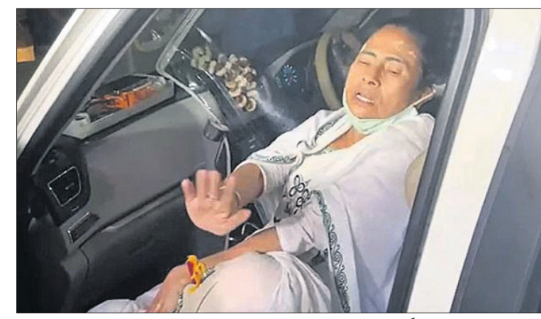
ଆକ୍ରମଣର ଶିକାର ହେବା ପରେ ପଶ୍ଚିମବଙ୍ଗ ମୁଖ୍ୟମନ୍ତ୍ରୀ ମମତା ବାନାର୍ଜୀ।

ଆତ୍ମପ୍ରତ୍ୟୟ ସୃଷ୍ଟି କରିବା ଏହି ପ୍ରକଳ୍ପ ଦ୍ଵାରା ନୂଆପଡ଼ାର କୋମଳା, ଖଡ଼ିଆଳ ଓ ବଲାଙ୍ଗୀରର ବଙ୍ଗୋମୁଣ୍ଡା, ପୁରିବାହାଲ ଏବଂ ଚିଟିଲାଗଡ଼ କୁଳର ୨୦୦ ଗାଁର ୧,୮୦,୦୦୦ ଲୋକଙ୍କୁ ପୃଷ୍ଠା-୨