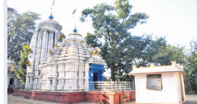
କୋରାପୁଟ ଜିଲ୍ଲାର ପ୍ରସିଦ୍ଧ ଗୁପ୍ତେଶ୍ୱର ପୀଠରେ ୪ ଦିନ ଧରି ଜାଗର ଯାତ୍ରା ପାଳନ କରାଯାଏ।

■ ଶ୍ରୀଲକ୍ଷ୍ମୀଙ୍କ ଅର୍ମାଳ ସ୍ତ୍ରୀନି ପରେ ଭିତରକୁ ଛଡ଼ାଯିବ ■ ହେବନାହିଁ ସାଂସ୍କୃତିକ କାର୍ଯ୍ୟକ୍ରମ