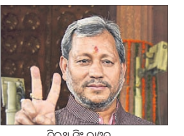
ତିରଥ ସିଂ ରାଓଙ୍କୁ

ଡେରାଡୁନ, ୧୦୩ ଉତ୍ତରାଖଣ୍ଡ ବିଧାନସଭା ନିର୍ବାଚନକୁ ଆଉ ବର୍ଷେ ବାକି ଥିବାବେଳେ ନୂଆ ମୁଖ୍ୟମନ୍ତ୍ରୀ ଭାବେ ତିରଥ ସିଂ ରାଓଙ୍କୁ ରୁଧିରୀ ଶପଥ ଗ୍ରହଣ କରିଛନ୍ତି। ତ୍ରିବେନ୍ଦ୍ର ସିଂ ରାଓଙ୍କ ମଙ୍ଗଳାକାଂକ୍ଷା ମୁଖ୍ୟମନ୍ତ୍ରୀ ପଦକୁ ଲାଭପାଏ।