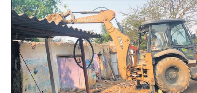
ଏକ ଦୋକାନ ଘର ଭଙ୍ଗାଯାଇଛି।