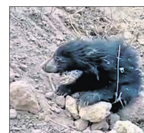
ଗଲିଯାଇଥିବା ବେଳେ ଅସୁସ୍ଥ ହୋଇ ଗୋଟିଏ ଛୁଆ ରହିଯାଇଥିଲା।

ନବରଙ୍ଗପୁର ଜିଲ୍ଲା ପାପଡ଼ାହାଣ୍ଡି ବ୍ଲକ ପିଟାରିଗୁଡ଼ା ଗ୍ରାମର ଏକ ଜମିରୁ ରୁଧିବାର ବନ ବିଭାଗ କର୍ମଚାରୀମାନେ ଏକ ଅସୁସ୍ଥ ଭାଲୁ ଛୁଆକୁ ଉଦ୍ଧାର କରିଛନ୍ତି। ଭାଲୁଛୁଆଟିକୁ କର୍ମଚାରୀମାନେ ବନ ବିଭାଗ କାର୍ଯ୍ୟାଳୟକୁ ଆଣି ଚିକିତ୍ସା କରିଛନ୍ତି। ଅଧିକ ଚିକିତ୍ସା ପାଇଁ ପାପଡ଼ାହାଣ୍ଡି ପଠାଯିବ ବୋଲି ସୂଚନା ମିଳିଛି। ପ୍ରକାଶ ଯେ, ଖାଦ୍ୟ ସଂଗ୍ରହ ପାଇଁ ଜଙ୍ଗଲରୁ ଏକ ମାଛ ଭାଲୁ ଚାଁର ତିନୋଟି ଛୁଆକୁ ନେଇ ଗାଁ ପାଖକୁ ମଙ୍ଗଳବାର ରାତିରେ ଚାଲି ଆସିଥିଲା। ସେଥିମଧ୍ୟରୁ ବନ ଭୁଇଁ ଛୁଆକୁ ନେଇ ମାଁ ଭାଲୁ ଜଙ୍ଗଲକୁ