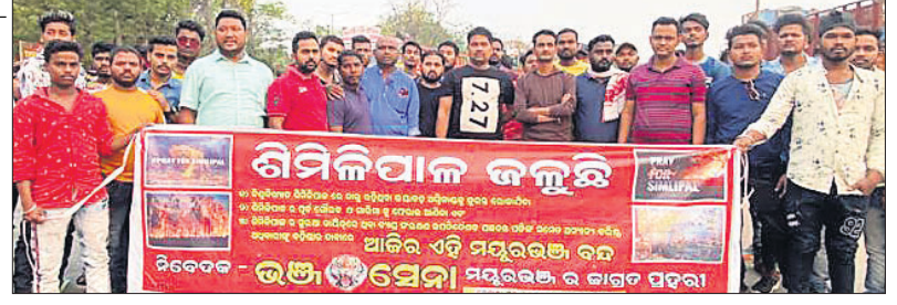
ବାରପଦାଠାରେ ବନ୍ଦ ପାଳନରେ ସାମିଲ ହୋଇଥିବା ଭଞ୍ଜସେନାର କର୍ମକର୍ମୀମାନେ।