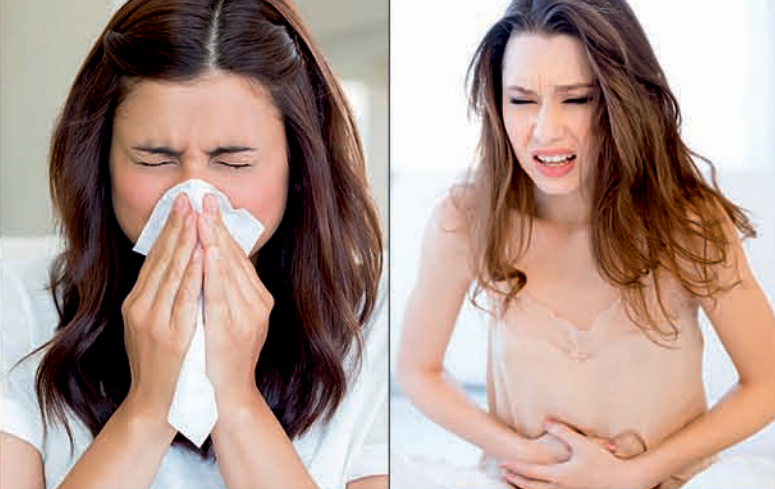
Inhalant Allergy (ଛିକ ଆସିବା) Food Allergy (ପେଟ ବ୍ୟଥା)