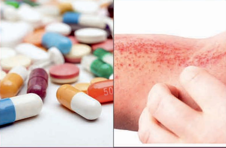
Drug Allergy (ଔଷଧରୁ ଆଲର୍ଜି) Skin Allergy (ଚର୍ମରେ ନାଲି ଦାନା ପଡ଼ିବା)

ଆଲର୍ଜି ହେବାର କାରଣଗୁଡ଼ିକ କ'ଣ ଆଲର୍ଜି ଆମର ଦୈନିକ ଜୀବନରେ ଭାଗ ନେବା ସମୟରେ ଆମର ପାରିବାସିକ ପରିବେଶ/ପର୍ଯ୍ୟାବରଣର ଅନେକ କାରଣରୁ ହୋଇପାରେ, ଯେପରିକି ଭିଜି, ବୃକ୍ଷ, ଧୂଳି, ମାଟି, ପୋଷାକ, ଔଷଧ ଏବଂ ଖାଇବା ପିଇବା ସାମଗ୍ରୀ ଇତ୍ୟାଦି । 1. ଗୋଟିଏ ପରିବାରର ବିଭିନ୍ନ ସଦସ୍ୟ, ମହିଳା, ପୁରୁଷ, ଶିଶୁ କିମ୍ବା ବୃଦ୍ଧଙ୍କୁ ବିଭିନ୍ନ ବସ୍ତୁ କାରଣରୁ ଆଲର୍ଜି ହୋଇପାରେ । 2. କେତେକ ବ୍ୟକ୍ତି ଫୁଲ ସଂସ୍ପର୍ଶରେ ଆସିଲେ ଆଲର୍ଜିରେ ପୀଡ଼ିତ ହୋଇପାରନ୍ତି । 3. କ୍ଷୀର, ଦହି, ମା'ସ, ମାଛ ସେବନ କଲେ ମଧ୍ୟ ଆଲର୍ଜି ହୋଇପାରେ । 4. ଯେଉଁଠି ପ୍ରାୟତଃ ପ୍ରଦାୟନ ପ୍ରଦାୟନ ଦ୍ୱାରା ମଧ୍ୟ ଆଲର୍ଜି ହୋଇପାରେ । ଅନେକ ପ୍ରକାରର ଆଲର୍ଜିର ଚିକିତ୍ସା ଔଷଧରୁ ହୋଇପାରେ । ରକ୍ତ ପରୀକ୍ଷା କରିବା ଦ୍ୱାରା ଆଲର୍ଜି କେଉଁ ଧରଣର ଅଟେ, ଏହା ଜଣାପଡ଼ିଯାଏ ଏବଂ ସେହି ଅନୁସୂଚିତ ଔଷଧ ଦିଆଯାଇ ଆଲର୍ଜିର ଚିକିତ୍ସା ସମ୍ଭବ ହୁଏ ।