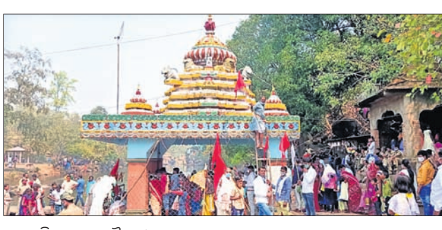
କୋଇଲି ଘୋଘର ଶୈବପୀଠ ।

ରାତି ୧୨ଟାରେ ମହାଦୀପ ଉଠିଥିଲା। ଲଖନପୁର ବ୍ଲକ୍‌ର ଐତିହାସିକ କୋଇଲି ଘୋଘର ପୀଠ ଖାଁ ଖାଁ ଲାଗିଥିଲା। ସିଂହାରପୁର, ସେମିଲିଆ, ଇସ୍‌ପାନାଲ, ମନ୍ଦିର ପରିସରରେ ଶ୍ରଦ୍ଧାଳୁଙ୍କୁ ଜାଗର ଜାଳିବା ପାଇଁ ଅନୁମତି ଦିଆଯାଇ ନ ଥିଲା। ଆୟୋଜକ ମନ୍ଦିର କମିଟି ତରଫରୁ