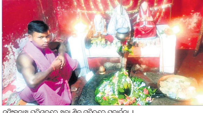
ନୃସିଂହନାଥ ପରିସରରେ ଥିବା ଶିବ ମନ୍ଦିରରେ ପୂଜାର୍ଚ୍ଚନା ।

ବରଗଡ଼ ଜିଲାର ବିଭିନ୍ନ ଶ୍ରେଣୀଠାରେ ମହାଶିବରାତ୍ରି ପାଳିତ ହୋଇଯାଇଛି । କୋଭିଡ୍ କଟକଣା ଯୋଗୁଁ ଭକ୍ତଙ୍କ ଗହଳ ଦେଖିବାକୁ ମିଳି ନ ଥିଲା । ଅଧ୍ୟାତ୍ମୋଦ୍ଧାର କେଦାରନାଥ, ନୀଳକାନ୍ତ ନୀଳକଣ୍ଠେଶ୍ୱର, ସୋର୍ଣ୍ଣାର ସ୍ୱପ୍ନେଶ୍ୱର, ରାଜସାମାର ବରାଡ଼ ବାଲୁକେଶ୍ୱର, ଦେଓଗାଁର ବିଦ୍ୟନାଥ, ସରଣ୍ଡାର ବିଶ୍ୱେଶ୍ୱର ବାବାଜୀ ମନ୍ଦିର ସମେତ ଅନ୍ୟ ଶ୍ରେଣୀଠାରେ ଏହା ପାଳିତ ହୋଇଥିଲା । ନୃସିଂହନାଥ ପରିସରସ୍ଥିତ ଶିବ ମନ୍ଦିରରେ ପୂଜାର୍ଚ୍ଚନା ହୋଇଥିଲେ ମଧ୍ୟ କୋଭିଡ୍ କଟକଣା ଯୋଗୁଁ ଭକ୍ତଙ୍କ ଭିଡ଼ ଦେଖିବାକୁ ମିଳି ନ ଥିଲା ବୋଲି ଆମ ପାଇକମାଳ ପ୍ରତିନିଧି ସୂଚନା ଦେଇଛନ୍ତି ।