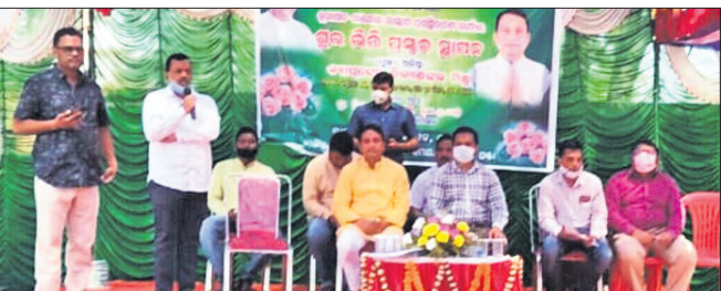
ଭିତ୍ତିପଥର ସ୍ଥାପନ କାର୍ଯ୍ୟକ୍ରମରେ ଯୋଗଦେଇଥିବା ଅତିଥିବୃନ୍ଦ ।