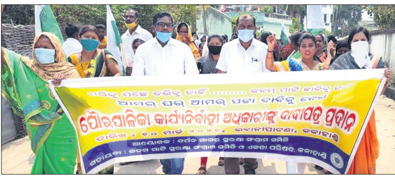
ମୁନିସିପାଲିଟି କାର୍ଯ୍ୟାଳୟ ଘେରାଉ ପାଇଁ ବସ୍ତ୍ରଦାନୀ ଶୋଭାଯାତ୍ରାରେ ଯାଉଛନ୍ତି ।

କଳାହାଣ୍ଡି ଜିଲ୍ଲା ଭବାନୀପାଟଣା ସହରର ଖୁସ୍ତି ବସ୍ତ୍ରଦାନୀଙ୍କୁ ସ୍ଥାୟୀ ଘରଦିଆ ପାଇଁ ଦାବିରେ ଦର୍ପଣ ସାଗର ସୁରକ୍ଷା ସମିତି ପକ୍ଷରୁ ମୁନିସିପାଲିଟି କାର୍ଯ୍ୟାଳୟ ବୁଧବାର ଘେରାଉ କରାଯାଇଥିଲା । ଦୀର୍ଘ ଦିନ ଧରି ବସ୍ତ୍ରଦାନୀ ବିଭିନ୍ନ ଖର୍ଚ୍ଚରେ ରହି ଆସୁଛନ୍ତି । ସରକାରୀ ପୁସ୍ତକ କୌଶଳ ପ୍ରକାର ସହାୟତା ପାଇପାରୁ ନ ଥିବା ଅଭିଯୋଗରେ ମୁନିସିପାଲିଟି କାର୍ଯ୍ୟାଳୟ ଘେରାଉ କରିଥିଲେ । ପରେ ସୁରକ୍ଷା ସମିତି ପକ୍ଷରୁ ଜିଲ୍ଲାପାଳଙ୍କୁ କେଟି ମୁଖ୍ୟମନ୍ତ୍ରୀଙ୍କ ଉଦ୍‌ଦେଶ୍ୟରେ ଏକ ଦାବିପତ୍ର ପ୍ରଦାନ କରିଥିଲେ ।