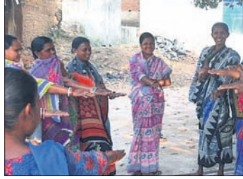
ଗ୍ରାମବାସୀ ଶପଥ ଗ୍ରହଣ କରୁଛନ୍ତି ।

ସମ୍ବଲପୁର ଜିଲ୍ଲାର ବିଭିନ୍ନ ଜଙ୍ଗଲରେ ନିଆଁ ଲାଗିଛି। ବନ ବିଭାଗ ପକ୍ଷରୁ ଦିଆଯାଇଥିବା ସୂଚନା ଅନୁସାରେ ମୋଟ ୪୯ ସ୍ଥାନରେ ନିଆଁ ଲାଗିଛି। ସାଚେଲାଇଟ ଚିତ୍ରରେ ଏହା ସ୍ପଷ୍ଟ ଭାବେ ଜଣାପଡିଛି। ନିଆଁ ଆୟତ କରିବା ପାଇଁ ୩୫ ଯୁଦ୍ଧି ଗଠନ କରାଯାଇଛି। ସମ୍ବଲପୁର ବନଖଣ୍ଡ ଧମା ରେଞ୍ଜରେ ୩ଟି ସ୍ଥାନ, ପଡ଼ିଆବାହାଲ ରେଞ୍ଜରେ ୫, ରେଜାଲି ରେଞ୍ଜରେ ୨୩, ସଦର ରେଞ୍ଜରେ ୧୮ ସ୍ଥାନରେ ନିଆଁ ଲାଗିଥିବା ରିପୋର୍ଟ ରହିଛି। ସେହିପରି ଚାନ୍ଦନ ରେଞ୍ଜ ଅଧୀନରେ ଥିବା ବୁଢ଼ାଗଜା ପାହାଡ଼ରେ ଗଡ଼କାଲି ଲାଗିଥିବା ନିଆଁକୁ ଆୟତ କରାଯାଇଛି। ଅନ୍ୟପକ୍ଷେ