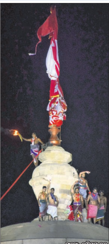
ରାତି ୯ଟା ୨୭ରେ ଉଠିଥିବା ମହାଦୀପ।

ଭୁବନେଶ୍ୱର, (ବୁଧବେଳା)/ ପୁରୁଣା ଭୁବନେଶ୍ୱର, ୧୧ମ