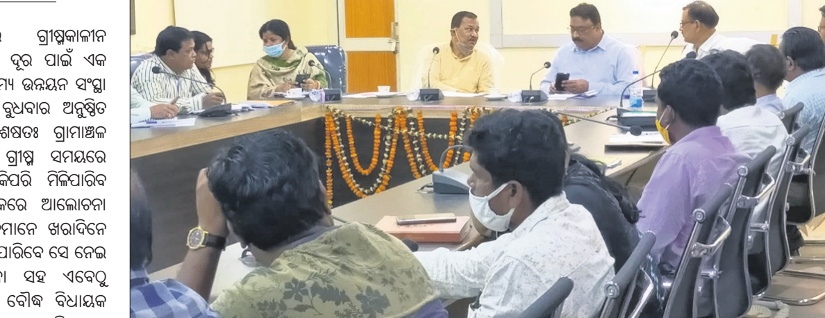
ସମାକ୍ଷା ବୈଠକରେ ମହାସାଧନ ଅତିଥି ।