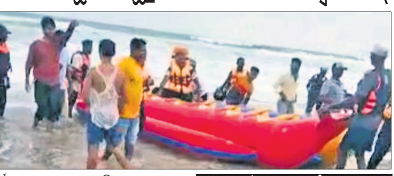
ପର୍ଯ୍ୟଟକଙ୍କୁ ଉଦ୍ଧାର କରାଯାଇଛି।