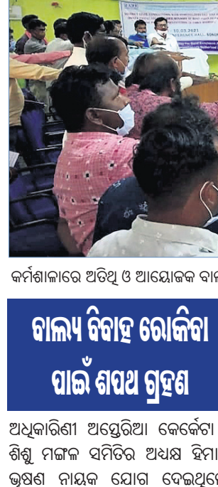
କର୍ମଶାଳାରେ ଅତିଥି ଓ ଆୟୋଜକ ବାଲ୍ୟ ବିବାହ ରୋକିବା ପାଇଁ ଶପଥ ନେଉଛନ୍ତି ।