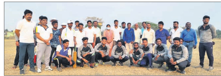
ଉଦ୍‌ଘାଟନା ମ୍ୟାଚରେ ଅତିଥିକ ଗହଣରେ ଖେଳାଳିମାନେ ।

କଳାହାଣ୍ଡି ଜିଲ୍ଲା କୋକସରା ଷୋର୍ଟ୍ କ୍ଲବ ଆନୁକୁଲ୍ୟରେ ଗୁରୁବାର କୋକସରା କ୍ରିକେଟ ପ୍ରିମିୟର ଲିଗ୍ ଉଦ୍‌ଘାଟିତ ହୋଇଛି । ଉଦ୍‌ଘାଟନା ମ୍ୟାଚ ରୁକ୍ ଟିମ୍ ଓ ଶକ୍ତିମାନ ଟିମ୍ ମଧ୍ୟରେ ଅନୁଷ୍ଠିତ ହୋଇଥିଲା । ପ୍ରଥମେ ରୁକ୍ ଟିମ୍ ବ୍ୟାଟିଂ କରି ନିର୍ଦ୍ଧାରିତ ୧୨ ଓଭରରେ ୭ ରନକେନ୍ ହରାଇ ୫୮ମନ ସଂଗୃହ କରିଥିଲା । ଜବାବରେ ଶକ୍ତିମାନ ଟିମ୍ ନିର୍ଦ୍ଧାରିତ ଓଭର ପୂର୍ବରୁ ୫୯ ରନ୍ ସଂଗୃହ କରି ମ୍ୟାଚ ବିଜୟୀ ହୋଇଥିଲା । ପ୍ରିମିୟର ଲିଗ୍‌କୁ କୋକସରା