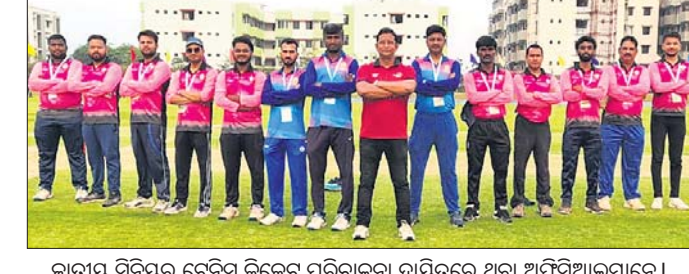
ଜାତୀୟ ସିରିଜର ଚେନିସ କ୍ରିକେଟ୍ ପରିଚାଳନା ଦାୟିତ୍ୱରେ ଥିବା ଅଧିକାରୀମାନେ।