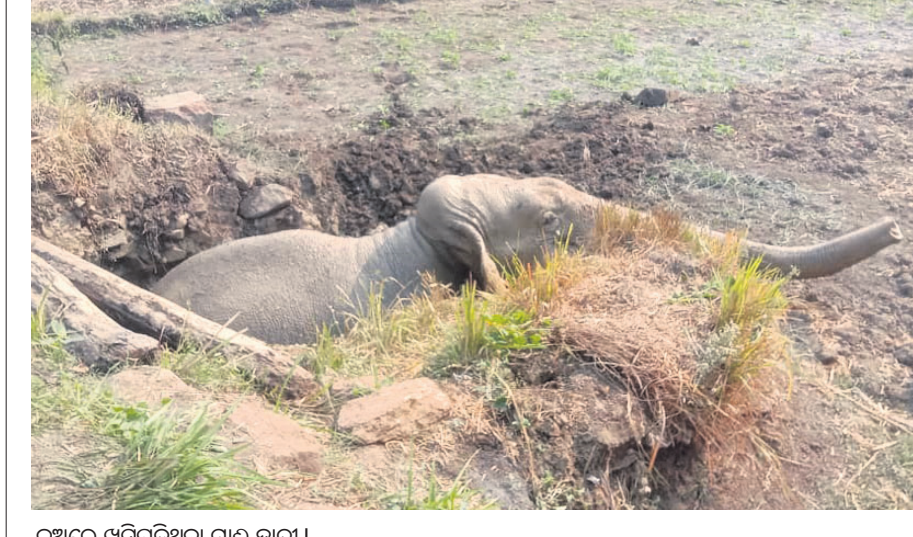
କୂଅରେ ଖସିପଡ଼ିଥିବା ମାଛ ହାତୀ।