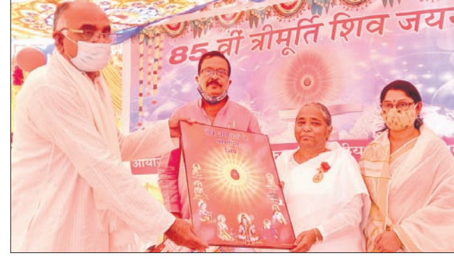
ଶିବ ଦର୍ଶନ ଭବନଠାରେ ଅତିଥିମାନଙ୍କୁ ଉପହାର ଦିଆଯାଇଛି ।