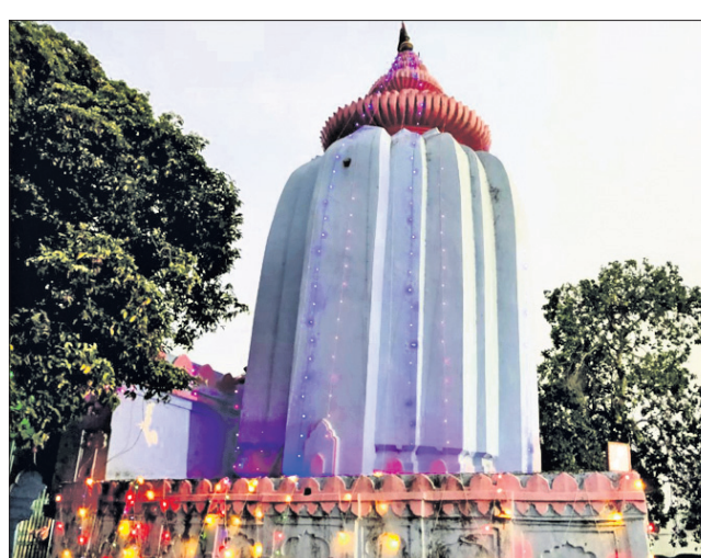
ଆଲୋକମାଳାରେ ଝୁଲିଥିବା ହୁମା ବିମଳେଶ୍ଵର ବାବାଙ୍କ ମନ୍ଦିର ।

ଗୁରୁବାର ପବିତ୍ର ଶିବରାତ୍ରୀ। ଏହି ଦିନ ଭକ୍ତମାନେ ଉପବାସ ରହି ରାତିରେ ଦୀପ ଜାଳି ଉଜାଗର ରହନ୍ତି। ହେଲେ ଚଳିତବର୍ଷ କୋଭିଡ଼ କଟକଣା ମଧ୍ୟରେ ସମ୍ବଲପୁର ଜିଲ୍ଲାରେ ମହାଶିବରାତ୍ରୀ ପାଳନ କରାଯାଇଛି। ସମ୍ବଲପୁର ସହର ବାଲିବନ୍ଦର ସୋମନାଥ ବାବା ମନ୍ଦିର, ବୁଢ଼ାଗଜା ମହାଦେବ, ଗୁଡ଼େଶ୍ଵର ବାବା, ପ୍ରସିଦ୍ଧ ବକ୍ତା ହୁମା ବିମଳେଶ୍ଵର ବାବାଙ୍କ ମନ୍ଦିରରେ ଭକ୍ତଙ୍କ ଦର୍ଶନ ବନ୍ଦ ରହିଥିଲା। ମହାଦେବଙ୍କୁ ଦର୍ଶନ ପାଇଁ ଶ୍ରଦ୍ଧାଳୁମାନେ ଯାଇଥିଲେ ମଧ୍ୟ ମନ୍ଦିର ଟ୍ରଷ୍ଟ, ପ୍ରଶାସନ, ପୋଲିସ୍ ଉପସ୍ଥିତ ରହି ଭକ୍ତମାନଙ୍କୁ ପୁଷ୍ୟ ଗେଟ୍‌ରୁ ଫେରାଇ ଦେଇଥିଲେ। ଅନ୍ୟପକ୍ଷରେ ସହର ଉପକଣ୍ଠ ମାନେଶ୍ଵର ମାନଧାରୀ ଓ ହାତିବାରୀ କଳେଶ୍ଵର ବାବାଙ୍କ ପୀଠ ଖୋଲା ରହିଥିଲା। କୋଭିଡ଼ ଗାଇଡ଼ଲାଇନ ପାଳନ କରି ଦିନତମାମ