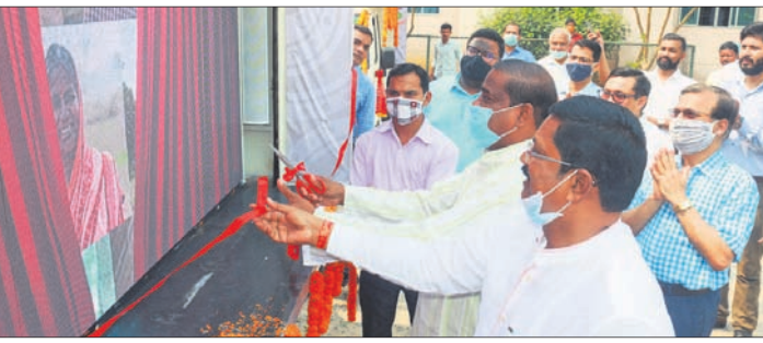
କାର୍ଯ୍ୟକ୍ରମକୁ ବିଧାୟକ ଓ ପ୍ରଶାସନିକ ଅଧିକାରୀମାନେ ଉଦଘାଟନ କରୁଛନ୍ତି।

ଅନୁଗୋଳ ଅଞ୍ଚଳ, ୧୧୧୩ ରାଜ୍ୟ ସରକାରଙ୍କ ୫୦୦ ଲକ୍ଷ ଲୋକସ୍ୱିକର ଯୋଜନାର ଉଦ୍ଦେଶ୍ୟ ଓ ଆଭିମୁଖ୍ୟ ସମ୍ପର୍କରେ ଜିଲାର ୨୨୫ଟି ପଞ୍ଚାୟତର ଜନସାଧାରଣଙ୍କୁ ବିସ୍ତୃତ ଭାବେ ମନୁଷ୍ୟ ଭିତ୍ତି ଓ ମାଧ୍ୟମରେ ଅବଗତ ଓ ସଚେତନ କରିବ 'ବାଉଁ'।