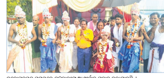
ବ୍ରତୋପନୟନ ସମୟରେ ବ୍ରହ୍ମଚାରୀଙ୍କୁ ଆଶୀର୍ବାଦ ପ୍ରଦାନ କରାଯାଇଛି ।