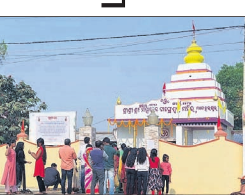
କୋଭିଡ୍ କଟକଣାରେ ମହାଶିବରାତ୍ରି ପାଳିତ ହୋଇନାହିଁ, ଆବାସ ଯୋଜନାରେ ଘର

ବଳାଙ୍ଗୀର ଅଫିସ: ବଳାଙ୍ଗୀର ସହରରେ ମହାଶିବରାତ୍ରୀରେ ନିହାତି କମ୍ ଭିଡ ପରିଲକ୍ଷିତ ହୋଇଥିଲା । ଲୋକନାଥ ମନ୍ଦିର, ବୁଲ୍‌ସାନଗର ଗାଙ୍ଗେଶ୍ୱର ମହାଦେବ ମନ୍ଦିର, ଶାନ୍ତିପଡ଼ାର ଚନ୍ଦ୍ରଶେଖର ମନ୍ଦିର, ରେଭେନ୍‌ସେ ଶୈବମନ୍ଦିର, ଖୁଜେନ୍ଦ୍ରପାଲି ଶୈବମନ୍ଦିରରେ ବିଧିରଖା ପୂର୍ବକ ପୂଜାର୍ଚ୍ଚନା ହୋଇଥିଲେ ମଧ୍ୟ ଭକ୍ତଙ୍କ ସମୂହ ବର୍ତ୍ତନକୁ ବାରଣ କରାଯାଇଥିଲା । ଫଳରେ ଭକ୍ତ ଓ ଶ୍ରଦ୍ଧାଳୁମାନେ ମନ୍ଦିର ଗେଟ୍ ବାହାରେ ରହି ପୂଜାର୍ଚ୍ଚନା ସାମଗ୍ରୀ ଦେଇ ଭକ୍ତି ନିବେଦନ କରିଥିଲେ । କଟକଣା ସୁନିଶ୍ଚିତ କରିବା ପାଇଁ ପ୍ରତ୍ୟେକ ମନ୍ଦିରରେ ପୋଲିସ୍ ସୁରକ୍ଷା ବ୍ୟବସ୍ଥା କରାଯାଇଥିଲା ।