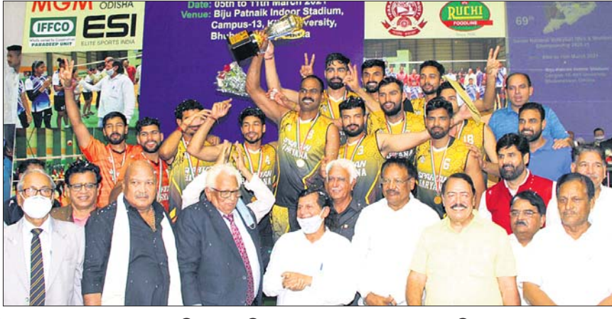
ଜାତୀୟ ସିରିଜର ଭଲିବଲ୍ ପ୍ରତିଯୋଗିତାରେ ଚାମ୍ପିୟନ କେରଳ (ମହିଳା) ଓ ହରିୟାଣା (ପୁରୁଷ) ଦଳର ଖେଳାଳିମାନେ ଅତିଥିଙ୍କଠାରୁ ପୁରୁଷର ଗ୍ରହଣ କରୁଛନ୍ତି।