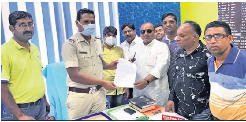
କୁନାଗଡ଼ ଭାରତୀୟ ଆନାଧିକାରୀଙ୍କୁ ଦାବିପତ୍ର ଦିଆଯାଇଛି ।

କଳାହାଣ୍ଡି ଜିଲ୍ଲା କୁନାଗଡ଼ ସହରରେ ଏବେ ଦିନକୁ ଦିନ ଚୋରି ବୃଦ୍ଧି ପାଇବାରେ ଲାଗିଛି । ଫକରେ ଅନେକ ଧନ ଜୀବନ ନଷ୍ଟ ହେବାରେ ଲାଗିଛି । ବୁଧବାର ଦିନବିପ୍ରହରରେ ଜଣେ ବ୍ୟବସାୟକଠାରୁ ସୁନାଗୁପା ଭର୍ତ୍ତି ବ୍ୟାଗ ଧରି ଦୁର୍ଭିକ୍ଷରେ ବନ୍ଦୀ ହୋଇଥିଲେ ।