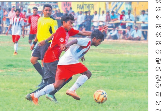
ରାୟପୁର ଓ କୁଟିଆ ଦଳ ମଧ୍ୟରେ ଅନୁଷ୍ଠିତ ମ୍ୟାଚ ।