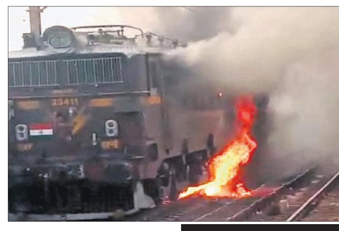
ବଡ଼ବିଲ, ୧୧ମାର୍ଚ୍ଚ (ସ୍ୱ.ପ୍ର.)