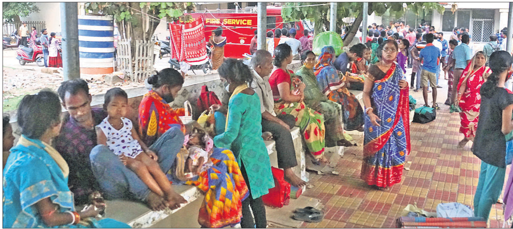
ବିକ୍ଷିତ ଶିଶୁଙ୍କୁ ଧରି ବାହାରକୁ ପଳାଇଆସିଥିବା ଆଚେଷ୍ଟାଖମାନେ।

କଟକ ଶିଶୁଭବନର ସ୍ତମ୍ଭ ମେଡିକାଲ ଏକ୍ସପର୍ଟିମେଣ୍ଟ ବିଭାଗରେ ଶନିବାର ଅପରାହ୍ଣ ସାଞ୍ଜ ୫ଟାରେ ଅଗ୍ନିକାଣ୍ଡ ଘଟିଛି। ଶତସଂଖ୍ୟକ ଯୋଗୁଁ ବିଦ୍ୟୁତ୍ ପ୍ୟାନେଲ ବୋର୍ଡରେ ଧୂଆଁ ବାହାରୁଥିବା ଦେଖି ରୋଗୀ ଓ ଆଚେଷ୍ଟାଖମାନେ ଭୟଭୀତ ହୋଇ ଏଣେତେଣେ ଦୌଡ଼ିଥିଲେ। ପରବର୍ତ୍ତୀ ସମୟରେ ବିଭାଗୀୟ ଅଧିକାରୀଙ୍କ ପକ୍ଷରୁ ସମସ୍ତ ରୋଗୀଙ୍କୁ ନିରାପଦ ସ୍ଥାନକୁ ସ୍ଥାନାନ୍ତର କରାଯାଇଥିଲା। ଏଥିରେ କାହାରି ବିଶେଷ କ୍ଷୟକ୍ଷତି ହୋଇ ନ ଥିବାବେଳେ ସାମୟିକ ଭାବେ ବିଦ୍ୟୁତ୍ ସେବା ବନ୍ଦି ହୋଇଯାଇଥିଲା। ଖବରପାଇ ଅଗ୍ନିଶମ କର୍ମଚାରୀ ଘଟଣାସ୍ଥଳରେ ପହଞ୍ଚିବା ପୂର୍ବରୁ ପ୍ୟାନେଲ ବୋର୍ଡ ନିକଟରେ ଥିବା ଏମ୍ବିସି ପୁଲ୍ ବର୍ଷ ପୂର୍ବରୁ ଶିଶୁଭବନରେ ଅଗ୍ନିକାଣ୍ଡ ଘଟି ବ୍ୟାପକ କ୍ଷୟକ୍ଷତି ହୋଇଥିଲା। ସେହିପରି କିଛି ପୂର୍ବରୁ କଟକ ସର୍ବୋଚ୍ଚ ହସ୍ପିଟାଲ, ସର୍ବ ହସ୍ପିଟାଲ ଓ ଏସ୍‌ସି ଚିକିତ୍ସାଳୟରେ ଅଗ୍ନିକାଣ୍ଡ ଘଟିଥିଲା। ଅପ୍ରତିକର ପରିସ୍ଥିତି ଉତ୍ପତ୍ତି ନାହିଁ। ଶତସଂଖ୍ୟକ ଘଟିଥିବା ବିଭାଗରେ ଅଗ୍ନି ନିର୍ବାପକ ବ୍ୟବସ୍ଥା ରହିଛି। ଖବର ପାଇ