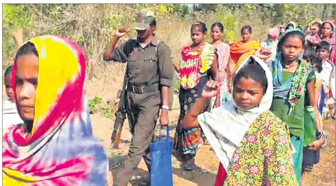
ରାଜି କରୁଥିବା ମହିଳା ମାଓବାଦୀ।

ଏହି ସମୟରେ ସେମାନେ ପୋଲିସ୍ ଓ ଯବାନମାନଙ୍କୁ ମଧ୍ୟ ଚାର୍ଜେଜ୍ କରିଥିଲେ। ପୋଲିସ୍ ଓ ଯବାନଙ୍କ ଦ୍ଵାରା ମହିଳାଙ୍କ ଉପରେ ହେଉଥିବା ଅତ୍ୟାଚାର ଓ ହତ୍ୟା ଘଟଣା ନେଇ ସମାବେଶରେ ବିରୋଧ କରାଯାଇଥିଲା। ଅନେକ ମହିଳାଙ୍କୁ ମିଥ୍ୟା ମାମଲାରେ ପୋଲିସ୍ ଜେଲ ପଠାଇଛି। ସେମାନଙ୍କୁ ଭୁଲ୍ ମୁକ୍ତି କରାଯାଇ ବୋଲି ସେମାନେ ଦାବି କରିଥିଲେ। ଏହି ଅବସରରେ କ୍ରାନ୍ତିକାରୀ ଆଦିବାସୀ ମହିଳା ସଙ୍ଗଠନ ନାମରେ ଛାପାଯାଇଥିବା ପ୍ରଚାରପତ୍ର ବ୍ୟାପାଇଥିଲା। ତେବେ ଏ ସମ୍ପର୍କରେ ପୋଲିସ୍ ନିକଟରେ କୌଣସି ଖବର ନ ଥିବା ଜଣାପଡ଼ିଛି।