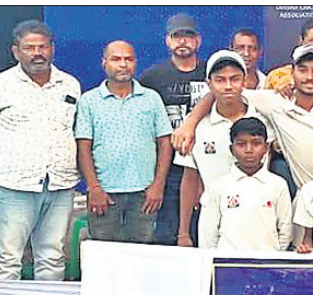
ଅତିଥିକ ସହ ଚାମ୍ପିୟନ ଦଳ।

ଓଡ଼ିଶା କ୍ରିକେଟ ଆସୋସିଏଶନର ଭିଜନ-୨୦୨୪ ପରିଚ୍ଛେପ୍ତାରେ ଭଦ୍ରକ ରମ୍ୟା ସ୍ଥିତ ରେଲଓ୍ୱେ କ୍ରିକେଟ ପଡ଼ିଆରେ ଆୟୋଜିତ ଆନ୍ତର୍ଜାତୀୟ କ୍ଲବ୍ କ୍ରିକେଟର ଫାଇନାଲ ମ୍ୟାଚ୍ ଶନିବାର ଅନୁଷ୍ଠିତ ହୋଇଯାଇଛି।