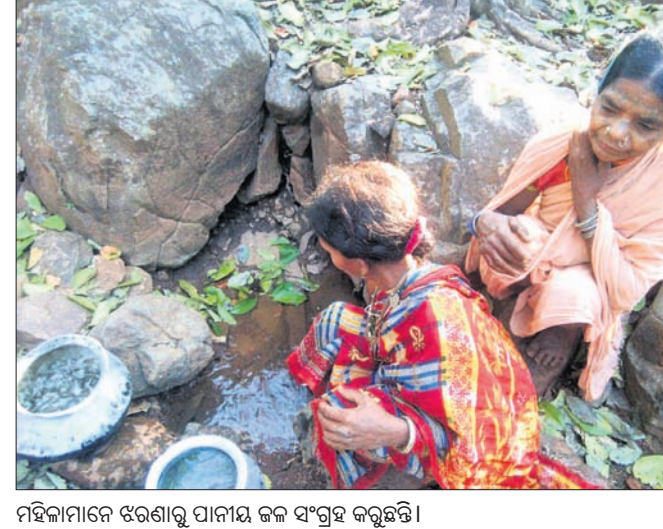
ମହିଳାମାନେ ଝରଣାକୁ ପାନୀୟ ଜଳ ସଂଗ୍ରହ କରୁଛନ୍ତି ।

ମାଲକାନଗିରି ଜିଲ୍ଲାରେ ବାଲିମେଳା ଓ ସତ୍ୟରାତ୍ରି ପରି ବୃହତ୍ ଜନକଣ୍ଠରେ ରହିଛି । ପୋଟେରୁ ସାବେରୀ, ପାଳୀମ ଭଳି ଅନେକ ନଦୀ ଓ ଝରଣା ପ୍ରବାହିତ ହେଉଛି । ଏହା ସତ୍ତ୍ୱେ ଗ୍ରାମ୍ୟ ରୁଚ୍ଚରେ ବର୍ଷ ବର୍ଷ ଧରି ପାନୀୟ ଜଳ ସମସ୍ୟା ଲାଗିରହିଛି । ସ୍ୱାଭିମାନ ଅଞ୍ଚଳରେ ରୁଚ୍ଚପ୍ରିୟା ସେତୁ ନିର୍ମାଣ ପୂର୍ବରୁ ଯେ ପଞ୍ଚାୟତରେ ନଳକୂପ କିମ୍ବା ପାଇପ୍ ଜଳ ଯୋଗାଣ ବ୍ୟବସ୍ଥା ନ ଥିଲା, ଫଳରେ ସେସବୁ ଅଞ୍ଚଳର ଗ୍ରାମ ଲୋକେ ଝରଣା ପାଣି ଏବଂ ଡ୍ୟାମ୍ ପାଣିକୁ ବ୍ୟବହାର କରୁଥିଲେ । ୨୦୧୮ରେ ରୁଚ୍ଚପ୍ରିୟା ସେତୁ ନିର୍ମାଣ ହୋଇ ଲୋକାକର୍ଷଣ ହେବା ପରେ ସ୍ୱାଭିମାନ ଅଞ୍ଚଳକୁ ରାସ୍ତାଘାଟ ନିର୍ମାଣ ସହ ଅନେକ ଗ୍ରାମରେ ନଳକୂପ ପ୍ରତିଷ୍ଠା ହେଉଥିଲେ ମଧ୍ୟ ଏହା ସମ୍ପୂର୍ଣ୍ଣ ଅଞ୍ଚଳ ପାନୀୟ ଜଳ ଯୋଗାଣ ବ୍ୟବସ୍ଥାକୁ ଏଯାବତ୍ ସ୍ୱାଭାବିକ କରିପାରିନା । ଫଳରେ ଏବେ ମଧ୍ୟ ଲୋକେ ଝରଣା ପାଣି ବ୍ୟବହାର କରୁଛନ୍ତି । ପାନୀୟ ଜଳ ସମସ୍ୟା ନେଇ ପ୍ରଶାସନକୁ ଜଣାଇଲେ ବିଭାଗୀୟ ଅଧିକାରୀମାନେ ପ୍ରତିଶ୍ରୁତି ଦେଉଛନ୍ତି ।