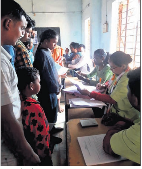
ଶିଶୁ ସମ୍ପର୍କ କାର୍ଯ୍ୟକ୍ରମରେ ଅଭିଭାବକମାନେ ନାମ ପଞ୍ଜୀକରଣ କରୁଛନ୍ତି