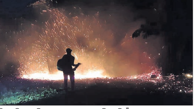
ଚିତାପାରି କ୍ରମେ ନିକଟରେ ଥିବା ଜଙ୍ଗଲରେ ଲାଗିଥିବା ନିଆଁ

ପ୍ରତିଦିନ ରାଜ୍ୟ କେଉଁଠି ନାଁ କେଉଁଠି ଜଙ୍ଗଲରେ ନିଆଁ ଲାଗୁଛି । ଏନେଇ ସରକାରଙ୍କ ପକ୍ଷରୁ ସଚେତନତା କାର୍ଯ୍ୟକ୍ରମମାନ କରାଯାଉଥିଲେ ମଧ୍ୟ ଏଥିରୁ ସୁଧାକ ମିଳୁନାହିଁ । ଏହି ନିଆଁ ଜଙ୍ଗଲ ନିକଟରେ ବସ୍ତି କରି ରହୁଥିବା ଲୋକଙ୍କ ପ୍ରତି ବିପଦ ସୃଷ୍ଟି କରୁଛି । ମାଲକାନଗିରି ଜିଲ୍ଲା ବାଲିମେଳା ବ୍ଲକ୍‌ରେ ଥିବା ଜଙ୍ଗଲଗୁଡ଼ିକରେ ଦିନରାତି ନିଆଁ ଲାଗି ରହୁଛି । ବନ ବିଭାଗ ସଦିନରେ କିଛି ପଦକ୍ଷେପ ନେଉନାହିଁ । ଫଳରେ ବନ୍ୟ ଜୀବଙ୍କୁ କ୍ଷତିଗ୍ରସ୍ତ ହେବା ସହ ବହୁ ଉପକାରୀ ମୂଲ୍ୟବାନ ବୃକ୍ଷ କଳି ପାଉଁଶ ହୋଇଯାଇଛି । ବାଲିମେଳା ସଦର ଜଳ ବିଦ୍ୟୁତ୍ କେନ୍ଦ୍ରକୁ ଲାଗିଥିବା ଜଙ୍ଗଲ, ଆଇଏମଏସ୍‌ସି ବିଦ୍ୟାଳୟ ପଛପଟେ ଥିବା ଜଙ୍ଗଲ, ଚିତାପାରି-୩ ପୋଲକୁ ଲାଗିଥିବା ଜଙ୍ଗଲ ଏବଂ ବାଲିମେଳା-ଚିତ୍ରକୋଣା ମୁଖ୍ୟ ରାସ୍ତାରେ ଥିବା ଜଙ୍ଗଲରେ ପ୍ରତିଦିନ ନିଆଁ ଲାଗୁଥିବା ଦେଖିବାକୁ ମିଳୁଛି । ବନ ବିଭାଗ କର୍ମଚାରୀ