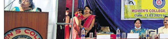
ବୈଠକରେ ମଞ୍ଚାସୀନ ଅତିଥିମାନେ।