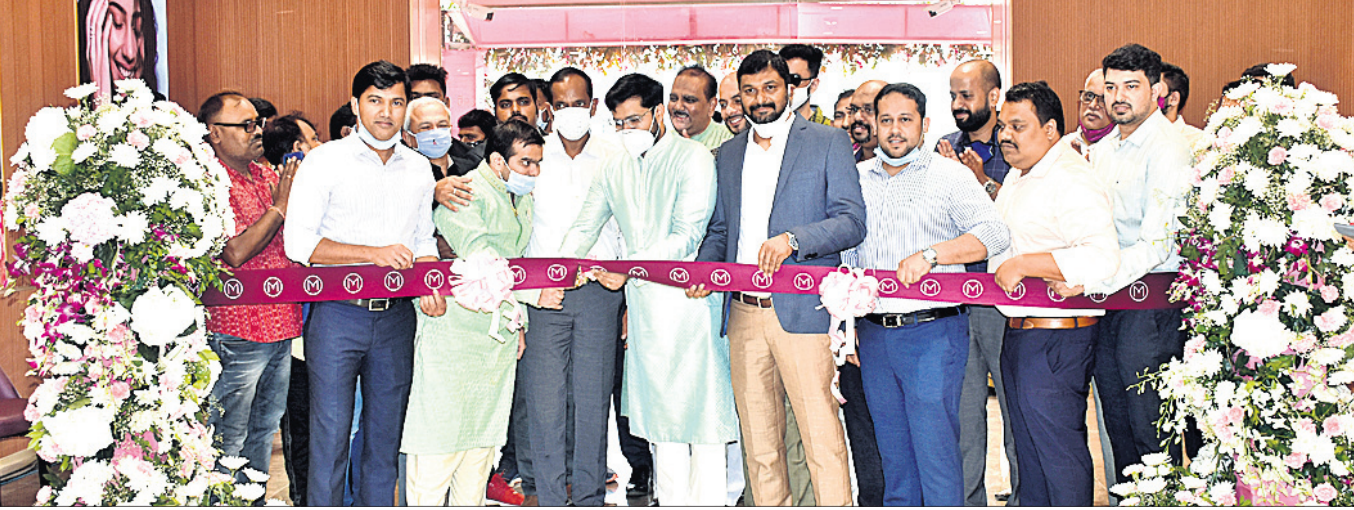
ଦେଶର ଅଗ୍ରଣୀ ଅଳଙ୍କାର ପ୍ରତିଷ୍ଠାନ ମାଲାବାର ଶୋ'ରୁମ୍ ଶନିବାର ଭୁବନେଶ୍ଵରରେ ଉଦ୍ଘାଟନ ଅବସରରେ ନିମନ୍ତ୍ରିତ ଅତିଥି ଓ ଅଧିକାରୀ ସ୍ଵରୂପେ।

ଭାରତୀୟ ନାଗାମାନେ ସୌନ୍ଦର୍ଯ୍ୟ କ୍ଷେତ୍ରରେ ସାରା ବିଶ୍ଵରେ ପରିଚିତ। ଏହାର ପ୍ରମୁଖ କାରଣ ହେଉଛି ସାଲସିନା ଓ ଗହଣାର ବହୁଳ ବ୍ୟବହାର।