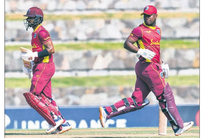
୧୯୨ ରନ ଭାରାଦାରି ଅବସରରେ ଏଭିନ ଲିଓସ୍ ଓ ଶାଲ ହୋଇ।

ସ୍ଥାନୀୟ ସାର୍ ଭିକ୍ଟିଆନ ରିଟାର୍ଡ୍ ଷ୍ଟାଡିୟମରେ ଅନୁଷ୍ଠିତ ଶ୍ରୀଲଙ୍କା ବିପକ୍ଷ ଦ୍ୱିତୀୟ ଅନ୍ତର୍ଜାତୀୟ ଦିନିକିଆ ମ୍ୟାଚରେ ଫ୍ଲେକ୍ସିବିଲିଟି ୫ ଉଲ୍ଲକେଟରେ ବିଜୟ ହାସଲ କରିଛି।