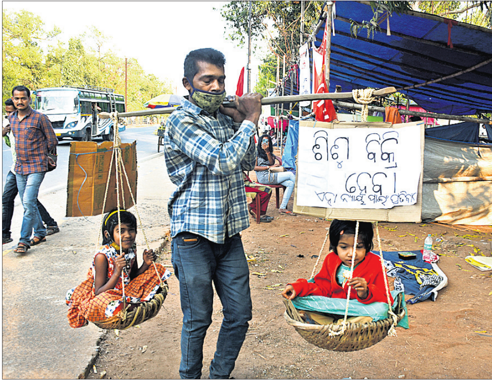
ଜମିରେ ରିଲାଏଣ୍ଟ୍ ଚାଷୀଙ୍କ ଦ୍ଵାରା ପାଇଁ ୩୧ ଲକ୍ଷ ଟଙ୍କା ଠାକୁରାଣୀ ଉପାସିତ ଅଭିଯୋଗରେ ଶନିବାର ଭୁବନେଶ୍ଵରସ୍ଥିତ ପିଏସ୍‌ଜିରେ ୨ ଡିଏସ୍‌ସ୍ ଉପରେ ଧରି ଅଭିଯୋଗ ପ୍ରଦର୍ଶନ କରୁଛନ୍ତି।