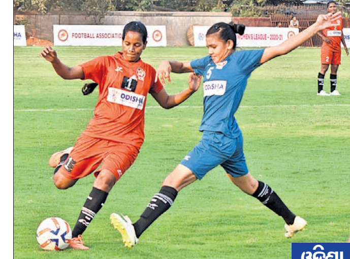
ଓଡ଼ିଶା ପୋଲିସ ଓ ଓଡ଼ିସି କ୍ଲବ ମଧ୍ୟରେ ଅନୁଷ୍ଠିତ ମ୍ୟାଚ୍।

ଏଠାରେ ଚାଲିଥିବା ଓଡ଼ିଶା ଓମେନ୍ସ ଫୁଟବଲ ଲିଗ୍ରେ ଶନିବାର ଖେଳାଯାଇଥିବା ମ୍ୟାଚ୍‌ରେ ଓଡ଼ିଶା ପୋଲିସ, ଇଷ୍ଟକୋଷ୍ଟ ରେଲଓ୍ୱେ ଓ ରାଇଟିଂ ଷ୍ଟୁଡେଣ୍ଟ ବିଜୟ ହାସଲ କରିଛନ୍ତି।