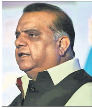
ନରିନ୍ଦର ବାତ୍ରା ପ୍ୟାନେଲ (ଇଓପି)କୁ ହସ୍ତାନ୍ତର କରିବେ।

ନରିନ୍ଦର ବାତ୍ରା ଅନ୍ତର୍ଜାତୀୟ ହକି ମହାସଂଘ (ଏଫ୍‌ଆଇଏର୍)ର ସଭାପତି ଭାବେ ପୁନଃନିର୍ବାଚିତ ହେବାକୁ ଆଗ୍ରହୀ। ଏଫ୍‌ଆଇଏର୍ ପରିଚାଳନା ପରିଷଦର ୪୭ତମ ଅଧିବେଶନ ମେ ୨୨ ତାରିଖରେ ନୂଆଦିଲ୍ଲୀରେ ହେବ।