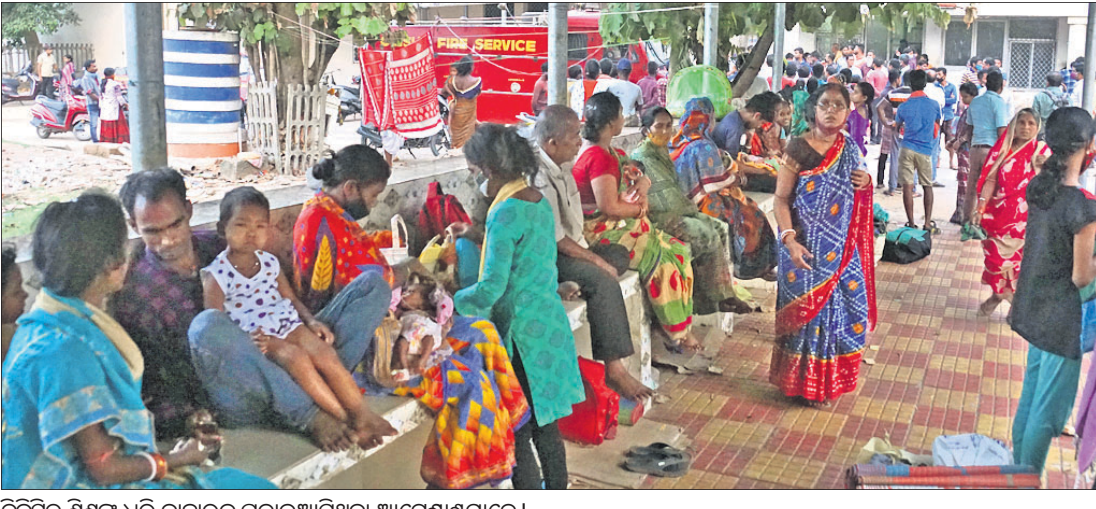
ବିକ୍ଷିତ ଶିଶୁଙ୍କୁ ଧରି ବାହାରକୁ ପଳାଇଆସିଥିବା ଆଚେଷ୍ଟାଖମାନେ।