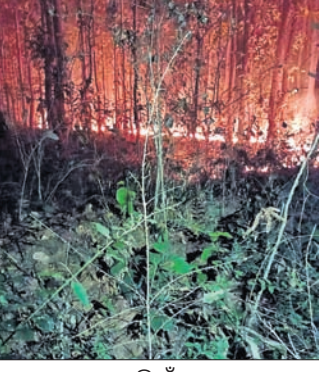
ଜୟପୁର ଜଙ୍ଗଲରେ ନିଆଁ

ସେହି ବାଟ ଦେଇ ଯାତାୟତ କରୁଥିଲେ ମଧ୍ୟ ଏହାକୁ ଅଣଦେଖା କରୁଛନ୍ତି । ବାଲିମେଳା ପଞ୍ଚାୟତ ଉପରେ ଥିବା ବସ୍ତିଗୁଡ଼ିକରେ ବ୍ୟବସାୟ କରୁଥିବା ଲୋକେ ଏହି ନିଆଁକୁ ନେଇ ଚିନ୍ତାରେ ପଡ଼ିଛନ୍ତି । ବିଭାଗୀୟ କର୍ମଚାରୀ ନିଆଁ ଲିଭାଇବାକୁ ପଦକ୍ଷେପ ନ ନେଲେ ଯଦି କିଛି ଅଭାବ ଯତେ ତେବେ ଏଥିପାଇଁ ସେମାନେ ଦାୟୀ ରହିବେ ବୋଲି ବସ୍ତିବାସିନ୍ଦା ପ୍ରକାଶ କରିଛନ୍ତି । ଏଦିଗରେ ତୁରନ୍ତ ପଦକ୍ଷେପ ନେବାକୁ ସାଧାରଣରେ ଦାବି ହେଉଛି ।