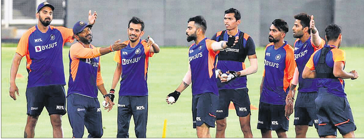
ଅଭ୍ୟାସ ଅବସରରେ ଭାରତୀୟ କ୍ରିକେଟ ଦଳର ଖେଳାଳିମାନେ ।

ଇଲଗୁ ବିପକ୍ଷ ପ୍ରଥମ ଟି୨୦ ମ୍ୟାଚ୍‌ରେ ମାମୁଲି ପ୍ରଦର୍ଶନ କରି ପରାଜୟ ବରଣ କରିବା ପରେ ଘରୋଇ ଭାରତ ପ୍ରତ୍ୟାବର୍ତ୍ତନ କରିବା ଲକ୍ଷ୍ୟରେ ରହିଛି। ଗୁଆରାଟି ନଗରୀ ମେଦି ଷ୍ଟାଡ଼ିୟମରେ ଉଦ୍‌ଘାଟନ ଭାରତ ଓ ଇଲଗୁ ମଧ୍ୟରେ ଦ୍ୱିତୀୟ ଟି୨୦ ଖେଳାଦିବାର କାର୍ଯ୍ୟକ୍ରମ ରହିଛି। ଟେଣ୍ଟ ପରାଜୟର ଝଟକାକୁ ଭୁଲି ଭାରତ ଏହି ମ୍ୟାଚ୍‌ରେ ବିଜୟ ହୋଇ