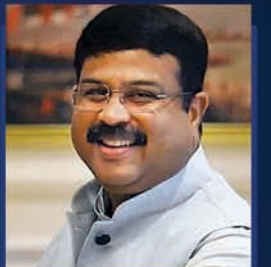
Shri Dharmendra Pradhan Hon'ble Union Minister Petroleum & Natural Gas and Steel