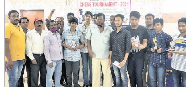
ଜିଲ୍ଲାସ୍ତରୀୟ ଚେସ୍ ଟୁର୍ଣ୍ଣାମେଣ୍ଟର କୃତୀ ଖେଳାଳୀମାନେ ଅତିଥିଙ୍କ ସହ ।