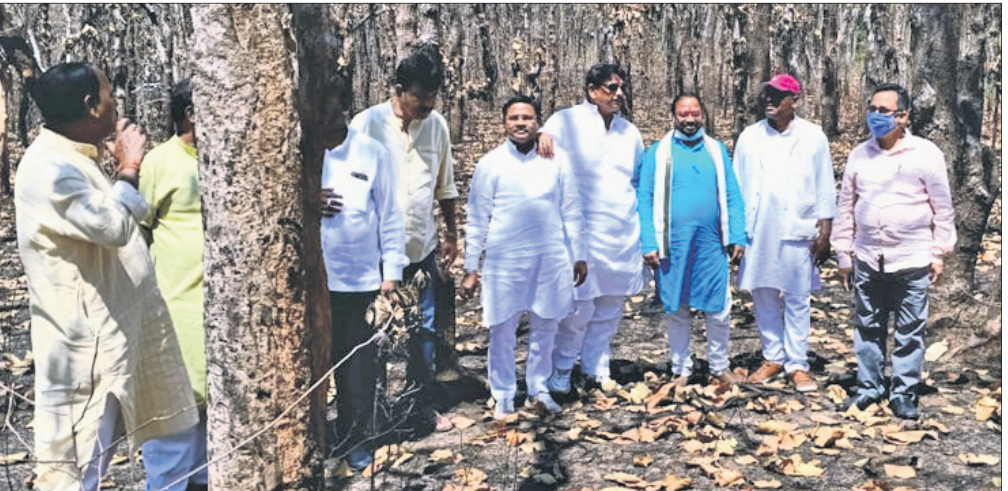
ଭାବପା ବିଧାୟକମାନେ ଶିମିଳିପାଳ ସ୍ଥିତି ବୁଲି ଦେଖୁଛନ୍ତି।