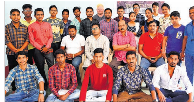
ଆୟୋଜିତ ସମ୍ବଲପୁର ନାଟକ କର୍ମଶାଳାରେ ପ୍ରଶିକ୍ଷକ ଓ ପ୍ରଶିକ୍ଷାଥୀମାନେ ।