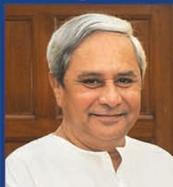
Shri Naveen Patnaik Hon'ble CM, Odisha