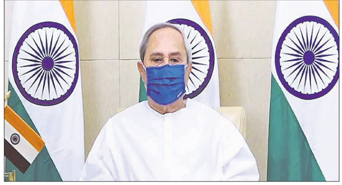
ପୁଖ୍ୟମନ୍ତ୍ରୀ ନବୀନ ପଟ୍ଟନାୟକ

ଶୂନ୍ୟ ସଂକ୍ରମଣ ଆମର ଲକ୍ଷ୍ୟ: ପୁଖ୍ୟମନ୍ତ୍ରୀ ■ ସହଯୋଗ ଲୋଡ଼ିଲେ, ଭରସା ରଖିଲେ ■ ଲାଜତାଉନ୍ କଷ୍ଟକୁ ଯତ୍ନେପକାଇ ଦେଲେ ■ କୋଭିଡ଼ ଗାଢ଼ଲାଇନ୍ ପାଳନ କରିବାକୁ ଅନୁରୋଧ କଲେ