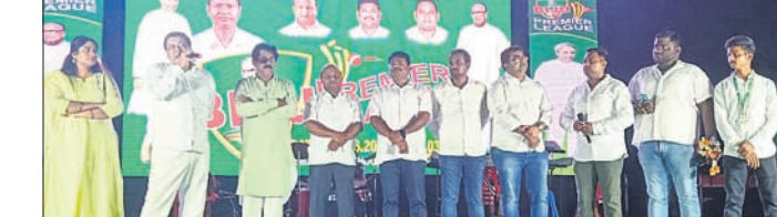
ବିଜୁ ପ୍ରିମିୟର ଲିଗ୍ ଉଦ୍‌ଘାଟନ କାର୍ଯ୍ୟକ୍ରମରେ ଯୋଗଦେଇଥିବା ଅତିଥିମାନେ।