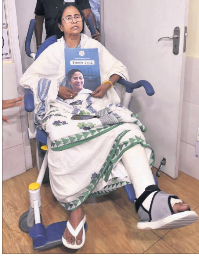
ପଶ୍ଚିମବଙ୍ଗ ପୁଞ୍ଜାମନ୍ତ୍ରାଳୟ ମମତା ବାନାର୍ଜୀ ଟିଏମ୍‌ସିର ନିର୍ବାଚନୀ ଇସ୍ତହାର ଉନ୍ମୋଚନ କରୁଛନ୍ତି ।

ପଶ୍ଚିମବଙ୍ଗ ପୁଞ୍ଜାମନ୍ତ୍ରାଳୟ ମମତା ବାନାର୍ଜୀ ବୁଧବାର ତୃଣମୂଳ କଂଗ୍ରେସ (ଟିଏମ୍‌ସି)ର ନିର୍ବାଚନୀ ଇସ୍ତହାର ଉନ୍ମୋଚନ କରିଛନ୍ତି । ଏଥିରେ ପଞ୍ଚୁଆ ବର୍ଗର ଲୋକମାନଙ୍କ ଲାଗି ବାର୍ଷିକ ସର୍ବନିମ୍ନ ରୋଜଗାର ପ୍ରତିଶ୍ରୁତି ସାଙ୍ଗକୁ ଉଚ୍ଚଶିକ୍ଷା କ୍ଷେତ୍ରରେ ଛାତ୍ରୀଛାତ୍ରଙ୍କ ପାଇଁ ୧୦ ଲକ୍ଷ ଟଙ୍କା ମୂଲ୍ୟର ସ୍ୱତନ୍ତ୍ର କ୍ରେଡିଟ୍ କାର୍ଡ ଓ ଜନକାଠି ପରିବାରକୁ ୧୦୦୦ ମାତ୍ର ୪ ପ୍ରତିଶତ ସୁଧହାରରେ ଅର୍ଥ ଯୋଗାଇଦିଆଯିବ ବୋଲି କୁହାଯାଇଛି । ସେହିପରି ଚାଷୀଙ୍କୁ ୧୦ ହଜାର ଟଙ୍କା ଆର୍ଥିକ ସହାୟତାର ପ୍ରତିଶ୍ରୁତି ଦିଆଯାଇଛି । ଟିଏମ୍‌ସି କ୍ଷମତାକୁ ଆସିଲେ ଅନ୍ୟାନ୍ୟ ପଞ୍ଚୁଆ ବର୍ଗରେ ଅନ୍ୟ ସମ୍ପ୍ରଦାୟକୁ ସାମିଲ କରିବା ଲାଗି ଚାଷୀମାନଙ୍କୁ ଗଠନ ହେବ । ଗତ ସପ୍ତାହରେ ଟିଏମ୍‌ସିର ଇସ୍ତହାର ପ୍ରକାଶ ପାଇବାକୁ ଥିବାବେଳେ ପୁଞ୍ଜାମନ୍ତ୍ରାଳୟ ଆଇଡିଏର ଆଦାତ ଲାଗିବାରୁ ଏହାକୁ ସ୍ଥଗିତ ରଖାଯାଇଥିଲା । ଇସ୍ତହାର ଅନୁଯାୟୀ ଟିଏମ୍‌ସି ସରକାର ପ୍ରତିଶ୍ରୁତି ଦେବେ ପୁଞ୍ଜାମନ୍ତ୍ରାଳୟ ପ୍ରତ୍ୟେକ ପରିବାରକୁ ସର୍ବନିମ୍ନ ମୌଳିକ ଆୟ ପରିସରକୁ ଅଣାଯିବ । ଏହି ଯୋଜନାରେ କରାଯାଇଥିଲା ।