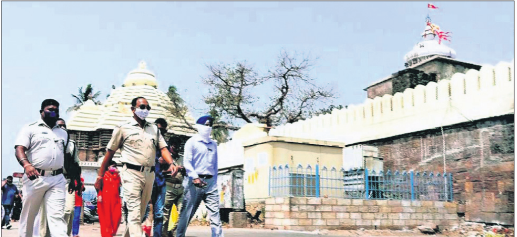
ପୁରୀ ଅଫିସ, ୧୭୩