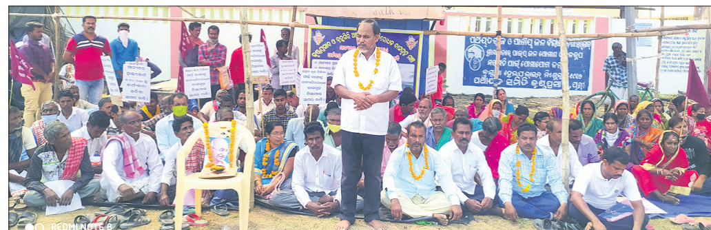
ଫାଇଲିନ ସହାୟତା ଦାବିରେ ହିତାଧିକାରୀମାନେ ଧାରଣା ଦେଇଛନ୍ତି।

ଫାଇଲିନ ବାତ୍ୟା ଯିବାର ୮ବର୍ଷ ବିତିଯାଇଥିଲେ ମଧ୍ୟ କୃଷ୍ଣପ୍ରସାଦ ଓ ବ୍ରହ୍ମଗିରି ଅଞ୍ଚଳର କେତେକ ହିତାଧିକାରୀ ଏହା ସହ ସରକାରୀ ସହାୟତା ଦାବି କରିଛନ୍ତି। ଗୃହ ପାଇବା ଦାବିରେ ଉଚ୍ଚ ୨ ଅଞ୍ଚଳକୁ ନେଇ ଗଠିତ ମହାସଂଘ ସହ କେତେକ ହିତାଧିକାରୀ ବୁଧବାର ବ୍ଲକ୍ ଆଗରେ ଅହୋରାତ୍ର ଅନଶନରେ ବସିଛନ୍ତି। ଫାଇଲିନରେ ଗୃହ ହରାଇଥିବା ପରିବାର ପାଇଁ ପୁରୀ, ଗଞ୍ଜାମ ଏବଂ ଖୋର୍ଦ୍ଧା ଜିଲ୍ଲାରେ ଗୃହ ସହାୟତା ନିମନ୍ତେ ବିଶ୍ୱ ବ୍ୟାଙ୍କ ୩ଲକ୍ଷ କିଛି ଟଙ୍କା ଉପକ୍ରମ ଆରମ୍ଭ କରିଛନ୍ତି। ଏ ସମ୍ପର୍କରେ ସହାୟକ କୃଷି ଅଧିକାରୀ ରୁଚିକ୍ଷିତା କରମହାପାତ୍ର ୭ମାସ ପରେ ବ୍ଲକ୍ କୃଷି ଅଧିକାରୀ ଗ୍ରାମ୍ୟ କୃଷି କାର୍ଯ୍ୟକର୍ତ୍ତା(ବିଏମ୍.ଏ.ଏ.ଏ.)ଙ୍କ ମାଧ୍ୟମରେ ଚଳିତ ମାସ ୪ତାରିଖରେ ଏକ ବିଲ୍ ପ୍ରଦାନ କରିଥିଲେ। ସେଥିରେ ଓଡ଼ିଶା ଆଗ୍ରୋ ଇଣ୍ଡଷ୍ଟ୍ରି କର୍ପୋରେସନ୍ ଲିମିଟେଡ୍, ସତ୍ୟନଗର ଭୁବନେଶ୍ୱର ଦ୍ୱାରା ପ୍ରଦତ୍ତ