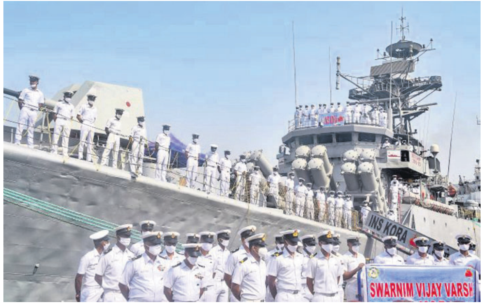
୧୯୭୧ ଭାରତ-ପାକିସ୍ତାନ ଯୁଦ୍ଧର ୫୦ ବର୍ଷ ପୂର୍ବ ଅବସରରେ 'ସର୍ବମ ବିଜୟ ବର୍ଷ' ମଶାଲ ସହ କୋଲକାତାରେ ଖୁବ୍‌ବେଗରେ ଚଳେଇଥିବା ପହଣ୍ଡିଆ ଆଇଏସଏସ କୋରା ଡେକ୍‌ରେ ଭାରତୀୟ ନୌସେନା ଅଧିକାରୀମାନେ ।

ନୂଆଦିଲ୍ଲୀ, ୧୭/୩(ପି.ଟି.): ଲୋକ ସଭାରେ ବୁଧବାର ୨୦୨୧-୨୨ ଆର୍ଥିକ ବର୍ଷ ଲାଗି ବ୍ୟୟମଞ୍ଜୁରୀ ବିଲ୍ ଗୃହୀତ ହୋଇଯାଇଛି । ଫଳରେ ବିଭିନ୍ନ ଯୋଜନା ଓ କାର୍ଯ୍ୟକ୍ରମ କାର୍ଯ୍ୟକାରୀ କରିବା ନିମନ୍ତେ ସରକାରୀ ପାଖିରୁ ଅର୍ଥ ଖର୍ଚ୍ଚ କରିବା ଲାଗି କେନ୍ଦ୍ର ସରକାରଙ୍କୁ କ୍ଷମତା ମିଳିଯାଇଛି । ବ୍ୟୟମଞ୍ଜୁରୀ ବିଲ୍ ପାଇଁ ସହିତ ବଜେଟ୍ ଅନୁମୋଦନର ଦୁଇତୃତୀୟାଂଶ କାର୍ଯ୍ୟ ସମ୍ପୂର୍ଣ୍ଣ ହୋଇଛି । ଅର୍ଥମନ୍ତ୍ରାଳୟ ନିର୍ମଳା ସାତାଗାମନ ଏହି ବିଲ୍ ଆଗତ କରିଥିଲେ ।