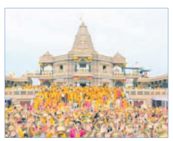
ଗୁରୁଧ୍ୟାନ ମନ୍ଦିର ପରିସରରେ ଜଗଦଗୁରୁ କୃପାଳୁ ପରିଷଦ ପକ୍ଷରୁ ମାର୍ଚ୍ଚ ୧୩କୁ ଏହି ଧର୍ମସଭା ଆୟୋଜନ କରାଯାଇଥିଲା। ଏଥିରେ ବିଭିନ୍ନ ଅଞ୍ଚଳରୁ ୧୪ ହଜାରରୁ ଊର୍ଦ୍ଧ୍ୱ ଶ୍ରଦ୍ଧାଳୁ ଯୋଗଦେଇଥିଲେ। ସେମାନେ କରୋନା କଟକଣା ମାନି ନ ଥିଲେ। ମାଝ ପିଠି, ସାମାଜିକ ଦୂରତ୍ୱ, ଚାପମାତ୍ରା ସାଞ୍ଜ, ହ୍ୟାଣ୍ଡ୍ ସାନିଟାଇଜ୍ ଆଦିକୁ ଅଣେବେଣୀ କରାଯାଇଥିଲା। ଯେଉଁମାନେ କୋଭିଡ୍ ପଜିଟିଭ୍ ଚିହ୍ନଟ ହେଲେ ସେମାନଙ୍କୁ ଚିକିତ୍ସା କରା ନ ଯାଇ ମନ୍ଦିର ପରିସରକୁ ଚାଲିଯିବାକୁ କୁହାଯାଇଥିଲା।

ଲକ୍ଷ୍ନୌ, ୧୭ମାର୍ଚ୍ଚ (ଆଇଏସ୍‌ଏସ୍) ଉତ୍ତରପ୍ରଦେଶର ପ୍ରତାପଗଡ଼ ନିକଟରେ ଥିବା ଗୁରୁଧ୍ୟାନ ମନ୍ଦିର କୋଭିଡ୍ ହର୍ଷଣରେ ପରିଣତ ହୋଇଛି। ସେଠାରେ ଅନୁଷ୍ଠିତ ହୋଇଥିବା ୩ ଦିନିଆ ଧର୍ମସଭାକୁ ଆସିଥିବା ଅନେକ ଭକ୍ତ ଏବେ କରୋନା ପଜିଟିଭ୍ ଚିହ୍ନଟ ହୋଇଛନ୍ତି। ଗତବର୍ଷ ନୂଆଦିଲ୍ଲୀର ତବଲିୟି ଜମାଂଦ ସମ୍ମିଳନୀରୁ ଅନୁରୂପ ସଂକ୍ରମଣ ବ୍ୟାପିଥିଲା।