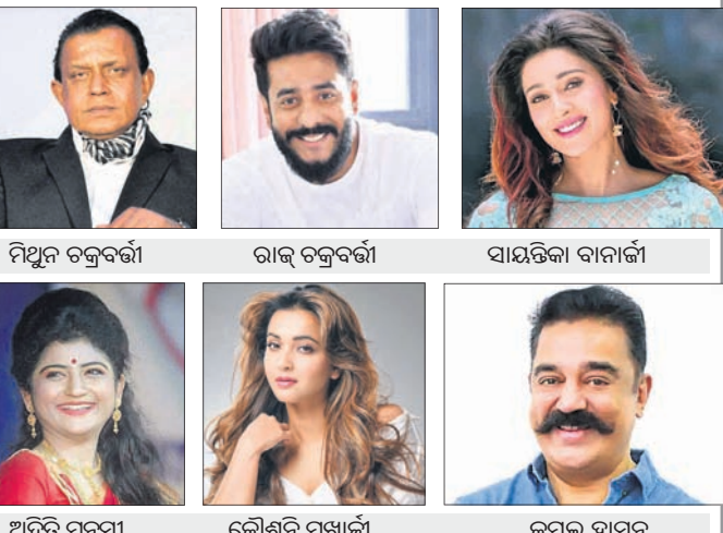
ମିଥୁନ ଚକ୍ରବର୍ତ୍ତୀ, ରାଜ ଚକ୍ରବର୍ତ୍ତୀ, ସାୟୋନି ବାନାର୍ଜୀ, ଅଦିତ ପୁନ୍ୟା, କୌଶଳ ପୁଞ୍ଜୀ, କମଳ ହାସନ, ଚାକ୍ ଭୂମିକା, ଚକ୍ରିପୁରରୁ ରହିଛି। ଏପରିକି ଭାଜପା ତାଙ୍କୁ ପୁଞ୍ଜୀମନ୍ତ୍ରୀ ଆସନ ପାଇଁ ବାଛିଥିବା ଅନେକେ ଆଲୋଚନା କରୁଛନ୍ତି। ପୂର୍ବତନ ଭାରତୀୟ କ୍ରିକେଟର ଅଶୋକ ତିଝା, ଏମ୍‌ପି ତଥା ବିଭିନ୍ନ ଗାୟକ ବାପୁଲ ପୁପ୍ରି ଚଳିତରୁ ଶ୍ୟାମପୁରରୁ ଚକ୍ରବର୍ତ୍ତୀ, ଚକ୍ରିପୁରରୁ ଯଶ ଦାସପୁତ୍ରୀ, ଆସନରୁ ଭାଜପା ପ୍ରାର୍ଥୀ କରି ନ ଥିଲେ ହେଁ ନିର୍ବାଚନୀ ପ୍ରଚାରରେ ପଞ୍ଜୀ କରିଛି। ଚାଳିଶାହାରେ ତୀବ୍ର ହେବାରେ ଲାଗିଛି ସ୍ୱାର୍ ପ୍ଲାର୍।