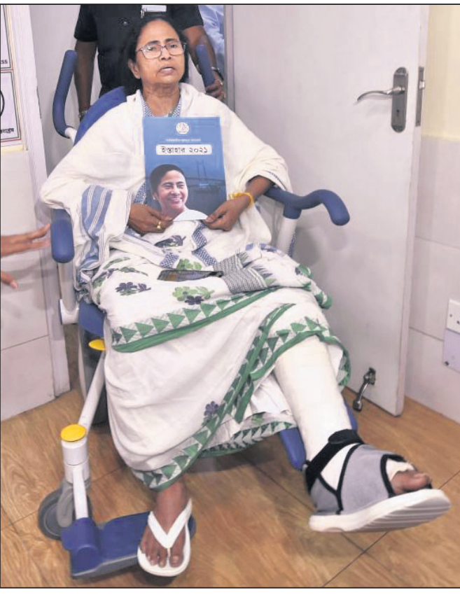
ପଞ୍ଚମ ପର୍ଯ୍ୟାୟ ମମତା ବାନାର୍ଜୀ ଟିଏମ୍‌ସିର ନିର୍ବାଚନୀ ଇସ୍ତହାର ଉନ୍ମୋଚନ କରୁଛନ୍ତି।