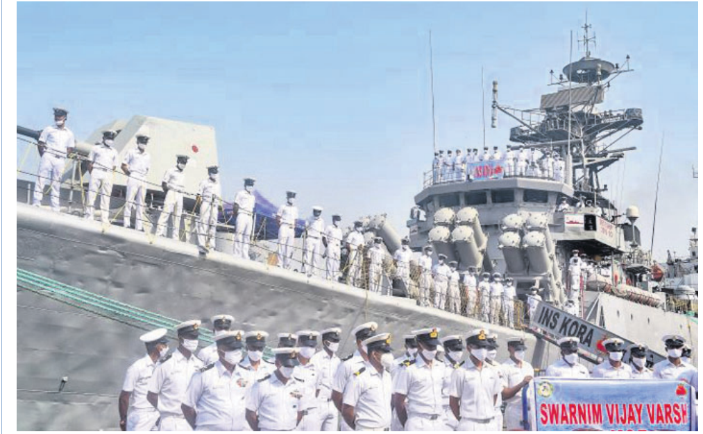
୧୯୭୧ ଭାରତ-ପାକିସ୍ତାନ ଯୁଦ୍ଧର ୫୦ ବର୍ଷ ପୂର୍ବ ଅବସରରେ 'ସର୍ବମ ବିଜୟ ବର୍ଷ' ମଶାଲ ସହ କୋଲକାତାର ଖୁବେରପୁର ଚକ୍ରେ ରୁଧିରା ପହଞ୍ଚିଥିବା ଆଇଏସ୍‌ଏସ୍ କୋରା ଡେକ୍ରେ ଭାରତୀୟ ନୌସେନା ଅଧିକାରୀମାନେ।

ନୂଆଦିଲ୍ଲୀ, ୧୭ମାର୍ଚ୍ଚ (ପି.ଟି.) ଲୋକ ସଭାରେ ରୁଧିରା ୨୦୨୧-୨୨ ଆର୍ଥିକ ବର୍ଷ ଲାଗି ବ୍ୟୟମଞ୍ଜୁରୀ ବିଲ୍ ଗୃହୀତ ହୋଇଯାଇଛି। ଫଳରେ ବିଭିନ୍ନ ଯୋଜନା ଓ କାର୍ଯ୍ୟକ୍ରମ କାର୍ଯ୍ୟକାରୀ କରିବା ନିମନ୍ତେ ସରକାରୀ ପାଖିରୁ ଅର୍ଥ ଖର୍ଚ୍ଚ କରିବା ଲାଗି କେନ୍ଦ୍ର ସରକାରଙ୍କୁ କ୍ଷମତା ମିଳିଯାଇଛି। ବ୍ୟୟମଞ୍ଜୁରୀ ବିଲ୍ ପାଇଁ ସହିତ ବଜେଟ୍ ଅନୁମୋଦନର ଦୁରୁତ୍ତ୍ୱାୟାଣ କାର୍ଯ୍ୟ ସମ୍ପୂର୍ଣ୍ଣ ହୋଇଛି। ଅର୍ଥମନ୍ତ୍ରୀ ନିର୍ମଳା ସୀତାରାମନ ଏହି ବିଲ୍ ଆଗତ କରିଥିଲେ।