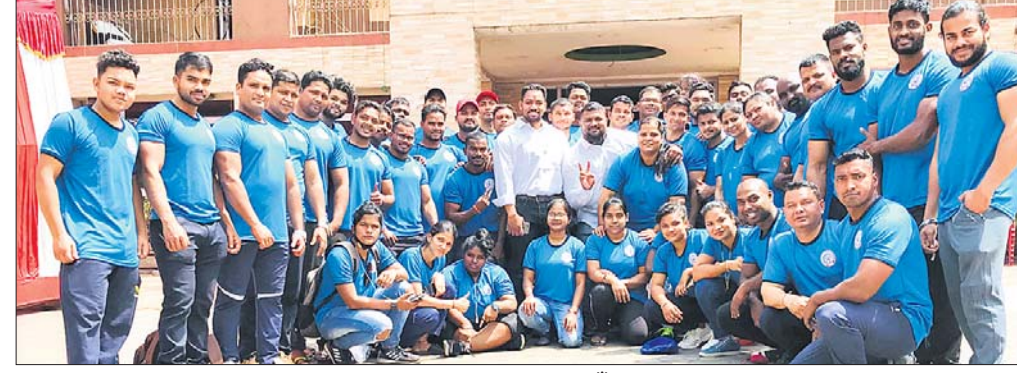
ଜାତୀୟ ଶକ୍ତି ଉତ୍ତୋଳନରେ ଭାଗନେବା ପାଇଁ ମନୋନୀତ ଓଡ଼ିଶା ଦଳ।

ପୁରୁଣା ଭୁବନେଶ୍ୱର, ୧୭୩୩ (ପି.ଏନ.ଏ.): ଗ୍ଲାନାୟ ବାକ୍ସିଆଳ ଖେଳ ପଡ଼ିଆରେ ଆସନ୍ତା ୨୭ ଓ ୨୮ ତାରିଖ ଦୁଇଦିନଧରି ତିନାମଣି ସ୍ଥାନକୀ କ୍ରିକେଟ ଚୁନାମେଷ୍ ଅନୁଷ୍ଠିତ ହେବ। ଏହି ରାଜ୍ୟସ୍ତରୀୟ ଚୁନାମେଷ୍ରେ କଟକ, ଭେଙ୍କାନାଳ, ଜଗଦିସିଂହପୁର, ଖୋର୍ଦ୍ଧା ଆଦି ଅଞ୍ଚଳରୁ ଦଳଗୁଡ଼ିକ ଭାଗନେବେ। କର୍ମ ବଳରେ ମ୍ୟାଚ୍ ଗୁଡ଼ିକ ଫୁଲ୍ ଲାଇଟରେ ଅନୁଷ୍ଠିତ ହେବ। ପ୍ରଥମ ଦିବସରେ ୪ କ୍ୱାର୍ଟର ଫାଇନାଲ ଏବଂ ଦ୍ୱିତୀୟ ଦିବସରେ ୨ ସେମିଫାଇନାଲ ଓ ଫାଇନାଲ ଖେଳାଯିବ। ବାକ୍ସିଆଳ ଯୁଦ୍ଧ କ୍ଷେତ୍ରରେ ଆୟୋଜିତ ହେବାକୁଥିବା ଏହି ପ୍ରତିଯୋଗିତା ପାଇଁ ଗମ୍ଭୀର ଦଳକୁ ଟ୍ରଫି ସହ ୧୫,୦୦୦ ଓ ରକ୍ଷଣାବଦ୍ଧ ଦଳକୁ ୧୦,୦୦୦ଟଙ୍କା ପୁରସ୍କାର ଆକାରରେ ପ୍ରଦାନ କରାଯିବ ବୋଲି ରୁଧିରା ପ୍ରସ୍ତୁତି ଟ୍ରେନିଂରେ ଘୋଷଣା ହୋଇଛି। ଟ୍ରେନିଂରେ ଆୟୋଜକ ଅନୁଷ୍ଠାନର କବିରାଜ ସାଲ୍, କାଳିନ୍ଦି ପ୍ରଧାନ, ଆଦିତ୍ୟ ସାଲ୍, ସୁନୀଲ ସାଲ୍, ରସାନ୍ଦ ସାଲ୍ ଗୌତମ ପ୍ରଧାନ ପ୍ରମୁଖ ଯୋଗ ଦେଇଥିଲେ।