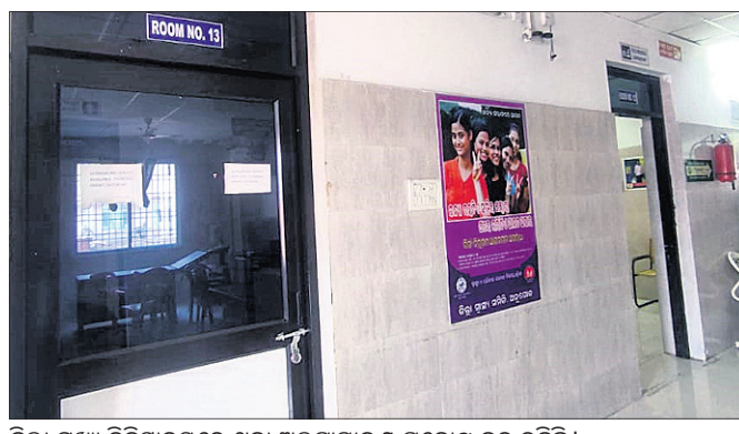
ଜିଲ୍ଲା ମୁଖ୍ୟ ଚିକିତ୍ସାଳୟରେ ଥିବା ଅଲଗାସାଥରେ ପ୍ରକୋଷ୍ଠ ବନ୍ଦ ରହିଛି ।

ଅନୁଗୋଳ ଜିଲ୍ଲା ମୁଖ୍ୟ ଚିକିତ୍ସାଳୟର ମହିଳା ଓ ପୁସ୍ତକ ବିଭାଗ ରୋଗୀଙ୍କୁ ଠିକ୍ ଭାବେ ଅଲଗାସାଥରେ ସେବା ମିଳୁନାହିଁ ବାସ୍ତବରେ ଥିବା ମହିଳା ତାଲୁକ ଜଣକ ସ୍ୱାମୀଙ୍କ ଚିକିତ୍ସା ପାଇଁ ବାରମ୍ବାର କୁଟିର ଯାଉଥିବାରୁ ଏହି ସେବା ଏକପ୍ରକାର ଠିକ୍ ହୋଇଯାଇଥିବା ଅଭିଯୋଗ ହେଉଛି । ଦୀର୍ଘଦିନ ଧରି ଜିଲ୍ଲା ମୁଖ୍ୟ ଚିକିତ୍ସାଳୟରେ ଅଲଗାସାଥରେ ନେଇ ଏପରି ଅବ୍ୟବସ୍ଥା ଯୋଗୁ ମହିଳା ରୋଗୀମାନେ ବାଧ୍ୟ ହୋଇ ଘରୋଇ ମେଡିକାଲ ଯାତ୍ରା ଖର୍ଚ୍ଚ ହେଉଥିବାରୁ ଅସନ୍ତୋଷ ପ୍ରକାଶ ପାଇଛି । ମେଡିକାଲ ପକ୍ଷରୁ ମିଳୁଥିବା ସୂଚନା ମୁତାବକ, ଗତ ନଭେମ୍ବରରେ ଜିଲ୍ଲା ମୁଖ୍ୟ ଚିକିତ୍ସାଳୟର ୬୫୫ ମହଲରେ ଥିବା ଅଲଗାସାଥରେ ପ୍ରକୋଷ୍ଠ ବାରମ୍ବାର ବନ୍ଦ ରହିଛି । ସାମା ଅସୁସ୍ଥ ଥିବାରୁ ସମସ୍ତା