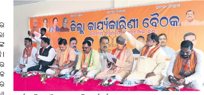
କାର୍ଯ୍ୟକାରୀଣା ବୈଠକରେ ଉପସ୍ଥିତ କର୍ମକର୍ମୀମାନେ ।