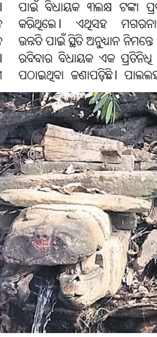
ଉନ୍ନତୀକରଣ ଦିଗରେ ଉଷ୍ମ ପ୍ରସ୍ରବଣ ।