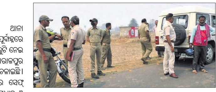
ଘଟଣାସ୍ଥଳରେ ପୋଲିସ୍ ଟିମ୍ ଅନୁଧ୍ୟାନ କରୁଛି।