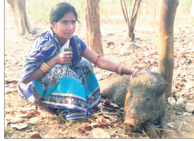
ଧୂଡୁକୁ ସ୍ନେହ କରୁଛନ୍ତି କୁଟୁମ୍ବିକ।

କୁଟୁମ୍ବିକ ପରିବାର ଲୋକଙ୍କୁ କମ୍ ପରିଶ୍ରମ କରିବାକୁ ପଡ଼ିଛି। ବୁଧବାର କୁଟୁମ୍ବିକ ଓ ତାଙ୍କ ଝିଅ ଘରଠାରୁ ୨୦ କି.ମି. ଦୂର ସମାଲୋଇ ଜଙ୍ଗଲରେ ପହଞ୍ଚି ଧୂଡୁ ନାଁ ଧରି ଡାକିଥିଲେ। ତାଙ୍କ ଡାକ ଶୁଣି ଘଞ୍ଚ ଜଙ୍ଗଲରେ ଥିବା ଧୂଡୁ ସେମାନଙ୍କ ପାଖକୁ ଧାଇଁ ଆସିଥିଲା। ମା' ଝିଅ ସାଙ୍ଗରେ ନେଇଥିବା ଭାତ ତାକୁ ଖାଇବାକୁ ଦେଇଥିଲେ। ଆନନ୍ଦରେ ସେହି ଜଙ୍ଗଲରେ ଛାଡ଼ି ଦେଇଥିବା ବେଳେ ସାଙ୍ଗରେ ପୁରୁଷୋତ୍ତମପୁର ଫେରି ଆସିଥିଲା। ଉଲ୍ଲେଖଯୋଗ୍ୟ ଯେ, ଦୁଇ ବର୍ଷ ତଳେ ଜଙ୍ଗଲକୁ ଜାଲେଣୀ କାଠ ଆଣିବାକୁ ଯାଇଥିବା ବେଳେ ମା' ଠାରୁ ଅଲଗା ହୋଇ ଏକୃତ୍ୟା ବୁଲୁଥିବା ଏକ ବାଉଁଶ ଛୁଆକୁ ପାଲ କୁଟୁମ୍ବିକ ଘରକୁ ନେଇ ଆସିଥିଲେ। ସେ ତାକୁ ଖାଇବା ପାଇବାକୁ ଦେଇ ନିଜ ପିଲା ଭଳି ପାଲି ଆସୁଥିଲେ। ବାଉଁଶ ତେଲକୋଇ ବୁକ ପୁରୁଷୋତ୍ତମପୁର ପାଲ ବନ ବିଭାଗ ଗତ ମଙ୍ଗଳବାର ତାକୁ ଉଦ୍ଧାର କରି ସମାଲୋଇ ଜଙ୍ଗଲରେ ଛାଡ଼ି ଦେଇଥିଲେ। ବାଉଁଶକୁ ଝୁରି ଝୁରି କୁଟୁମ୍ବିକରେ