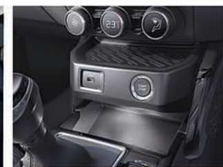
ଅଗ୍ର AC, PM2.5 ଫିଲ୍ଟର ଏୟାର ଫିଲ୍ଟର ସାଥ୍ରେ