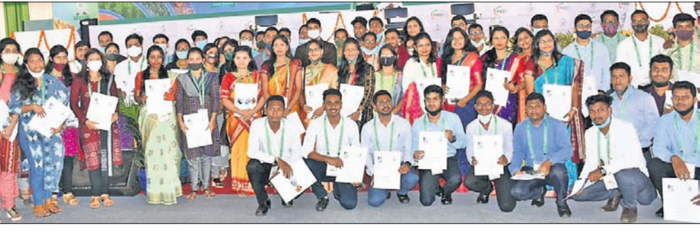
କୃଷିମନ୍ତ୍ରାଳୟର ଉପସାହାୟକ ସହକାରୀ ମହ୍ୟ ଅଧିକାରୀମାନେ।

ଓଡ଼ିଶାରେ ମହ୍ୟ ଉତ୍ସାଦନ ଏବଂ ରପ୍ତାନି ବୃଦ୍ଧିର ବ୍ୟାପକ ସୁଯୋଗ ରହିଛି। ରାଜ୍ୟର ଅର୍ଥନୈତିକ ଅଭିବୃଦ୍ଧିରେ ମହ୍ୟ ସମ୍ପଦର ଭୂମିକା ଗୁରୁତ୍ଵପୂର୍ଣ୍ଣ। ସରକାର ଚାଷୀଙ୍କ ଆୟ ବୃଦ୍ଧି କରିବା ପାଇଁ ଲକ୍ଷ୍ୟ ରଖୁଥିବା ବେଳେ ମାଛଚାଷ ଏଥିରେ ସହାୟକ ହୋଇପାରେ ବୋଲି