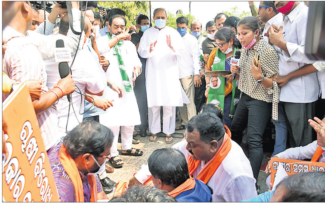
ଧାରଣାଗତ ଭାଜପା ବିଧାୟକଙ୍କୁ ଆଲୋଚନା ପାଇଁ ଗୁରୁବାର ମୁଖ୍ୟମନ୍ତ୍ରୀ ନବୀନ ପଟ୍ଟନାୟକ ନବୀନ ନିବାସକୁ ଡାକି ନେଇଛନ୍ତି।