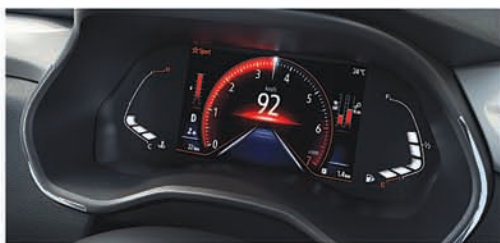
ମଲ୍ଟି-ସ୍କିନ 17.78 cm ପୁନର୍ବିନ୍ୟାସ ଯୋଗ୍ୟ TFT ଡିସ୍ପ୍ଲେ, ମଲ୍ଟି-ସ୍ପେଡ୍ ଟ୍ରାନ୍ସମିସନ୍ ମୋଡ୍ ସାଥ୍ରେ

ପ୍ରାରମ୍ଭିକ ମୂଲ୍ୟ ₹5.45 ଲକ୍ଷ* ଶ୍ରେଣୀଧାରୀ ଲକ୍ଷ୍ୟାଳିଙ୍ଗ ବେନିଫିଟ୍