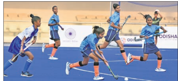
ଅଲିମ୍ପିଆନ୍ ବିଭେଦ ହିଁ ଏକାଡେମୀ ଓ ଚାମିନିନାଟୁ ହିଁ ଏକାଡେମୀ ମଧ୍ୟରେ ଅନୁଷ୍ଠିତ ମ୍ୟାଚ । ଛୁବନେଶ୍ୱର, ୧୮୩(କ୍ରୀଡ଼ା ପ୍ରତିନିଧି)

ଶ୍ଯାମୀୟ କଳିଙ୍ଗ ଷ୍ଟାଡ଼ିୟମରେ ଚାଲିଥିବା ଏକାଡେମୀ ମହିଳା ହକି ଟୁର୍ନାମେଣ୍ଟର ସର୍ବଶ୍ରେଷ୍ଠ ବିଭାଗରେ ଓଡ଼ିଶା ନାଭାଲ ଟୀମ୍ ହକି ହାଲ ପରଫର୍ମାନ୍ସ ସେକ୍ଟର (ଏନ୍ଟିଏର୍) ବିଜୟୀ ହୋଇଛି । ଚତୁର୍ଥ ଦିନରେ ଛତିଶଗଡ଼କୁ ୫ ଉଇକେଟରେ ପରାସ୍ତ କରିଛି । ଛତିଶଗଡ଼ ପକ୍ଷରୁ ଧାର୍ଯ୍ୟ ୧୪୯ ରନ ବିଜୟ ଲକ୍ଷ୍ୟକୁ ଓଡ଼ିଶା ୪୦.୧ ଓଭରରେ ୫ ଉଇକେଟ ହରାଇ ହାସଲ କରି ନେଇଥିଲା । ମାର୍ଚ୍ଚ ୧୨ରେ ଖାଡ଼ଖଣ୍ଡଠାରୁ ପ୍ରଥମ ମ୍ୟାଚରେ ୫ ଉଇକେଟରେ ହାରିବା ପରେ ଓଡ଼ିଶାର ଏହା କ୍ରମାଗତ ତୃତୀୟ ବିଜୟ । ପରବର୍ତ୍ତୀ ୨ ମ୍ୟାଚରେ ଓଡ଼ିଶା ୯ ଉଇକେଟରେ ଶ୍ଯାମୀୟ କଳିଙ୍ଗ ଷ୍ଟାଡ଼ିୟମରେ ଚାଲିଥିବା ଏକାଡେମୀ ମହିଳା ହକି ଟୁର୍ନାମେଣ୍ଟର ସର୍ବଶ୍ରେଷ୍ଠ ବିଭାଗରେ ଓଡ଼ିଶା ନାଭାଲ ଟୀମ୍ ହକି ହାଲ ପରଫର୍ମାନ୍ସ ସେକ୍ଟର (ଏନ୍ଟିଏର୍) ବିଜୟୀ ହୋଇଛି । ଚତୁର୍ଥ ଦିନରେ ଛତିଶଗଡ଼କୁ ୫ ଉଇକେଟରେ ପରାସ୍ତ କରିଛି । ଛତିଶଗଡ଼ ପକ୍ଷରୁ ଧାର୍ଯ୍ୟ ୧୪୯ ରନ ବିଜୟ ଲକ୍ଷ୍ୟକୁ ଓଡ଼ିଶା ୪୦.୧ ଓଭରରେ ୫ ଉଇକେଟ ହରାଇ ହାସଲ କରି ନେଇଥିଲା । ମାର୍ଚ୍ଚ ୧୨ରେ ଖାଡ଼ଖଣ୍ଡଠାରୁ ପ୍ରଥମ ମ୍ୟାଚରେ ୫ ଉଇକେଟରେ ହାରିବା ପରେ ଓଡ଼ିଶାର ଏହା କ୍ରମାଗତ ତୃତୀୟ ବିଜୟ । ପରବର୍ତ୍ତୀ ୨ ମ୍ୟାଚରେ ଓଡ଼ିଶା ୯ ଉଇକେଟରେ