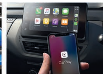
ଝାଞ୍ଚାଲକେସ୍ ପ୍ଲାର୍ଟ ଫୋନ ରେସ୍ପୋନ୍ସିଭ୍