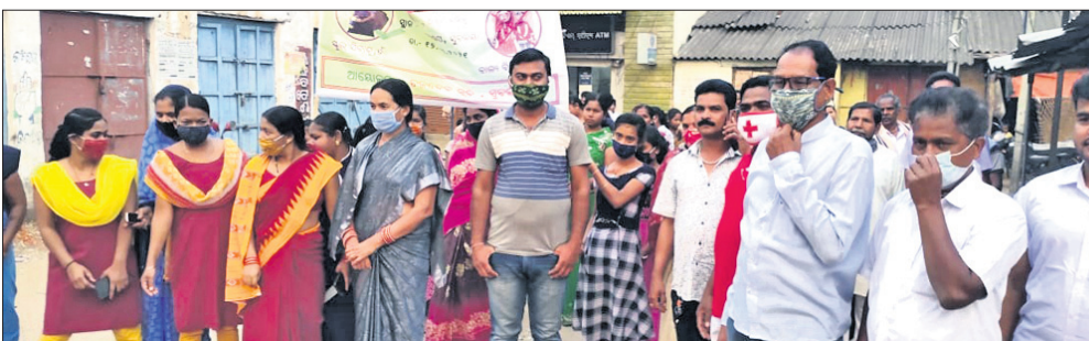
ସୁବକନ୍ୟାରେ ବାହାରିଥିବା ବାଲ୍ୟ ବିବାହ ସଚେତନତା ଶୋଭାଯାତ୍ରା ।