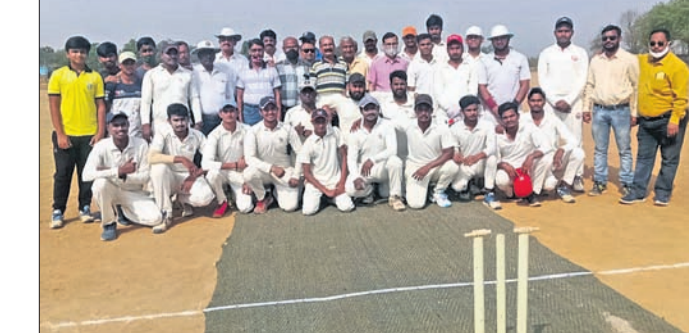
ଉଦ୍‌ଘାଟନୀ ମ୍ୟାଚ୍‌ରେ ଖେଳାଳିଙ୍କ ସହିତ ଅତିଥିମାନେ।