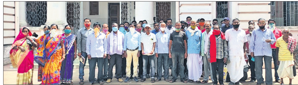
ଚାଷୀମାନେ ସ୍ମାରକପତ୍ର ଦେବାକୁ ଜିଲାପାଳଙ୍କ ନିକଟକୁ ଆସିଛନ୍ତି।