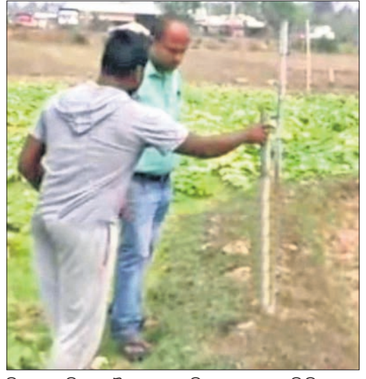
ନିଜ ବାସଜମିରେ ସୌର ଚାରବାଡ଼ ବିସ୍ତାରରେ ବୁଝାଇଛନ୍ତି ବିପ୍ଳବ।