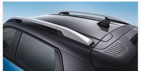
ନିଷ୍ଠୁରି ରାକ ରୁଫ୍, ଶାର୍ପ ଫିଙ୍ଗ୍ ଆଣ୍ଡେନା ସହିତ

for a test drive, call on 1800 315 4444. for further details, visit www.renault.co.in