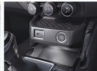
ଅଗ୍ର AC, PM2.5 ଫିଲ୍ଟର ଏୟାର ଫିଲ୍ଟର ସାଥରେ