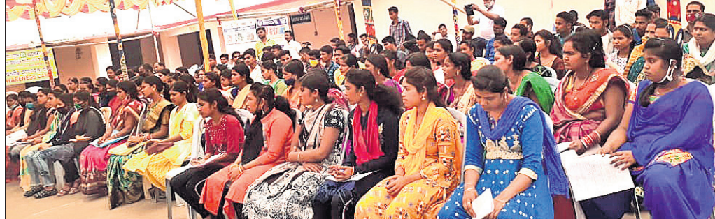
ଶିବିରରେ ଯୋଗଦେଇଥିବା ସୁବର୍ଣ୍ଣା ସୁବର୍ଣ୍ଣାମାନେ।

କୃଷିମନ୍ତ୍ରାଳୟରେ ନବନିଯୁକ୍ତ ସହକାରୀ ମହାତ୍ମା ଉତ୍ସାହୀନମାନେ।