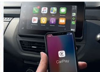
ଝାଞ୍ଜାଳକେସ୍ ପ୍ଲାର୍ଟ ଫୋନ ରେସ୍ପୋନ୍ସିଭ୍