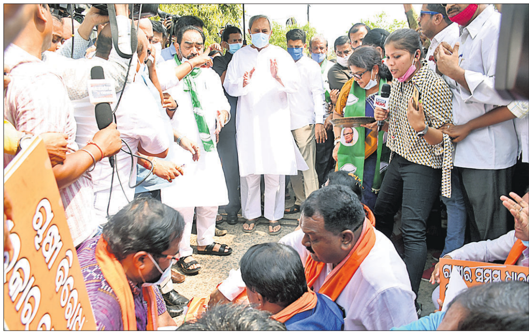
ଧାରଣାଗଡ଼ ଭାଜପା ବିଧାନସଭା ଆଲୋଚନା ପାଇଁ ଗୁରୁବାର ମୁଖ୍ୟମନ୍ତ୍ରୀ ନବୀନ ପଟ୍ଟନାୟକ ନବୀନ ନିବାସକୁ ଡାକି ନେଇଛନ୍ତି।