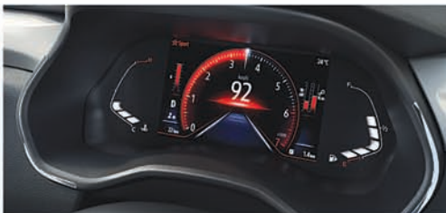
ମଲ୍ଟି-ସ୍କିନ 17.78 cm ପୁନର୍ବିନ୍ୟାସ ଯୋଗ୍ୟ TFT ଡିସ୍ପ୍ଲେ, ମଲ୍ଟି-ସେଟ୍ ଡ୍ରାଇଭ୍ ମୋଡ୍ ସାଥରେ

ପ୍ରାରମ୍ଭିକ ମୂଲ୍ୟ ₹5.45 ଲକ୍ଷ* ଶ୍ରେଣୀଧାରୀ ଲକ୍ଷାଳିଣୀ ବେନିଫିଟ୍