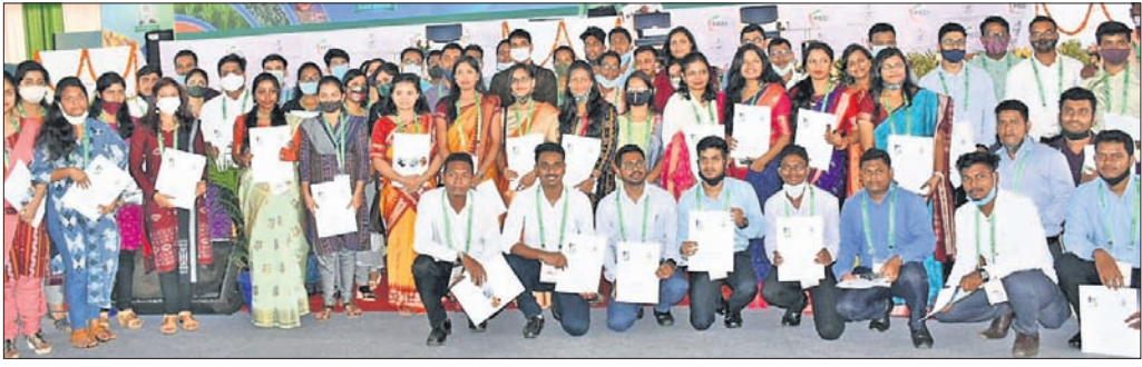
କୃଷିମନ୍ତ୍ରାଳୟରେ ନବନିଯୁକ୍ତ ସହକାରୀ ମହାତ୍ମା ଉତ୍ସାହୀନମାନେ।