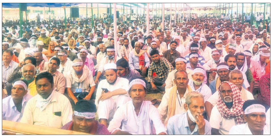
ଚଣ୍ଡିଖୋଲରେ ଆନ୍ଦୋଳିତ ଚାଷୀ ମହାସଂଗ୍ରହରେ କାତୀୟ ଏବଂ ରାଜ୍ୟସ୍ତରୀୟ କୃଷକ ନେତୃତ୍ୱର ଉପସ୍ଥିତ ଚାଷୀମାନେ।