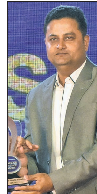
ସାହିଲ୍ ସାଲ୍ ଓଏସ୍‌ଏମ୍