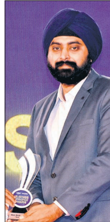
ଅର୍ଶଦୀପ ସିଂ ସବି ମୋଟର୍ସ