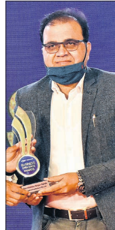
ନିଶାନ୍ତ ରଞ୍ଜନ ନନ୍ଦ ସମଷ୍ଟି ଇନ୍ଫୋର୍ମେସନ୍