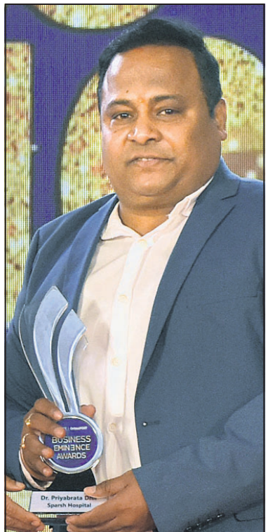
ପ୍ରିୟବ୍ରତ ଧାର ସର୍ଗ ହସ୍ପିଟାଲ୍