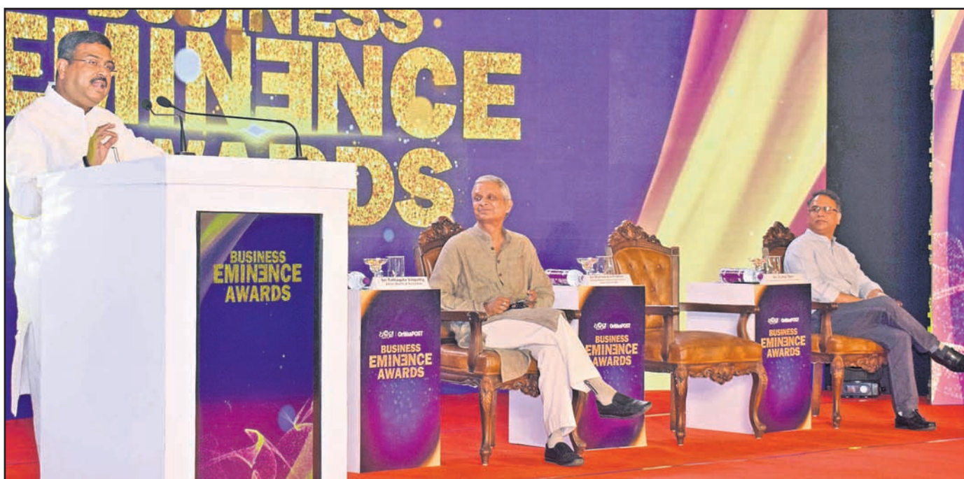
କେନ୍ଦ୍ରମାତୃ ଧର୍ମେନ୍ଦ୍ର ପ୍ରଧାନ ଉଦ୍ଘୋଷଣା କରୁଛନ୍ତି ।