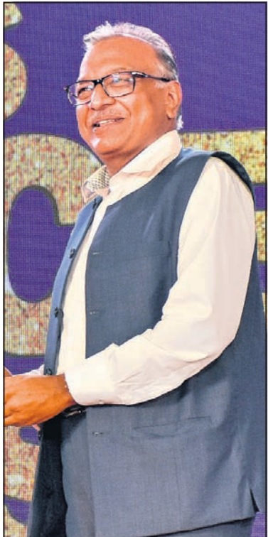
ଜୟପ୍ରକାଶ ବିଦ୍ୟୁତିଆ ଭାରତ ଗ୍ରୁପ୍