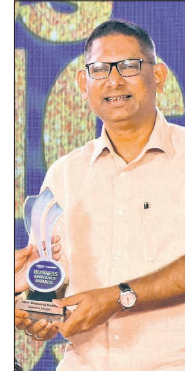
ଦେବରାଜ ରଥ ସେକ୍ସା ଭିଜେଟ୍