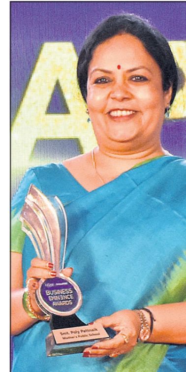
ସଲ୍ମା ପଟ୍ଟନାୟକ ମଦର୍ସ ପବ୍ଲିକ୍ ସ୍କୁଲ୍