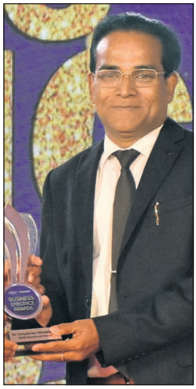
ସତ୍ୟବ୍ରତ ପାନଜେଡ଼ ଓଡ଼ିଏମ୍ ଏକ୍ସପ୍ରେସ୍ ଗ୍ରୁପ୍