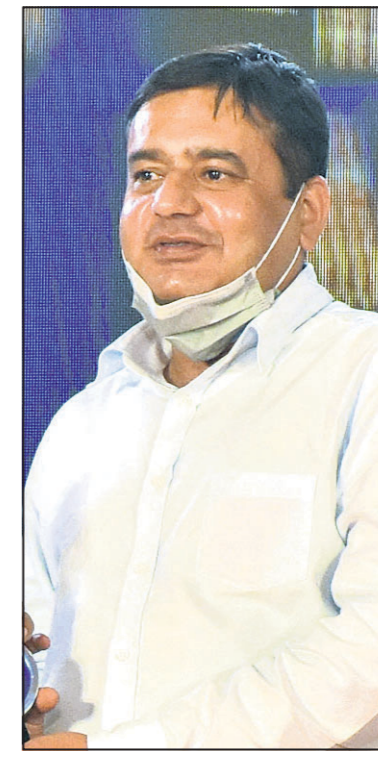
ବିଶାଳ ଧାଡ଼ନ କର୍ମାଣ୍ଡୋ ଅଟୋମୋବାଇଲ୍ସ ପ୍ରା.ଲି.