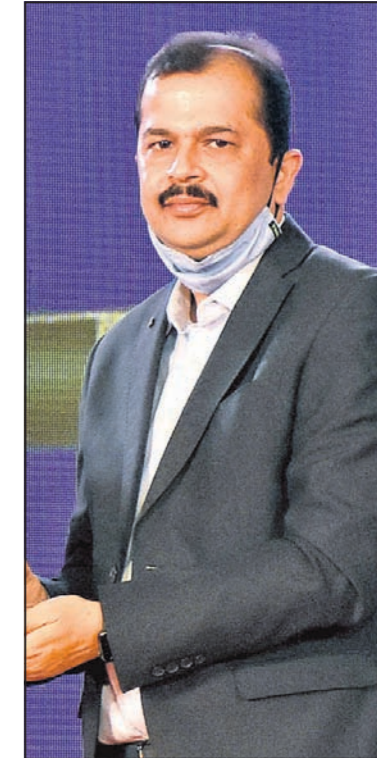
ବ୍ରହ୍ମାନନ୍ଦ ମେହେର ଅରୁଣ୍ଡତୀ କୁଏଲର୍ସ