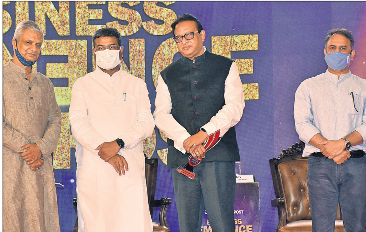
ଜିତେନ୍ଦ୍ର କୁମାର ସାର ଇଣ୍ଡଷ୍ଟ୍ରିଆଲ୍ସ ଓ ଷ୍ଟାଲ୍