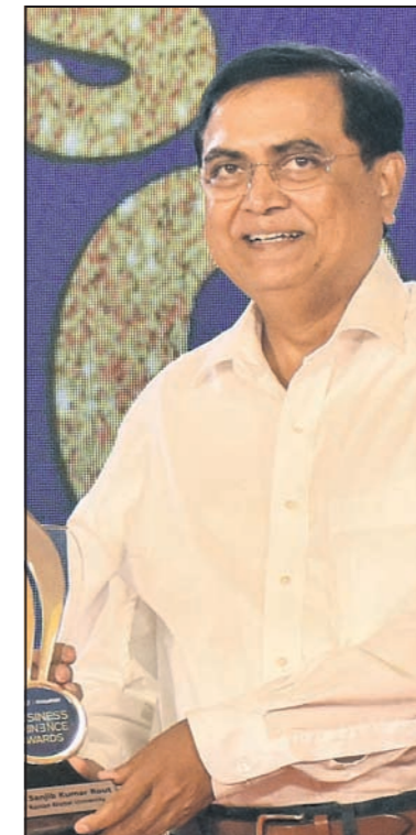
ସଞ୍ଜୀବ କୁମାର ରାଉତ ସି.ଭି. ରମଣ ଟ୍ରାଭେଲ୍ସ ଓ ଟୁରିଜ୍ମ