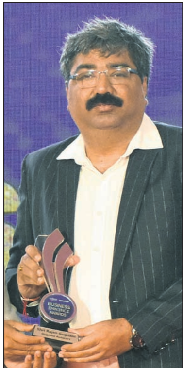
ରାଜନ୍ ପ୍ରତାପ ଗୁରୁନାଥ ଅଟୋମୋବାଇଲ୍ସ