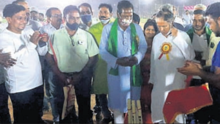
ଭଦ୍ରାଚରଣ କାର୍ଯ୍ୟକ୍ରମରେ ମନ୍ତ୍ରୀ, ଏମ୍ପିଏଙ୍କ ସମେତ ଅନ୍ୟମାନେ।

କାମାକ୍ଷାନଗରରେ ଆୟୋଜିତ କ୍ରୀଡ଼ା ମହୋତ୍ସବ କେବଳ ଏକ ପ୍ରତିଯୋଗିତା ନୁହେଁ, ଏହା ହେଉଛି ଯୁବ ଜାତୀୟତା ପ୍ରତିଭା ବିକାଶର ପ୍ରକୃଷ୍ଟ ମଞ୍ଚ।