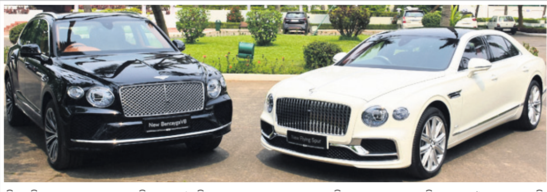
ବିଶ୍ୱର ବିକାସମୟ କାର୍ ମଧ୍ୟରୁ ବେଣ୍ଟଲି ଅନ୍ୟତମ । ଶନିବାର ଭୁବନେଶ୍ୱରରେ ଏହାର ରୁଲ୍ଡିଙ୍ଗ୍ ଉଦଘାଟନ କରାଯାଇଛି ।

ସୁନା ଆମଦାନୀର ହ୍ରାସର ପ୍ରମୁଖ କାରଣ ହେଉଛି ଦେଶର ନିଆଁର ଆମଦାନୀର ହ୍ରାସ । ଗତ ଏପ୍ରିଲରୁ ଫେବୃଆରୀ ମଧ୍ୟରେ ଦେଶର ବାଣିଜ୍ୟ ନିଆଁ ପରିମାଣ ୮୪.୬୨ ବିଲିୟନ ଡଲାରରୁ ହ୍ରାସ ପାଇଛି । ସେହିଭଳି ପୂର୍ବ ବର୍ଷ (୨୦୧୯-୨୦) ସେହି ସମୟରେ ୧୫୧.୩୭ ବିଲିୟନ ଡଲାର ରହିଥିଲା ।