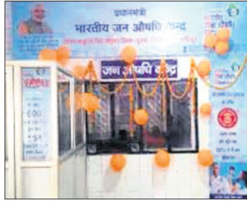
ଔଷଧ କେନ୍ଦ୍ର ଖୋଲିବାକୁ ମୋଦି ସରକାର ଲୋକଙ୍କୁ ପ୍ରୋତ୍ସାହିତ କରୁଛନ୍ତି । ବର୍ତ୍ତମାନ ଦେଶରେ ଜନ ଔଷଧ କେନ୍ଦ୍ର ଖୋଲିବା ଉପଲକ୍ଷେ ୭ କୋଟି ୬୦ ଲକ୍ଷ ଟଙ୍କା ପ୍ରୋତ୍ସାହିତ ରାଶି ମିଳିବ । ଯାହା ପୂର୍ବରୁ ଏହି ପ୍ରୋତ୍ସାହିତ ରାଶି ଅଡ଼େଇ ଲକ୍ଷ ଟଙ୍କା ରହିଥିଲା ।

ଭୁବନେଶ୍ୱର, ୨୧ମ : ଜନ ଔଷଧୀ ପାଇଁ ୭ କୋଟି ୬୦ ଲକ୍ଷ ଟଙ୍କା ପ୍ରୋତ୍ସାହିତ ରାଶି ମିଳିବ । ଯାହା ପୂର୍ବରୁ ଏହି ପ୍ରୋତ୍ସାହିତ ରାଶି ଅଡ଼େଇ ଲକ୍ଷ ଟଙ୍କା ରହିଥିଲା । ବର୍ତ୍ତମାନ ଦେଶରେ ଜନ ଔଷଧ କେନ୍ଦ୍ର ଖୋଲିବା ଉପଲକ୍ଷେ ୭ କୋଟି ୬୦ ଲକ୍ଷ ଟଙ୍କା ପ୍ରୋତ୍ସାହିତ ରାଶି ମିଳିବ । ଯାହା ପୂର୍ବରୁ ଏହି ପ୍ରୋତ୍ସାହିତ ରାଶି ଅଡ଼େଇ ଲକ୍ଷ ଟଙ୍କା ରହିଥିଲା । ବର୍ତ୍ତମାନ ଦେଶରେ ଜନ ଔଷଧ କେନ୍ଦ୍ର ଖୋଲିବା ଉପଲକ୍ଷେ ୭ କୋଟି ୬୦ ଲକ୍ଷ ଟଙ୍କା ପ୍ରୋତ୍ସାହିତ ରାଶି ମିଳିବ ।