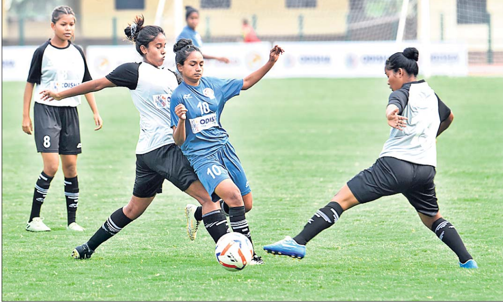
କ୍ରୀଡ଼ା ଛାତ୍ରାବାସ-ଓଡ଼ିଶା କ୍ଲବ୍ ମ୍ୟାଚ୍ରେ ଏକ ସଂଘର୍ଷପୂର୍ଣ୍ଣ ମୁହୂର୍ତ୍ତ ।