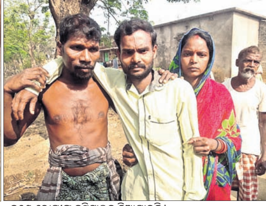
ଜଣେ ବୋଗୀକୁ ହସିବାକୁ ନିଆଯାଇଛି।