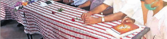
ବୈଠକରେ ଉପସ୍ଥାପିତ କାର୍ଯ୍ୟକର୍ମୀମାନେ।