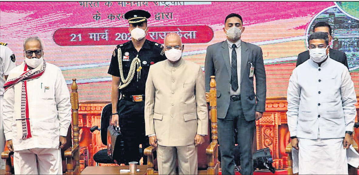
ରାଉରକେଲାଠାରେ ରବିବାର ସୁପର ହେଶିଆଲିଟି ହସ୍ପିଟାଲ ଓ ମେଡିକାଲ କଲେଜ ଲୋକାର୍ପଣ ଉତ୍ସବରେ ଉପସ୍ଥିତ ରାମନାଥ କୋବିନ୍ଦ (ମଝି)ଙ୍କ ସହ ରାଜ୍ୟପାଳ ପ୍ରଫେସର ଗଣେଶ ଲାଲ (ବାମ) ଏବଂ କେନ୍ଦ୍ର ପେଡ୍ରୋଲିୟମ ଓ ପ୍ରାକୃତିକ ବାଷ୍ପ ତଥା ଇସ୍ପାତ ମନ୍ତ୍ରୀ ଧର୍ମେନ୍ଦ୍ର ପ୍ରଧାନ ।