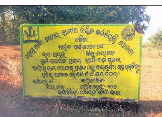
ବଡ଼ସରା ପଞ୍ଚାୟତ ଗୋପାଳପ୍ରସାଦ ରାସ୍ତା, ଲାଗିଥିବା କାର୍ଯ୍ୟ ବିବରଣୀ ଫଳକ

ନୟାଗଡ଼ ଅଧିକ, ୨୧୩୩ ଅଧୀର କରି ଗୋଷ୍ଠୀକ ବିରୋଧରେ କାର୍ଯ୍ୟାନୁଷ୍ଠାନ ଗ୍ରହଣ କରାଯିବ ବୋଲି ପିଡି ଡିଆରଡିଏ ସୁବାସ ଚନ୍ଦ୍ର ରାୟ କହିଛନ୍ତି।