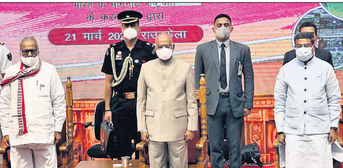
ରାଉରକେଲାଠାରେ ରବିବାର ସୁପର ହେଶିଆଲିଟି ହସ୍ପିଟାଲ ଓ ମେଡିକାଲ କଲେଜ ଲୋକାର୍ପଣ ଉତ୍ସବରେ ଉପସ୍ଥିତ ରାମନାଥ କୋବିନ୍ଦ (ମଝି)ଙ୍କ ସହ ରାଜ୍ୟପାଳ ପ୍ରଫେସର ଗଣେଶ ଲାଲ (ବାମ) ଏବଂ କେନ୍ଦ୍ର ପେଡ୍ରୋଲିୟମ ଓ ପ୍ରାକୃତିକ ବାଷ୍ପ ତଥା ଇସ୍ପାତ ମନ୍ତ୍ରୀ ଧର୍ମେନ୍ଦ୍ର ପ୍ରଧାନ ।

ରାଉରକେଲା ଅଧିକାରୀଙ୍କୁ ସୁପର ହେଶିଆଲିଟି ହସ୍ପିଟାଲ ଓ ମେଡିକାଲ କଲେଜ ଲୋକାର୍ପଣ ରାଉରକେଲାରେ ଆର୍ଏସ୍‌ପିର ସୁପର ହେଶିଆଲିଟି ହସ୍ପିଟାଲ ଓ ମେଡିକାଲ କଲେଜକୁ ରାଷ୍ଟ୍ରପତି ରାମନାଥ କୋବିନ୍ଦ ରବିବାର ଜାତି ଉଦ୍ଦେଶ୍ୟରେ ଲୋକାର୍ପଣ କରିଛନ୍ତି। ଉଦ୍ଦେଶ୍ୟରେ ଦେବାବେଳେ ସେ ରାଉରକେଲାକୁ ଏକତାର ସହର ବୋଲି ଅଭିହିତ କରିଛନ୍ତି। ପ୍ରାୟ ୩୫୫ କୋଟି ଟଙ୍କା ବ୍ୟୟ ଅଟକଳରେ ନିର୍ମିତ ୨୫୫ ଶଯ୍ୟା ବିଶିଷ୍ଟ ଏହି