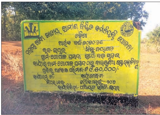
ବଡ଼ସରା ପଞ୍ଚାୟତ ଗୋପାଳପ୍ରସାଦ ରାସ୍ତା, ଲାଗିଥିବା କାର୍ଯ୍ୟ ବିବରଣୀ ଫଳକ ।