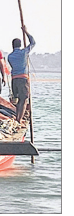
ମହାନଦୀରୁ ବିପଦପୂର୍ଣ୍ଣ ଭାବେ ତଙ୍ଗାରେ ଶ୍ରମିକମାନେ ବାଲି ଭର୍ତ୍ତି କରି କୂଳକୁ ଆଣୁଛନ୍ତି।

କେନ୍ଦ୍ରାପଡ଼ା ଜିଲ୍ଲା ମହାନଦୀକୂଳରୁ କୂଳ ମହାନଦୀ, ଲୁଣା, ପାଇକା, ଗୋବରା ଆଦି ନଦୀ ରହିଛି। ଗଭୀର ନଦୀରେ ବୁଡି ଶ୍ରମିକମାନେ ପେଟ ପାଟଣା ପାଇଁ ନିଜ ଜୀବନକୁ ବାଜି ଲାଗାଇ ବାଲି ସଂଗ୍ରହ କରୁଛନ୍ତି। ସେମାନେ ପାଲି କରି ବାଲିଟି ସାହାଯ୍ୟରେ ବାଲି ଉଠାଇ ତଙ୍ଗାରେ ଭରିଥାନ୍ତି। ଏପରି ଶାଳୁ ଯନ୍ତ୍ର ଅନୁକ୍ରମ ପରିଶ୍ରମ କରିବା ପରେ ତଙ୍ଗାରେ ବାଲି ଭରି ହୋଇଥାଏ। ଏଭଳି ଦୈନିକ ୧୦ରୁ ୨୦ ତଙ୍ଗା ବାଲି ନେଇ ଯାତାୟତ କରିଥାଏ। ଅଭାବୀ ଶ୍ରମିକମାନେ ନିଜ ପରିବାରର ଗୁରୁତାର ମେଣ୍ଟାଇବାକୁ ଏହି ବିପଦପୂର୍ଣ୍ଣ କାମକୁ ଆପଣେଇଥାନ୍ତି। ସେହି ବାଲି ବିକ୍ରିରୁ ଯେଉଁ ଅର୍ଥ ମିଳେ ସେଥିରୁ ତଙ୍ଗା ଭଡା ଦିଆଯାଏ। ଅବଶିଷ୍ଟ