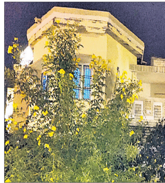
ବ୍ରହ୍ମପୁର ସହରରେ ଗାନ୍ଧିଜୀ ଅବସ୍ଥାନ କରିଥିବା 'ମଧୁ ମନ୍ଦିର'

ମାର୍ଚ୍ଚ ୨୫ ରାତିରେ ଟ୍ରେନ୍‌ରେ ଗାନ୍ଧି ଗୋପବନ୍ଧୁଙ୍କ ସାଥରେ ଧରି ଭଦ୍ରକରୁ ପୁରୀ ଅଭିମୁଖେ ବାହାରିଲେ। ମାର୍ଚ୍ଚ ୨୬ ସକାଳେ ପ୍ରଥମେ ପହଞ୍ଚିଲେ ସତ୍ୟବାଦୀରେ। ସତ୍ୟବାଦୀର ଅଭିନବ ପୁଲ୍‌କାଶି ଶିକ୍ଷାୟତନ ତାଙ୍କୁ ଗଭୀର ଭାବେ ପ୍ରଭାବିତ କରିଥିଲା। ଅପରାହ୍ଣରେ ସାକ୍ଷୀଗୋପାଳ ଦର୍ଶନ ସାହି ଗାନ୍ଧି ଶ୍ରୀକ୍ଷେତ୍ର ଅଭିମୁଖେ ବାହାରିଥିଲେ। ପୁରୀଧାମକୁ ଏହାଥିଲା ତାଙ୍କର ପ୍ରଥମ ଗସ୍ତ। ସେହିଦିନ ସନ୍ଧ୍ୟାରେ ଶରଧା ବାଲିରେ ଏକ ସଭାରେ ଯୋଗଦେଇଥିଲେ ଗାନ୍ଧି।