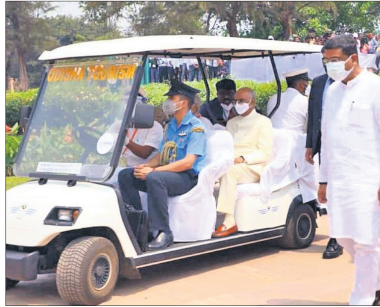
ରାଷ୍ଟ୍ରପତି ବ୍ୟାଚେରିଟାଳିତ ଗାଡ଼ିରେ ବସି କୋଣାର୍କ ସୂର୍ଯ୍ୟମନ୍ଦିର ପରିସର ବୁଲି ଦେଖୁଛନ୍ତି ।