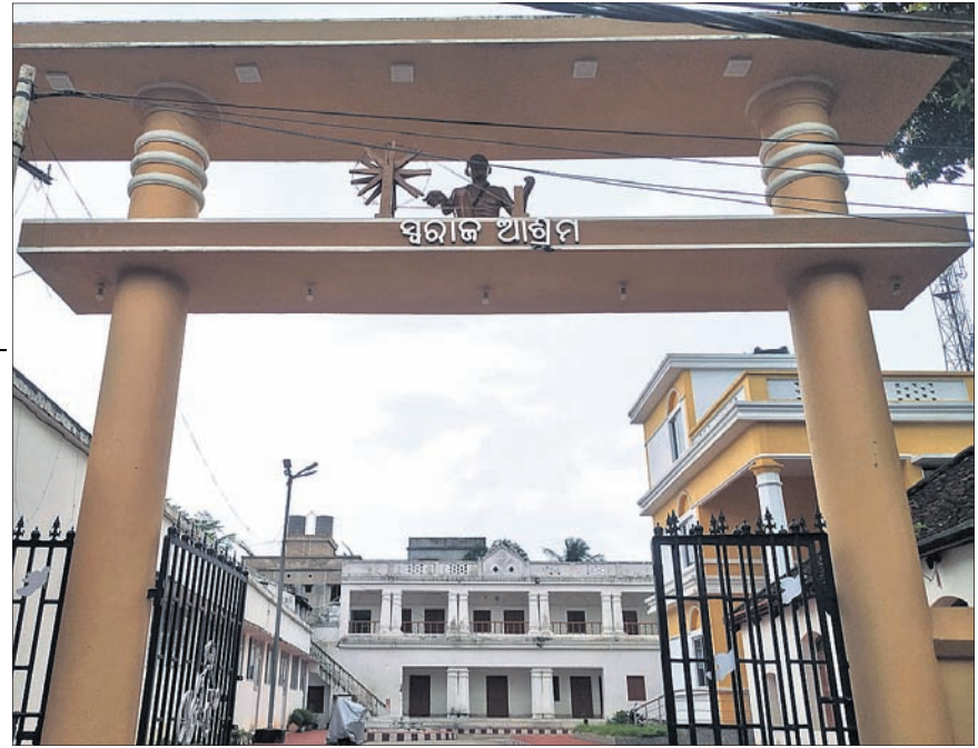
କଟକସ୍ଥିତ ସ୍ୱରାଜ ଆଗ୍ରମ