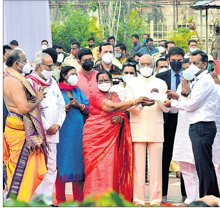
ଶ୍ରୀମନ୍ଦିର ପରିକ୍ରମା ଯୋଜନା ପାଇଁ ରାଷ୍ଟ୍ରପତି ଓ ତାଙ୍କ ସହଧର୍ମିଣୀ ୧ ଲକ୍ଷ ଟଙ୍କାର ଚେକ ପ୍ରଦାନ କରୁଛନ୍ତି ।