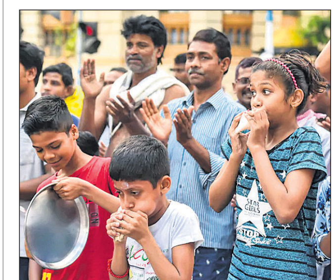
୨୦୨୦ ମାର୍ଚ୍ଚ ୨୨ ଜନତା କର୍ମ୍ୟୁ ପରେ ଅପରାହ୍ଣରେ ଲୋକେ ଘର ବାହାରେ ଚାଲି ଓ ଆଳି ବଜାଇଛନ୍ତି।

ଖାଦ୍ୟଶାସ୍ତ୍ର ଗଢ଼ିତ ରଖିବା ପାଇଁ ଥିବା ଏକ ତ୍ରମ୍ପରେ ପସି ୫ ଶିଶୁଙ୍କ ଜୀବନ ଯାଇଛି। ରାଜସ୍ଥାନର ବିକାଶରେ ଲିଲା ଯତ୍ନରେ ହିନ୍ଦୁସାନ ଗ୍ରାମରେ ଏହି ଚିତ୍ତହତାକର ଘଟଣା ଘଟିଛି।