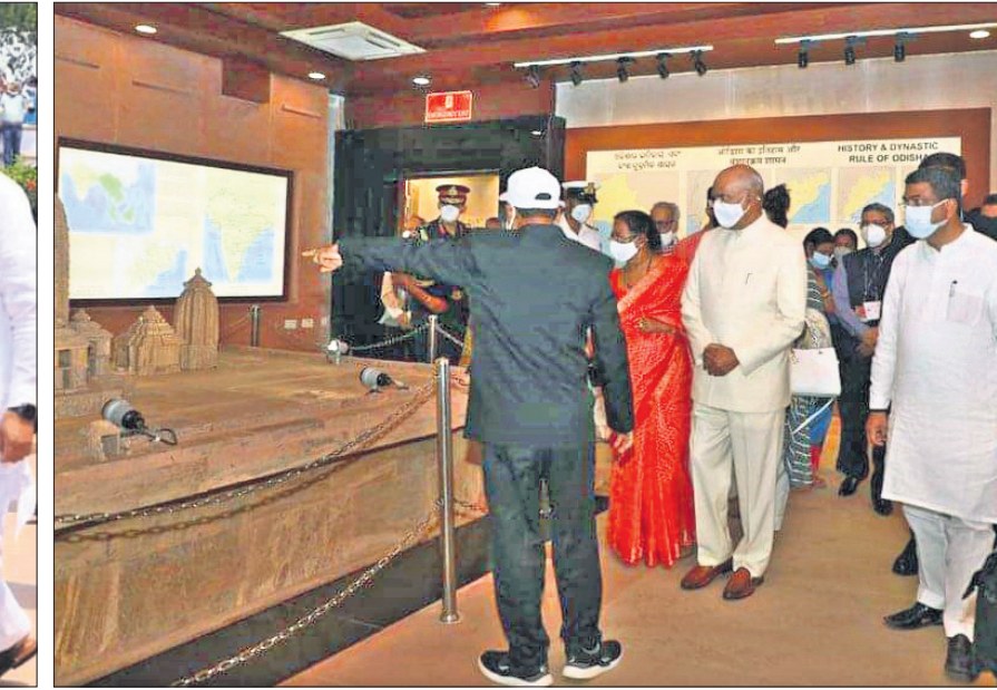
ରାଷ୍ଟ୍ରପତି ରାମନାଥ କୋବିନ୍ଦ ଓ କେନ୍ଦ୍ରମନ୍ତ୍ରୀ ଧର୍ମେନ୍ଦ୍ର ପ୍ରଧାନ ବ୍ୟାଖ୍ୟାନ କେନ୍ଦ୍ର ବୁଲି ଦେଖୁଛନ୍ତି ।