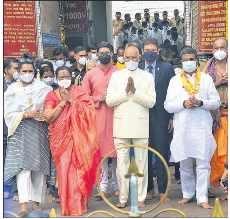
ମହାପ୍ରଭୁଙ୍କ ଦର୍ଶନ ସାରି ଫେରିବା ପରେ ଶ୍ରୀମନ୍ଦିର ସମ୍ମୁଖରେ ରାଷ୍ଟ୍ରପତି, ତାଙ୍କ ସହଧର୍ମିଣୀ ଏବଂ କେନ୍ଦ୍ରମନ୍ତ୍ରୀ ଧର୍ମେନ୍ଦ୍ର ପ୍ରଧାନ ।