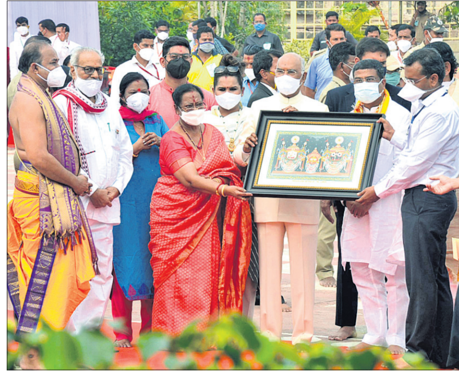
ରାଷ୍ଟ୍ରପତି ରାମନାଥ କୋବିନ୍ଦଙ୍କୁ ପ୍ରଶାସନ ପକ୍ଷରୁ ଶ୍ରୀମନ୍ଦିର ମୁଖ୍ୟ ପ୍ରଶାସକ କ୍ରିଷ୍ଣନ କୁମାର ମହାପ୍ରଭୁଙ୍କ ନାଗାର୍ଜୁନ ବେଶର ପତ୍ରିତ୍ର ପ୍ରଦାନ କରୁଛନ୍ତି ।