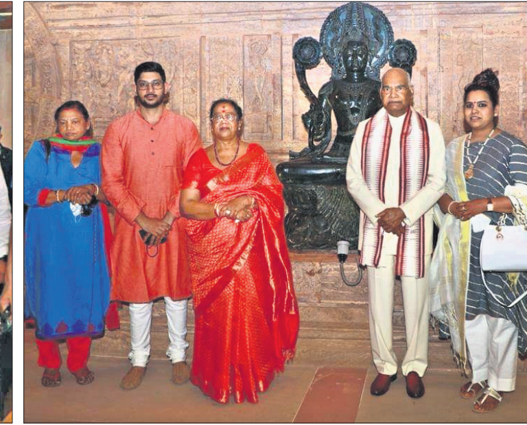
ସହଧର୍ମିଣୀ ସବିତା କୋବିନ୍ଦ ଓ ସମ୍ପର୍କୀୟଙ୍କ ସହ ରାଷ୍ଟ୍ରପତି ।