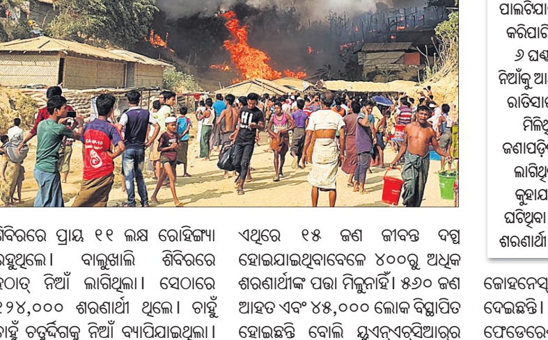
ଶିବିରରେ ପ୍ରାୟ ୧୧ ଲକ୍ଷ ରୋହିଙ୍ଗା ରହୁଥିଲେ। ବାଲୁଖାଲି ଶିବିରରେ ହଠାତ୍ ନିଆଁ ଲାଗିଥିଲା। ସେଠାରେ ୧୨୪,୦୦୦ ଶରଣାର୍ଥୀ ଥିଲେ। ଚାହିଁ ଚାହିଁ ଚତୁର୍ଦ୍ଦିଗକୁ ନିଆଁ ବ୍ୟାପିଯାଇଥିଲା।

ବାଂଲାଦେଶର କୋହବାଜାରରେ ରୋହିଙ୍ଗା ଶରଣାର୍ଥୀ ଶିବିରରେ ସୋମନାଥର ଭାଷଣ ଅଗ୍ରକାଣ୍ଡ ଘଟିଛି। ଏଥିରେ ଅନୁମତ ୧୫ ଜଣଙ୍କ ମୃତ୍ୟୁ ଘଟିଥିବାବେଳେ ୪୦୦ରୁ ଊର୍ଦ୍ଧ୍ୱ ନିଖୋଜ ହୋଇଯାଇଥିବା ଜାତିସଂଘ ଶରଣାର୍ଥୀ ସଂସ୍ଥା ସ୍ୱୟନ୍-ସର୍ବିଆର୍ ପକ୍ଷରୁ ଜଣାଯାଇଛି। ନିଆଁରେ ୧ ହଜାରରୁ ଅଧିକ ଘର ଜଳିଯାଇଛି। ବାଂଲାଦେଶର ଦକ୍ଷିଣ ପୂର୍ବ ସହର କୋହବାଜାର ଶରଣାର୍ଥୀ