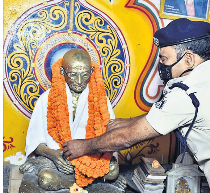
ସମ୍ବଲପୁର ଭଡରା ଗାନ୍ଧୀ ମନ୍ଦିରର ପ୍ରତିମାରେ ମାଳ୍ୟାର୍ପଣ ।