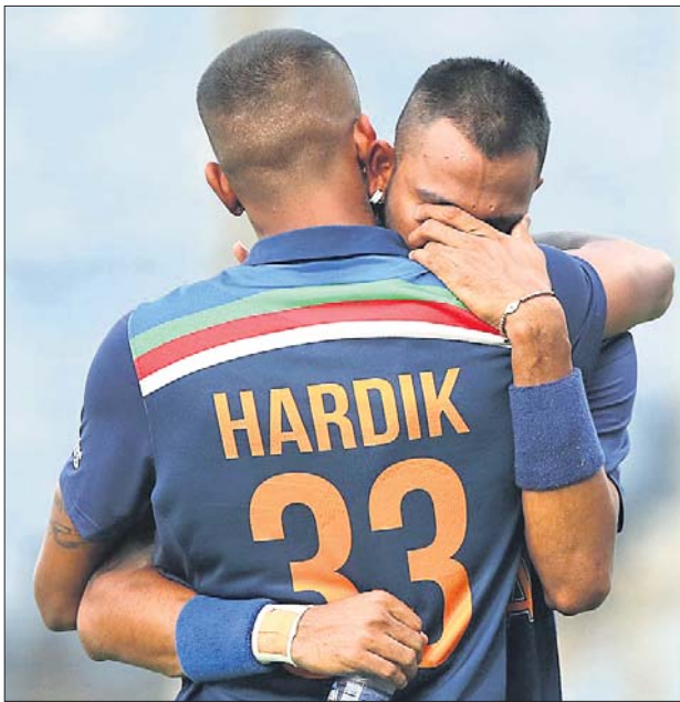
ପଦାର୍ପଣ ଏକଦିବସୀୟ କ୍ରିକେଟ ମ୍ୟାଚ୍ରେ ଦ୍ରୁତ ଅର୍ଦ୍ଧଶତକ ହାସଲ କରିବା ପରେ ପିତାଙ୍କୁ ମନେପକାଇ ସାନଭାଇ ହାର୍ଡିକ୍ ପାଣ୍ଡାଙ୍କୁ ଆଲିଙ୍ଗନ କଲାବେଳେ କାଦିପକାଉଛନ୍ତି କୃନାଲ ପାଣ୍ଡା।