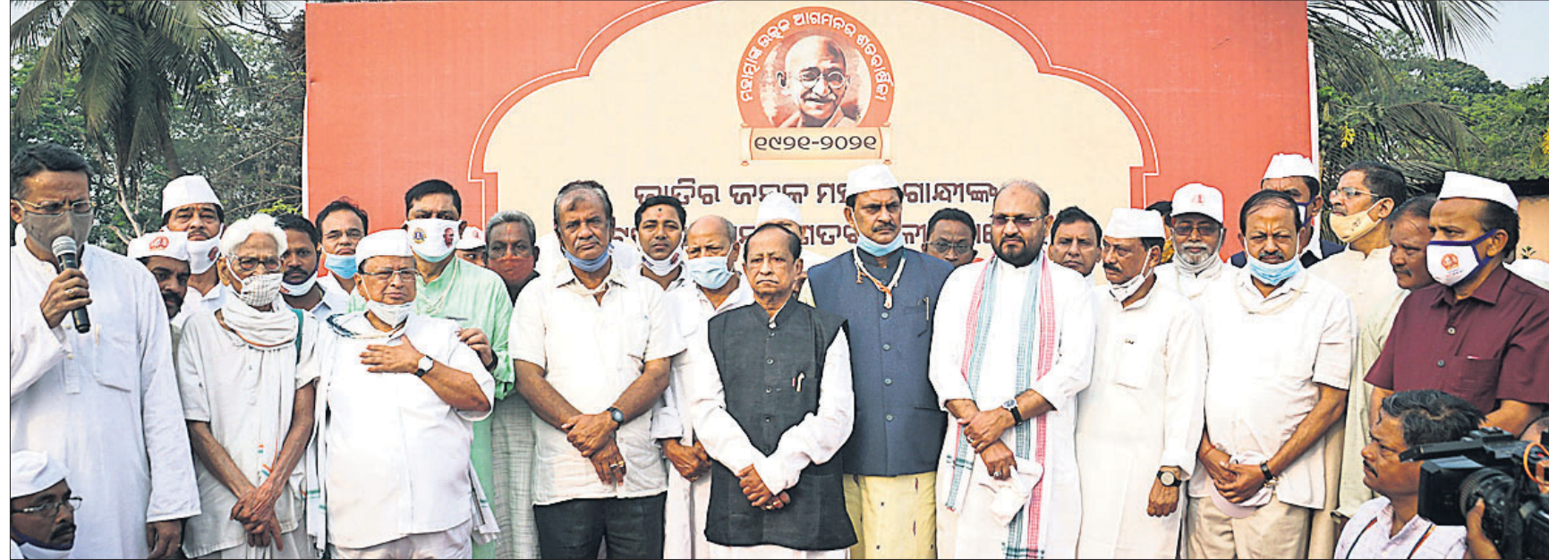
କଟକରେ ଅନୁଷ୍ଠିତ ଗାନ୍ଧୀଙ୍କ ଓଡ଼ିଶା ଆଗମନର ଶତବାର୍ଷିକୀ ଶୋଭାଯାତ୍ରାରେ ଯୋଗଦେଇଥିବା ବିଭିନ୍ନ ଦଳର ନେତୃବୃନ୍ଦ ସହ ବିଶିଷ୍ଟ ବ୍ୟକ୍ତିମାନେ ।