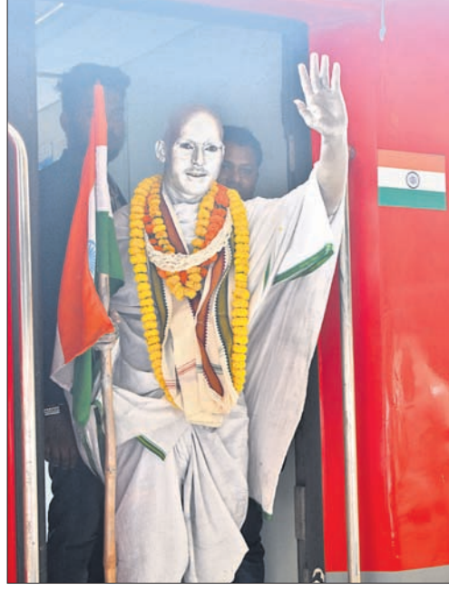
କୁବନେଶ୍ୱର ରେଳସ୍ଟେ ଷ୍ଟେଶନରେ ଗାନ୍ଧୀବେଶ୍ୟଧାରୀ ମୁକ୍ତ ।