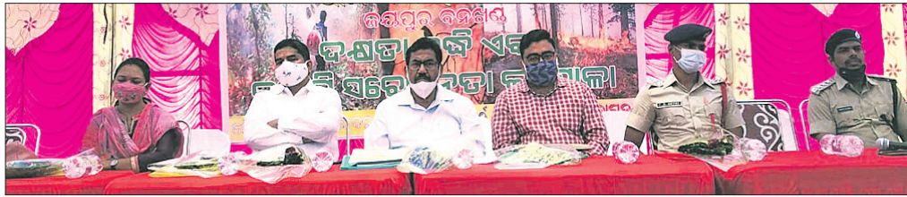
କାର୍ଯ୍ୟକ୍ରମରେ ମଞ୍ଚାସୀନ ଅତିଥିମାନେ।

ଜୟପୁର ବନଖଣ୍ଡ ଦ୍ୱାରା ଦକ୍ଷିଣ ବୃକ୍ଷ ତାଲିମ ପ୍ରଦାନ ଓ ବନାଗ୍ନି ସତରକ୍ଷା କାର୍ଯ୍ୟକ୍ରମ ଅନୁଷ୍ଠିତ ହୋଇଛି। ଜୟପୁର ବନାଞ୍ଚଳ ଅଧିକାଂଶ ଅଞ୍ଚଳରେ ଅନୁଷ୍ଠିତ କାର୍ଯ୍ୟକ୍ରମରେ ଜୟପୁର, ବୋରିଗୁମ୍ଫା ଓ କୁନ୍ତୁରା ବନାଞ୍ଚଳ ଅଧିକାରୀ, ବନ କର୍ମଚାରୀ ଓ ଭିଏସଏସ୍ ମାନେ ଭଗବନ୍ତ ଥିଲେ।