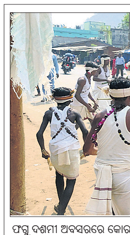
ଫସୁ ଦଶମୀ ଅବସରରେ କୋରାପୁଟ୍ ଜିଲ୍ଲା ବିଭାଗରେ ପୁରୁଣା ଜନକାତ ଲୋକ ପାରମ୍ପରିକ ଦକ୍ଷାଦର୍ଶନ ଯୁକ୍ତ କରୁଛନ୍ତି।