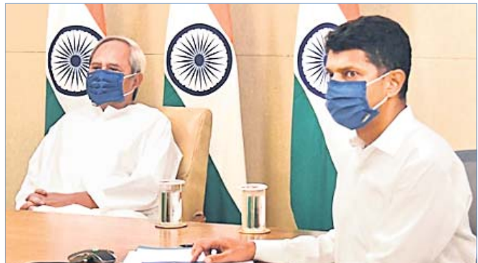
ସମାପ୍ତ ବୈଠକରେ ପୁଣ୍ୟମନ୍ତ୍ରୀ ଓ ୫-ଟି ସଭାପତି

ରାଜ୍ୟର ପାନୀୟଜଳ ଯୋଗାଣ ଛିଟି ସମ୍ପର୍କରେ ପୁଣ୍ୟମନ୍ତ୍ରୀ ନବୀନ ପଟ୍ଟନାୟକ ବୁଧବାର ସମାପ୍ତ କରିଛନ୍ତି। ସମସ୍ତ ଗ୍ରାମ ପଞ୍ଚାୟତ ଏବଂ ପୌରାଞ୍ଚଳ କର୍ତ୍ତୃପକ୍ଷ ପାନୀୟ ଜଳ ଯୋଗାଣ ନେଇ ଶତପ୍ରତିଶତ ପ୍ରସ୍ତୁତ ଅଛନ୍ତି ବୋଲି ପ୍ରମାଣପତ୍ର ଦେବା ଲାଗି ପୁଣ୍ୟମନ୍ତ୍ରୀ ନିର୍ଦ୍ଦେଶ ଦେଇଛନ୍ତି। ଚଳିତବର୍ଷ ଶୀଘ୍ର ଗ୍ରୀଷ୍ମପ୍ରବାହ ଆରମ୍ଭ ହୋଇଛି। ଅଧିକ ଗରମ ହେବା ଆଶଙ୍କା ରହିଛି। ତଦନୁଯାୟୀ ପ୍ରସ୍ତୁତି କରିବାକୁ ପଡ଼ିବ। ପାନୀୟ ଜଳ ସମସ୍ୟା ଥିବା ହ୍ରଦସ୍ଵର ଅଞ୍ଚଳଗୁଡ଼ିକୁ ଚିହ୍ନଟ କରି ତୁରନ୍ତ ପଦକ୍ଷେପ ଗ୍ରହଣ କରିବାକୁ ପୁଣ୍ୟମନ୍ତ୍ରୀ ପରାମର୍ଶ ଦେଇଛନ୍ତି।