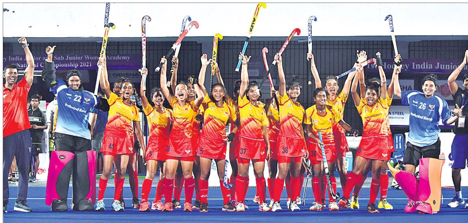
କଳିଙ୍ଗ ଷ୍ଟାଡ଼ିୟମରେ ଚାଲିଥିବା ଜାତୀୟ ଏକାଡେମୀ ମହିଳା ହକିର ସର୍ବୋତ୍ତମ ବିଭାଗ ଫାଇନାଲରେ ପ୍ରବେଶ କରିବାପରେ ଉତ୍ସାହରେ ଉଡ଼ିବା ନାଭାଳ ଟାଟା ହକି ହାଲ ପରମ୍ପରାକୁ ସେକ୍ସରର ଖେଳାଳିମାନେ।