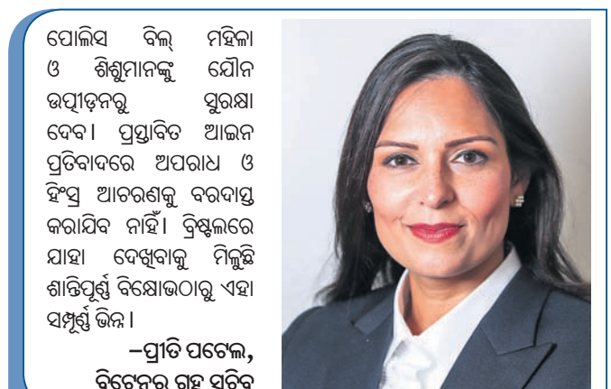
-ପ୍ରାଚି ପଟେଲ, ବ୍ରିଟେନର ଗୃହ ସଚିବ

କିଛି ମାସ ହେଲା ଯୁରୋପ ସାରା ବିଭିନ୍ନ ପ୍ରସଙ୍ଗରେ ବିରୋଧ ଓ ଆନ୍ଦୋଳନ ମୁଖ୍ୟ ଚଳିଛି। ଗତବର୍ଷ ଆମେରିକାକୁ ଆରମ୍ଭ ହୋଇଥିବା ବ୍ଲ୍ୟାକ୍ ଲାଇଭ୍‌ସ୍ ମ୍ୟାଚର ଆନ୍ଦୋଳନ ବିଭିନ୍ନ ଦେଶକୁ ବ୍ୟାପିଥିଲା। ସେହିପରି ଫ୍ରାନ୍ସରେ ପୁରୁଷ ଆଇନକୁ ନେଇ ବିବାଦ ହୋଇଥିଲା। ଲକ୍ଷଡ଼ାଉଁଟ୍ ବିରୋଧ କରି ସବୁଠି ବିରୋଧ ପ୍ରଦର୍ଶନ ଜାରି ରହିଛି। ପୋଲିସ୍ ଏହି ସବୁ ଗଣବିରୋଧକୁ କିପରି ପରିଚାଳନା କରିବ ତାହା ଏକ ବିବାଦୀୟ ବିଷୟ ହୋଇଛି। ବିଶେଷକରି କେତେକ ମାମଲାରେ ଅଧିକାରୀମାନେ ଅତି ଆକ୍ରମଣାତ୍ମକ ଭୂମିକା ନେଉଥିବା ଅଭିଯୋଗ ବଢ଼ିବାରେ ଲାଗିଛି। ବ୍ରିଟେନରେ ଆଇନର ଶାସନ ଓ ନାଗରିକ ସ୍ୱାଧୀନତାର ସୁରକ୍ଷାର ସମ୍ବଳନ ସହ କରୋନା କଟକଣା ଏଥିରେ ଆଉ ଏକ ପ୍ରଶ୍ନ ଯୋଡ଼ିଦେଇଛି। ନୂଆ ପୋଲିସ୍ ବିଲ୍‌କୁ ନେଇ ସବୁଠି କୋର୍ଟ ଧରିଛନ୍ତି।