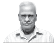
ନିମାଇଁ ଚରଣ ଲେଙ୍କା