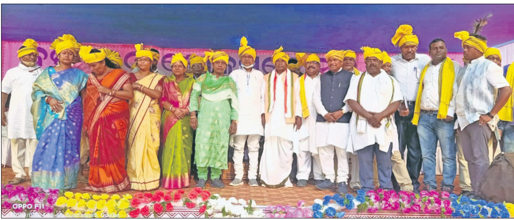
ମହୋତ୍ସବରେ ଯୋଗଦେଇଥିବା ଅତିଥିବୃନ୍ଦ ।