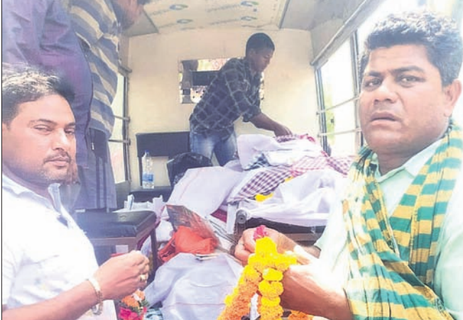
ମାଧପୁରଠାରେ ଶ୍ରଦ୍ଧାଞ୍ଜଳି ଦିଆଯାଇଛି ।