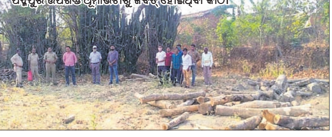
ପତ୍ନୀଙ୍କୁ ଉପଖଣ୍ଡ ଅଧୀନ ଚଢ଼ାଉ କରି ହୋଇଥିବା କାଠ ।

ସମ୍ବଲପୁର ଜିଲ୍ଲାର ଭିଜିଲିନ୍ (ଫରେଷ୍ଟ ଡିଭି) ଏବଂ ସ୍ଥାନୀୟ ବନ କର୍ମଚାରୀମାନେ ଗୁରୁବାର ପତ୍ନୀଙ୍କୁ ଉପଖଣ୍ଡ ଅଧୀନ ଡୋଲ୍‌ବନ୍ଧ ଗ୍ରାମରେ ଚଢ଼ାଉ କରି ବିପୁଳ ପରିମାଣର ମୂଲ୍ୟବାନ କାଠ ଜବତ କରିଛନ୍ତି । ଜବତ କାଠ ମଧ୍ୟରେ ୪.୦୭ ବିଏଫ୍‌ଟି ଶାଗୁଆନ, ୬.୬୦ ବିଏଫ୍‌ଟି ବିଜା ଏବଂ ୪.୬୦ ବିଏଫ୍‌ଟି ଅନ୍ୟ କାଠ ଜବତ ହୋଇଛି । ସେହିପରି ୨୫.୨୩ ବିଏଫ୍‌ଟି