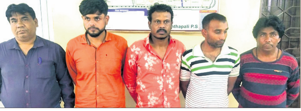
ଗିରଫ ଅଭିଯୁକ୍ତମାନେ ।

ବହୁ କଳକାରଖାନା ରହିଛି। ହେଲେ ଆଦିବାସୀ ଯୁବମାନଙ୍କୁ ନିଯୁକ୍ତି ନାହିଁ। ଶିଳ୍ପ ଉଦ୍ଦେଶ୍ୟରେ ଆଦିବାସୀଙ୍କୁ ଜମିକୁ ଜମି ମାଫିଆଳି କରିଆରେ ଶାଗମାଛ ଦରରେ କିଣାଦିବା ହେଉଛି। ଏ ଦିଗରେ ସରକାରଙ୍କ ଲାଗଣ ନାହିଁ। ଏସବୁ କ୍ଷେତ୍ରରେ ଆଦିବାସୀଙ୍କୁ ସରକାର ଅଣଦେଖା କରୁଛନ୍ତି। ଏଭଳି ପରିସ୍ଥିତି ଯଦି ଆଗକୁ ଜାରି ରହେ ତେବେ ରାଜ୍ୟରେ ଆଦିବାସୀ ଆନ୍ଦୋଳନ ଚେଳିବ ବୋଲି ସେ ଚେତାବନୀ ଦେଇଛନ୍ତି। ଏହି ଅବସରରେ ବିଭିନ୍ନ ସଂସ୍କୃତିକ କାର୍ଯ୍ୟକ୍ରମ ପରିବେଷଣ ହୋଇଥିଲା। ଏଥିରେ ରାଜ୍ୟ ତଥା ରାଜ୍ୟ ସାହାଯ୍ୟ ସାମାଜିକ ସଂଗଠନର ଶତାଧିକ କର୍ମଚାରୀ ଯୋଗ ଦେଇଥିଲେ।