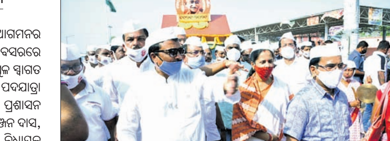
ପଦଯାତ୍ରାରେ ପ୍ରଶାସନିକ ଅଧିକାରୀ, ଏନପି, ବିଧାୟକ ଓ ଅନ୍ୟମାନେ।

ମହାତ୍ମା ଗାନ୍ଧୀଙ୍କ ଭଦ୍ରକ ଆଶାକର୍ମୀ ଶତବାର୍ଷିକୀ ପାଳନ ଅବସରରେ ବାହାରିଥିବା ଗାନ୍ଧୀ ରଥକୁ ବିପୁଳ ସ୍ଵାଗତ କରାଯାଇଥିବା ବେଳେ ସମୂହ ପଦଯାତ୍ରା ଅନୁଷ୍ଠିତ ହୋଇଯାଇଛି।