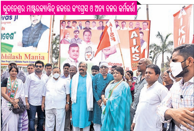
ଭୁବନେଶ୍ୱର ମାଷ୍ଟରକ୍ୟାଣ୍ଟିନ୍ ଛକରେ କଂଗ୍ରେସ ଓ ଅନ୍ୟ ଦଳର କର୍ମକର୍ତ୍ତା