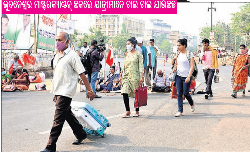
ଭୁବନେଶ୍ୱର ମାଷ୍ଟରକ୍ୟାଣ୍ଟିନ୍ ଛକରେ ଯାତ୍ରୀମାନେ ଚାଲି ଚାଲି ଯାଉଛନ୍ତି