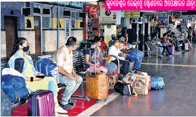
ଭୁବନେଶ୍ୱର ରେଲ୍ୱେ ଷ୍ଟେଶନରେ ଅପେକ୍ଷାରତ ଯାତ୍ରୀ