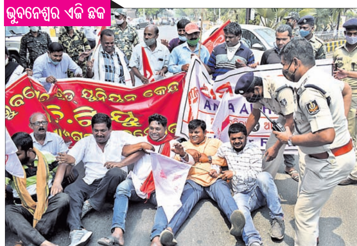
ଭୁବନେଶ୍ୱର ଏଜି ଛକ