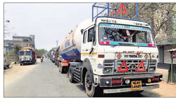
ବନ୍ଦ ପାଳନ ଯୋଗୁଁ ସୋନପୁର ରୁକ୍ଷ ଛକରେ ଯାନବାହନ ଅଟକି ରହିଛି (ବାମ) ।

କେନ୍ଦ୍ର ସରକାରଙ୍କ ମୁଖ୍ୟ ଶାନ୍ତି ପ୍ରତ୍ୟାଶା ପଦକ୍ଷେପରେ ସଂପୂର୍ଣ୍ଣ କିଷାନ ଫୋର୍ଟର ଆହ୍ଲାନ୍ କ୍ରମେ ଶୁକ୍ରବାର ଦିଆଯାଇଥିବା ଭାରତ ବନ୍ଦ ତାକରା ପ୍ରତ୍ୟାଶା ବରଗଡ଼ ଜିଲ୍ଲାରେ ପରିଲକ୍ଷିତ ହୋଇଥିଲା ।