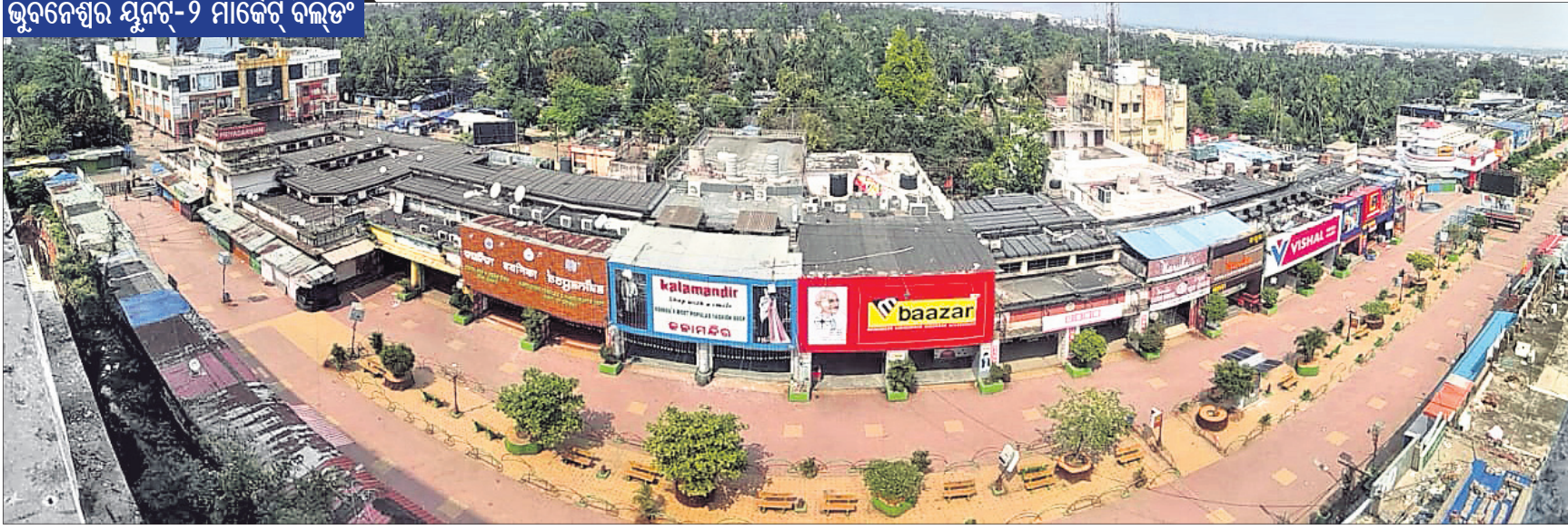
ଭୁବନେଶ୍ୱର ଯୁନିଟ୍-୨ ମାର୍କେଟ ବିଲ୍ଡିଂ