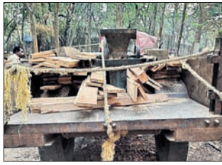
ବେଆଇନ କରତକଳ ଭାବରେ ଚଢ଼ାଇ

ଲୋକସଂହାର, ୨୭ମାର୍ଚ୍ଚ(ଡି.ଏନ.ଏ.): ବଲାଙ୍ଗୀର ଜିଲ୍ଲା ଲୋକସଂହାର ପଞ୍ଚମ ପର୍ଯ୍ୟନ୍ତ ଶୁକ୍ରବାର ପୂର୍ଣ୍ଣାହାର ନିର୍ଦ୍ଧାରଣ କରାଯାଇଛି ।