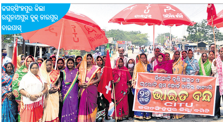
ରଘୁବିଂଶପୁର ଜିଲ୍ଲା ରଘୁନାଥପୁର ବ୍ଲକ୍ ଚାରପୁର ବାରପାଲ୍