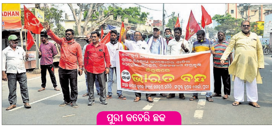
ପୁରୀ କଟରୋ ଛକ