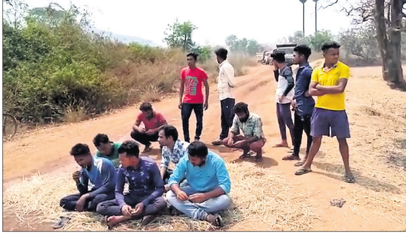
କୋଇଣ୍ଡାପାଲି ଗ୍ରାମବାସୀ ସୁକତେଲ ପ୍ରକଳ୍ପ ମାଟିରୁହା କାମକୁ ବିରୋଧ କରି ଧାରଣା ଦେଇଛନ୍ତି ।

ବଲାଙ୍ଗୀର ଅଧିକାରୀଙ୍କୁ କୋଇଣ୍ଡାପାଲି ଗ୍ରାମବାସୀ ବିରୋଧ କରିଛନ୍ତି । ପ୍ରକାଶ ଯେ, ଦୀର୍ଘ ଅଡ଼େଇ ବର୍ଷ ପରେ ବନ୍ଦ ପଡ଼ିଥିବା କୋଇଣ୍ଡାପାଲି ସୁକତେଲ ପ୍ରକଳ୍ପ