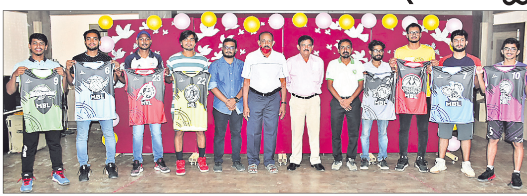
ଅତିଥିଙ୍କ ଉପସ୍ଥିତିରେ ଅଧିକାରୀମାନେ ଜର୍ସି ଉନ୍ମୋଚନ କରୁଛନ୍ତି।

ଭୁବନେଶ୍ୱର, ୨୬/୩(ଗ୍ରାହ୍ୟ ପ୍ରତିନିଧି) ମଦର୍ସ ବାସ୍କେଟବଲ ଲିଗ୍ରେ ୫ମ ସଂସ୍କରଣ ଚଳିତ ମାସ ୨୭ ତାରିଖରୁ ଆରମ୍ଭ ହେବ। ସ୍ଥାନୀୟ ଯୁନିଟ-୧ରୁ ମଦର୍ସ ପଦ୍ମ ଷ୍ଟାଲ ବାସ୍କେଟ ବଲ ପଡ଼ିଆରେ ଏହା ଏପ୍ରିଲ ୪ ପର୍ଯ୍ୟନ୍ତ ଚାଲିବ। ମଦର୍ସ ବାସ୍କେଟବଲ କ୍ଲବ ଓ ମଦର୍ସ ପଦ୍ମ ଷ୍ଟାଲ ମିଳିତ ଆନୁକୂଲ୍ୟରେ ହେବାକୁ ଯାଉଥିବା ପ୍ରତିଯୋଗିତାରେ ରାଜ୍ୟର ୪୪ ମହିଳା ଓ ୧୦୦ ପୁରୁଷ ପ୍ରତିଯୋଗୀ ଅଂଶଗ୍ରହଣ କରିବେ। ପଞ୍ଚାକ୍ଷର ମହିଳା ପ୍ରତିଯୋଗୀଙ୍କୁ ୪ ଦଳରେ ବିଭକ୍ତ କରାଯାଇଛି। ଦଳଗତରେ କର୍ମାଚକ ନାମ ତକର୍ସ, ଆଭେଞ୍ଜର୍ସ, ଓରିୟା ଓ ଯଜ୍ଞସ୍ତ୍ର ସଭାପତି। ସେହିପରି ପୁରୁଷ ବିଭାଗରେ ୮ ଦଳ ଖେଳିବାକୁ ନିଶ୍ଚିତ ହୋଇଛି। ଦଳଗତରେ ନାମ ତକର୍ସ, ହୁପର୍ସ, ସ୍ପାର୍ଟସ୍, ଆଭେଞ୍ଜର୍ସ, ଓରିୟା, ଭଲଭରିଟ୍, ଯଜ୍ଞସ୍ତ୍ର ଓ ସ୍ତ୍ରୀକର୍ମାଚକ ସଭାପତି। ବିଭିନ୍ନ ଦଳର ଖେଳାଳିଙ୍କ ପାଇଁ ଗତ ୨୦ ତାରିଖରେ ନିଲାମ ପ୍ରକ୍ରିୟା ଅନୁଷ୍ଠିତ ହୋଇଥିଲା ବୋଲି ଶୁକ୍ରବାର ଆୟୋଜିତ ଖବରଦାତା ସମ୍ମିଳନୀରେ ସକେତ ପତି ସୂଚନା ଦେଇଥିଲେ। ପୁରୁଷ ବର୍ଗରେ ନିଲାମ ପାଇଁ ୧୪୦୦ ଡଲ୍ଲର ଖେଳାଳି ନାମ ପଞ୍ଜୀକୃତ କରିଥିଲେ। ଗ୍ରାସକ ନିଆଯିବା ପରେ ସେମାନଙ୍କ ମଧ୍ୟରୁ ୧୦୦ ଖେଳାଳିଙ୍କୁ ନିଲାମ