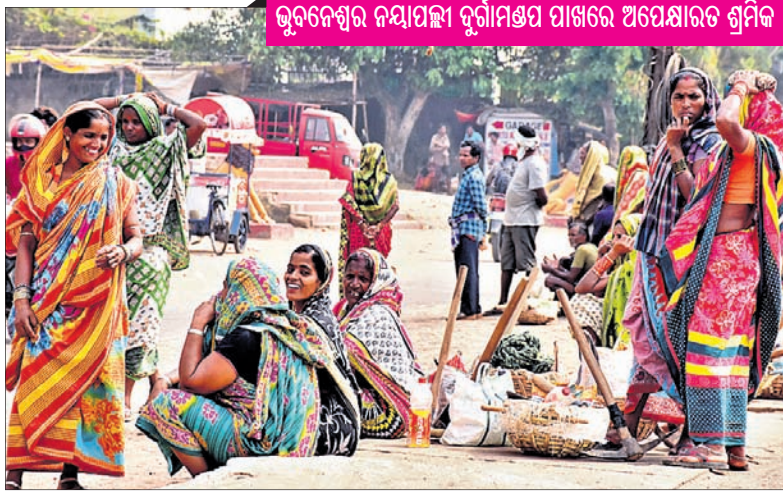
ଭୁବନେଶ୍ୱର ନୟାପଲ୍ଲୀ ଦୁର୍ଗାମଣ୍ଡପ ପାଖରେ ଅପେକ୍ଷାରତ ଶ୍ରମିକ