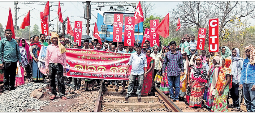
ଆନ୍ଦୋଳନକାରୀମାନେ ଚେନ୍ଦ୍ର ଅଟକାଇଛନ୍ତି।

ସୁନ୍ଦରଗଡ଼/ଲୁହଣୀପଡା/ବେଦବ୍ୟାସ, ୨୬/୩ (ଡି.ଏନ.ଏ.): ଭାରତ ବନ୍ଦର ପ୍ରଭାବ ସୁନ୍ଦରଗଡ଼ରେ ଆଂଶିକ ଭାବେ ପଡ଼ିଥିଲା। ଏହି ଆନ୍ଦୋଳନକୁ ସମର୍ଥନକରି ପ୍ରଦେଶ କଂଗ୍ରେସ କମିଟିର ନିର୍ଦ୍ଦେଶକ୍ରମେ ଜିଲ୍ଲା କଂଗ୍ରେସ କମିଟି ବିଭିନ୍ନ ସ୍ଥାନରେ ପିକେଟିଂ କରିବା ସହ ଶିଳ୍ପରା ବାଲପାସରେ ରାସ୍ତା ଅବରୋଧ କରି ବସ ରହିବାକୁ ଉତ୍ସାହ ପାଇଁ ପଦକ୍ଷେପ ଗ୍ରହଣ କରାଯାଇଥିଲା।