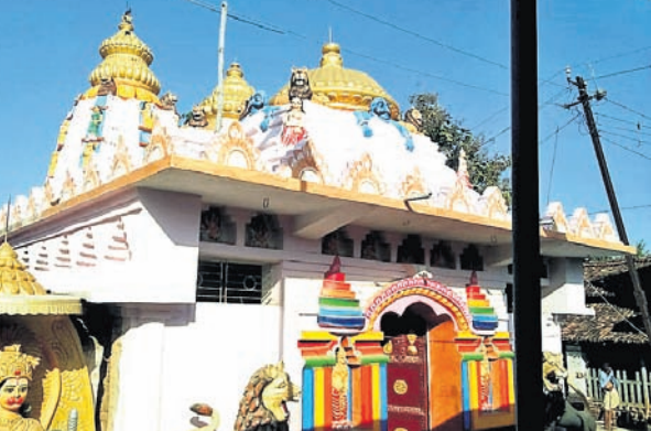
ସାଲେପାଲି ଗ୍ରାମରେ ନିର୍ମିତ ମନ୍ଦିର।