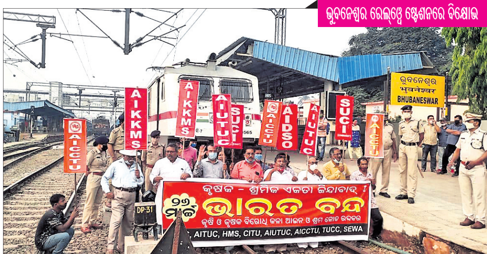
ଭୁବନେଶ୍ୱର ରେଲ୍ୱେ ଷ୍ଟେଶନରେ ବିକ୍ଷୋଭ