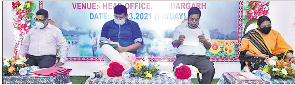
ସୁନ୍ଦରଗଡ଼ ଜିଲ୍ଲା କେନ୍ଦ୍ର ସମବାୟ ବ୍ୟାଙ୍କର ସାଧାରଣ ସଭା

ସୁନ୍ଦରଗଡ଼ ଜିଲ୍ଲା କେନ୍ଦ୍ର ସମବାୟ ବ୍ୟାଙ୍କର ୬୪ତମ ବାର୍ଷିକ ସାଧାରଣ ସଭା ଶୁକ୍ରବାର ମୁଖ୍ୟ କାର୍ଯ୍ୟାଳୟର ସମ୍ମିଳନୀ କକ୍ଷରେ ଅନୁଷ୍ଠିତ ହୋଇଯାଇଛି।