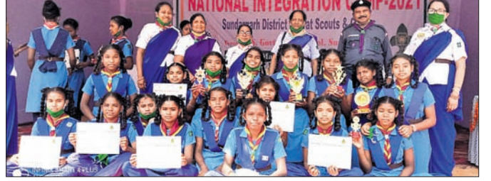
କୁତ୍ରା ସରକାରୀ ଉଚ୍ଚ ବିଦ୍ୟାଳୟର ଷ୍ଟାଉଟ ଦଳ।

ରାଜ୍ୟସ୍ତରୀୟ ଷ୍ଟାଉଟ ଗାଇଡ କାମ୍ପେରିରେ ପୁଣିଥରେ ସୁନ୍ଦରଗଡ଼ ଜିଲ୍ଲା କୁତ୍ରା ସରକାରୀ ଉଚ୍ଚ ବିଦ୍ୟାଳୟର ଷ୍ଟାଉଟ ଦଳ ଚମକାଇଛନ୍ତି।