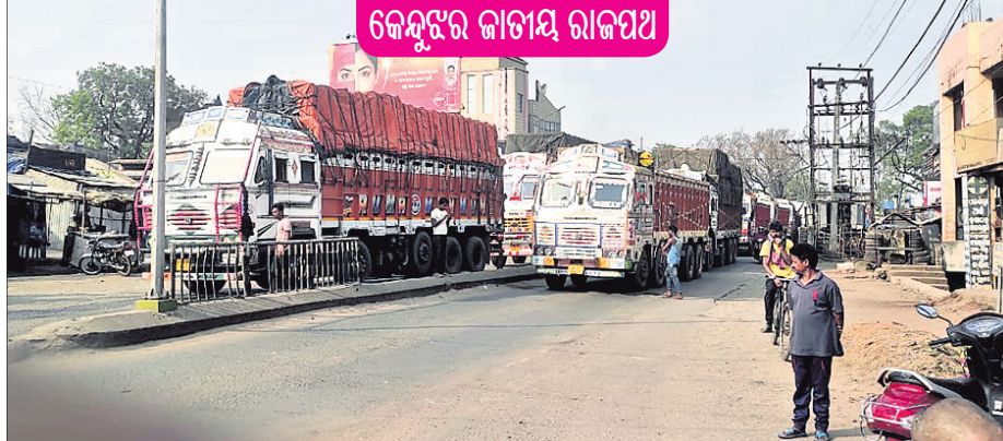
କେନ୍ଦୁଝର ଜାତୀୟ ରାଜପଥ