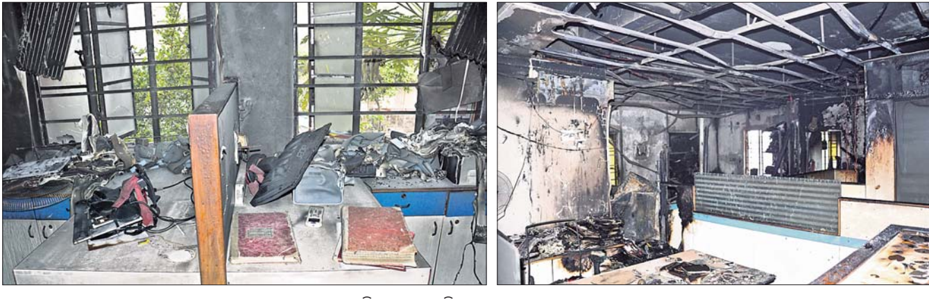
ଅଗ୍ନିକାଣ୍ଡରେ ପୋଡ଼ିଯାଇଥିବା ଆସବାବପତ୍ର।

ଗୁରୁବାର ରାତିରେ ହଠାତ୍ ନିଆଁ ଲାଗିଯାଇଥିଲା। ଏଥିରେ ସିଲି, ଏସି, କମ୍ପ୍ୟୁଟର ସମେତ ସମସ୍ତ ଆସବାବପତ୍ର ପୋଡ଼ିଯାଇଥିଲା। ପରେ ଏହି ନିଆଁ ନିକଟସ୍ଥ ଅନ୍ୟ କ୍ୟାମ୍ପରେ ଲାଗିଯାଇଥିଲା। ଏଥିରେ କ୍ୟାମ୍ପରୁ ଡିଜିଟାଲ ସିଲି ପୋଡ଼ିଯାଇଛି। କାରଣ ଅସ୍ପଷ୍ଟ ରହିଥିବାବେଳେ ବିଦ୍ୟୁତ୍ ଶର୍କଟରୁ ନିଆଁ ଲାଗିଥିବା ଅନୁମାନ କରାଯାଇଛି। ଏହି ବ୍ୟାଙ୍କ କାର୍ଯ୍ୟାଳୟ ନିକଟ ଅନ୍ୟ ଏକ ବିଲ୍ଡିଂରେ ରହୁଥିବା ଲୋକମାନେ ସୁଅଁ ବାହାରିଥିବା ବେଳେ ଶୁକ୍ରବାର ଏହି ନିଆଁ ନିକଟସ୍ଥ ଅନ୍ୟ କ୍ୟାମ୍ପରେ ଲାଗିଯାଇଥିଲା। ଅଗ୍ନିଶମ କର୍ମଚାରୀ କ୍ୟାମ୍ପରୁ ଡିଜିଟାଲ ସିଲି ପୋଡ଼ିଯାଇଛି। କାରଣ ଅସ୍ପଷ୍ଟ ରହିଥିବାବେଳେ ବିଦ୍ୟୁତ୍ ଶର୍କଟରୁ ନିଆଁ ଲାଗିଥିବା ଅନୁମାନ କରାଯାଇଛି। ଏହି ବ୍ୟାଙ୍କ କାର୍ଯ୍ୟାଳୟ ନିକଟ ଅନ୍ୟ ଏକ ବିଲ୍ଡିଂରେ ରହୁଥିବା ଲୋକମାନେ ସୁଅଁ ବାହାରିଥିବା ବେଳେ ଶୁକ୍ରବାର ଏହି ନିଆଁ ନିକଟସ୍ଥ ଅନ୍ୟ କ୍ୟାମ୍ପରେ ଲାଗିଯାଇଥିଲା। ଅଗ୍ନିଶମ କର୍ମଚାରୀ କ୍ୟାମ୍ପରୁ ଡିଜିଟାଲ ସିଲି ପୋଡ଼ିଯାଇଛି। କାରଣ ଅସ୍ପଷ୍ଟ ରହିଥିବାବେଳେ ବିଦ୍ୟୁତ୍ ଶର୍କଟରୁ ନିଆଁ ଲାଗିଥିବା ଅନୁମାନ କରାଯାଇଛି।