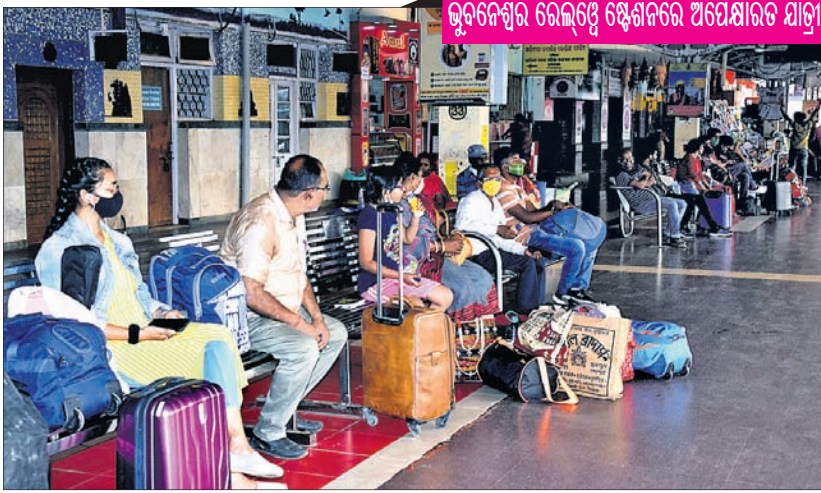
ଭୁବନେଶ୍ୱର ରେଲ୍ୱେ ଷ୍ଟେଶନରେ ଅଧେକ୍ଷାତର ଯାତ୍ରୀ