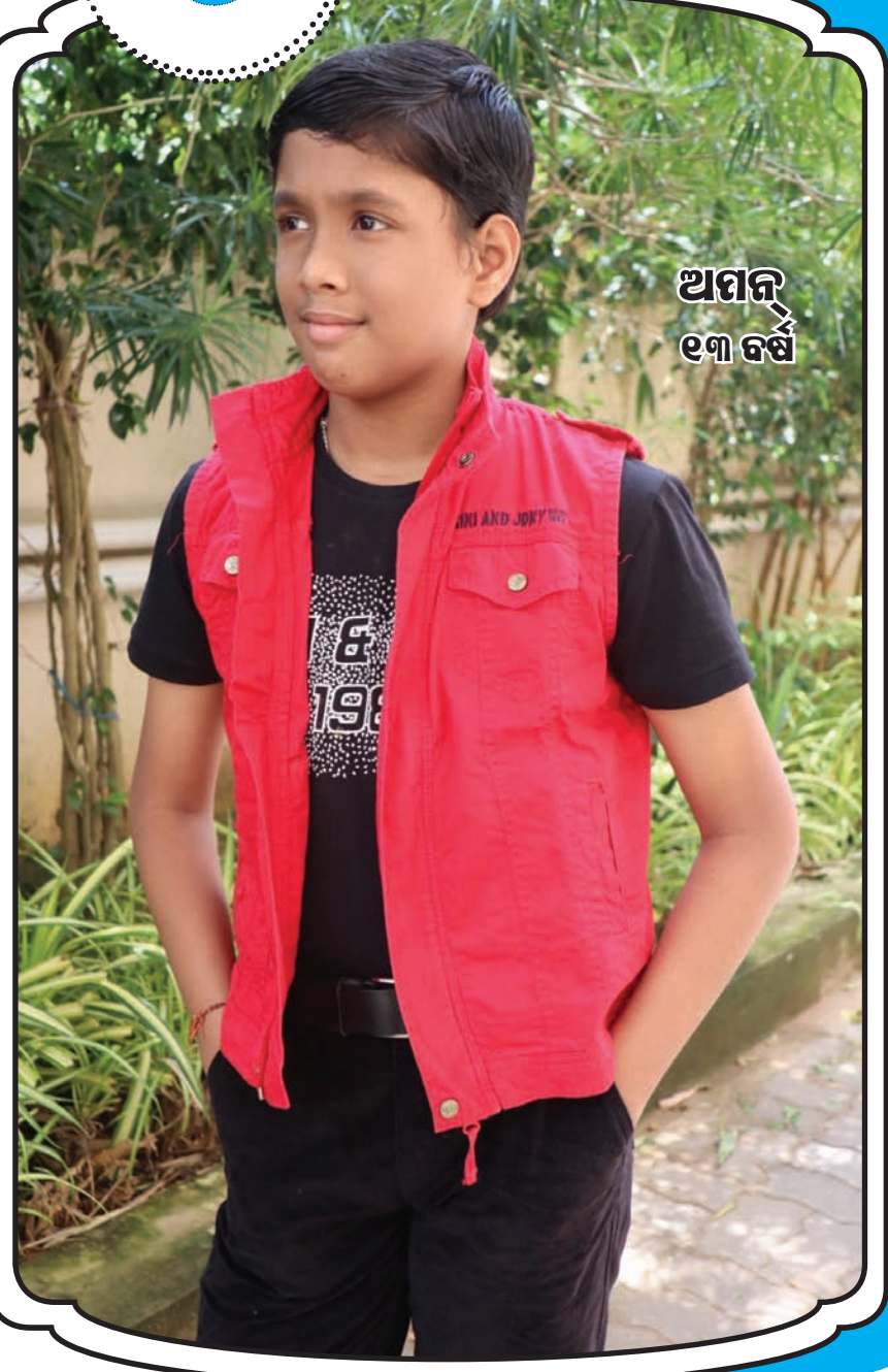
ଅମନ୍ ୧୩ ବର୍ଷ