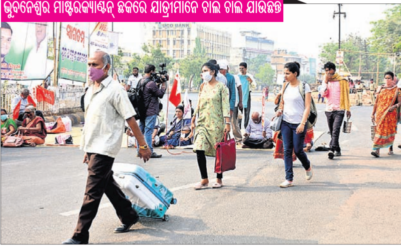
ଭୁବନେଶ୍ୱର ମାଷ୍ଟରକ୍ୟାଣ୍ଟିନ୍ ଛକରେ ଯାତ୍ରୀମାନେ ଚାଲି ଚାଲି ଯାଉଛନ୍ତି