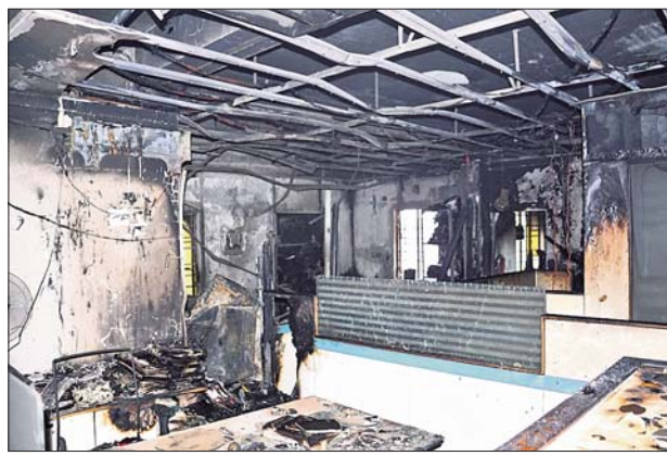
ଅଗ୍ନିକାଣ୍ଡରେ ପୋଡ଼ିଯାଇଥିବା ଆସବାବପତ୍ର।