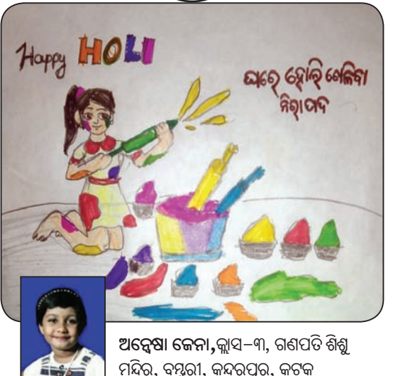
ଅଦୈକ୍ଷା ଜେନା, କ୍ଲାସ-୩, ଗଣପତି ଶିଶୁ ମନ୍ଦିର, ବସୁଦା, କଟକପୁର, କଟକ