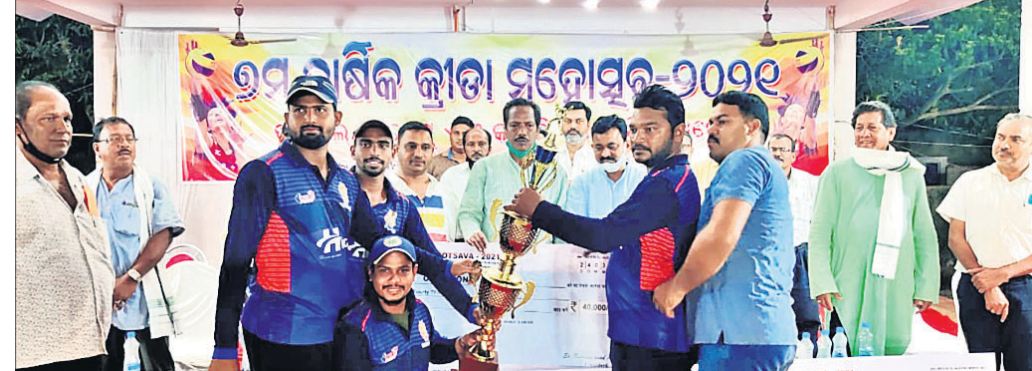
ଚୁଫି ସହ ଚାମ୍ପିୟନ କ୍ରିକେଟ ଦଳର ଖେଳାଳିମାନେ।