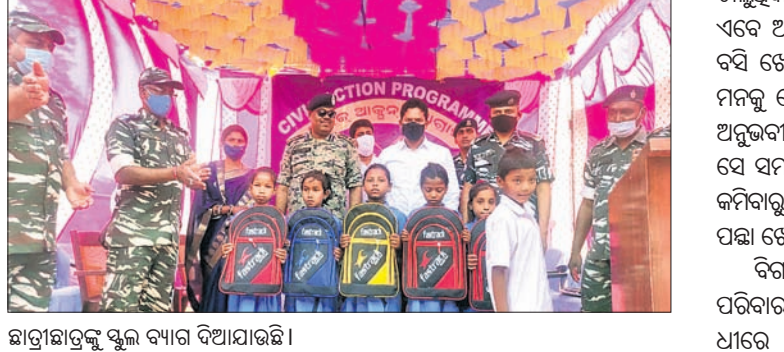
ହାତୀଛାତ୍ରଙ୍କୁ ସ୍କୁଲ ବ୍ୟାଗ ଦିଆଯାଇଛି ।

ପ୍ରତିବନ୍ଧକ ସାଜିଥିବା ସେମାନେ କହିଛନ୍ତି। ଏପରି ପରିସ୍ଥିତିରେ ଦୁଇ ଭାଇ ମା', ବାପାଙ୍କ ସହ ମିଶି ରୁଣାପୁର ଉପଜିଲ୍ଲାପାଳ ସେନାଳୟରେ ଉପସ୍ଥିତ ହୋଇ ସହାୟତା ଦାବି କରିଥିଲେ।