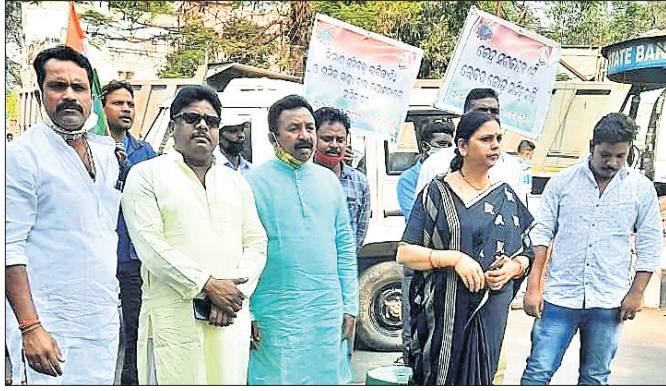
କୋରାପୁଟରେ କଂଗ୍ରେସ ସମର୍ଥନରେ ବନ୍ଦ ପାଳନ କରାଯାଇଛି ।

କୋରାପୁଟ/କନ୍ଧମୁର/ସେମିଲିଗୁଡ଼ା/ବୈପାରିଗୁଡ଼ା, ୨୬/୩(ବି.ପ୍ର./ସ.ପ୍ର./ଡି.ଏନ୍.ଏ.)