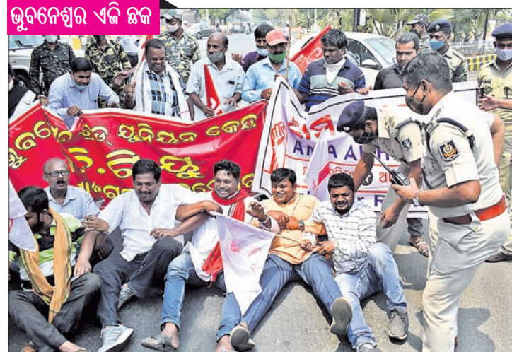
ଭୁବନେଶ୍ୱର ଏଜି ଛକ