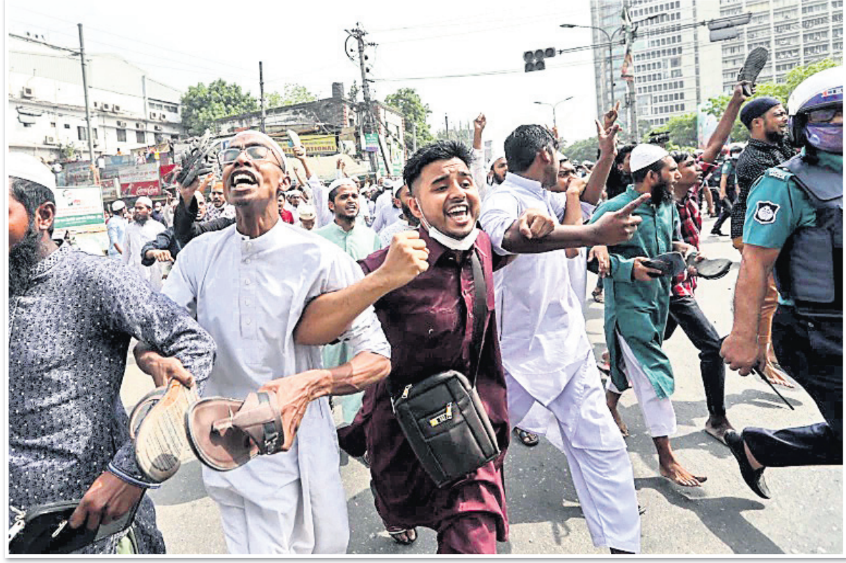
ଡାକାର ବୈଦୁଲ ମୋକରମ ମସଜିଦ୍ ବାହାରେ ବିକ୍ଷୋଭ ପ୍ରଦର୍ଶନ।