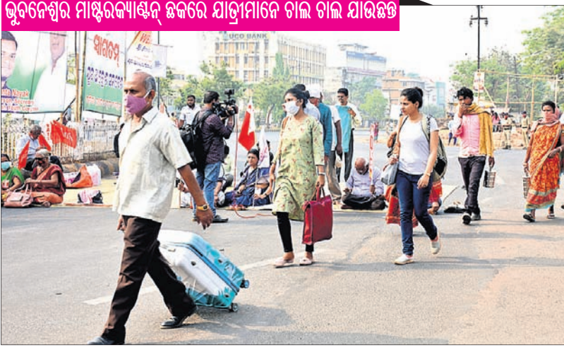
ଭୁବନେଶ୍ୱର ମାଷ୍ଟରକ୍ୟାଣ୍ଟିନ୍ ଛକରେ ଯାତ୍ରୀମାନେ ଚାଲି ଚାଲି ଯାଉଛନ୍ତି