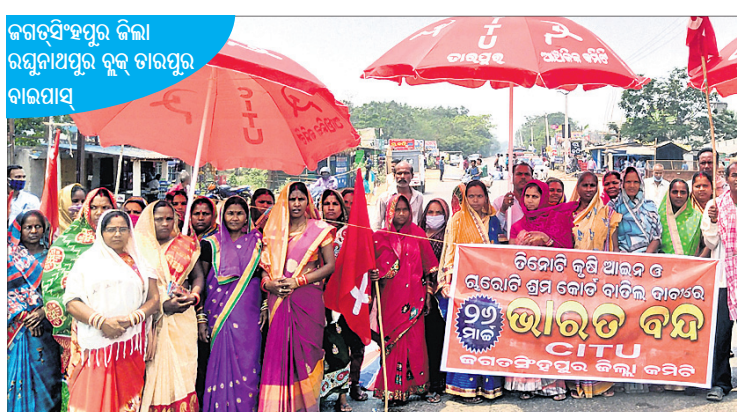
ରମାଦେବୀଂଶପୁର ଜିଲ୍ଲା ରାଜ୍ୟନାଥପୁର ବୁଦ୍ଧ ଚାରପୁର ବାରପାଲ୍