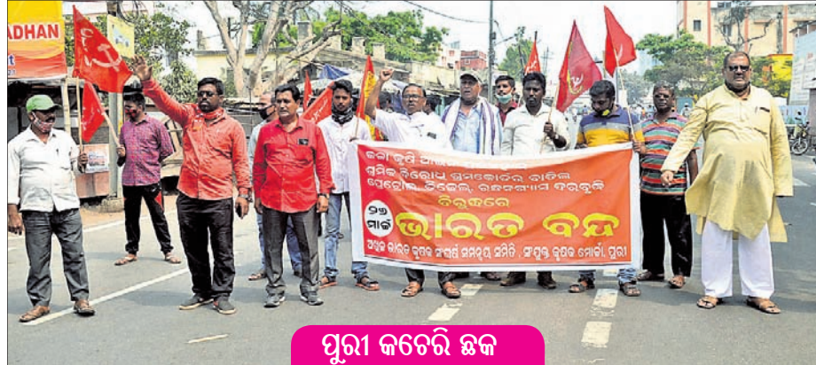
ପୁରୀ କଟରୋ ଛକ