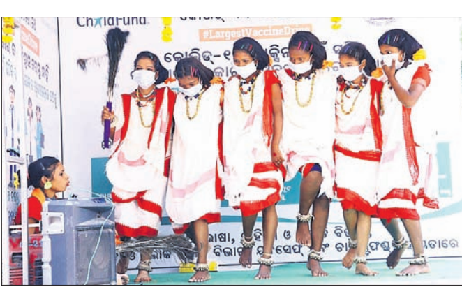
ଡକ୍ଟରିଆ ମହିଳାମାନେ ନୃତ୍ୟ ମାଧ୍ୟମରେ ସଚେତନ କରୁଛନ୍ତି ।

କରୋନା ବିଷୟରେ ଲୋକଙ୍କୁ ସଚେତନ କରିବା ନିମନ୍ତେ ଜିଲ୍ଲା ପ୍ରଶାସନ ପକ୍ଷରୁ 'ଚକା ଉପରେ ମଞ୍ଚ' କାର୍ଯ୍ୟକ୍ରମ ଆରମ୍ଭ ହୋଇଛି। ଏଥିରେ ଏକ ସଚେତନତା ରଥ ବିଭିନ୍ନ ଗାଁକୁ ଲୋକଙ୍କୁ ସଚେତନ କରିବ।