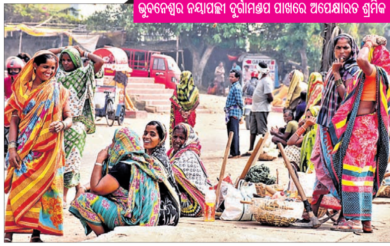
ଭୁବନେଶ୍ୱର ନୟାପଲ୍ଲୀ ଦୁର୍ଗାମଣ୍ଡପ ପାଖରେ ଅପେକ୍ଷାରତ ଶ୍ରମିକ