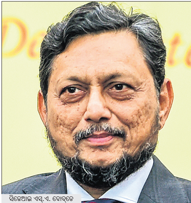
ସିଜେଆଇ ଏସ୍.ଏ. ବୋବ୍ଡେ

ଦେଶର ସବୁରୁ ବଡ଼ ଅଦାଲତକ ପ୍ରଦର୍ଶନ ସମ୍ପର୍କରେ ଜାଣିହେଉଛି। ନୂଆ ସିଜେଆଇଙ୍କ ଅପେକ୍ଷାରେ ୬୬,୭୨୭ରୁ ଅଧିକ ପ୍ରସଙ୍ଗ ବୃଦ୍ଧି ପାଇଥିବା ଏଥିରୁ ସ୍ପଷ୍ଟ ହୋଇଛି, ଯାହାକି ପୂର୍ବ ଚଳନାରେ ୧୦.୩୫% ଅଧିକ। ବିଶେଷକରି ଏହି ଅବଧି ମଧ୍ୟରେ ନିଉ କେସ୍ଗୁଡ଼ିକୁ ଅନୁଲୋଭନୀ ଶୁଣାଣି ପାଇଁ ଚାଲିକାଳୁ କରାଯାଇ ନ ଥିଲା। ବିଚାରାଧୀନ ଆସିବା ପୂର୍ବରୁ ସୋମବାର ଓ ଶୁକ୍ରବାର ପ୍ରତି ଖଣ୍ଡପାଠକ ନିକଟରେ ୫୦ରୁ୬୦ ନିଉକେସ୍ ଶୁଣାଣି ଚାଲିକାଳୁ କରାଯାଉଥିଲା। କିନ୍ତୁ ମହାମାରୀ ପରେ ଏହି ସଂଖ୍ୟା ୨୫-୩୫ରୁ ଖସିଆସିଥିଲା। ୧୯୯୦ ଦଶକ ପରେ ଏତେ ମାମଲା କେବେ ଗଢ଼ିଥିବା ଦେଖିବାକୁ ମିଳି ନ ଥିଲା। ୨୦୨୦ ମାର୍ଚ୍ଚ ୧୭ରେ ଗରୁଥିବା ମାମଲା ସଂଖ୍ୟା ୬୦,୪୬୯ ଥିଲା। ୧୨ ମାସରେ ଏଭଳି ୬,୨୫୮ ମାମଲା