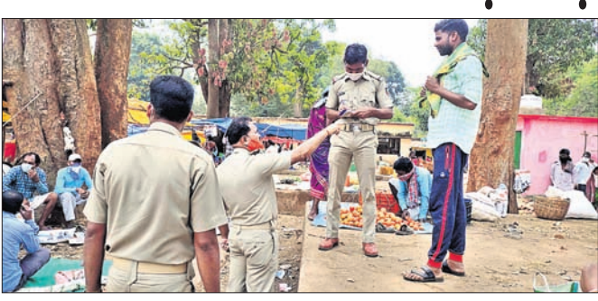
ଦଶମତରୁ ସାପ୍ତାହିକ ହାତରେ ପୋଲିସ୍ ସତରଞ୍ଜ କରୁଛି ।

ଦଶମତରୁ, ୨୬/୩ (ଡି.ଏନ୍.ଏ.) କୋରାପୁଟ ଜିଲ୍ଲା ଦଶମତରୁରୁ ପ୍ରଚାର କରାଯାଇଥିଲା। ଯେଉଁଠି ଗ୍ରାହକ ସାପ୍ତାହିକ ହାତରେ ଶୁକ୍ରବାର ପୋଲିସ୍ ସମ୍ପୂର୍ଣ୍ଣ ରକ୍ଷା କରି ନ ଥିବେ ଏବଂ ପକ୍ଷରୁ କରୋନା ନେଇ ଯାଅଁ କଡ଼ାକଡ଼ି କରାଯାଇଛି।