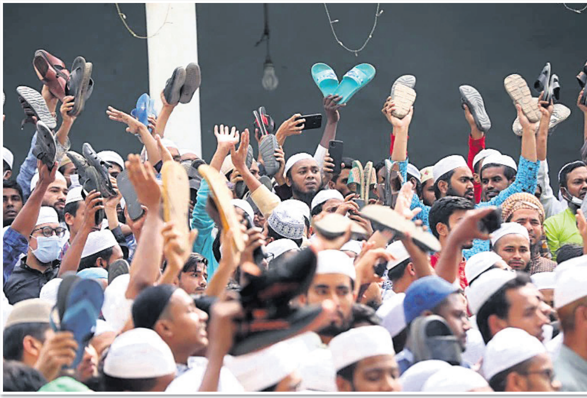
ବାଂଲାଦେଶ ରାଜଧାନୀ ଢାକାରେ ବିକ୍ଷୋଭକାରୀମାନେ ଜୋଡା ଧରି ପ୍ରଧାନମନ୍ତ୍ରୀ ନରେନ୍ଦ୍ର ମୋଦିଙ୍କ ଗସ୍ତକୁ ବିରୋଧ କରୁଛନ୍ତି।