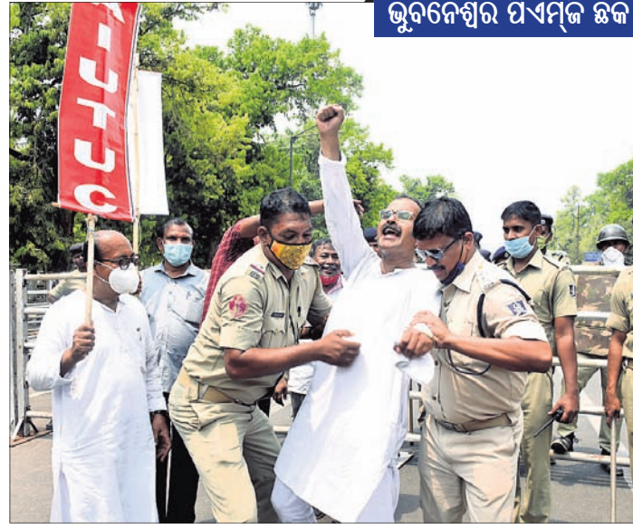
ଭୁବନେଶ୍ୱର ପିଏମଜି ଛକ