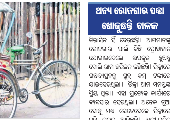
ଆଦରି ନେଇ ସମସ୍ତେ। ଏବେ ଲୋକେ ଗମନାଗମନ ପାଇଁ ଅଟୋ ଉପରେ ବିଶେଷ ନିର୍ଭର କରୁଛନ୍ତି।

ସମୟ ସ୍ରୋତରେ ହଜିଗଲାଣି ସାଇକେଲ ରିକ୍ସା ଏବଂ ଅନେକ ପ୍ରକାର ଉନ୍ନତ ଗାଡ଼ି ଗମନାଗମନ ପାଇଁ ଅଟୋ ଉପରେ ବିଶେଷ ନିର୍ଭର କରୁଛନ୍ତି। ରିକ୍ସା ଚଳାଇ ଫୁଁମୋର ଘର ଚଳାଉଥିଲେ। ପ୍ରତିଦିନ ୧୦ ରୁ ୧୫ ଗ୍ରାହକଙ୍କୁ ନେବା ଆଣିବା କରି ଦିନକୁ ୧୫୦ରୁ ୨୦୦ ଟଙ୍କା ରୋଜଗାର କରୁଥିଲେ।