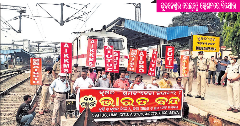
ଭୁବନେଶ୍ୱର ରେଲ୍ୱେ ଷ୍ଟେଶନରେ ବିକ୍ଷୋଭ