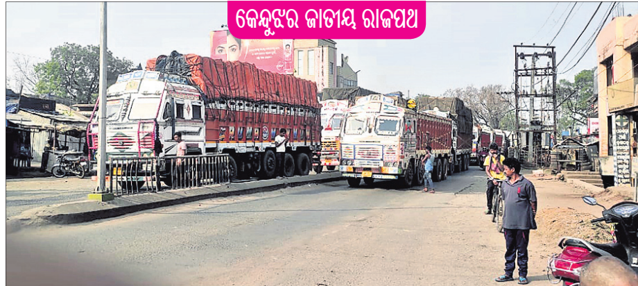
କେନ୍ଦୁଝର ଜାତୀୟ ରାଜପଥ