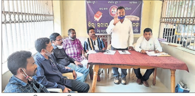
ଖବରଦାତା ସମ୍ମିଳନୀରେ ଉପସ୍ଥିତ ସଂଘ ସଦସ୍ୟମାନେ ।

ନବରଙ୍ଗପୁର ଜିଲ୍ଲା ଅନୁସୂଚିତ ଜାତି (ଏସ୍‌ସ୍‌ସ୍‌) ଯୁବସଂଘ ପକ୍ଷରୁ ଶୁକ୍ରବାର ସଂରକ୍ଷଣ ଏବଂ ବିଭିନ୍ନ ଦାବିନେଇ ଏକ ଖବରଦାତା ସମ୍ମିଳନୀ ସ୍ଥାନୀୟ ପିତୃସ୍ମୃତି ଆଇଡିଓରେ ଅନୁଷ୍ଠିତ ହୋଇଛି।