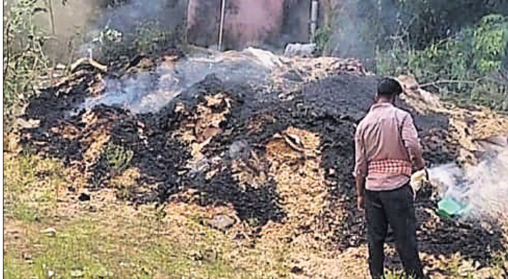
ପୋଡ଼ା ଯାଉଥିବା ରୁଡ଼ା ।

ବନ୍ୟା, ୩୦୩୩(ଡି.ଏନ.ଏ.) ଯାଜପୁର ଜିଲ୍ଲାର ବନ୍ୟା ବ୍ଲକ୍ ଏକ ବନ୍ୟା ବାଟ୍ୟା ପ୍ରଭାବିତ ଅଞ୍ଚଳ । ବିଭିନ୍ନ ସମୟରେ ଏଠି ପ୍ରାକୃତିକ ବିପର୍ଯ୍ୟୟ ଆସି ଲୋକଙ୍କର କ୍ଷତି କରିଥାଏ । ସେହି ଅନୁସାରେ ସରକାରଙ୍କ ପକ୍ଷରୁ ପ୍ରାକୃତିକ ବିପର୍ଯ୍ୟୟ ମୁକାବିଲା ପାଇଁ ରୁଡ଼ାଗୁଡ଼ିକ ମହକୁଦା ରଖାଯାଇଥାଏ । ବନ୍ୟାବାଟ୍ୟା ସମୟରେ ଏସବୁ ଲୋକଙ୍କୁ ବ୍ୟବହାର କରାଯାଏ । ତେବେ ପ୍ରଶାସନିକ ଅଧିକାରୀଙ୍କ ଦୂରଦୃଷ୍ଟି ଅଭାବ ଯୋଗୁ ବିପନ୍ନଙ୍କ ପାଇଁ ବନ୍ୟା ବ୍ଲକ୍ ଅଞ୍ଚଳକୁ ଆସିଥିବା ୨୦ କୁଇଣ୍ଟାଲ ରୁଡ଼ାକୁ ଶେଷରେ ପୋଡ଼ି ଦିଆଯାଇଛି । ୨୯ ତାରିଖ (ସୋମବାର)ସରକାରୀ ଛୁଟିଦିନରେ ବନ୍ୟା ବ୍ଲକ୍ ପ୍ରଶାସନ ପକ୍ଷରୁ ଏହି ରୁଡ଼ାକୁ ଗୋଦାମରୁ କଢ଼ାଯାଇ ନିଆଁ ଲଗାଇ ଦିଆଯାଇଛି । ଫଳରେ ଏହାକୁ ନେଇ ସାଧାରଣରେ ନାନା ଅସନ୍ତୋଷ ପ୍ରକାଶ ପାଇଛି । ପ୍ରଶ୍ନ ଉଠେ ବନ୍ୟା ପ୍ରଭାବିତ ଲୋକେ ନିରାଶ୍ରୟ