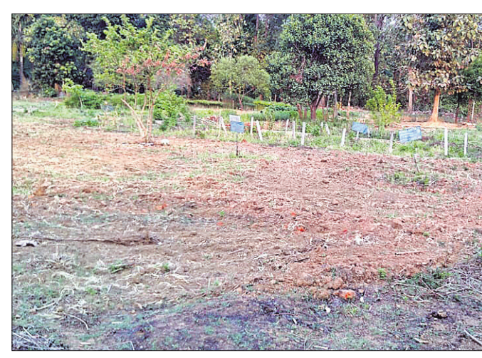
ଓଷଧୀୟ ଉଦ୍ୟାନ ପରିସରରେ ହଳ କରାଯାଇଥିବା ସ୍ଥାନ ।