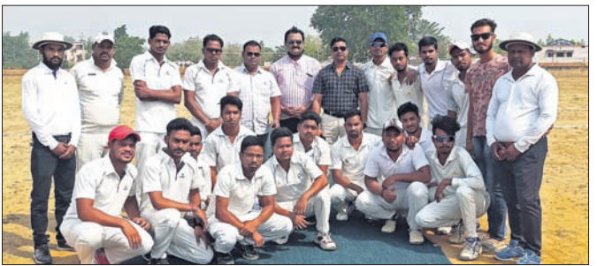
ଅଧିକାରୀଙ୍କ ସହ ଓଷଧି ଭିଜନରେ ।

ଭଲୁଣ୍ଡା, ୩୦।୩।(ଡି.ଏନ.ଏ.): ସୁବର୍ଣ୍ଣପୁର ଜିଲ୍ଲା ଭଲୁଣ୍ଡା ଅଞ୍ଚଳରେ ଓଷଧି ଭିଜନ କାର୍ଯ୍ୟକ୍ରମ ଆୟତ୍ତ ହେଉଛି ଏହି ସମ୍ବନ୍ଧରେ ଯୋଜନା କରାଯାଇଛି। ଭଲୁଣ୍ଡା ଅଞ୍ଚଳରେ ଓଷଧି ଭିଜନ କାର୍ଯ୍ୟକ୍ରମ ଆୟତ୍ତ ହେଉଛି ଏହି ସମ୍ବନ୍ଧରେ ଯୋଜନା କରାଯାଇଛି।