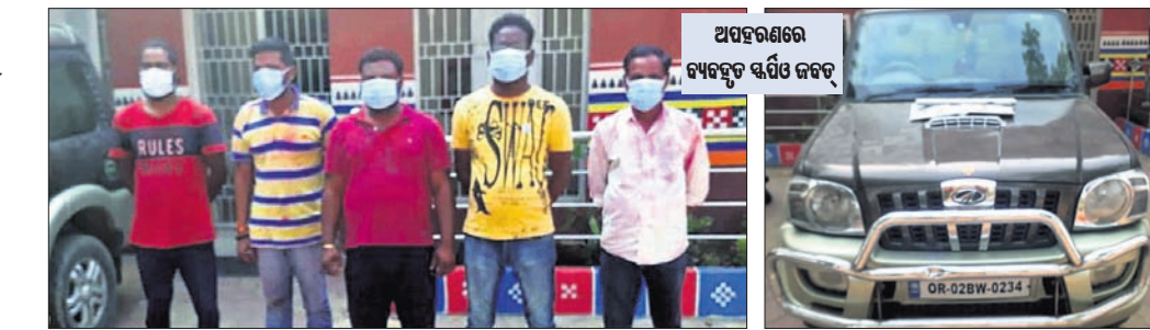
ଗିରଫ ୫ ଅଭିଯୁକ୍ତ ।

ବଲାଙ୍ଗୀର ଅଧିକାରୀ, ୩୦।୩।(ନି.ପ୍ର.): କିଛି ଦିନ ନିକଟରେ ପରେ ବଲାଙ୍ଗୀର ସହରରେ ପୁଣି ଥରେ ଘଟଣା ଘଟିଛି । ଅପହରଣ, ଡକାୟତି ଘଟଣାରେ ୫ ଗିରଫ ହୋଇଛି ଏହି ସମ୍ବନ୍ଧରେ ଯୋଜନା କରାଯାଇଛି।