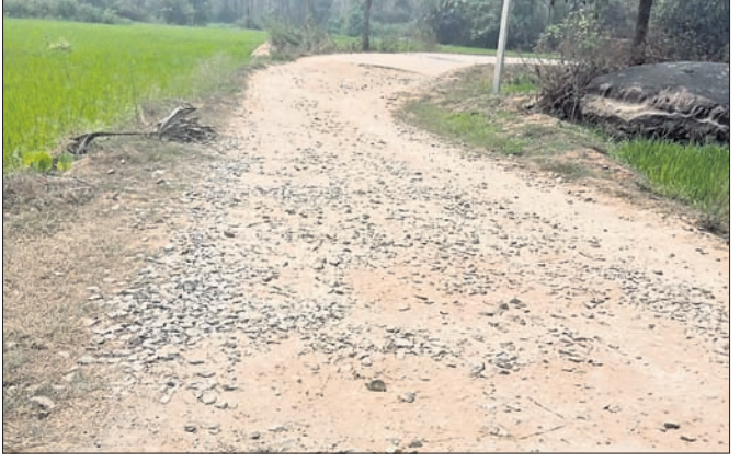
ଶୋଚନୀୟ ହୋଇ ପଡ଼ିଥିବା ରାସ୍ତା ।

ବିନିକା, ୩୦।୩।(ଡି.ଏନ.ଏ.): ସୁବର୍ଣ୍ଣପୁର ଜିଲ୍ଲା ବିନିକା ବ୍ଲକ୍ ଅନ୍ତର୍ଗତ ପଞ୍ଚାୟତ ଅଧିକାରୀଙ୍କ ସହ ପ୍ରଶାସନର ସମ୍ବନ୍ଧରେ ଯୋଜନା କରାଯାଇଛି। ସୁବର୍ଣ୍ଣପୁର ଜିଲ୍ଲା ବିନିକା ବ୍ଲକ୍ ଅନ୍ତର୍ଗତ ପଞ୍ଚାୟତ ଅଧିକାରୀଙ୍କ ସହ ପ୍ରଶାସନର ସମ୍ବନ୍ଧରେ ଯୋଜନା କରାଯାଇଛି।