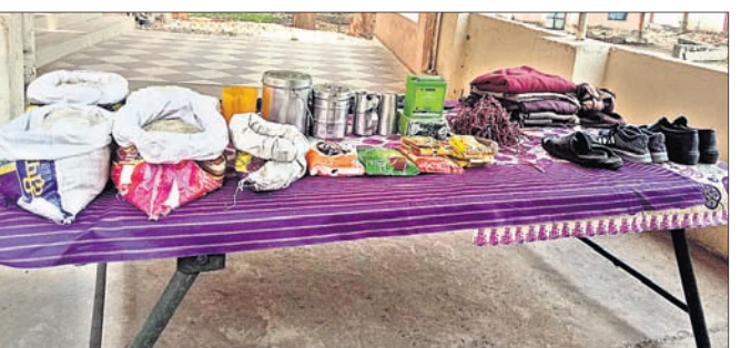
କବଚ ହୋଇଥିବା ମାଓବାଦୀଙ୍କ ବିଭିନ୍ନ ସାମଗ୍ରୀ।

କନ୍ଧମାଳ ଜିଲ୍ଲା ଫିଟିଙ୍ଗିଆ ବୁକ୍ ଗୋଷ୍ଠୀପତା ଅଞ୍ଚଳରେ ଦୁଇ ଯୋଲିସ-ମାଓବାଦୀଙ୍କ ମଧ୍ୟରେ ଗୁଳି ବିନିମୟ ହୋଇଛି।