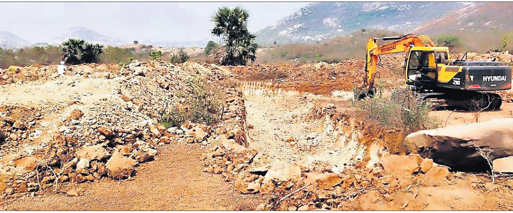
ଯାଜପୁର ଜିଲ୍ଲା ବକରାମପୁର ଗଡ଼ ସଂରକ୍ଷିତ ଜଙ୍ଗଲରେ ହାତୀଙ୍କ ପାଇଁ ଶ୍ରେଷ୍ଠ ଖୋଜାଗାଳିଛି।

ରାଜ୍ୟରେ ୨୦୧୦-୧୧ରୁ ୨୦୨୦-୨୧ ମାର୍ଚ୍ଚ ୨୨ ରୁ ୧୧ ବର୍ଷ ମଧ୍ୟରେ ୮୪୩ ହାତୀଙ୍କ ମୃତ୍ୟୁ ହୋଇଛି।