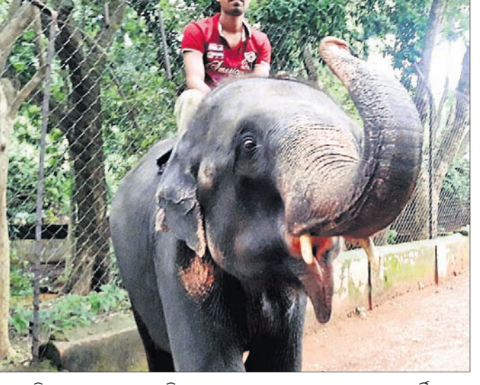
କପିଳାସ ପ୍ରାଣୀ ଉଦ୍ୟାନ ପରିସରରେ ରେବନ୍ୟୁ ସେକ୍ଟରରେ ଥିବା ଦକ୍ଷିଣା ଦିଗରେ କାନ୍ଥିକ।

୫ ହାତୀ ରହିଛନ୍ତି। ତନ୍ମଧ୍ୟରୁ ଦକ୍ଷିଣା ଦିଗରେ କାନ୍ଥିକକୁ ୨୦୧୦ ଜୁଲାଇ ୨ରେ କଟକ ଜିଲ୍ଲା ଆଠଗଡ଼ ଡିଭିଜନରୁ ଉଦ୍ଧାର କରି ଅଣାଯାଇଥିଲା।