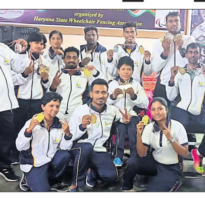
ପଦକ ବିଜୟୀ ଓଡ଼ିଶା ପ୍ରତିଯୋଗୀମାନେ।

ଓଡ଼ିଶା ଦଳର ଉପକ୍ରମକାରୀ ଭାବେ କାର୍ଯ୍ୟ କରିବାକୁ ସମର୍ଥନ ପାଇଛନ୍ତି। ଓଡ଼ିଶା ଦଳର ଉପକ୍ରମକାରୀ ଭାବେ କାର୍ଯ୍ୟ କରିବାକୁ ସମର୍ଥନ ପାଇଛନ୍ତି। ଓଡ଼ିଶା ଦଳର ଉପକ୍ରମକାରୀ ଭାବେ କାର୍ଯ୍ୟ କରିବାକୁ ସମର୍ଥନ ପାଇଛନ୍ତି।