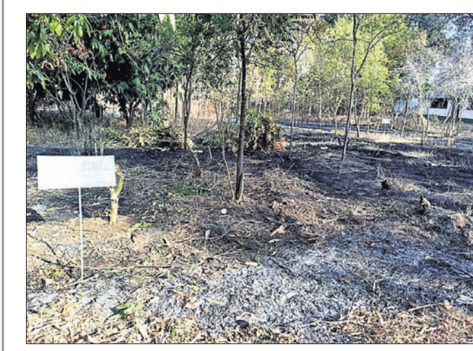
ଓଷଧୀୟ ଉଦ୍ୟାନ ପରିସରରେ ନିଆଁ ଲଗାଇ ପୋଡ଼ାଯାଇଥିବା ସ୍ଥାନ ।

ବେଓଗାଁ, ୩୦।୩।(ଡି.ଏନ.ଏ.): ବଲାଙ୍ଗୀର ଜିଲ୍ଲା ବେଓଗାଁ ବ୍ଲକ୍ ଅନ୍ତର୍ଗତ ପଞ୍ଚାୟତ କାର୍ଯ୍ୟକ୍ଷମ ସମ୍ପର୍କରେ ସିନିଆର ଶୀତଳ ଜଳ ପ୍ରକଳ୍ପ କାର୍ଯ୍ୟକ୍ଷମ କରିବା ପାଇଁ ସ୍ଥାନୀୟ ସ୍ତର ସଂଗଠନ ଦାବି କରିଛି। ୨୦୧୮-୧୯ ଆର୍ଥିକ ବର୍ଷରେ ଏହା ଶୀତଳ ଜଳ ପ୍ରକଳ୍ପ କାର୍ଯ୍ୟକ୍ଷମ କରିବା ପାଇଁ ସ୍ଥାନୀୟ ସ୍ତର ସଂଗଠନ ଦାବି କରିଛି। ୨୦୧୮-୧୯ ଆର୍ଥିକ ବର୍ଷରେ ଏହା ଶୀତଳ ଜଳ ପ୍ରକଳ୍ପ କାର୍ଯ୍ୟକ୍ଷମ କରିବା ପାଇଁ ସ୍ଥାନୀୟ ସ୍ତର ସଂଗଠନ ଦାବି କରିଛି।