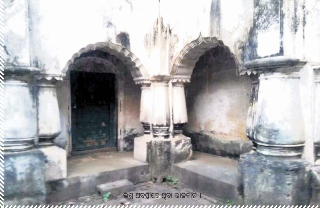
ଭଗ୍ନ ଅବସ୍ଥାରେ ଥିବା ରାଜବାଟି ।