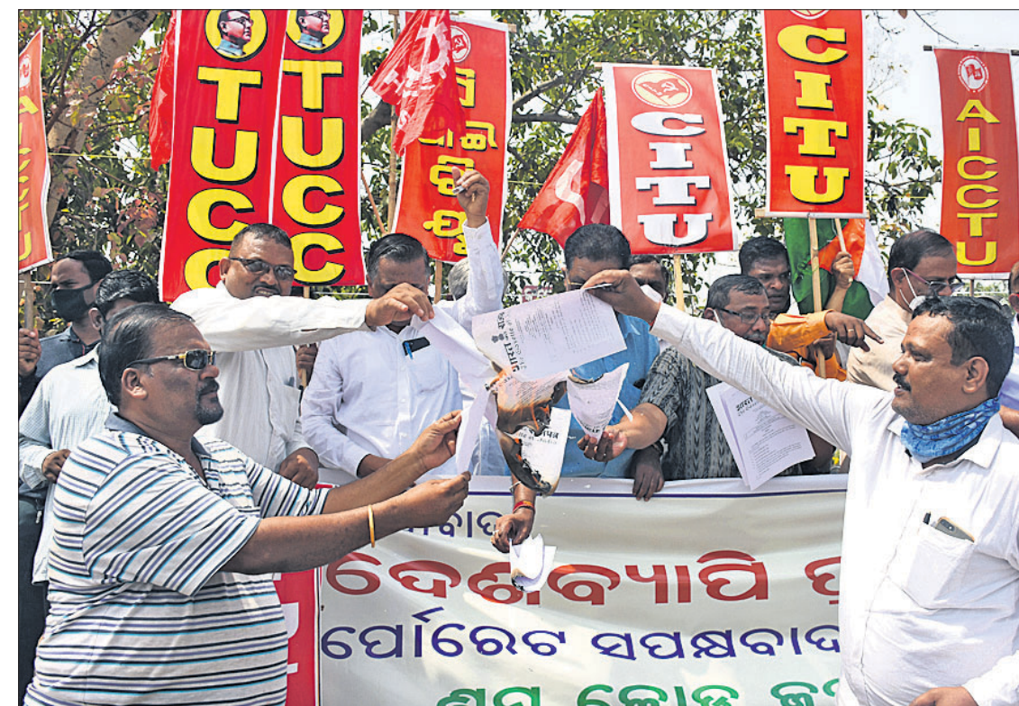
କେନ୍ଦ୍ର ସରକାରଙ୍କ ଶ୍ରମିକ ବିରୋଧୀ ଶ୍ରମ କୋଡ୍‌କୁ ବିରୋଧ କରି ଗୁରୁବାର ଭୁବନେଶ୍ୱର ମାଷ୍ଟରଜର୍ଣ୍ଣାଲ ଛକରେ ବିଭିନ୍ନ ଶ୍ରମିକ ସଙ୍ଗଠନ ପକ୍ଷରୁ ବିରୋଧ ଶୋଭାଯାତ୍ରାରେ କୋଡ୍ ସମ୍ପାଦକଙ୍କୁ ପୋଡ଼ାଯାଇଛି।