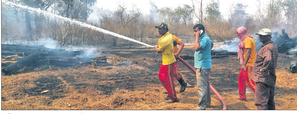
ନିଆଁ ଲିଭାଇଛନ୍ତି ଦମକଳ କେନ୍ଦ୍ର କର୍ମଚାରୀ ।