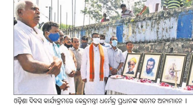
ଓଡ଼ିଶା ଦିବସ କାର୍ଯ୍ୟକ୍ରମରେ କେନ୍ଦ୍ରମନ୍ତ୍ରୀ ଧର୍ମେନ୍ଦ୍ର ପ୍ରଧାନଙ୍କ ସମେତ ଅନ୍ୟମାନେ ।