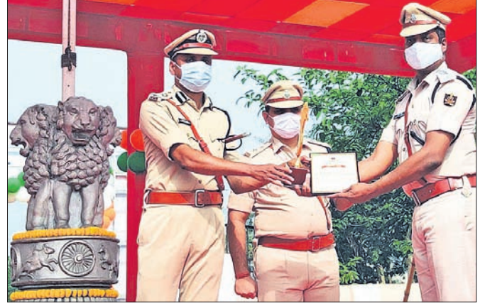
ପୋଲିସ କର୍ମଚାରୀଙ୍କୁ ପୁରସ୍କୃତ କରୁଛନ୍ତି ଡିଆଇଜି।