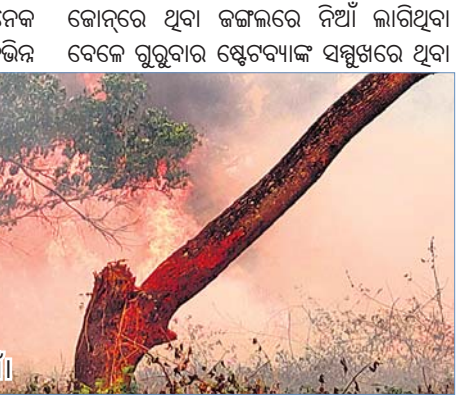
ହାଲ୍ ସହରାଞ୍ଚଳ ଜଙ୍ଗଲରେ ଲାଗିଥିବା ନିଆଁ।

ସୁନାବେଡ଼ା, ୧୫(ସ୍ଵ.ପ୍ର.) ସୁନାବେଡ଼ା ହାଲ୍ ନିକଟବର୍ତ୍ତୀ ଅଞ୍ଚଳରେ ଅନେକ ଜଙ୍ଗଲ ରହିଛି। ଏହିସବୁ ଜଙ୍ଗଲରେ ବିଭିନ୍ନ