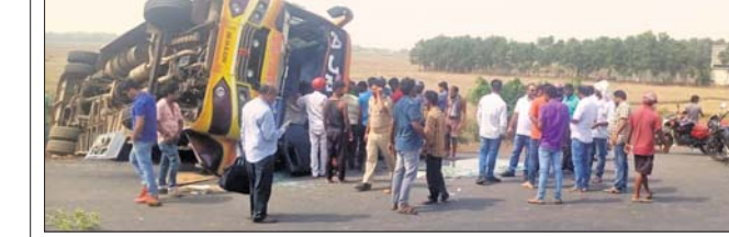
ଛପୁଲିଆ ନିକଟରେ ଓଲଟି ପଡ଼ିଥିବା ବସ୍।

ଭଦ୍ରକ ଜିଲ୍ଲା ଭଞ୍ଜାରିପୋଖରୀ ଥାନା ୧୬ ନଂ. ଜାତୀୟ ରାଜପଥର ଛପୁଲିଆ ନିକଟରେ ଗୁରୁବାର ଅପରାହ୍ନରେ ଅକ୍ଷୟ ନାମକ ଏକ ବସ୍ ଓଲଟି ୧୨ ଯାତ୍ରୀ ଆହତ ହୋଇଛନ୍ତି। ସେମାନଙ୍କ ମଧ୍ୟରୁ ୯ ଜଣ ଭଞ୍ଜାରିପୋଖରୀ ଗୋଷ୍ଠୀ ସ୍ୱାସ୍ଥ୍ୟକେନ୍ଦ୍ରରେ ପ୍ରାଥମିକ ଚିକିତ୍ସା ପରେ ଘରକୁ ଚାଲି ଯାଇଥିବା ବେଳେ ୩ ଜଣଙ୍କୁ ଭଦ୍ରକ ଡାକ୍ତରଖାନାକୁ ସ୍ଥାନାନ୍ତର କରାଯାଇଛି। ପ୍ରକାଶ ଯେ, ବସ୍ଟି ଭୁବନେଶ୍ୱରକୁ ବାରିପଦା ଅଭିମୁଖେ ଯାଉଥିଲା। ଭଞ୍ଜାରିପୋଖରୀ ବୁକ ଛପୁଲିଆ ନିକଟରେ ଓଭରଟେକ୍ କରୁଥିବା ସମୟରେ ଭାରସାମ୍ୟ ହରାଇ ରାଜପଥ ଉପରେ ଓଲଟି ପଡ଼ିଥିଲା। ସ୍ଥାନୀୟ ପୋଲିସ୍ ଆହତମାନଙ୍କୁ ଉଦ୍ଧାର କରି ଆସ୍ଥାଳୀଗୁଡ଼ିରେ ଭଞ୍ଜାରିପୋଖରୀ ଡାକ୍ତରଖାନାରେ ଭର୍ତ୍ତି କରିଥିଲା। ବସ୍ଟିରେ ୭୦ରୁ ୮୦ ଜଣ ଯାତ୍ରୀ ଥିଲେ ବୋଲି ପ୍ରତ୍ୟେକ୍ଷଦର୍ଶୀଙ୍କ ସ୍ତବ୍ଧ ପ୍ରକାଶ ପୋଲିସ୍ ଘଟଣାରେ ତଦନ୍ତ କରୁଛି।