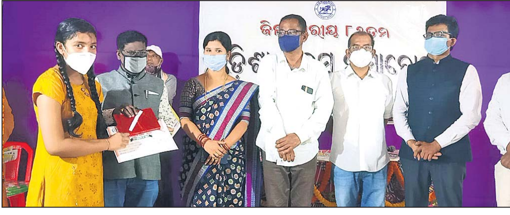
କୃତୀ ପ୍ରତିଯୋଗୀଙ୍କୁ ପୁରସ୍କୃତ କରାଯାଇଛି ।