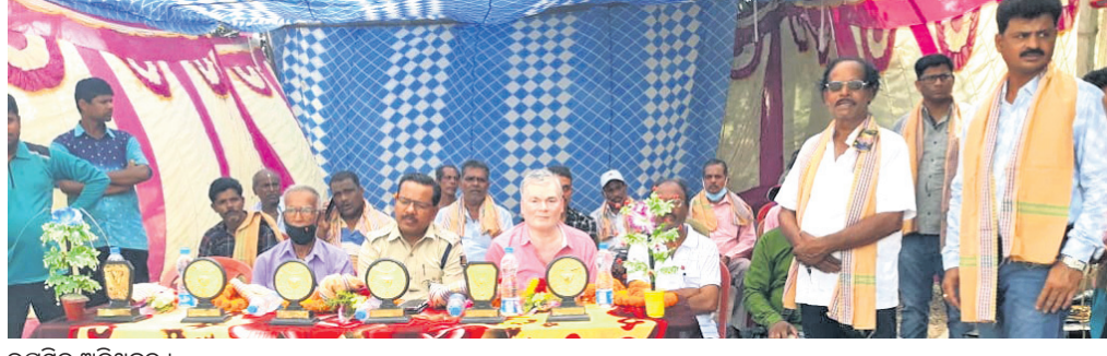
ଉପସ୍ଥିତ ଅତିଥିବୃନ୍ଦ ।