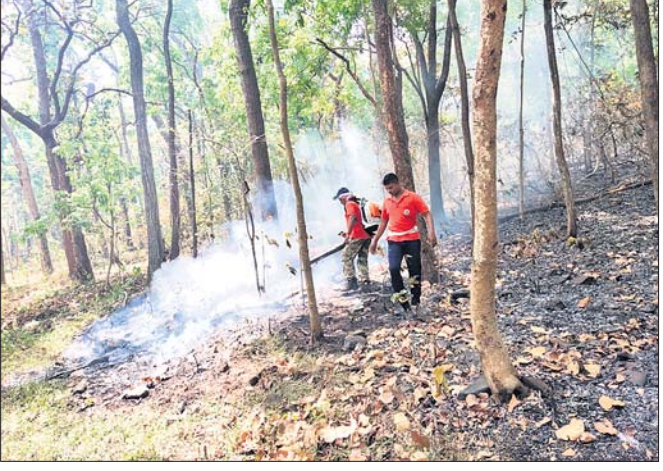
ଅଭୟାରଣ୍ୟରେ ଲାଗିଥିବା ନିଆଁକୁ ଆୟତ୍ତ କରାଯାଇଛି।

ଶିମିଳିପାଳ ଅଭୟାରଣ୍ୟରୁ ନିଆଁ ଲାଗୁନି। ରୋଗିଏ ପଟେ ବନ କର୍ମଚାରୀ ଯେତିକି ଲିଭାଇଛନ୍ତି ଅନ୍ୟପଟେ ସେତିକି ମାଡ଼ି ଚାଲିଛି ବନାଗ୍ନି। ଶୁଷ୍କ ଅଭୟାରଣ୍ୟ ମଧ୍ୟରେ କାୟା ବିସ୍ଫୋରଣ କରି ଚାଲିଛି। ଗୁରୁବାର ସୁଦ୍ଧା ୩୭ଟି ସ୍ଥାନରେ ନିଆଁ ଜଳୁଥିବା ସୂଚନା ମିଳିଛି। ନିଆଁ ବାଉରୁ ରକ୍ଷା ପାଇବା ପାଇଁ ଜୀବଜନ୍ତୁ ଗାଁ ଓ ସହର ମୁକ୍ତି ହେଉଛନ୍ତି। ବୃକ୍ଷଲତା କଳିପୋଡ଼ି ପାଇଁ ହୋଇଯାଇଛି। ନିଆଁକୁ ଆୟତ୍ତ କରିବା ପାଇଁ ବିଭାଗ ପକ୍ଷରୁ ଆପ୍ରାଣ ଉଦ୍ୟମ କରାଯାଇଛି। ମାତ୍ର ବର୍ଷା ଆଭାବରୁ ଅଭୟାରଣ୍ୟକୁ ସୁରକ୍ଷା ଦେବା କଷ୍ଟକର ହୋଇପଡ଼ିଛି। ସୂଚନା ଅନୁଯାୟୀ, ଜାତୀୟ ଅଭୟାରଣ୍ୟ ଦକ୍ଷିଣରେ ଥିବା ବ୍ୟାଘ୍ର ସଂରକ୍ଷଣ ପ୍ରକଳ୍ପର ବୁଢ଼ିଆ, ଜେନାବିଲ, ପିଠାବରୀ, ଚନ୍ଦ୍ରଲ ରେଞ୍ଜର ୨୭ଟି ଏବଂ ଅଭୟାରଣ୍ୟ ଦକ୍ଷିଣରେ ଥିବା ବ୍ୟାଘ୍ର ସଂରକ୍ଷଣ ପ୍ରକଳ୍ପର ବୁଢ଼ିଆ, ଜେନାବିଲ, ଆୟତ୍ତ କରିବା ପାଇଁ ୪ଟି ଓଡ୍ରାସ୍ ରିମ୍ପରେ ୫୦କର୍ମଚାରୀଙ୍କ ସହ ବନକର୍ମଚାରୀ ଏବଂ ୧୦ଟି ସ୍ଥାନରେ ନିଆଁ ଜଳୁଛି। ନିଆଁକୁ