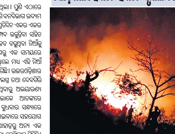
କୁଲଡ଼ିହା ଜଳୁଛି କୁଲଡ଼ିହା।