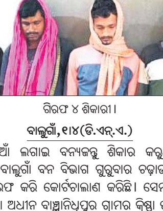
ଗିରଫ ୪ ଶିକାରୀ।

ଜଙ୍ଗଲରେ ନିଆଁ ଲାଗିଛି। ଖବର ପାଇ ହାଲ୍ ଅଗ୍ନିଶମ ବିଭାଗ କର୍ମଚାରୀ ପହଞ୍ଚି ଦୀର୍ଘ ୪ ଘଣ୍ଟା ପରିଶ୍ରମ କରି ନିଆଁକୁ ଆୟତ୍ତ କରିଛନ୍ତି। ନିଆଁ ଲାଗିବା ଯୋଗୁ ଜଙ୍ଗଲରେ ଥିବା ବହୁ ଛୋଟ ବଡ଼ ଗଛ କଳିଯାଇଛି। ଜଙ୍ଗଲଟି ସହରର ମଧ୍ୟଭାଗରେ ଥିବାରୁ ଜଙ୍ଗଲ ପାର୍ଶ୍ୱ ରାସ୍ତା ଦେଇ ପ୍ରତ୍ୟହ ଲୋକେ ଯାତାୟତ କରିଥାନ୍ତି। ନିଆଁ ଯୋଗୁ ବେଶ୍ କିଛି ସମୟ ଧରି ସହର ପରିବେଶକୁ କୁହୁଡ଼ି ପରି ଧୂଆଁମୟ ହୋଇଯାଇଥିଲା। କେତେକଜଣ ବ୍ୟକ୍ତି ସିଗାରେଟ୍ କିମ୍ବା ବିଡ଼ି ଟାଣି ସାରିବା ପରେ ବଳକା ଅଂଶକୁ ଏଣେତେଣେ ଫିଙ୍ଗିବା ଦ୍ୱାରା ଜଙ୍ଗଲରେ ନିଆଁ ଲାଗୁଥିବା ଆଲୋଚନା ହେଉଛି। ହାଲ୍ ସୁରକ୍ଷା ବିଭାଗ ଏବଂ ବନ ବିଭାଗ ଏଥିପ୍ରତି ଦୃଷ୍ଟି ଦେବାକୁ ଦାବି ହେଉଛି।