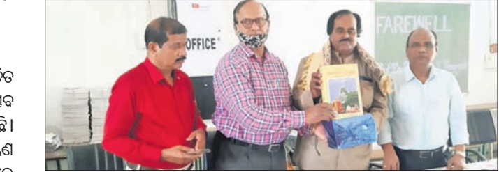
ଅଧ୍ୟକ୍ଷ ଉପସଭାପତି ଓ ମାନପତ୍ର ଦେଇ ସମ୍ବର୍ଦ୍ଧିତ କରୁଛନ୍ତି ।