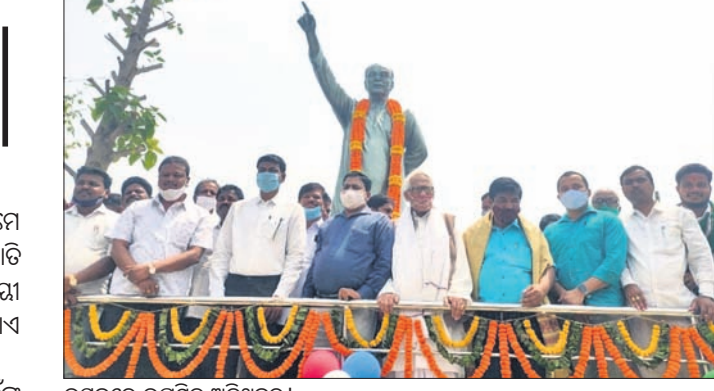
ଉପସ୍ଥାପନା ପାଇଁ ଉପସ୍ଥିତ ଅତିଥିବୃନ୍ଦ ।