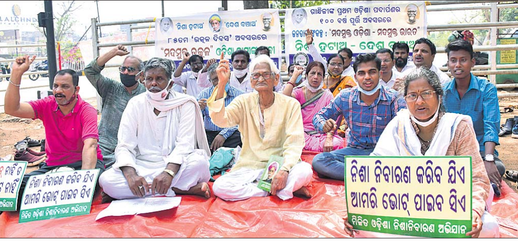
ଧାରଣାରେ ବସିଥିବା ମିଳିତ ଓଡ଼ିଶା ନିଶା ନିବାରଣ ଅଭିଯାନର କର୍ମକର୍ମୀ।