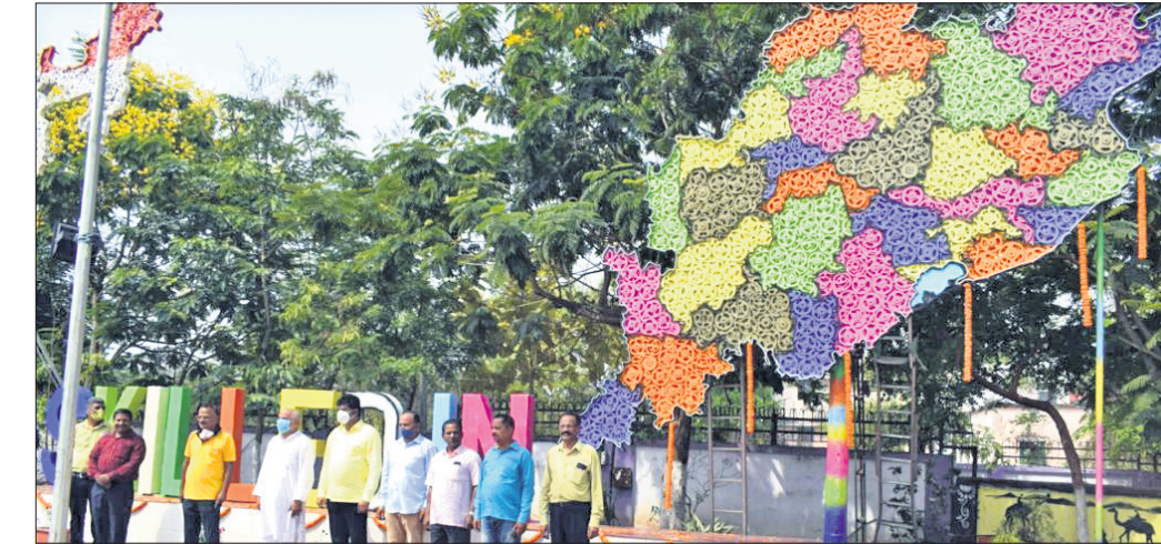
ଓଡ଼ିଶା ମାନଚିତ୍ର ଉନ୍ମୋଚନ ଅବସରରେ ଉପସ୍ଥିତ ଅତିଥି।