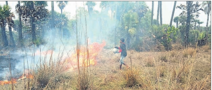
ସାହିବାସୀ ନିଆଁ ଲିଭାଇଛନ୍ତି ।

ପରଜଙ୍ଗ, ୧୪ (ବି.ଏନ.ଏ.) ଡେକାନାଲ ଜିଲ୍ଲା ପରଜଙ୍ଗ ବ୍ଲକ୍ କନ୍ଦରସିଂହା ପଞ୍ଚାୟତ ଭାଲୁପୁଣ୍ଡା ନିକଟ ବିଲ ଓ ଆଖପାଖ ଅଞ୍ଚଳରେ ଲାଗିଥିବା ନିଆଁକୁ ସାହିବାସୀ ଲିଭାଇଛନ୍ତି । ଫଳରେ ଗ୍ରାମ ନିକଟ ସଂରକ୍ଷିତ ଜଙ୍ଗଲ ବନାଗ୍ନିରୁ ବଞ୍ଚିଯାଇଛି । ବନାଗ୍ନିର ଭୟାବହତା ସମ୍ପର୍କରେ ବନ ବିଭାଗ ପକ୍ଷରୁ ବ୍ୟାପକ ସଚେତନତା ସୃଷ୍ଟି ଶିକାରୀମାନେ ନିଆଁ ଲାଗାଇଦେଉଛନ୍ତି । ନିଆଁ ଭୟରେ ବନ୍ୟଜନ୍ତୁ ଗ୍ରାମାଭିମୁଖୀ ହେବା ପରେ ସେମାନଙ୍କ ଲାଗି ଶିକାର କରିବା ସହଜ ହୋଇଯାଇଛି । ଗୁରୁବାର ଏଭଳି ମହା ଉଦ୍ଦେଶ୍ୟ