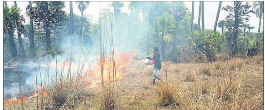
ସାହିବାସୀ ନିଆଁ ଲିଭାଇଛନ୍ତି ।

ପରଜଙ୍ଗ, ୧୪ (ବି.ଏନ.ଏ.) ଡେକାନାଲ ଜିଲ୍ଲା ପରଜଙ୍ଗ ବ୍ଲକ କନ୍ଦରସିଂହା ପଞ୍ଚାୟତ ଭାଲୁପୁଣ୍ଡା ନିକଟ ବିଲ ଓ ଆଖପାଖ ଅଞ୍ଚଳରେ ଲାଗିଥିବା ନିଆଁକୁ ସାହିବାସୀ ଲିଭାଇଛନ୍ତି । ଫଳରେ ଗ୍ରାମ ନିକଟ ସଂରକ୍ଷିତ ଜଙ୍ଗଲ ବନାଗ୍ନିରୁ ବଞ୍ଚିଯାଇଛି । ବନାଗ୍ନିର ଭୟାବହତା ସମ୍ପର୍କରେ ବନ ବିଭାଗ ପକ୍ଷରୁ ବ୍ୟାପକ ସଚେତନତା ସୃଷ୍ଟି ଶିକାରୀମାନେ ନିଆଁ ଲାଗାଇଦେଉଛନ୍ତି । ନିଆଁ ଭୟରେ ବନ୍ୟଜନ୍ତୁ ଗ୍ରାମାଭିମୁଖୀ ହେବା ପରେ ସେମାନଙ୍କ ଲାଗି ଶିକାର କରିବା ସହଜ ହୋଇଯାଇଛି । ଗୁରୁବାର ଏଭଳି ମହ ଉଦ୍ଦେଶ୍ୟ