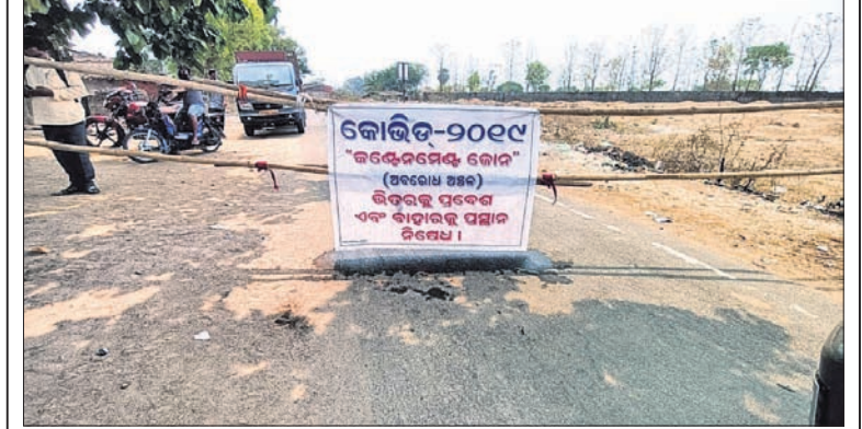
ଲିମସେର ଗାଁ କଣ୍ଠେନମେଣ୍ଟ ଜୋନ୍ ଘୋଷଣା କରାଯିବା ପରେ ରାସ୍ତାକୁ ବନ୍ଦ କରାଯାଇଛି।