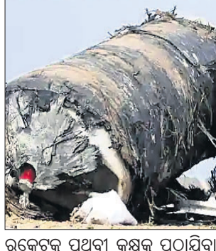
ରକେଟ୍‌ରୁ ପୂର୍ଣ୍ଣ ପରିଷ୍କାର ହୋଇଥିବା ସ୍ଵେଦ୍‌ସ୍ତର ରକେଟ୍ ଫାଲ୍‌ଆଉଟ୍ ହୋଇଛି।

ଗତ ସପ୍ତାହରେ ଦୁର୍ଘଟଣାଗ୍ରସ୍ତ ହୋଇଥିବା ସ୍ଵେଦ୍‌ସ୍ତର ରକେଟ୍ ଫାଲ୍‌ଆଉଟ୍ ଆମେରିକାର ପୂର୍ବ ଖେତରେ ପଡ଼ିଥିବା ଜଣାଯାଇଛି।