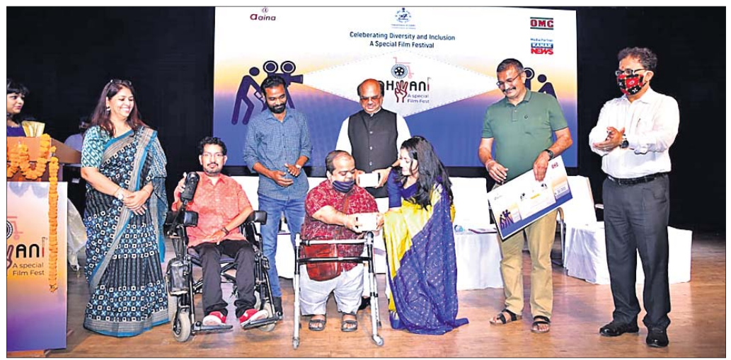
ଉତ୍ସବରେ ଅତିଥିମାନେ ଶ୍ରେଷ୍ଠ ଚଳଚ୍ଚିତ୍ର ‘ଶରତ ପୂଜାରୀ ସ୍ମାରକୀ ପୁରସ୍କାର’ ପ୍ରଦାନ କରୁଛନ୍ତି ।