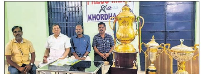
ଖବରଦାତା ସମ୍ମିଳନୀରେ ଚୁନିମେଣ୍ଟ ଆୟୋଜକ କମିଟିର ସଭ୍ୟମାନେ । ଖୋର୍ଦ୍ଧା ଅଫିସ, ୩୫

୬୬ ଓ ଦାନେଶ ଚାନ୍ଦିମଲ ୧୦ ରନ କରି ଅପରାଜିତ ରହିଥିଲେ । ତେବେ ଶତକାନ୍ତ ଭାଗାଦାରି ସ୍ଥାପନ କରିଥିବା ଦୁଇ ଓପନର ଥିଲେ ୩୯ ଓ କରୁଣାରଠାରେ ୭୫ ରନ ସଂଗ୍ରହ କରି ଯଥାକ୍ରମେ ଅଲକାରି କୋଶେଫ ଓ କାଏଲ ମେୟର୍ସଙ୍କ ଦ୍ୱାରା ଆଉଟ ହୋଇଥିଲେ । ଅସମାପ୍ତ ଦ୍ୱିତୀୟ ଇନିଂସ ଘୋର ୨୯/୦ ରୁ ଶ୍ରୀଲଙ୍କା ଖେଳ ଆରମ୍ଭ କରିଥିଲା । ଓଭରନାଲଟ ବ୍ୟାଟ୍‌ମ୍ୟାନ ଥିଲେ ୧୭ ଓ କରୁଣାରଠାରେ ୧୧ ରୁ ଖେଳ ଆରମ୍ଭ କରି ଶନିବାର ଆଉଟ ହୋଇଥିଲେ । ସଂକ୍ଷିପ୍ତ ଘୋର: ଫ୍ରେସ୍‌ଇଣ୍ଡିଜ ପ୍ରଥମ ଇନିଂସ: ୧୧୧.୧ ଓଭରରେ ୩୫୪ ଅଲଆଉଟ । ଶ୍ରୀଲଙ୍କା ପ୍ରଥମ ଇନିଂସ: ୧୦୭ ଓଭରରେ ୨୫୮ ଅଲଆଉଟ । ଫ୍ରେସ୍‌ଇଣ୍ଡିଜ ଦ୍ୱିତୀୟ ଇନିଂସ: ୭୨.୪ ଓଭରରେ ୨୮୦/୪ (ଇନିଂସ ଘୋଷଣା) ଶ୍ରୀଲଙ୍କା ଦ୍ୱିତୀୟ ଇନିଂସ: ୭୯ ଓଭରରେ ୧୯୩/୨ (ଓଶାଡ଼ା ଫର୍ମାଣ୍ଡୋ- ୬୬*, ଦାନେଶ ଚାନ୍ଦିମଲ- ୧୦*, କରୁଣାରଠାରେ- ୭୫, ଥିଲେ- ୩୯, କୋଶେଫ- ୧/୩୩, ମେୟର୍ସ- ୧/୫) ।