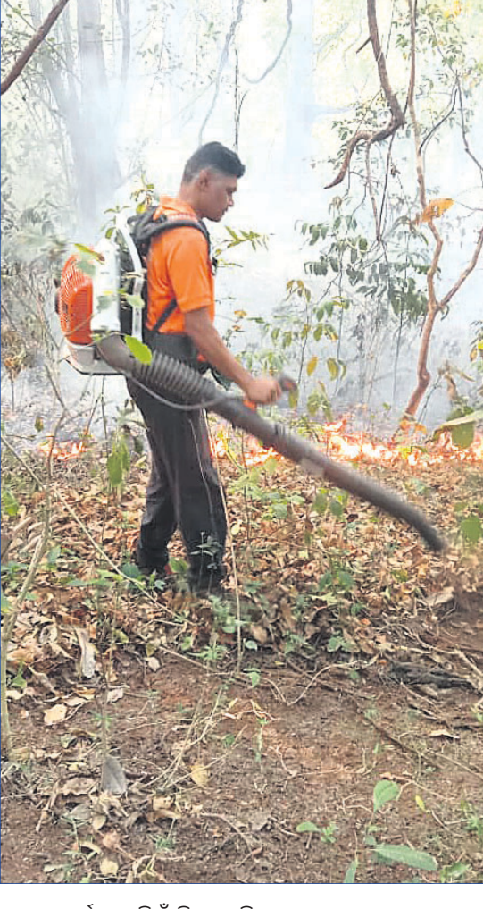
ଓଡ଼ିଆ କର୍ମଚାରୀ ନିଆଁ ଲିଭାଇଛନ୍ତି।