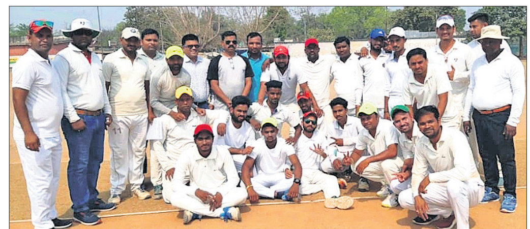
ଅତିଥିକ୍ ରହଣରେ କ୍ରିକେଟ୍ ସଂଘର କର୍ମଚାରୀ ଓ ଖେଳାଳି ।

ଉଇକେଟ୍ ନେଇଥିଲେ । ୨୩୯ ରନର ବିଜୟ ଲକ୍ଷ୍ୟ ନେଇ 'ଏର୍' ଦଳ ୩୨ ଓଭରରେ ସମସ୍ତ ଉଇକେଟ୍ ହରାଇ ୧୭୭ ରନ ସଂଗ୍ରହ କରିଥିଲା । ମୁଖତାର ଖାନ୍ ସର୍ବାଧିକ ୬୧ରନ ସଂଗ୍ରହ କରିଥିଲେ ।