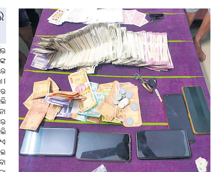
ଜବତ ଟଙ୍କା ଓ ମୋବାଇଲ୍ ଫୋନ୍ ।

ବ୍ରହ୍ମପୁର ସହରରେ ଏବେ ଖୁଲିମୁଖୋଲି ପାଲଟିଛି ଜୁଆଡ଼ିଙ୍କ ନୂଆ ଠିକଣା। ପୋଲିସ୍ ଦୁର୍ଘଟ ହେଉଛି ରହିବା ପାଇଁ ଜୁଆଡ଼ିମାନେ ଆପାର୍ଟମେଣ୍ଟରୁ ସୁରକ୍ଷିତ ସ୍ଥାନ ଭାବେ ବାଛି ନେଇଛନ୍ତି। ହେଲେ ପୋଲିସ୍ ଏବେ ସମ୍ପୂର୍ଣ୍ଣ ଆପାର୍ଟମେଣ୍ଟ ଉପରେ ନଜର ରଖିଛି। ଏକ ବିଶେଷ ସୂତ୍ରରୁ ଖବର ପାଇ ପୋଲିସ୍ ଶୁକ୍ରବାର ରାତି ପ୍ରାୟ ୧୧ଟାରେ ଏକ ବଡ଼ପରଶର ଜୁଆ ଆଞ୍ଚା ଠାଏ ବିକଳିଥିଲା। ଶିବାଶକ୍ତି ସିନେମା ହଲ ନିକଟ ଶାସ୍ତ୍ରୀନଗରରେ ଥିବା ହେରିଟେଜ୍ ଆପାର୍ଟମେଣ୍ଟରେ ଗୋଷାଣୀଗୁଆଁ ଓ ବଡ଼ବଜାର ପୋଲିସ୍ ମିଳିତ ଭାବେ ଚଢ଼ାଇ କରିଥିଲା। ୩୦୭ ନମ୍ବର କ୍ୱାର୍ଟରରେ ଖେଳୁଥିବା ସମସ୍ତ ଜୁଆଡ଼ିଙ୍କୁ କାବୁ