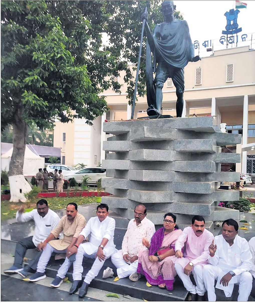
ବିଧାନସଭା ଗାନ୍ଧୀମୂର୍ତ୍ତି ତଳେ ଭାଜପା ବିଧାୟକଙ୍କ ଧାରଣା ।