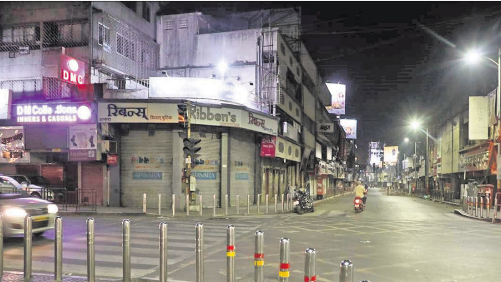
ପୁଣେରେ ଶନିବାରଠାରୁ ୧୨ ଘଣ୍ଟିଆ ନାଇଟ୍ କର୍ଫ୍ୟୁ ଆରମ୍ଭ ହୋଇଛି।

ଭାରତରେ କରୋନା ସଂକ୍ରମଣର ଦ୍ରୁତତା ଲହରୀ ଉଦ୍‌ବେଗଜନକ ସ୍ଥିତିରେ ପହଞ୍ଚିଛି। କ୍ରମାଗତ ୨୪ ଦିନ ହେଲା ଦେଶରେ ଆକ୍ରାନ୍ତ ସଂଖ୍ୟା ହ୍ରାସ ହୋଇ ବଢ଼ିଗଲାଣି।