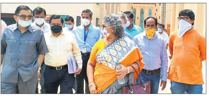
୯ ଜଣିଆ ପ୍ରତିନିଧି ଦଳ ସୁନ୍ଦରଗଡ଼ଠାରେ ଏମ୍ସ ପ୍ରତିଷ୍ଠା ନେଇ ଭିତ୍ତିଭୂମି ଅନୁଧାନ କରୁଛନ୍ତି ।