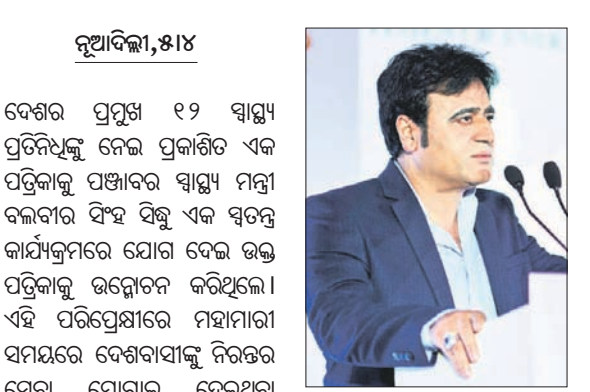
ଦେଶର ପ୍ରମୁଖ ୧୨ ସ୍ୱାସ୍ଥ୍ୟ ପ୍ରତିନିଧିତ୍ୱ ନେଇ ପ୍ରକାଶିତ ଏକ ପତ୍ରିକାକୁ ପଞ୍ଜୀକରଣ ସମ୍ପର୍କରେ ସଞ୍ଚୀବ କହିଛନ୍ତି।

ଦେଶର ପ୍ରମୁଖ ୧୨ ସ୍ୱାସ୍ଥ୍ୟ ପ୍ରତିନିଧିତ୍ୱ ନେଇ ପ୍ରକାଶିତ ଏକ ପତ୍ରିକାକୁ ପଞ୍ଜୀକରଣ ସମ୍ପର୍କରେ ସଞ୍ଚୀବ କହିଛନ୍ତି। ଏହି ପତ୍ରିକାରେ ପଞ୍ଜୀକରଣ ସମ୍ପର୍କରେ ସମସ୍ତ ସୂଚନା ଦିଆଯାଇଛି।