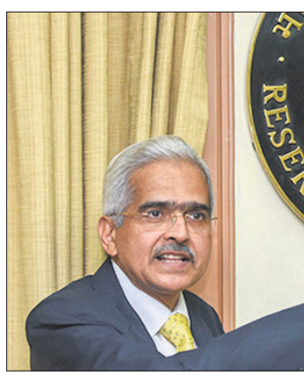
ରଞ୍ଜିତ ବ୍ୟାଙ୍କ ଅଫ୍ ଇଣ୍ଡିଆ(ଆର୍ବିଆଇ)ର ୩ ଦିନିଆ ପୁରାଣୀ କମିଟି(ଏମ୍ପିସି) ବୈଠକ ଆରମ୍ଭ ହୋଇଛି।

ସରକାର ପୁଞ୍ଜୀକରଣ ୪% ପ୍ରଭାବରେ ଉନ୍ନତ ହୋଇଛି। ଏମ୍ପିସି ବୈଠକରେ ଗୋଟିଏ ନିଷ୍ପତ୍ତି ଗ୍ରହଣ କରାଯାଇଛି।