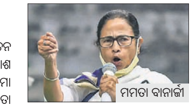
କରିବି। ଗତଦିନରେ ନିଜପ୍ରାଣରେ ପ୍ରାର୍ଥାପତ୍ର ଦାଖଲକରିବାକୁ ତାଙ୍କ ଗୋଡ଼ରେ ଆସାମ ଲାଗିଥିବାକୁ ସେ ହିଲ ଚେନ୍ଦ୍ରରେ ବସି ନିର୍ବାଚନ ପ୍ରଚାର କରୁଥିବାକୁ ଏକଲ ମନ୍ତବ୍ୟ ଦେଇଛନ୍ତି।

ପଶ୍ଚିମବଙ୍ଗରେ ବୃତ୍ତୀୟ ପର୍ଯ୍ୟାୟ ନିର୍ବାଚନ ପୂର୍ବରୁ ନିଜ ବିଜୟ ପାଇଁ ଦକ୍ଷେଇ ପ୍ରକାଶ କରିଛନ୍ତି ଡିଏମ୍‌କେ ସୁପ୍ରିମୋ ଡା. ପଶ୍ଚିମବଙ୍ଗ ମୁଖ୍ୟମନ୍ତ୍ରୀ ମମତା ବାନାର୍ଜୀ।