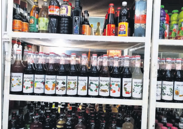
ପ୍ରୋଜେକ୍ଟ ପୁଞ୍ଜ ପ୍ରଡକ୍ସ ବିତରଣ କରୁଛି।

ହୋଟେଲ, ରେଷ୍ଟୋରାଣ୍ଟ, ପାଖାପାଖି ଏବଂ ରିଟେଲରେ ମଧ୍ୟ ପ୍ରଡକ୍ସ ଯୋଗାଣ ହେଉଛି।