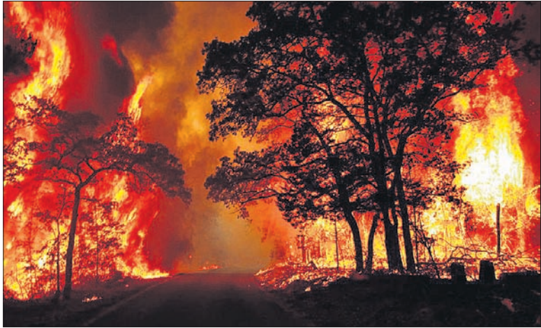
ପକ୍ଷରୁ ଏକ୍ସିଆରଏଏଏ ଟିମ୍ ପଠାଯିବା ସହ ନିମନ୍ତେ ନିୟୋଜିତ ହୋଇଛନ୍ତି। ରାଜ୍ୟ ସରକାର ୧୨ ହଜାର ବନ କର୍ମଚାରୀଙ୍କୁ ୨ଟି ବାୟୁସେନା ହେଲିକପ୍ଟର ନିଆଁ ଲିଭା

ପୂର୍ତ୍ତମନ କରିବା ସହ ୧୩ ଶହ ଫାୟାର ଫାଇଟିଂ ଟିମ୍ ନିର୍ମାଣ କରାଯାଇଛି।