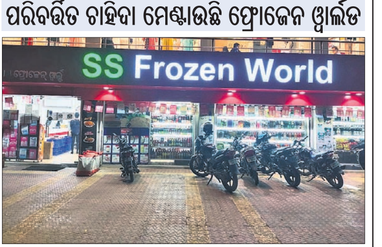
ପରିବର୍ତ୍ତନ ଚାହିଦା ମେଣ୍ଟାଇବା ପ୍ରୋଜେକ୍ଟ ପୁଞ୍ଜ ପ୍ରଡକ୍ସ

ବର୍ତ୍ତମାନ ସମୟରେ ପରିବର୍ତ୍ତନ ସହ ଗ୍ରାହକଙ୍କ ଚାହିଦାରେ ମଧ୍ୟ ପରିବର୍ତ୍ତନ ଆସିଛି। ଏସିଏଏଲ୍ ଟେକ୍ନୋଲୋଜି କାରବାର ୩.୦୮% ଉନ୍ନତ ରହିଥିବା ଜଣାପଡ଼ିଛି।