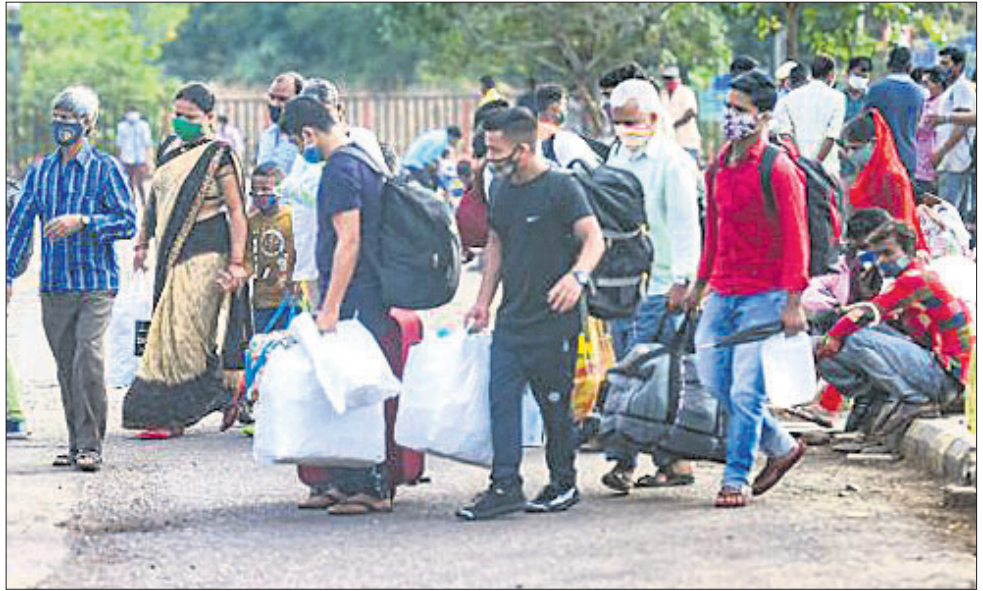
ବହୁ ସଂଖ୍ୟାରେ ଘର ବାହୁଡ଼ା ପ୍ରବାସୀ ଶ୍ରମିକ ମୁମ୍ବାଇର ଲୋକମାନଙ୍କ ତିଳକ ଚର୍ଚ୍ଚନାରେ ଚେନ୍ଦ୍ର ଧରିବା ପାଇଁ ଏକାଠି ହୋଇଛନ୍ତି।