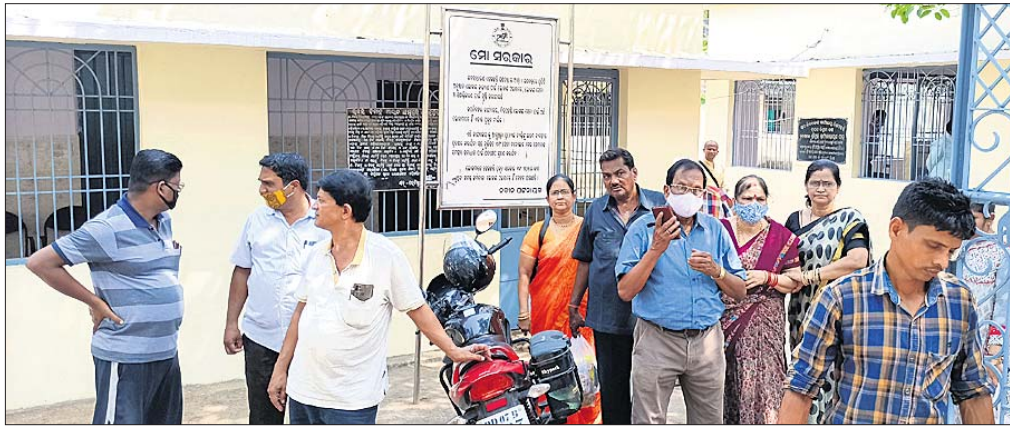
ସବ୍ ରେଜିଷ୍ଟ୍ରାର ଅଫିସରେ ଜମି ରେଜିଷ୍ଟ୍ରେଶନ ଆଜି ବନ୍ଦ ରହିବାରୁ କ୍ରେତା-ବିକ୍ରେତା ମାନେ ଫେରି ଯାଇଛନ୍ତି।