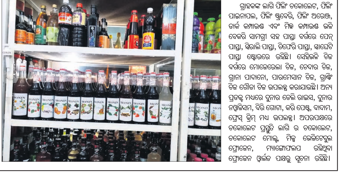
ପ୍ରୋଜେକ୍ଟ ପୁଞ୍ଜ ପ୍ରଡକ୍ସ

ହୋଟେଲ, ରେଷ୍ଟୁରାଣ୍ଟ, ପାଖୁ ପୁଞ୍ଜ ଏବଂ ରିଟେଲରୁ ମଧ୍ୟ ପ୍ରଡକ୍ସ ଯୋଗାଇ ହେଉଛି। ପ୍ରୋଜେକ୍ଟ ପୁଞ୍ଜ ଷ୍ଟୋରରେ ଗ୍ରାହକଙ୍କ ପାଇଁ ଗ୍ରୀନ୍ ମଟର, ସ୍ପିଟ୍ କର୍ଣ୍ଣ, ଖୋୟା, ପିଲା ଚିକ୍, ପ୍ଲାଇସ ଚିକ୍, ଭେଜି ପିକ୍‌ଅପ୍, ଆଲୁମିନିୟମ ପ୍ରଡକ୍ସ, ସୁସ୍ୱାଦୁ ଚିକ୍ ଏବଂ ଗାଈକ (ପୋଟୋ ବାଲଟୁ), ଚକ୍ଲେଟ୍‌ସ୍ ଏବଂ ମୋଜେରେଲା ସେଭେଡ୍ ଭଳି ପ୍ରଡକ୍ସ ଯାମିଲ ରହିଛି।