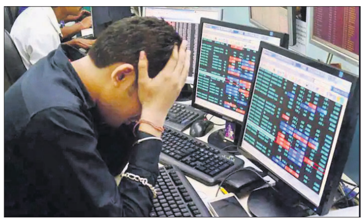
ନ୍ୟାସିକା,୫୪ ୧୨୫ କମ୍ପାନୀର ଶେୟାର କାରବାର ୨୦୧୫ ଲକ୍ଷ କୋଟି ଟଙ୍କା ପ୍ରଭାବିତ ରହିଛି।

ନ୍ୟାସିକା,୫୪ ଯୋଗଦାନ ଭାରତୀୟ ସେୟାର ବଜାରର କାରବାର ପ୍ରଭାବିତ ରହିଛି। ଫଳରେ ନିବେଶକଙ୍କ ସମ୍ପତ୍ତି ୨.୧୬ ଲକ୍ଷ କୋଟି ଟଙ୍କା ହ୍ରାସ ହୋଇଛି।