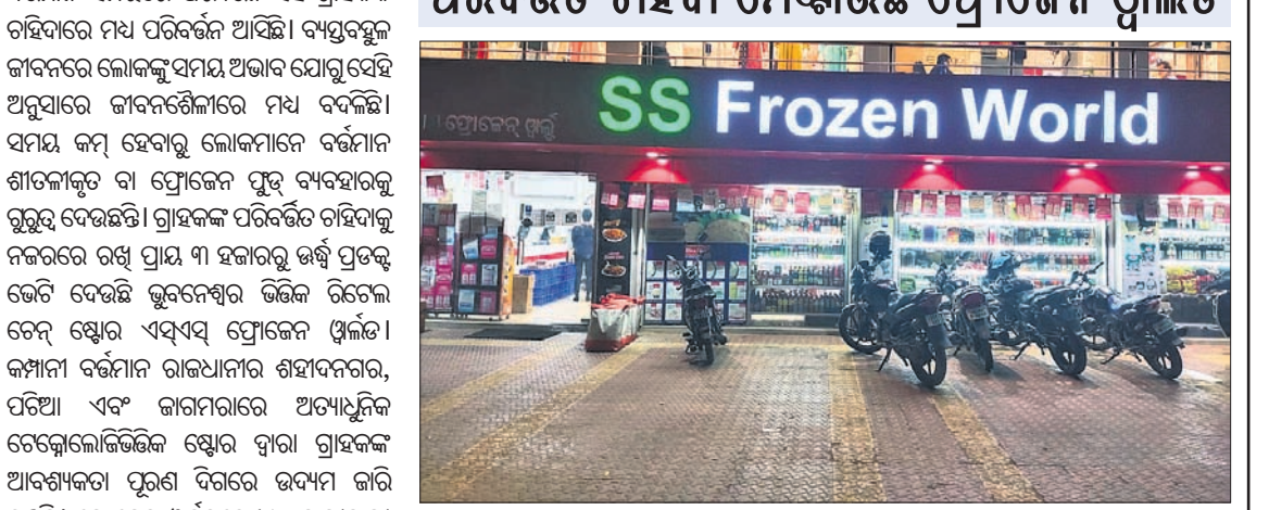
ପରିବର୍ତ୍ତନ ଚାହିଦା ମେଣ୍ଟାଇଛି ପ୍ରୋଜେକ୍ଟ ପୁଞ୍ଜ

ଭୁବନେଶ୍ୱର,୫୪ ବର୍ତ୍ତମାନ ସମୟରେ ପରିବର୍ତ୍ତନ ସହ ଗ୍ରାହକଙ୍କ ଚାହିଦାରେ ମଧ୍ୟ ପରିବର୍ତ୍ତନ ଆସିଛି। ବ୍ୟସ୍ତବହୁଳ ଜୀବନରେ ଲୋକଙ୍କୁ ସମୟ ଅଭାବ ଯୋଗୁଁ ସେହି ଅନୁସାରେ ଜୀବନଶୈଳୀରେ ମଧ୍ୟ ବଦଳିଛି।