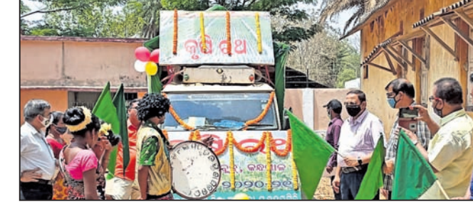
ସଚେତନତା ରଥ ଶୁଭାଭିଷେକ କରାଯାଇଛି।