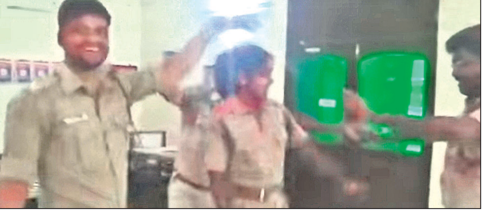
ଭାଇରାଲ ଭିଡିଓରେ ଥାନା ଭିତରେ ପୋଲିସ ଅଧିକାରୀମାନେ ନୃତ୍ୟ କରୁଛନ୍ତି।

ଯାକପୁର ଅଫିସ୍, ୨୪ ଯାକପୁର ଜିଲ୍ଲା ପାଣିକୋଇଲି ଏସିଆନ୍ ବିଶ୍ୱବିଦ୍ୟାଳୟ ଚାଳିକାର ୨୫୦ ଚମ ରାଧାକ୍ ହାସଲ କରିବାର ଯୋଗାଣ ହାସଲ କରିପାରିଛି ବୋଲି ପ୍ରଫେସର ବିଶ୍ୱାସ ଏହି ଅବସରରେ ସୂଚନା ଦେଇଛନ୍ତି।