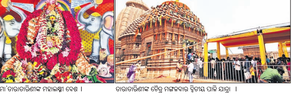
ମା' ତାରାତାରିଣୀଙ୍କ ମହାଲକ୍ଷ୍ମୀ ବେଶ । ତାରାତାରିଣୀଙ୍କ ଚୈତ୍ର ମଙ୍ଗଳବାର ବିଡ଼ାୟ ପାଇଁ ଯାତ୍ରା ।

ପୁରୁଷୋତ୍ତମପୁର, ୨୪ (ଡି.ଏନ୍.ଏ.): ଗଞ୍ଜାମ ଜିଲ୍ଲାର ଲକ୍ଷ୍ମଦେବୀ ମା' ତାରାତାରିଣୀଙ୍କ ଚୈତ୍ର ମଙ୍ଗଳବାର ବିଡ଼ାୟ ପାଇଁ ଯାତ୍ରା କରୋନା କଟକଣା ମଧ୍ୟରେ ହୋଇଛି। ସଂକ୍ରମଣ ବ୍ୟାପିଥିବାରୁ ଏହି ପାଳିକୁ ପିଲାଙ୍କ ମୁଣ୍ଡନକୁ ଜିଲ୍ଲାପାଳ ସମ୍ପୂର୍ଣ୍ଣ ବନ୍ଦ କରିଥିଲେ। ତେବେ ପ୍ରଶାସନ ପକ୍ଷରୁ ମୁଣ୍ଡନ କରାଯାଇନଥିବାର ମଧ୍ୟ କଟକଣାକୁ ଖାତିର ନକରି ଲୋକେ ପାହାଚ ପାଦଦେଶ, ନଦୀ ତଟ, ଜଙ୍ଗଲରେ ଶତାଧିକ ପିଲାଙ୍କ ମୁଣ୍ଡନ କରାଯାଇଛି। ସୋମବାର ରାତି ୨ଟା ୩୦ରୁ ମନ୍ଦିର ଦ୍ୱାର ଖୋଲାଯାଇ ଅବକାଶ ନାହିଁ, ମାଲିକା, ଅଭିଷେକ, ଶୁଣାଣ ଆଦି ପରେ ପୂଜାର୍ଚ୍ଚନା କରାଯାଇ ମା'ଙ୍କୁ ମହାଲକ୍ଷ୍ମୀ