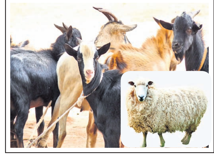
ନିଜ କ୍ଷେତରେ ଉତ୍ପନ୍ନ ନାଥ କର

ଯତ୍ନ ନିଅନ୍ତୁ। ଟିକାଦାନ ଫସଲ ଚିନାବାଦାମ -ଚିନାବାଦାମ ଫସଲ ଅମଳ କରି ୨-୩ ଦିନ ଖରାରେ ଶୁଖାଇ ବସ୍ତାରେ ସାଇତି ରଖନ୍ତୁ। ଆର୍ଦ୍ରତା କମାଇ ଏବଂ ପୋକ ନ ଲାଗିବା ଲାଗି ୩୦ କି.ଗ୍ରା. ବିହନରେ ୨୫୦ ଗ୍ରାମ୍ କ୍ୟାଲସିୟମ୍ କ୍ଲୋରାଇଡ୍ ବସ୍ତା ଭିତରେ ରଖନ୍ତୁ। ଡାଲୁଆ ଧାନ -ସମୟୋପଯୋଗୀ କଳସେଚନ କରନ୍ତୁ। -ସାର ପ୍ରୟୋଗର ଏକ ଦିନ ପୂର୍ବରୁ କ୍ଷେତରୁ ଜଳ ନିଷାସନ କରି ସାର ପ୍ରୟୋଗର ୪୮ ଘଣ୍ଟାପରେ ୫ ସେ.ମି. ଜଳ ବାନ୍ଧି ରଖନ୍ତୁ। -ଧାନ ଫୁଲ ଉଡ଼ାଇବାର ୨୦ ଦିନ ଆଗରୁ ଓ ୧୦-୧୫ ଦିନ ପର୍ଯ୍ୟନ୍ତ କ୍ଷେତରେ ୩-୫ ସେ.ମି. ପାଣି ବାନ୍ଧି ରଖନ୍ତୁ। -ଧାନ କେଣ୍ଡାର ୮୫% ପାଚିଗଲେ ଅମଳ କରନ୍ତୁ। ଗହମ -ଗହମ ଗଛ ଶୁଖି ହଳଦିଆ ପଡ଼ିଗଲେ ଓ କେଣ୍ଡାକୁ ବଳେଇ ଦେଲେ ଯଦି ସହଜରେ ଭାଙ୍ଗିଯାଏ ତେବେ ଗହମ ଫସଲ ଅମଳ ପାଇଁ ଉପଯୁକ୍ତ ଅଟେ। ଅମଳ ପରେ ୩/୪ଟି ଚାଣ ଖରାରେ ଶୁଖାଇ ସାଇତି ରଖନ୍ତୁ।