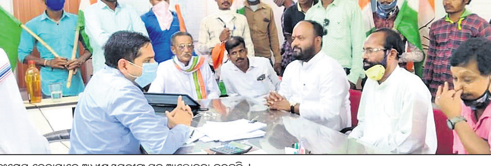
କଂଗ୍ରେସ ନେତାମାନେ ଅଧୀକାରୀଙ୍କ ସହ ଆଲୋଚନା କରୁଛନ୍ତି।

କଂଗ୍ରେସ ନେତାମାନେ ଅଧୀକାରୀଙ୍କ ସହ ଆଲୋଚନା କରୁଛନ୍ତି। କଂଗ୍ରେସ ନେତାମାନେ ଅଧୀକାରୀଙ୍କ ସହ ଆଲୋଚନା କରୁଛନ୍ତି।