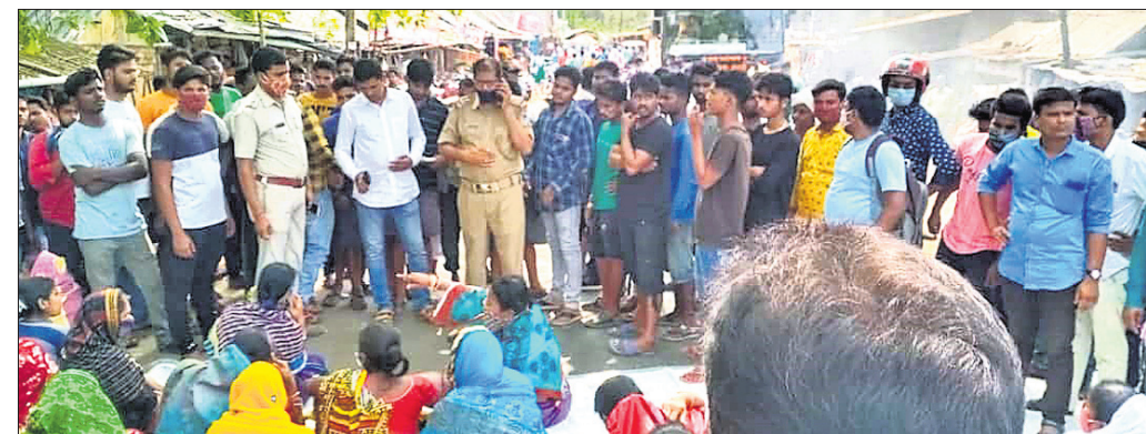
ରାସ୍ତା ଅବରୋଧକାରୀଙ୍କୁ ପୋଲିସ୍ ବୁଝାଶୁଣା କରୁଛି।