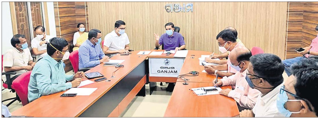
ବୈଠକରେ ଉପସ୍ଥିତ ଜିଲ୍ଲାପାଳ ଓ ଅନ୍ୟମାନେ।

ଗଞ୍ଜାମ ଜିଲ୍ଲାକୁ ପ୍ରବାସୀଙ୍କ ପ୍ରତ୍ୟାବର୍ତ୍ତନ କାରଣରୁ କରୋନା ସଂକ୍ରମିତଙ୍କ ସଂଖ୍ୟା ଗୋଟିଏ ସପ୍ତାହରେ ତିନିଗୁଣା ବୃଦ୍ଧିପାଇଛି। ସର୍ବନିମ୍ନ ହେଲେ ଛାତ୍ର ଶିକ୍ଷା ଦାମାପାଟଣା ଉପରେ ଗଞ୍ଜାମ ଜିଲ୍ଲା ପିଏଫ ଓ ପ୍ରିୟରଞ୍ଜନଙ୍କୁ ଅଟକାଇ ଦିଆଯାଇଥିଲା। ଗାଳିଶ କାଟିବାକୁ ଯାଉଥିବା ବେଳେ ସେମାନେ ପ୍ରଥମେ ବତ୍ୟା କରିବା ସହ ଗାଳିଶ ରସିଦ୍ ବହି ଚିରି ଦେଇଥିଲେ। ପରେ ଫାଷ୍ଟି ହାବିଲଦାରଙ୍କ ସମେତ ଅନ୍ୟ ପୋଲିସ କର୍ମଚାରୀଙ୍କୁ ମାଡ଼ ମାରି ଆହତ କରିଛନ୍ତି। ସେମାନଙ୍କୁ ଗିରଫ ପରେ କୋର୍ଟ ବାଲାଣ୍ଟ କରାଯାଇଥିଲା। ଜାମିନ ନାମାଖୁର ହେବାରୁ ସେମାନଙ୍କୁ ଜେଲ ହାତକୁ ପଠାଇ ଦିଆଯାଇଛି।