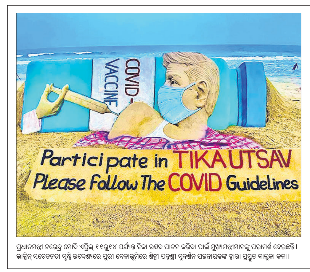
ପ୍ରଧାନମନ୍ତ୍ରୀ ନରେନ୍ଦ୍ର ମୋଦି ଏପ୍ରିଲ ୧୧୧୧୪ ପର୍ଯ୍ୟନ୍ତ ଟିକା ଉତ୍ସବ ପାଳନ କରିବା ପାଇଁ ପୁଣ୍ୟମନ୍ତ୍ରୀମାନଙ୍କୁ ପରାମର୍ଶ ଦେଇଛନ୍ତି । ଭାକ୍ସିନ୍ ସତ୍ତ୍ୱେନତନା ସୃଷ୍ଟି ଉଦ୍ଦେଶ୍ୟରେ ପୁରୀ ବେଳାଭୂମିରେ ଶିଳ୍ପୀ ପଦ୍ମଶ୍ରୀ ସୁବର୍ଣ୍ଣନ ପଟ୍ଟନାୟକଙ୍କ ଦ୍ୱାରା ପ୍ରସ୍ତୁତ ବାଲୁକା କଳା ।