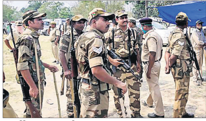
ଶୀତଳକୁଚିସ୍ଥିତ ୧୨୬ ନମ୍ବର ବ୍ଲକ୍‌ରେ ହିଂସା ପରେ କେନ୍ଦ୍ରୀୟ ସୁରକ୍ଷା ବଳ ଯବାନ।

କହିବା ଅନୁଯାୟୀ, ୩୫୦୦୪୦୦ ଉତ୍ତମ ଲୋକେ ରାଜଫାଲ ଛଡ଼ାଇବାକୁ ଉଦ୍ୟମ ହୋଇଥିଲା। ଯବାନମାନଙ୍କୁ ଘେରାଇ କରିବା ସହ ସେମାନଙ୍କୁ ସେମାନଙ୍କ ଆକ୍ରମଣରେ ୫/୬ ଯବାନ ଗୁରୁତର ଉପରେ ଆକ୍ରମଣ କରିଥିଲେ। ଯବାନଙ୍କଠାରୁ ଆହତ ହୋଇଥିବା ସିଆଇଏସ୍‌ଏଫ୍ ପକ୍ଷରୁ