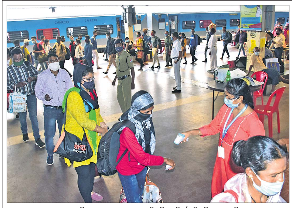
ବାହାରୁ ଆସୁଥିବା ଯାତ୍ରୀଙ୍କ ଓଡ଼ିଶା ପ୍ରବେଶ କରକଣ୍ଠକୁ କଡ଼ାକଡ଼ି କରିବାକୁ ନିର୍ଦ୍ଦେଶ ଦିଆଯିବା ପରେ ଶନିବାର ଭୁବନେଶ୍ୱର ରେଳ ଷ୍ଟେସନରେ ଯାତ୍ରୀଙ୍କ ସୁରକ୍ଷା କରାଯାଇଛି।

ଖୋର୍ଦ୍ଧା ଜିଲ୍ଲା କଟକ ତହସିଲ ଅଞ୍ଚଳରେ ପଥର ମାଡ଼ିଆକ ଦୌରାନ୍ତେ ଦିନକୁ ଦିନ ବଢ଼ିବାରେ ଲାଗିଛି। ଏହି ଅଞ୍ଚଳରେ ଦୈନିକ ବେଆଇନଭାବେ ପଥର ମାଡ଼ିଆକ କରାଯାଉଛି।