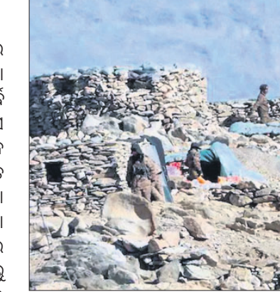
ଆଜିମୁଖ୍ୟ ପ୍ରକାଶ କରିବା ଫଳରେ ସେନା ସୂତ୍ରରୁ ଜଣାପଡ଼ିଛି। ଏକାଦଶ ଆଲୋଚନାରେ ବସିବା ପୂର୍ବରୁ ଚାଉନା ପକ୍ଷ ସମ୍ପୂର୍ଣ୍ଣ କୋରୋ ନିଷ୍ପତ୍ତି

ନୂଆଦିଲ୍ଲୀ, ୧୦୧୪: ଭାରତ ଓ ଚାଉନା ସୈନ୍ୟବାହିନୀର ୧୧ତମ କମାଣ୍ଡର ଯୁଗାନ୍ତ ଆଲୋଚନା ଶୁକ୍ରବାର ଆରମ୍ଭ ହୋଇଥିଲା। ପୂର୍ବ ଲବାଖର ଗୋଗ୍ରା ଏବଂ ହର୍ ସ୍ତ୍ରୀଙ୍କୁ ସରୁ ପ୍ରତ୍ୟାହାର କରିନେବା ପାଇଁ ଭାରତ ପକ୍ଷରୁ ଦିଆଯାଇଥିବା ପ୍ରସ୍ତାବକୁ ଚାଉନା ସେନା ପ୍ରତ୍ୟାଖ୍ୟାନ କରିଦେଇଥିବା ଜଣାପଡ଼ିଛି। ଗତ ଫେବୃୟାରୀରେ ପଞ୍ଜୋଙ୍ଗ୍ ହୋଇଥିଲା ଏବଂ ଏଡିନବର୍କରେ ଶନିବାର ମଧ୍ୟାହ୍ନରେ ଏକସମୟରେ ୪୧ ରାଉଣ୍ଡ ଡୋପ ଫୁଟାଯିବା ସହ ୮ ଦିନିଆ ଜାତୀୟ ଶୋକ ପାଳନ ଆରମ୍ଭ ହୋଇଛି।