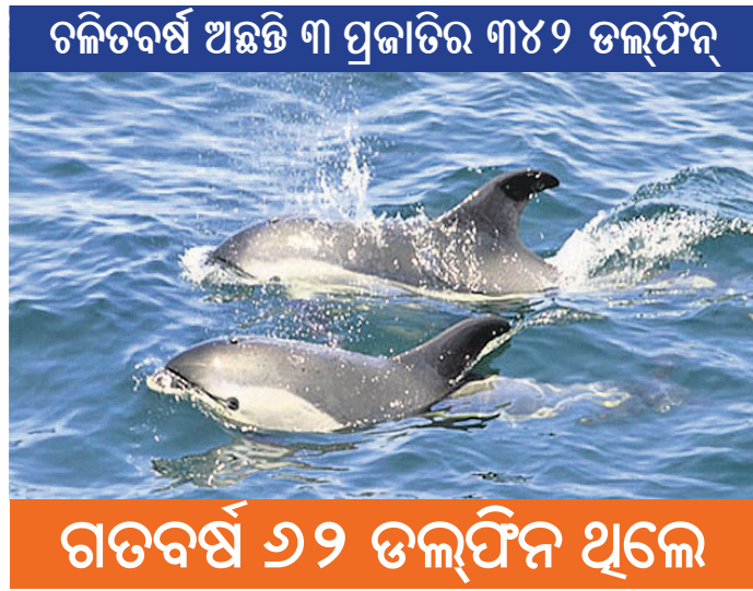
ଚଳିତବର୍ଷ ଅଛନ୍ତି ୩ ପ୍ରଜାତିର ୩୪୨ ଡଲ୍‌ଫିନ୍ ଗତବର୍ଷ ୨୨ ଡଲ୍‌ଫିନ୍ ଥିଲେ

କାତୀୟ ଉଦ୍ୟାନ ଭିତରକନିକାରେ ଗତ ୩ ବର୍ଷ ଧରି କ୍ରମାଗତ ହ୍ରାସ ପାଇଥିବା ଡଲ୍‌ଫିନଙ୍କ ସଂଖ୍ୟା ଚଳିତ ବର୍ଷ ଆଶାଘାତ ଭାବେ ବୃଦ୍ଧି ପାଇଛି । ଏହି ସାମୁଦ୍ରିକ ଅଞ୍ଚଳରେ ମୋଟ ୩ ପ୍ରଜାତିର ୩୪୨ ଡଲ୍‌ଫିନ୍ ଥିବା ଚଳିତ ବର୍ଷ ଗଣନା ସମୟରେ ତଥ୍ୟ ମିଳିଛି । ଡଲ୍‌ଫିନ ଗଣନାକୁ ନେଇ ଚଳିତ ବର୍ଷ ବହୁ ବାଦବିବାଦ ସୃଷ୍ଟି ହୋଇଥିଲା । କାନ୍ଥୁଆରୀରେ ଏହି ସାମୁଦ୍ରିକ ପ୍ରାଣୀଙ୍କ ଗଣନା ହେବାକୁ ଥିବାବେଳେ ତିଥି ଓ ପାଗକୁ ନେଇ ପରିବେଶବିତ୍‌ମାନେ ଆପତ୍ତି ଉଠାଇଥିଲେ । ଏଥିପାଇଁ ଫେବୃଆରୀରେ ଏହାର ପୁନଃଗଣନା କରାଯାଇଥିଲା ।