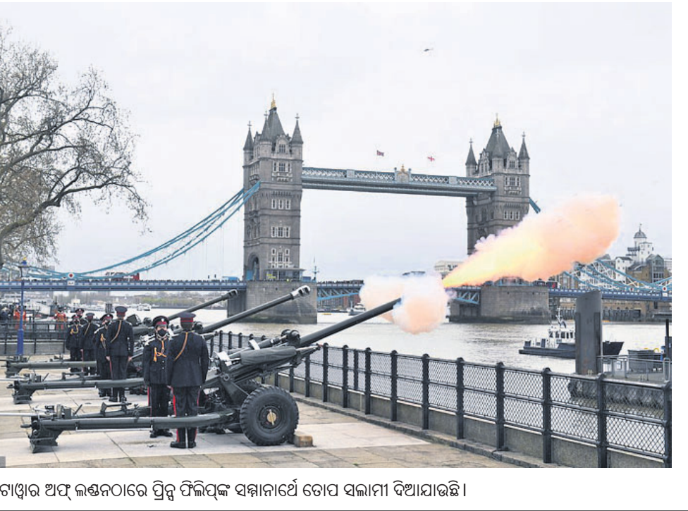
ବାଘ୍ୱାର ଅଫ୍ ଲଣ୍ଡନରେ ପ୍ରିନ୍ସ ଫିଲିପଙ୍କୁ ସମ୍ମାନାର୍ଥେ ଡୋପ ସଲାମୀ ଦିଆଯାଇଛି।