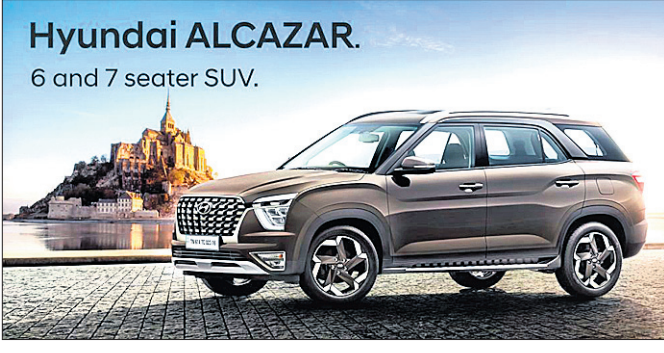
Hyundai ALCAZAR. 6 and 7 seater SUV.

ହ୍ୟୁଣ୍ଡାଇ ମୋଟର ଇଣ୍ଡିଆ ଲି. ପକ୍ଷରୁ ହ୍ୟୁଣ୍ଡାଇ ଅଲକାଜାର ପ୍ରତୀକ ପ୍ରଦର୍ଶନ କରାଯାଇଛି। ବଜାର ପ୍ରବେଶ ହେବାକୁ ଏହା ପୂର୍ବରୁ ଏହି ସୀମା ୧ ଲକ୍ଷ ଟଙ୍କା ରହିଥିଲା।