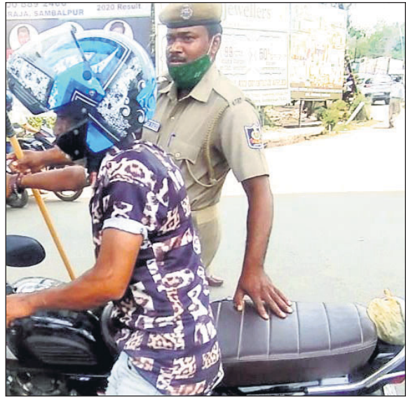
ମାଝ ଟେକି ସମୟରେ ପୋଲିସ କର୍ମଚାରୀ ଥୋଡ଼ିରେ ମାଝ ପିନ୍ଧିଛନ୍ତି ।

ସମ୍ବଲପୁର, ୧୦୧୪ (ବ୍ୟୁରୋ) ରାଜ୍ୟରେ କରୋନାଜୀବିତାକୁ ନିୟନ୍ତ୍ରଣ କରିବା ପାଇଁ ସରକାର ନୂଆ ଗାଇଦୁଲାଇନ କରିଛନ୍ତି। ୧୪ ଦିନିଆ ମାଝ ପିନ୍ଧା ଅଭିଯାନ ଭଳି କାର୍ଯ୍ୟକ୍ରମ ହାତକୁ ନେଇଛନ୍ତି। ନିୟମ ପାଳନ କରିବା ପାଇଁ ପୁଣ୍ୟମନ୍ତ୍ରୀ ଜନସାଧାରଣଙ୍କୁ ଅନୁରୋଧ କରିଛନ୍ତି। ଏଥିରେ ସ୍ୱଲପ କଲେ କଡ଼ା କାର୍ଯ୍ୟାନୁଷ୍ଠାନ ଗ୍ରହଣ କରିବାକୁ ପୋଲିସ ଓ ଜିଲ୍ଲା ପ୍ରଶାସନକୁ ନିର୍ଦ୍ଦେଶ ଦିଆଯାଇଛି। କିନ୍ତୁ ସମ୍ବଲପୁର ଜିଲ୍ଲାରେ ଖୋଦ୍ ପୋଲିସ କରୋନା କଟକଣା ମାନ୍ୟ ନ ଥିବା ଦେଖାଯାଇଛି। ନିଜେ ଠିକ୍ରେ ମାଝ ପିନ୍ଧି ନ ଥିବାବେଳେ ମାଝ ଟେକି ନାମରେ ଲୋକଙ୍କଠାରୁ ମୋଟା ଅକ୍ଷର ଜରିମାନା ଆଦାୟ କରୁଛି। ନିୟମ ଦୃଷ୍ଟିରୁ ପୋଲିସ କୌଣସି ଲୋକଙ୍କୁ ଦୂର୍ବ୍ୟବହାର ପ୍ରଦର୍ଶନ କରିପାରିବ ନାହିଁ। ଯଦି କୌଣସି ବ୍ୟକ୍ତି କଟକଣା ନ ମାନେ ତା' ଉପରେ ଜରିମାନା କିମ୍ବା ଆଇନଗତ କାର୍ଯ୍ୟାନୁଷ୍ଠାନ ଗ୍ରହଣ କରିବାର କ୍ଷମତା ଦିଆଯାଇଛି। ହେଲେ କ୍ଷମତାର ଅପବ୍ୟବହାର କରି ପୋଲିସ ଦୂର୍ବ୍ୟବହାର ପ୍ରଦର୍ଶନ କରୁଥିବା ଅଭିଯୋଗ ହେଉଛି।