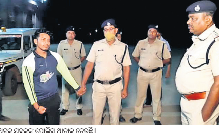
ଅଟକ ମୁକ୍ତକରି ପୋଲିସ୍ ଥାନାକୁ ନେଉଛନ୍ତି ।