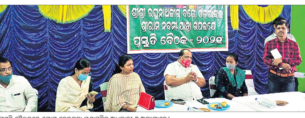
ପ୍ରସ୍ତୁତି ବୈଠକରେ ଯୋଗ ଦେଇଥିବା ପ୍ରଶାସନିକ ଅଧିକାରୀ ଓ ଅନ୍ୟମାନେ ।

ଓଡ଼ିଶା ଶ୍ରୀକ୍ଷେତ୍ର ଭାବେ ପରିଚିତ ନୟାଗଡ଼ ଜିଲ୍ଲା ଓଡ଼ିଶାରେ ବିଭେଦ ଶ୍ରୀରତ୍ନନାଥଜୀଉଙ୍କ ପ୍ରସିଦ୍ଧ ଶ୍ରୀରାମନବମୀ ଯାତ୍ରା ନିମନ୍ତେ ଯୋଜନା ପରିସ୍ପନ୍ଧ ସଭାଗୃହରେ ପ୍ରସ୍ତୁତି ବୈଠକ ଅନୁଷ୍ଠିତ ହୋଇଯାଇଛି ।