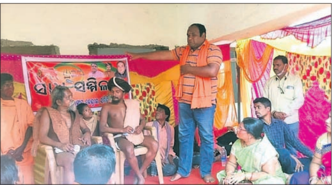
କାର୍ଯ୍ୟକ୍ରମରେ ଉପସ୍ଥିତ ଅତିଥି ଏବଂ ଅନ୍ୟମାନେ।

ନବରଙ୍ଗପୁର ଜିଲ୍ଲାର ବିଭିନ୍ନ ସ୍ଥାନରେ ନବରଙ୍ଗପୁର ଜିଲ୍ଲାର ବିଭିନ୍ନ ସ୍ଥାନରେ ନବରଙ୍ଗପୁର ଜିଲ୍ଲାର ବିଭିନ୍ନ ସ୍ଥାନରେ