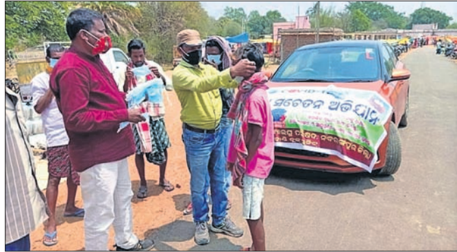
ଶ୍ରୀକ୍ଷିଆନ ସଂଖ୍ୟାଲତା ପରିଷଦ ସଦସ୍ୟମାନେ ମାଝ ବିତାଉଛନ୍ତି।

ନବରଙ୍ଗପୁର/ନହାହାଣ୍ଡି, ନବରଙ୍ଗପୁର/ନହାହାଣ୍ଡି, ନବରଙ୍ଗପୁର/ନହାହାଣ୍ଡି, ନବରଙ୍ଗପୁର/ନହାହାଣ୍ଡି, ନବରଙ୍ଗପୁର/ନହାହାଣ୍ଡି,