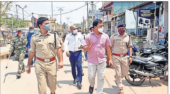
ଅଧିକାରୀମାନେ କୋଭିଡ୍ କଟକଣା ପାଳନ ସମ୍ପର୍କରେ ଯାଞ୍ଚ କରୁଛନ୍ତି।

ନବରଙ୍ଗପୁର ଜିଲ୍ଲାରେ କରୋନା ନବରଙ୍ଗପୁର ଜିଲ୍ଲାରେ କରୋନା ନବରଙ୍ଗପୁର ଜିଲ୍ଲାରେ କରୋନା