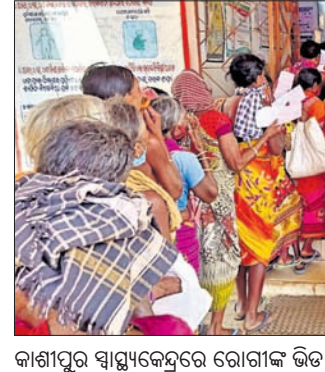
କାଶୀପୁର ସ୍ୱାସ୍ଥ୍ୟକେନ୍ଦ୍ରରେ ରୋଗୀଙ୍କ ଭିଡ଼ ଜମିଛି।

ଏବଂ ଏପି ନିଜେ ଦୋକାନ, ବଜାର ଏବଂ ଏପି ନିଜେ ଦୋକାନ, ବଜାର ଏବଂ ଏପି ନିଜେ ଦୋକାନ, ବଜାର