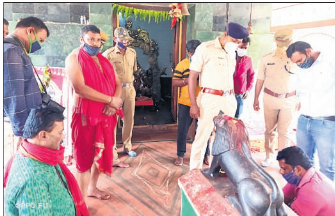
ପୋଲିସ, ସାଇଣ୍ଟିଫିକ୍ ଟିମ୍ ଓ ଡି.ଏ.ଏ. ଉପସ୍ଥିତରେ ଚୋରକୁ ଚାଲୁଛନ୍ତି।

ରାୟଗଡ଼ା ଜିଲ୍ଲା ବିଷମକଟକ ସହରର ରାୟଗଡ଼ା ଜିଲ୍ଲା ବିଷମକଟକ ସହରର ରାୟଗଡ଼ା ଜିଲ୍ଲା ବିଷମକଟକ ସହରର