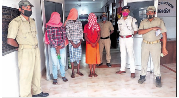
ପୋଲିସ ଗହଣରେ ରିଟ୍ ଅଭିଯୋଗମାନେ।

ପାତ ମାରି ଜଣେ ଲୋକଙ୍କଠାରୁ ପାତ ମାରି ଜଣେ ଲୋକଙ୍କଠାରୁ ପାତ ମାରି ଜଣେ ଲୋକଙ୍କଠାରୁ