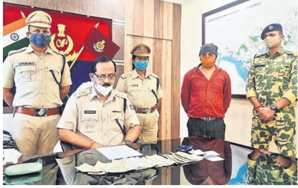
ଏସ୍ପିକ୍ ଖବରଦାତା ସମ୍ମିଳନୀରେ ହାଜର ହୋଇଥିବା ଅଭିଯୁକ୍ତ