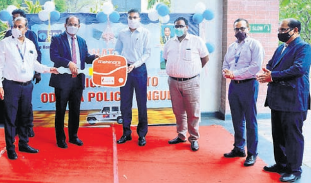
ଅନୁଗୋଳ ପୋଲିସ୍‌କୁ ଏସ୍‌ପିଏଲ୍ ପକ୍ଷରୁ ଗାଡ଼ି ଚାପ ପ୍ରଦାନ କରାଯାଇଛି।