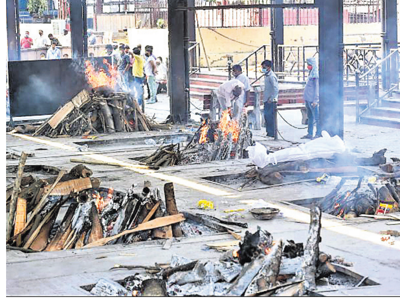
ଦିଲ୍ଲୀର ନିଗମବୋଧ ଶୁଶ୍ରୁଣାଘାଟରେ କୋଭିଡ଼ ମୃତକଙ୍କ ଚିତା ଜଳୁଛି।