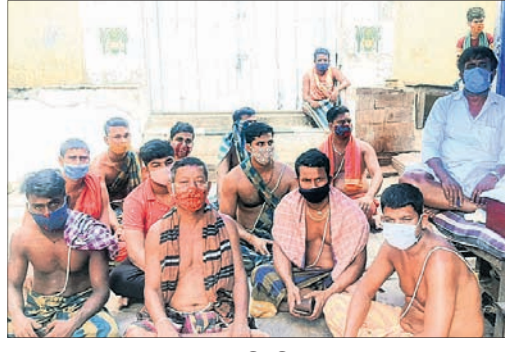
ସେବାୟତମାନେ ଧାରଣାରେ ବସିଛନ୍ତି।

ଆରକ୍ତି, ୧୫୪୪ (ଡି.ଏନ.ଏ.) ଭଦ୍ରକ ଜିଲ୍ଲା ଆରକ୍ତି ଆଖଣ୍ଡଳମଣି ମନ୍ଦିରର କଣେ ସେବାୟତ କରୋନା ପଞ୍ଜିଟିଭ୍ ହିସାବ ହୋଇଛନ୍ତି। ଏହି ଜିଲ୍ଲା ପ୍ରଶାସନ ପକ୍ଷରୁ ଚୁକ୍ତିବାର ସକାଳ ୮ଟାରୁ ୩ ଦିନ ପାଇଁ ମନ୍ଦିରରେ ସାଧାରଣ ଦର୍ଶନ ବନ୍ଦ ଘୋଷଣା କରାଯାଇଛି। ସେବାୟତମାନେ ଯଥାଚାରିତ ମନ୍ଦିରରେ ପୂଜାର୍ଚ୍ଚନା କରିପାରିବେ। କିନ୍ତୁ ଶ୍ରଦ୍ଧାଳୁମାନେ ମନ୍ଦିର ଭିତରକୁ ଯାଇପାରିବେ ନାହିଁ କି ବାବାଙ୍କୁ ଦର୍ଶନ କରିପାରିବେ ନାହିଁ ବୋଲି ପ୍ରଶାସନ ନିର୍ଦ୍ଦେଶନା ଜାରି କରିଛି। ଏହି ନିର୍ଦ୍ଦେଶନାମା ମନ୍ଦିର ପ୍ରଶାସନ ପାଠରେ ତାକସାଳି ଯନ୍ତ୍ରରେ ପ୍ରଚାର କରିଛି। କିନ୍ତୁ ପ୍ରଶାସନର ଏହି ନିଷ୍ପତ୍ତିକୁ ପ୍ରତିବାଦ କରିଛନ୍ତି ସେବାୟତ। ସେମାନଙ୍କ ଜୀବନ ଜାତିକାକୁ ନେଇ ପ୍ରଶାସନ ଖେଳ ଖେଳୁଥିବା ଅଭିଯୋଗ କରିଛନ୍ତି। ଏହାର ପ୍ରତିବାଦରେ ସେମାନେ ଚୁକ୍ତିବାର ମନ୍ଦିର ଦକ୍ଷିଣଦ୍ୱାର ସମ୍ମୁଖରେ ଧାରଣାରେ ବସି ରହିଥିଲେ। ମନ୍ଦିର ବନ୍ଦ ନିର୍ଦ୍ଦେଶ ପ୍ରତ୍ୟାହାର ନ ହେଲେ ସେମାନେ ଠିକ୍ କରୁ ନାହିଁ ନିତିକାଠି କରିବେ ନାହିଁ ବୋଲି ଚେତାବନୀ ଦେଇଛନ୍ତି। ଅନ୍ୟପକ୍ଷେ କୋଭିଡ୍ ଆକ୍ରାନ୍ତ ସେବାୟତ କେଉଁଆଡ଼େ ଚାଲିଯାଇଥିବା ସେମାନେ ପ୍ରକାଶ କରିଛନ୍ତି। ପ୍ରଶାସନ ତାଙ୍କୁ କୋଭିଡ୍ ହସ୍ପିଟାଲରେ ଚିକିତ୍ସା କରିବା ସହ ଭୁବନ ସମସ୍ତ ସେବାୟତଙ୍କ ଚେଷ୍ଟା କରାଇବାକୁ ଦାବି କରିଛନ୍ତି। ଅପରାହ୍ନରେ