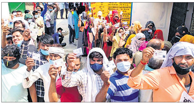
ଆଗ୍ରା ନିକଟସ୍ଥ ଏକ ଖୁସିରେ ଗ୍ରାମପଞ୍ଚାୟତ ନିର୍ବାଚନ ପାଇଁ ଭୋଟ ଦେବାକୁ ଯାଇଛନ୍ତି ମତଦାନୀ।

ଲକ୍ଷ୍ନୋ, ୧୫୪୪: ଭରତ ପ୍ରଦେଶରେ ଜିଲା ପରିଷଦ, ପଞ୍ଚାୟତ ସମିତି ଓ ଗ୍ରାମ ପଞ୍ଚାୟତ ନିର୍ବାଚନ ଗୁରୁବାର ଶେଷ ହୋଇଛି। ଅପରାହ୍ଣ ୫ଟା ସୁଦ୍ଧା ୬୧% ମତଦାନ ହୋଇଥିବା ରାଜ୍ୟ ନିର୍ବାଚନ କମିଶନ (ଏସ୍.ଏଚ୍.ଏସ୍) ସୂଚନା ଦେଇଛନ୍ତି। କେତେକ ସ୍ଥାନରେ ସାମାଜିକ ବିବାଦକୁ ଛାଡ଼ିଦେଲେ ଭୋଟ ଗ୍ରହଣ ଶକ୍ତିପୂର୍ଣ୍ଣ ହୋଇଛି। ଝାଡ଼ିରେ ସର୍ବାଧିକ ୬୯.୭୫% ମତଦାନ ହୋଇଛି। ୨.୨୧ ଲକ୍ଷ ସର୍ବପାର୍ଶ୍ୱ ମତଦାନକୁ ୩.୩୩ ଲକ୍ଷ ପ୍ରାର୍ଥୀ ଓହ୍ଲାଇଥିଲେ। କେନ୍ଦ୍ର କୃଷି ଆଇନ ପ୍ରତ୍ୟାହାର ଦାବିରେ କୃଷକ ଆନ୍ଦୋଳନର ନେତୃତ୍ୱ ନେଉଥିବା ଭାରତୀୟ କିଷାନ ଯୁନିୟନ୍ (ବିକେୟୁ) ଉକ୍ତ ନିର୍ବାଚନରେ ଭାଜପାକୁ ଭୋଟ ନ ଦେବା ପାଇଁ ମତଦାତାଙ୍କୁ ଅନୁରୋଧ କରିଥିଲା।