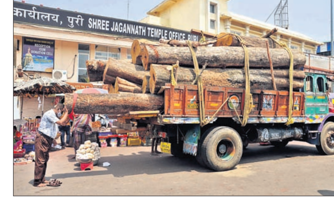
ନୟାଗଡ଼ରୁ ରଥକାଠ ନେଇ ପୁରୀ ବଡ଼ବାଣରେ ପହଞ୍ଚିଥିବା ଟ୍ରକ।