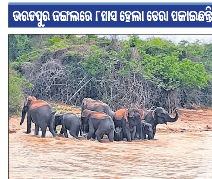
ଭରତପୁର ଜଙ୍ଗଲ ଭିତରେ ଥିବା ଏକ ଜନାଶୟରେ ହାତୀଙ୍କ ଜଙ୍ଗଲଟା।

ଆସୁଛନ୍ତି। ଭୁବନେଶ୍ୱର ବନାଞ୍ଚଳ ପ୍ରାୟ ସମୟରେ ହାତୀପଲକୁ କର୍ମଚାରୀମାନେ ପାଟ୍ରୋଲିଂ କଲାବେଳେ ଭେଟୁଛନ୍ତି ବୋଲି ସମ୍ବାର କହିଛନ୍ତି।