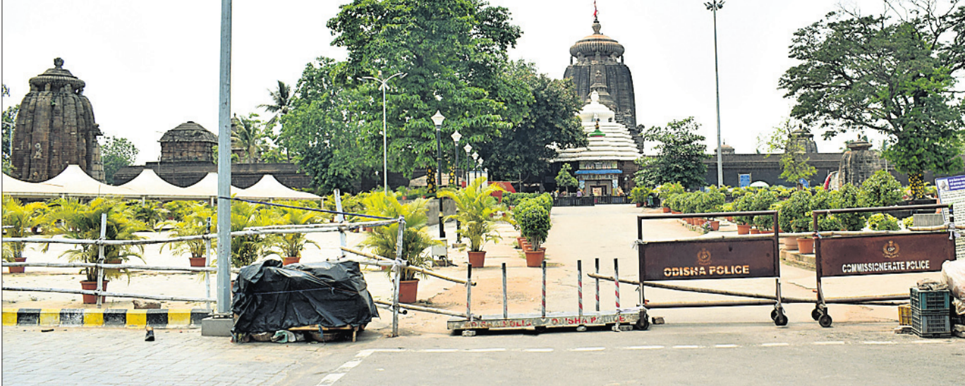
କରୋନା ସଂକ୍ରମଣକୁ ରୋକିବା ପାଇଁ ଶ୍ରୀଲିଙ୍ଗରାଜ ମନ୍ଦିରରେ ସର୍ବସାଧାରଣଙ୍କ ଦର୍ଶନକୁ ବନ୍ଦ କରାଯାଇଥିବାବେଳେ ପ୍ରବେଶ ପଥକୁ ବନ୍ଦ କରିଦିଆଯାଇଛି।

ଛକ, ହରତଣା ଛକ, ମୁନା ମେଡିକାଲ ଗଳି, ସୁନାମା ଗୋଟ ଗଳି ପତ୍ତୁ ଓ ଅନ୍ୟ ସାହି ରାସ୍ତା ଅଥବା ଗଳି ଯାହାକି ରଥରୋଡ଼ ସହିତ ସଂଯୋଗାକରଣ କରାଯାଇଛି, ସେହି ରାସ୍ତା ବା ଗଳିକୁ କୌଣସି ଯାନବାହନ ରଥ ରୋଡ଼ରେ ରଥ ରୋଡ଼ରେ ଯିବାକୁ ଅନୁମତି ଦିଆଯିବ ନାହିଁ। ଗାଡ଼ିରୁଟିକ ମାଉସା ମା' ଛକଠାରୁ ମ୍ୟୁଜିକମ ଛକ ଆଡ଼କୁ କିମ୍ବା ବିଦେକାନନ୍ଦ ମାର୍ଗଦେଇ ଯିବା ଆସିବା କରିପାରିବେ। ରଥ ରୋଡ଼ରେ ବାରିକ ସାହି, ମହାରଣା ସାହି ଗଳି, ଗୋପାଳଗେଶ୍ୱର ଛକ ଗଳି, ଶାନ୍ତକଣ୍ଠା ଛକ ଗଳି, ତିନିମୁଣ୍ଡିଆ ଧାରା ୯୬ ଅନୁସାରେ ୫୦୦ଟି ବା ସର୍ବାଧିକ ୧୦୦୦ ଟଙ୍କା ପର୍ଯ୍ୟନ୍ତ କରିମାନା ଦେବାକୁ ପଡିବ ବୋଲି ଜାରି ଗାଇଡ଼ଲାଇନରେ ଉଲ୍ଲେଖ ରହିଛି। ସୁନାମାଯୋଗ୍ୟ, କେତେଜଣ ସେବାୟତ ସଂକ୍ରମିତ ହେବା ପରେ ଶ୍ରଦ୍ଧାଳୁଙ୍କ ପାଇଁ ଅନିଷ୍ଟ କାଳ ଲାଗି ଶ୍ରୀଲିଙ୍ଗରାଜ ମନ୍ଦିର ବନ୍ଦ କରାଯାଇଛି। ଏହି ସମୟରେ ସେବାୟତଙ୍କ ଦ୍ୱାରା ମନ୍ଦିରରେ ଠାକୁରଙ୍କ ଦୈନିକ ନାତିକାନ୍ତି ବିଧି ଅନୁସାରେ କରାଯିବ ଓ ରୁକୁଣା ରଥଯାତ୍ରା କୋଭିଡ଼ ଗାଇଡ଼ଲାଇନ ଭିତରେ ଅନୁଷ୍ଠିତ ହେବ ବୋଲି ପୂର୍ବରୁ ବିଏମ୍‌ସି ପକ୍ଷରୁ ନିର୍ଦ୍ଦେଶନାମା ପ୍ରକାଶ ପାଇଥିଲା।