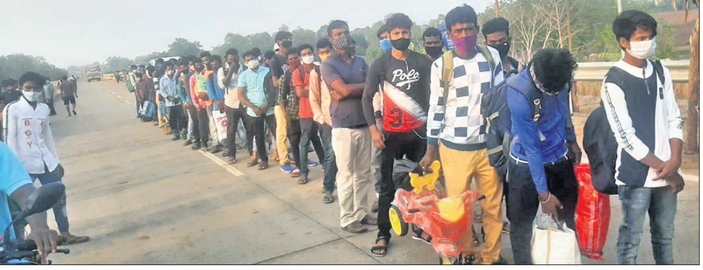
ମାଲକାନଗିରି ଜିଲ୍ଲା ସୀମାନ୍ତ ମୋଟୁରେ ପହଞ୍ଚିଥିବା ପ୍ରବାସୀ ଶ୍ରମିକ ।

ମାଲକାନଗିରି, ୧୯୮୪ (ଡି.ଏନ୍.ଏ.) କରୋନାର ବିଚାର ଲହରୀ ସମସ୍ତଙ୍କୁ ଚିନ୍ତାରେ ପକାଇଛି। ଏହାର ପ୍ରଭାବ ଦକ୍ଷିଣ ଭାରତରେ ବହୁଳ ମାତ୍ରାରେ ଦେଖିବାକୁ ମିଳୁଛି। ସେହିସବୁ ରାଜ୍ୟରେ କାର୍ଯ୍ୟ କରୁଥିବା ଓଡ଼ିଶାର ପ୍ରବାସୀ ଶ୍ରମିକମାନେ ଏବେ ଘରକୁ ଫେରିବାରେ ଲାଗିଛନ୍ତି। ମାଲକାନଗିରି ଜିଲ୍ଲା ଆନ୍ତ୍ର ଓ ତେଲଙ୍ଗାନା ସୀମାନ୍ତ ମୋଟୁରେ ସୋମବାର ଗୋଟିଏ ଦିନରେ ୬୪୦ ପ୍ରବାସୀ ଶ୍ରମିକ ଫେରିଥିବା ତହସିଲଦାର ଏବଂ ତାନ୍ତ୍ରୀକ ଟ୍ରେଷ୍ଟି କମିଟିରୁ ସଙ୍ଗରେ ସମୀକ୍ଷା କରାଯାଇଛି। ସେମାନେ ଏକ ରୁକ୍ଷପତ୍ର ସ୍ୱାକ୍ଷର କରି ୭ଦିନ ଗୃହ ସ୍ଥଳରୋଧରେ ରହିବା ପାଇଁ ପରାମର୍ଶ ଦିଆଯାଇଛି। ପୋଲିସ ଏବଂ ତାନ୍ତ୍ରୀକ ଦଳ ମୋଟୁରେ ରହି ଏହି ପ୍ରବାସୀ ଶ୍ରମିକଙ୍କୁ ଚଳଣି କରୁଛନ୍ତି। ତେବେ ଆଗାମୀ ଦିନରେ ଏହି ସଂଖ୍ୟା ବହୁ ପରିମାଣରେ ବୃଦ୍ଧି ପାଇବା ସମ୍ଭାବନା ରହିଛି। ଗତବର୍ଷ ଏପ୍ରିଲ ଓ ମେ ମାସରେ ବିଭିନ୍ନ ରାଜ୍ୟରୁ ପ୍ରାୟ ୬୦ ହଜାରରୁ ଊର୍ଦ୍ଧ୍ୱ ଶ୍ରମିକ ଚାମିଲନାୟ, କେରଳ, ଆନ୍ଧ୍ରପ୍ରଦେଶ ଓ ତେଲଙ୍ଗାନାରୁ ମୋଟୁ ସୀମାନ୍ତରେ ନିଜ ନିଜ ଜିଲ୍ଲାକୁ ଯାଇଥିଲେ। ମାଲକାନଗିରି ଜିଲ୍ଲାରେ ମୋଟୁରେ ଏକ ସ୍ୱତନ୍ତ୍ର କମ୍ପ୍ୟୁଟର କୋର୍ଡ୍ ପ୍ରତିଷ୍ଠା କରାଯାଇ ପ୍ରବାସୀ ଶ୍ରମିକଙ୍କୁ ଚାମିଲନାୟ କରିବା ପାଇଁ ପରାମର୍ଶ ଦିଆଯାଇଛି।