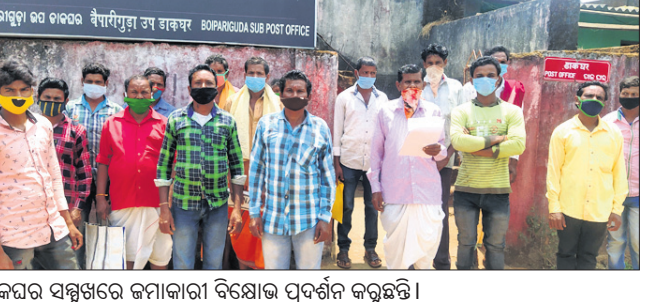
ଡାକଘର ସମ୍ମୁଖରେ କର୍ମଚାରୀ ବିକ୍ଷୋଭ ପ୍ରଦର୍ଶନ କରୁଛନ୍ତି।

କେତେକଙ୍କ ଆରତି ଖାତାର ଦିଆଯିବା ପୂର୍ବରୁ ହେଉଥିବା ସେବୁ ଖାତାରୁ ସେ କୌଣସିକ୍ରମେ ମାଡିଗୁଡ଼ା। ଆରଡି, ଏସି ଓ ସୁକନ୍ୟା ଯୋଜନାର କର୍ମଚାରୀଙ୍କୁ ପୁରୁଣା ଖାତା ବଦଳରେ ନୂଆ ଖାତା ଦେବା ଆଳରେ ସେମାନଙ୍କୁ ୫ ଶହ ଟଙ୍କା ସହ କର୍ମଖାତା ମାରି ଆଣିଥିଲେ। ପରବର୍ତ୍ତୀ ସମୟରେ କର୍ମଚାରୀମାନେ ଅର୍ଥ ଉଠାଇବାକୁ ଗଲେ କିମ୍ପା ପାହୁଙ୍କ ମାରିଗଲେ ବିଭିନ୍ନ କଥା କହି ସେମାନଙ୍କୁ ଫେରାଇ ଦେଉଥିଲେ। ଫେବୃଆରୀ ୧ରେ ପୋଷ୍ଟ ମାଷ୍ଟର ଜଣକ ଆହତ୍ୟା କରିଦେଇଥିଲେ। ଏନେଇ କର୍ମଚାରୀଙ୍କ ମନରେ ସନ୍ଦେହ ସୃଷ୍ଟି ହୋଇଥିଲା। ସେମାନେ ଡାକଘରକୁ ଯାଇ ସେମାନଙ୍କ ଆକାଉଣ୍ଟ ନମ୍ବର ଯାଞ୍ଚି ଦେଖି ଡାକଘରରେ ସେମାନଙ୍କ ଖାତାରେ ଟଙ୍କା କର୍ମା ହୋଇ ନ ଥିବା ଜାଣିବାକୁ ପାଇଥିଲେ।