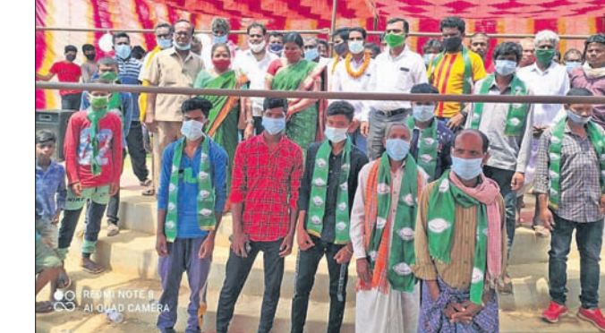
ବିକେତରେ ସାମିଲ ହୋଇଥିବା ପରିବାର ।