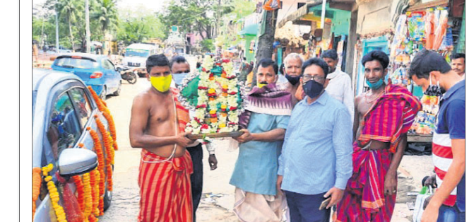
ଆଜ୍ଞାନାଳ ପଠାଯିବା ବେଳେ ମହିର ପରିସରରେ ଉପସ୍ଥିତ ସେବାୟତ ଓ ଅନ୍ୟମାନେ।