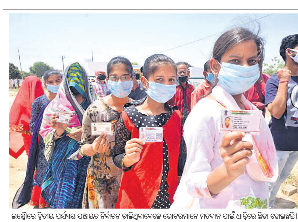
ଲକ୍ଷ୍ମଣାଭିଷେକ ଦ୍ୱିତୀୟ ପର୍ଯ୍ୟାୟ ପଞ୍ଚାୟତ ନିର୍ବାଚନ ଚାଲିଥିବାବେଳେ ଭୋଟରମାନେ ମତଦାନ ପାଇଁ ଧାଡ଼ିରେ ଛିଡା ହୋଇଛନ୍ତି।