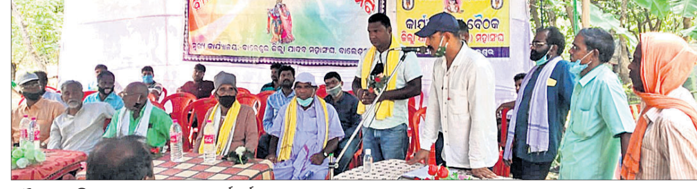
ବୈଠକରେ ଜିଲ୍ଲା ଯାଦବ ମହାସଂଘର କର୍ମକର୍ତ୍ତା।