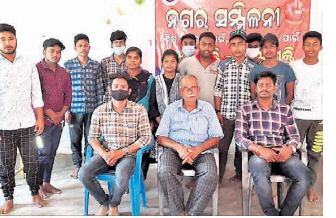
ନଗର ସମ୍ମିଳନୀରେ ଏରିଭିପି ସଦସ୍ୟ।