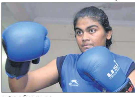
ଭିନ୍ନ ଭିନ୍ନ ପଦକ ପାଇଁ ଯୋଗ୍ୟ ହେବେ।

ପୋଲିସ୍ କମିଶନରେ ଚାକିରିରେ ଉଭୟ ପୁରୁଷ ଓ ମହିଳା ଖେଳାଳିଙ୍କୁ ଚାକିରିରେ ଯୋଗ୍ୟ ହେବେ।