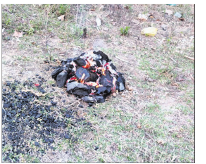
ଚିହ୍ନଟ ହୋଇଥିବା ମା' ହିଙ୍ଗୁଳାଙ୍କ ଉତ୍ତାପ୍ଳାମୀ

ତାଳଚେରର ଅଧିକାରୀ ଦେବୀ ଅଗ୍ନିପୁତ୍ରୀ ମା' ହିଙ୍ଗୁଳାଙ୍କ ଉତ୍ତାପ୍ଳାମୀ ରବିବାର ରାତିରେ ଚିହ୍ନଟ ହୋଇଛି। ଗୋପାଳପ୍ରସାଦସ୍ଥିତ ହିଙ୍ଗୁଳା ମନ୍ଦିର ପଶ୍ଚିମ ଦିଗରେ ପ୍ରାୟ ଏକ କିଲୋମିଟର ଦୂର ଉଚ୍ଚ ବିଦ୍ୟାଳୟ ପାଟେରି ନିକଟସ୍ଥ ପଡିଆରେ ମା' ଅଗ୍ନିପୁତ୍ରୀ ଆବିର୍ଭାବ ହୋଇଛନ୍ତି। ରବିବାର ମଧ୍ୟ ରାତ୍ରିରେ ଦେହୁରା ମା'ଙ୍କୁ ଶାବରୀ ମନ୍ତ୍ରରେ ଆରାଧନା କରି ବଶାଭୂତ କରିବା ସହ କୋଇଲା ସଂଯୋଗ କରି ଉତ୍ତାପ୍ଳାମୀ ଚିହ୍ନଟ କରିଥିଲେ। ତେବେ କୋରୋନା ସଂକ୍ରମଣକୁ ଦୃଷ୍ଟିରେ ରଖି ଚଳିତ ବର୍ଷ ମା'ଙ୍କ ଉତ୍ତାପ୍ଳାମୀ ଚିହ୍ନଟକୁ ଶ୍ରଦ୍ଧାଳୁମାନଙ୍କୁ ବାରଣ କରାଯାଇଛି। ତେଣୁ ଆବିର୍ଭାବସ୍ଥଳୀରେ ପୋଲିସ୍ ମୁତୟନ କରାଯାଇଛି। ମା' ହିଙ୍ଗୁଳାଙ୍କ ପ୍ରସିଦ୍ଧ ଯାତ୍ରା ଆସନ୍ତା ୨୬ ତାରିଖ ଠାରୁ ଆରମ୍ଭ ହେଉଥିଲେ ମଧ୍ୟ ସେଥିରେ