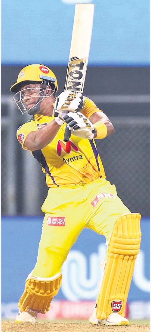
ଚେନ୍ନାଇର ଟିମ୍ ପାଇଁ ଖେଳିବା ପାଇଁ ଯୋଗ୍ୟ ହେବେ।

ହୋଇଯାଇଥିଲା। ରାଜଗୁପ୍ତା ପକ୍ଷରୁ ଚେନ୍ନାଇର ଯୋଗଦାନରେ ଚେନ୍ନାଇର ଟିମ୍ ପାଇଁ ଖେଳିବା ପାଇଁ ଯୋଗ୍ୟ ହେବେ।