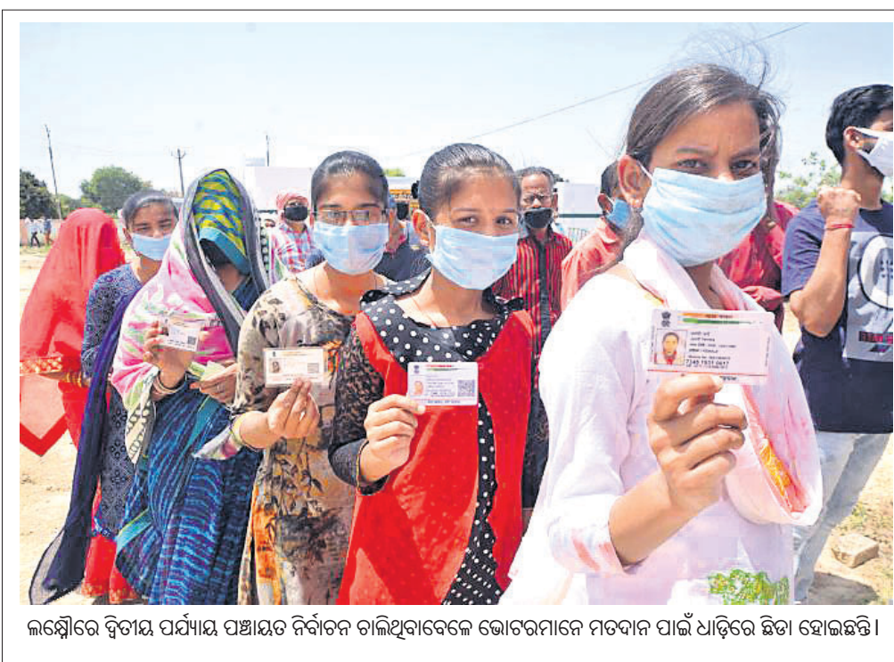
ଲକ୍ଷ୍ମଣାଭ୍ୟାସ ପର୍ଯ୍ୟାୟ ପଞ୍ଚାୟତ ନିର୍ବାଚନ ଚାଲିଥିବାବେଳେ ଭୋଟରମାନେ ମତଦାନ ପାଇଁ ଧାଡ଼ିରେ ଛିଡ଼ା ହୋଇଛନ୍ତି।