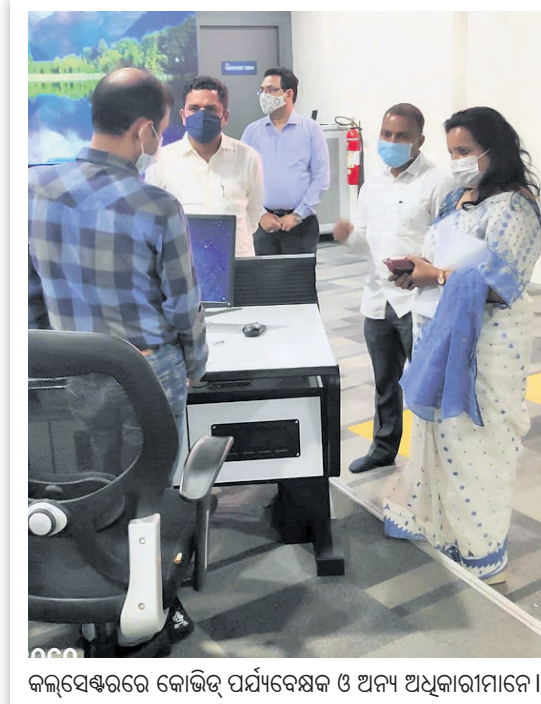
କଲ୍‌ସେଣ୍ଟରରେ କୋଭିଡ୍ ପର୍ଯ୍ୟବେକ୍ଷକ ଓ ଅନ୍ୟ ଅଧିକାରୀମାନେ।

ମଙ୍ଗଳବାରଠାରୁ କୁହେଲୁ କାର୍ଯ୍ୟକ୍ରମ ହେବ ଏବଂ ଖୁବ୍‌ଶୀଘ୍ର ସର୍ତ୍ତ ଓ କିନ୍ଦ୍ୱ କୋଭିଡ୍ ହସ୍ପିଟାଲକୁ କାର୍ଯ୍ୟକ୍ରମ କରାଯିବ।