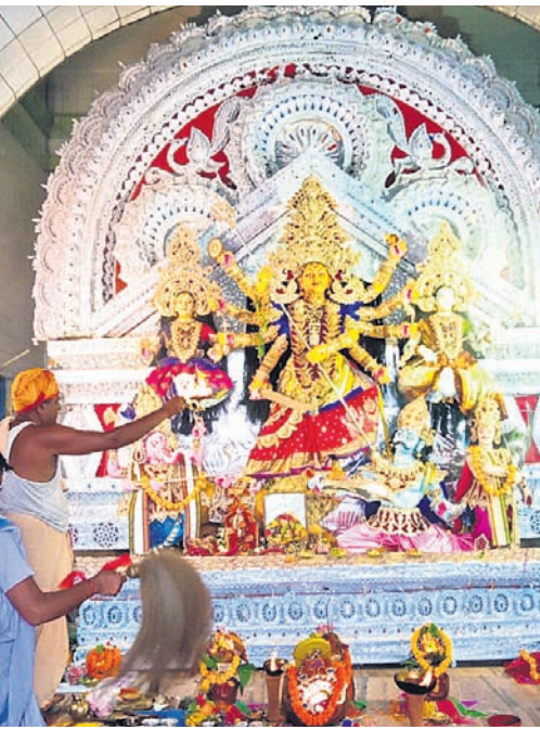
କଟକ ବାଲୁବଜାର ବିନୋଦ ବିହାରୀ ପୂଜା ମଣ୍ଡପ ଓ ରାଧିନୀଶୈଳୀ ପୂଜା ମଣ୍ଡପରେ ସୋମବାର ଅନୁଷ୍ଠିତ ମା' ବାସନ୍ତୀପୂର୍ଣ୍ଣିକା ମହାସପ୍ତମୀ ପୂଜା।