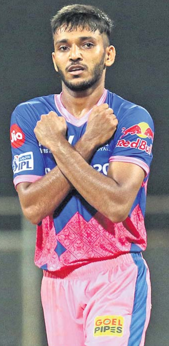
୩ ଉଇକେଟ ହାସଲକାରୀ ରାଜଗୁପ୍ତା ଚେନ୍ନାଇର ଯୋଗଦାନରେ ଚେନ୍ନାଇର ଟିମ୍ ପାଇଁ ଖେଳିବା ପାଇଁ ଯୋଗ୍ୟ ହେବେ।