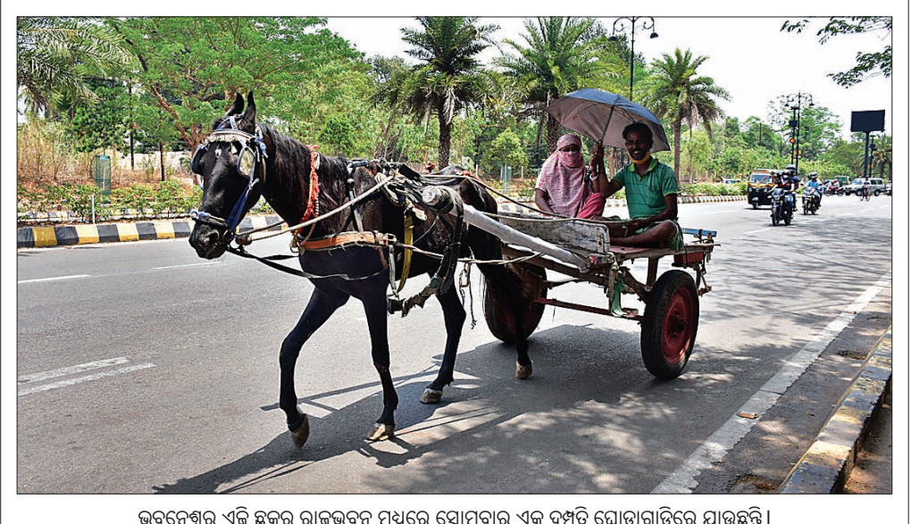
ଭୁବନେଶ୍ୱର ଏକ ଛକକୁ ରାଜଭବନ ମଧ୍ୟରେ ସୋମବାର ଏକ ବନ୍ଧିତ ଘୋଡ଼ାଚାଡ଼ିରେ ଯାଉଛନ୍ତି ।