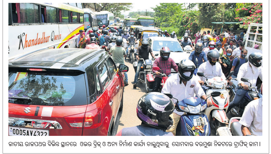
ଜାତୀୟ ରାଜପଥର ବିଭିନ୍ନ ସ୍ଥାନରେ ଓଭର ବ୍ରିଜ୍ ଓ ଅନ୍ୟ ନିର୍ମାଣ କାର୍ଯ୍ୟ ଚାଲୁଥିବାରୁ ଯୋଗାଣ ବରମୁଣ୍ଡା ନିକଟରେ ଗ୍ରାମିଣ କାମୀ।

ପୁରୁଣାଭୁବନେଶ୍ୱର, ୧୯୪ (ବ.ଏ.ଏ.ଏ.): ମଙ୍ଗଳବାର ପୂର୍ବାହ୍ନରେ ମନ୍ତ୍ରୀ ପ୍ରଫୁଲ୍ଲ କୁମାର ମଲିକ ଓ ଅଶୋକ ଚନ୍ଦ୍ର ପଣ୍ଡା ନିର୍ମାଣାଧୀନ ଧରଳି ସେତୁ, ଚନ୍ଦ୍ର ସେତୁ ଏବଂ ଭାର୍ଗବୀ ନଦୀ ସେତୁ ପରିଦର୍ଶନ କରିଛନ୍ତି।