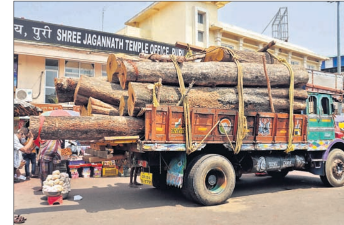
ନୟାଗଡ଼ରୁ ରଥକାଠ ନେଇ ପୁରୀ ବତବାଣ୍ଡରେ ପହଞ୍ଚିଥିବା ଟ୍ରକ।