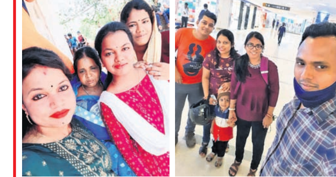
@ ମଧୁସୂତା @ ଅର୍ଚ୍ଚନା