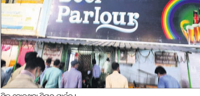
ସିଲ୍ ହୋଇଥିବା ବିୟର ପାର୍କର।

ଭୁବନେଶ୍ୱର, ୧୯୪ (ବୁଧବେଳା) ଭୁବନେଶ୍ୱର ଆଇଆରସି ଭିଲେଜରେ ଘରୋଇ ହଷ୍ଟେଲକୁ ବିଏମ୍‌ସି ପକ୍ଷରୁ ସୋମବାର ସିଲ୍ କରାଯାଇଛି।