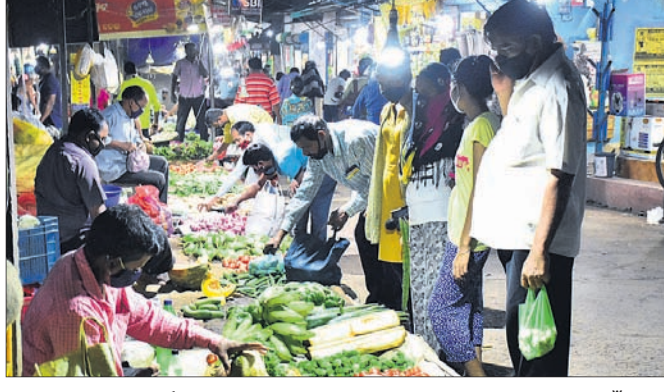
ରଘୁଲଗତ ରାସ୍ତା ପାର୍ଶ୍ୱ ପରିବା ହାଟରେ ଲୋକଙ୍କ ମଧ୍ୟରେ ସାମାଜିକ ଦୂରତା ରହିଛି।

ପୁରୁଣା ରଣକୌଶଳ ଆପଣାଉଛନ୍ତି ବିକେନ୍ଦ୍ରୀକରଣ ହେବ ହାଟ ବଜାର