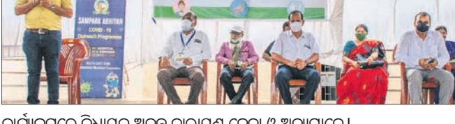
କାର୍ଯ୍ୟକ୍ରମରେ ବିଧାୟକ ଅନନ୍ତ ନାରାୟଣ ଜେନା ଓ ଅନ୍ୟମାନେ।

ଭୁବନେଶ୍ୱର, ୧୯୪ (ବୁଧବେଳା) କରୋନାର ଦ୍ୱିତୀୟ ଲହରୀକୁ ପ୍ରତିରୋଧ କରିବା ପାଇଁ ଭୁବନେଶ୍ୱର ମହାନଗର ନିଗମ (ବିଏମ୍‌ସି) ପକ୍ଷରୁ ପୁଣିଥରେ କୋଭିଡ୍ ସତରତକକୁ ସକ୍ରିୟ କରାଯାଇଛି।