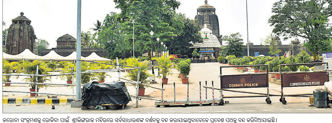
କରୋନା ସଂକ୍ରମଣକୁ ରୋକିବା ପାଇଁ ଶ୍ରୀଲିଙ୍ଗରାଜ ମନ୍ଦିରରେ ସର୍ବସାଧାରଣଙ୍କ ଦର୍ଶନକୁ ବନ୍ଦ କରାଯାଇଥିବାବେଳେ ପ୍ରବେଶ ପଥକୁ ବନ୍ଦ କରିଦିଆଯାଇଛି।

ବାଙ୍କୀ, ୧୯୮୪ (ସ୍ୱ.ପ୍ର.): ବାଙ୍କୀ ଅବକାରୀ ବିଭାଗର ସହକାରୀ ଅଧିକାରୀ ତେଜସ୍ୱର ଲାଙ୍ଗୁଳ ଚଣ୍ଡାବ୍ୟାଜରେ ୨ ଦିନ ହେବ ବାଙ୍କୀର ବିଭିନ୍ନ ସ୍ଥାନରେ ଚଢ଼ାଉ କରାଯାଉଛି। ରବିବାର ସନ୍ଧ୍ୟାରେ ଅଂଶୁପା ହ୍ରଦ ନିକଟ ଖଣ୍ଡର ସେତୁ ନିକଟରେ ଚଢ଼ାଉ କରାଯାଇ ଆଠଗଡ଼ର ଅଶୋକ ପ୍ରଧାନ(୩୯)ଙ୍କ ସ୍ମୃତିରୁ ୩୦ ଲିଟର ଚୋରା ଦେଶାମଦ ଜରତ କରାଯାଇଛି। ପରେ ଜାତପୁଣ୍ଡିଆ ଛକ ନିକଟରୁ ଆଠଗଡ଼ ପୁରୁଣା ଆଳୁକା ଗ୍ରାମର ଗର୍ଭର୍ ବେଉରା (୪୩)ଙ୍କଠାରୁ ୧୦ ଲିଟର ଚୋରା ଦେଶାମଦ ଜରତ କରାଯାଇଛି। ସୋମବାର ତମପଡ଼ା ଛକରେ ଚଢ଼ାଉ କରାଯାଇ ଆଠଗଡ଼ କନ୍ଦରପୁର ଗ୍ରାମର ଶ୍ରୀଧର ନାୟକ (୪୦)ଙ୍କ ବାଉଳକୁ ୩୦ ଲିଟର ଚୋରା ଦେଶାମଦ ଜରତ କରାଯାଇଛି। ସେହିପରି କୁସୁନ୍ଦା ଛକପା ସଦର ଅଭିମନ୍ୟୁ ଭୋଇ(୬୦)ଙ୍କଠାରୁ ୮ ଲିଟର ଦେଶାମଦ ଜରତ କରାଯାଇଛି। ସମସ୍ତ ଅଭିଯୁକ୍ତଙ୍କୁ ଗିରଫ ପରେ କୋର୍ଟ ଦାଖଲ କରାଯାଇଛି। ଏନେଇ ସଂପର୍କରେ ମାମଲା (ନଂ.୨,୩,୪,୫ /୨୧-୨୨) ରୁଜୁ ହୋଇଛି। ଚଢ଼ାଉରେ ବିଭାଗ ପକ୍ଷରୁ ଡାଏକ କୁମାର ସାମଲ, ସଞ୍ଜୟ କୁମାର ରାଉତ, ସତ୍ୟଜିତ କୁମାର ମହାରଣା ଓ ବିଶ୍ୱନାଥ ସୁରେନ୍ ପ୍ରମୁଖ ସାମିଲ ହୋଇଥିଲେ।