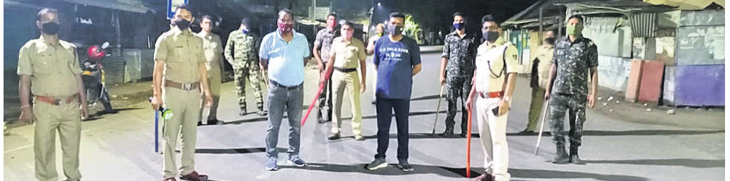
ଦଶପଲ୍ଲୀ ବିହାରୀତ ଅଞ୍ଚଳରେ ପୋଲିସ ପକ୍ଷରୁ ରାତ୍ରିକାଳୀନ ପହରା ଦିଆଯାଇଛି ।