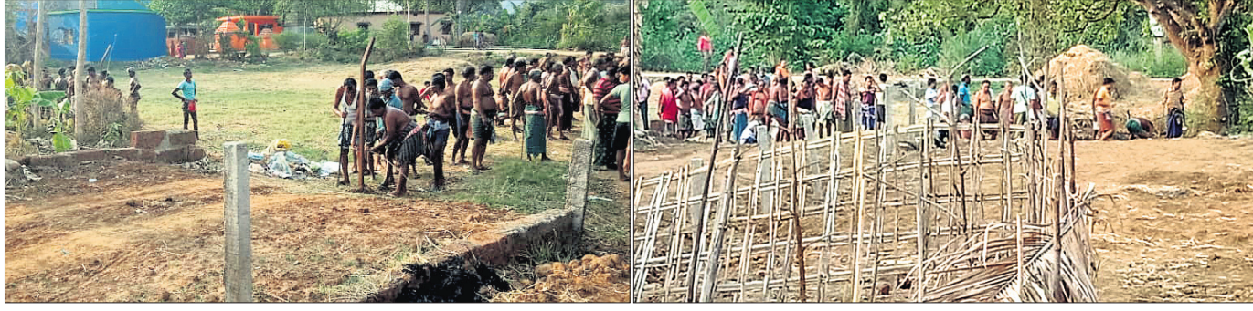
ତାଳିମପଡ଼ାର ଗାଁ ଲୋକ ରାସ୍ତା ନିର୍ମାଣକୁ ବିରୋଧ କରି ତାରବାଟୁ ପାଇଁ ଖୁଣ୍ଟ ପୋଡ଼ୁଛନ୍ତି ।