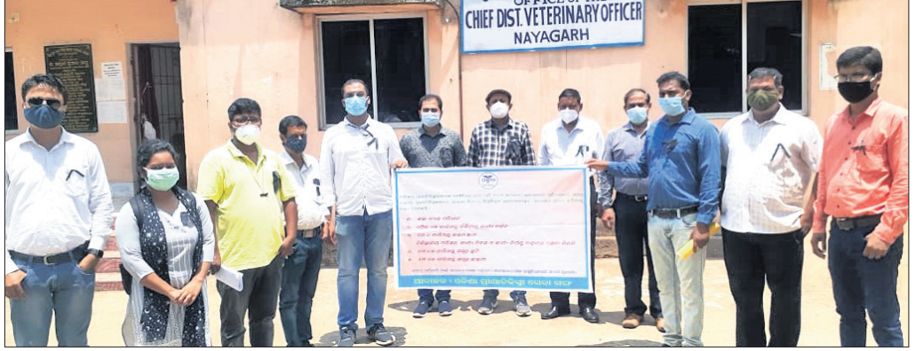
ଜିଲ୍ଲାପାଳଙ୍କୁ ଭେଟିବାକୁ ଯାଉଥିବା ପ୍ରାଣୀ ଚିକିତ୍ସକମାନେ ।