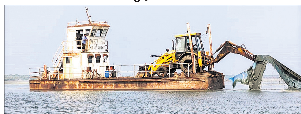
ଚିଙ୍ଗୁଡ଼ି ଘେରି ଉଚ୍ଛେଦ କରାଯାଇଛି ।

ଖଲିକୋଟ ତହସିଲ ଅଧୀନ ଚିଲିକାରେ ଥିବା ୧୫୮ ଏକର ବେଆଇନ ଚିଙ୍ଗୁଡ଼ିଘେରି ଯୋଗଦାନ ପ୍ରଶାସନ ପକ୍ଷରୁ ଉଚ୍ଛେଦ କରାଯାଇଛି । ଦୀର୍ଘଦିନ ହେବ ସମାଜନାସି, ଧର୍ମାବାଳି ଅଞ୍ଚଳରେ ବେଆଇନ ଚିଙ୍ଗୁଡ଼ି ଘେରି ଚାଲିଥିଲା । ଏହାକୁ ଭାଙ୍ଗିବା ପାଇଁ ପୂର୍ବରୁ ନୌସି ଛାଡି ହୋଇଥିଲା ।