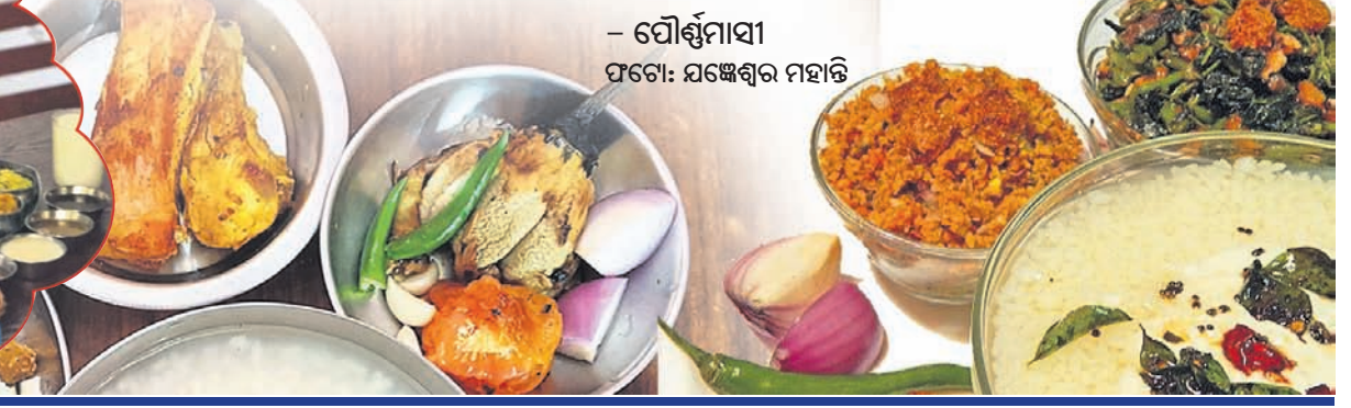
ପୌର୍ଣ୍ଣମୀ ସମୟରେ: ସଜପଣର ମହାତ୍ମା