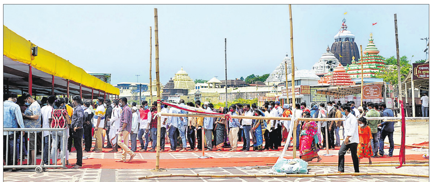
ଶନିବାର ଓ ରବିବାର ଶ୍ରୀମନ୍ଦିରରେ ବନ୍ଦ ରହିଥିଲା। ସୋମବାର ଖୋଲିବା ପରେ ଶ୍ରଦ୍ଧାଳୁମାନେ କୋଭିଡ୍ ନେଗେଟିଭ ରିପୋର୍ଟ ଦେଖାଇ ମହାପ୍ରଭୁଙ୍କ ଦର୍ଶନ ପାଇଁ ଧାଡ଼ିରେ ଯାଉଛନ୍ତି।

କରୋନା ସଂକ୍ରମଣ ଦୃଷ୍ଟିରେ ରଖି ରାଜ୍ୟ ସରକାର ପୂର୍ବରୁ ଯୋଜନାରେ ରହିବାକୁ ଶିକ୍ଷାନୁଷ୍ଠାନ ବନ୍ଦ ରହିବାକୁ ଘୋଷଣା କରିଥିଲେ।