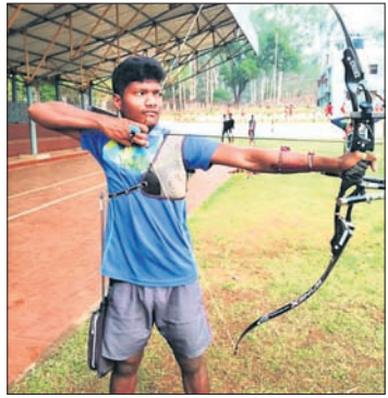
ତୀରନ୍ଦାଜ ଅଭ୍ୟାସ କରୁଛନ୍ତି ଏକା। ଜିଲ୍ଲା ତାଟିକ ଗତ ୩୧ ତାରିଖରେ ମୁହୂର୍ତ୍ତ ଯିଛି। ଫଳରେ ଏକାଙ୍କ ସହ ଭଉଣୀ...