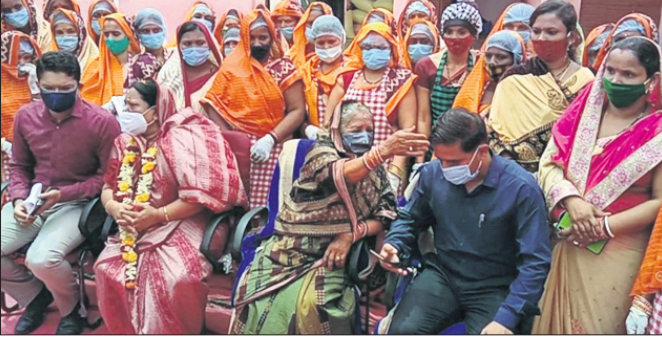
ଉପସ୍ଥିତ ଜିଲ୍ଲାପାଳ, ଏମପି, ବିଧାୟକ ଓ ଅନ୍ୟମାନେ ।