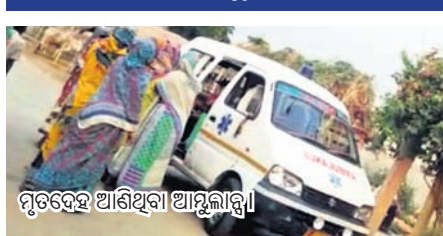
ମୃତଦେହ ଅଣିଥିବା ଆଶୁରୀକୁ।

କରିଥିଲେ। ସାମାଜିକ ମୃତଦେହ ଏକ ଆଶୁରୀଙ୍କୁ ନେଇ ସ୍ତ୍ରୀ ନିଜ ଗ୍ରାମରେ ପହଞ୍ଚିଥିଲେ ହେଁ ଭଉଣୀଙ୍କ ପରିବାର ଗ୍ରହଣ କରି ନ ଥିଲେ। ଫଳରେ ଦୀର୍ଘଦିନ ଧରି ମୃତଦେହ ଆଶୁରୀଙ୍କୁ ପଡ଼ିରହିଥିଲା। ଏ ସମ୍ପର୍କରେ ବନ୍ଧାଙ୍କୁ ଆଶ୍ଚର୍ଯ୍ୟରେ ପଡ଼ିଥିଲା।