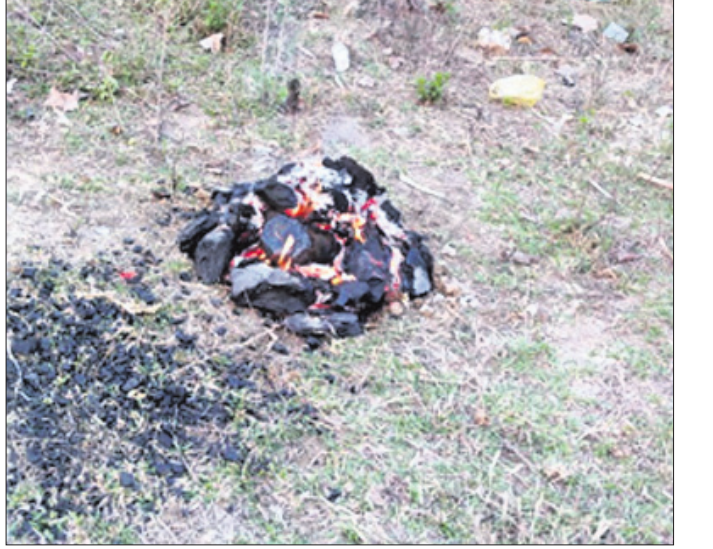
ଟିକ୍ସଟ ହୋଇଥିବା ମା' ହିଙ୍ଗୁଳାଙ୍କ ଉଦ୍ଧାର ପାଇଁ

ତାଳଚେରର ଅଧିକାରୀଙ୍କ ଦେବା ଅଗ୍ରାଧିକାରୀ ମା' ହିଙ୍ଗୁଳାଙ୍କ ଉଦ୍ଧାର ପାଇଁ ଟିକ୍ସଟ ହୋଇଛି।