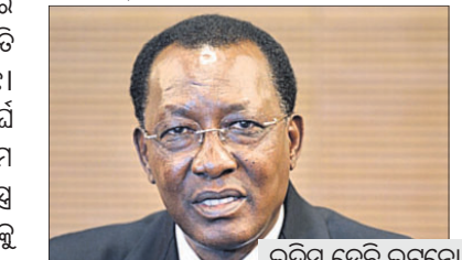
ଲକ୍ଷ୍ମୀଭଦ୍ର ତେବେ ଲକ୍ଷ୍ମୀଭଦ୍ର

ତିନି ଦଶନ୍ଧି ଧରି କ୍ଷମତାରେ ରହିବା ପରେ ବିଦ୍ରୋହୀଙ୍କ ସହ ସଂଘର୍ଷରେ ତାଙ୍କୁ ରାଷ୍ଟ୍ରପତି ଲକ୍ଷ୍ମୀଭଦ୍ର ତେବେ ଲକ୍ଷ୍ମୀଭଦ୍ର ଜୀବନ ଯାଇଛି। ୬୮ ବର୍ଷୀୟ ଲକ୍ଷ୍ମୀଭଦ୍ର କ୍ଷମତାରେ ଦୀର୍ଘ ସମୟ ଧରି ରହିଥିବା ଆଫ୍ରିକାର ଅନ୍ୟତମ ଶାସକ। ୧୯୯୦ ଦଶକରେ ଏକ ସଶସ୍ତ୍ର ବିଦ୍ରୋହ ପରେ ସେ ଶାସନ ଭାର ହାତକୁ ନେଇଥିଲେ। ଏହି ସାବିତ୍ରୀମ ରାଷ୍ଟ୍ରର ସୁରକ୍ଷା ପାଇଁ ଯୁଦ୍ଧଭୂଇଁରେ ଲକ୍ଷ୍ମୀଭଦ୍ର କେଉଁ କଣେ କଣେ ଜେନେରାଲ ସୂତନା ଦେଇଛନ୍ତି। ଏପ୍ରିଲ ୧୧ରେ ତାଙ୍କୁ ରାଷ୍ଟ୍ରପତି ନିର୍ବାଚନ ଅନୁଷ୍ଠିତ ହୋଇଥିଲା। ଯୋଗଦାନ ଆସିଥିବା ପକ୍ଷପକ୍ଷ ତାଙ୍କ ସପକ୍ଷରେ ଯାଇଥିଲା। ଲକ୍ଷ୍ମୀଭଦ୍ର ୮୦% ଭୋଟ ପାଇଥିବାରୁ ତାଙ୍କ ପାଇଁ ଷଷ୍ଠ ଥର ଲାଗି ଆଉ ୬ ବର୍ଷ ରାଷ୍ଟ୍ରପତି ଆସନ ଅଳଙ୍କୃତ କରିବାର ପଥ ପରିଷ୍କାର ହୋଇଥିଲା। ପତ୍ନୀଙ୍କୁ ଲିବ୍ୟାର ବିଦ୍ରୋହୀଙ୍କ ବିରୋଧରେ ଏହାକୁ ଏକ ମହାନ ବିଜୟ ବୋଲି ସେନା ପକ୍ଷରୁ ଘୋଷଣା କରାଯାଇଥିଲା। ତେବେ ପ୍ରଫ୍ଟ ଫର୍ଡ଼ ଡାକ୍ତରୀ ଆଞ୍ଚ କନ୍ଦକର୍ତ୍ତ