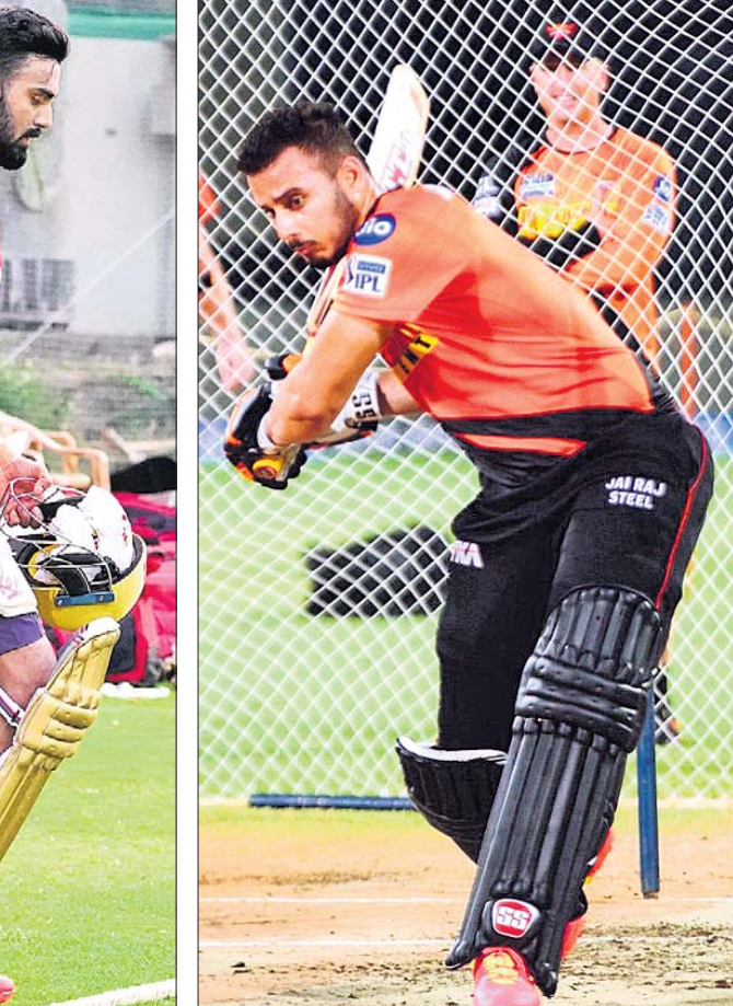
ନେତୃତ୍ୱରେ ପଞ୍ଜାବ କିଙ୍ଗ୍ସ ଅଧିନାୟକ ଲୋକେଶ୍ ରାହୁଲ୍ ଓ ସନ୍ତୋରାଇଜର୍ସ୍ ହାଇଦ୍ରାବାଦର ଅବସ୍ଥା ସମ୍ପର୍କରେ।

କୁମାର ଓ ଟି. ନଚରାଜନ ମଧ୍ୟ ଦୁର୍ବଳ ପ୍ରଦର୍ଶନ ଜାରି ରଖିଛନ୍ତି। ଗତ ମ୍ୟାଚ୍ରେ ନଚରାଜନଙ୍କ ବଦଳରେ ଖଲିଲ ଅହମ୍ମଦଙ୍କୁ ସୁଯୋଗ ମିଳିଥିଲା ଓ ସେ ଭଲ ପ୍ରଦର୍ଶନ କରିଥିଲେ ଓ ମୁମ୍ବାଇକୁ ରୋକିବାରେ ବିଫଳ ହୋଇଥିଲେ। ରସିଦ୍ ସମ୍ପର୍କରେ ବ୍ୟୟ କରିଥିଲେ ମଧ୍ୟ ପୁରୁଣା ପ୍ରଦର୍ଶନକୁ ବୋହୋଇବାରେ ବିଫଳ ହୋଇଛନ୍ତି। ଅପରପକ୍ଷରେ ପଞ୍ଜାବ ପ୍ରଥମ ମ୍ୟାଚ୍ରେ ବିଜୟୀ ହୋଇଥିଲେ ମଧ୍ୟ ପରବର୍ତ୍ତୀ ୨ଟି ମ୍ୟାଚ୍ରେ ପରାସ୍ତ ହୋଇଛି। ଚେନ୍ନାଇ ବିପକ୍ଷରେ ପଞ୍ଜାବ ବ୍ୟାଟିଂ ବିପର୍ଯ୍ୟୟର ସମ୍ମୁଖୀନ ହୋଇଥିଲା। କିଛି ଦିଲ୍ଲୀ ବିପକ୍ଷରେ ରାହୁଲ୍ ୬୬ ଓ ମୟଙ୍କ ଅଗ୍ରୱାଲ ୬୯ ରନର ଅର୍ଦ୍ଧଶତକୀୟ ପାଳି ଖେଳି ୧୯୫ ରନର ବଡ଼ ସ୍କୋର ହାସଲ କରିଥିଲେ। ତେବେ ବୋଲରଙ୍କ ଦୁର୍ବଳ ପ୍ରଦର୍ଶନ ପାଇଁ ଦଳ ପରାଜୟ ବରଣ କରିଥିଲା। ମହମ୍ମଦ ସାମି ଭଲ ପ୍ରଦର୍ଶନ କରିଥିଲେ ମଧ୍ୟ ଦୁଇ ଅଧିକାରୀଙ୍କୁ ଦୃଢ଼ ବୋଲର ଝେ ଚିତାଧିକାର ଓ ରିଲେ ମନେହେଉଥିବା ବେଶ୍ ମହଙ୍ଗା ସାବ୍ୟସ୍ତ ହୋଇଛନ୍ତି। ସବୁ ମ୍ୟାଚ୍ରେ ଏହି ଦୁଇ ବୋଲର ବହୁ ରନ ବ୍ୟୟ କରିଛନ୍ତି। ତେଣୁ କ୍ରିକ୍ ଗୋଟିନକୁ ଦଳରେ ସାମିଲ କରିବାକୁ ରାହୁଲ୍ ନିଶ୍ଚିତ ନେବା ଉଚିତ୍ ହେବ। ଯୁବ ଦୁଇ ବୋଲର ଅର୍ଦ୍ଧାଦି ପଞ୍ଜାବ ପାଇଁ ପ୍ରଭାବୀ ପ୍ରଦର୍ଶନ କରିଛନ୍ତି। ପଞ୍ଜାବ