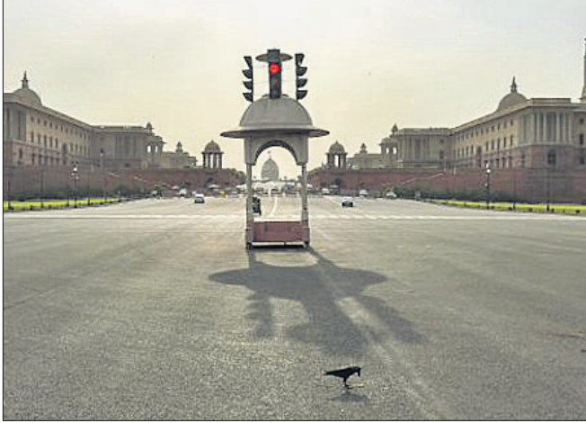
ନୂଆଦିଲ୍ଲୀ: ଲକ୍ଷ୍ମୀଭଦ୍ର ବେଳେ କନଶ୍ଚୁମି ବିକସ ଚୌକ।

ଆମେ ଭୂତାତ୍ମକ ଭୟାବହତାକୁ ଭୁଲିବାରେ ଲାଗିଥିଲେ। କିନ୍ତୁ ମାଙ୍କ ଶେଷରେ ପୁଣି ପୁଣି ଚେକିଲା କରାଗଲା। ଏପ୍ରିଲ ୪ରେ ୧ ଲକ୍ଷ ୩ ହଜାର ୭୯୩ ନୂଆ ସଂକ୍ରମିତ ଚିହ୍ନ ହୋଇଥିବାବେଳେ ୪୭୭ ଜଣଙ୍କ ମୃତ୍ୟୁ ଘଟିଥିଲା। ସ୍ୱାସ୍ଥ୍ୟ ମନ୍ତ୍ରାଳୟର ସୂଚନାମୁତାବେଳେ ଭାରତରେ ମଙ୍ଗଳବାର ସକାଳ ୮ଟା ବୁଝା ୨୪ ଘଣ୍ଟା ମଧ୍ୟରେ ୨,୪୯,୧୭୦ ନୂଆ ସଂକ୍ରମିତ ଚିହ୍ନ ହୋଇଛନ୍ତି। ମୋଟ ଆକ୍ରାନ୍ତଙ୍କ ସଂଖ୍ୟା ୧,୫୩,୨୧,୦୮୯ରେ ପହଞ୍ଚିଥିବାବେଳେ ସକ୍ରିୟ ମାମଲା ୨୦ ଲକ୍ଷ ଚିହ୍ନ ଦିନକରେ ୧,୭୭୧ ଜଣଙ୍କ ଜୀବନ ଯିବା ପରେ ମୋଟ ମୃତ୍ୟୁସଂଖ୍ୟା ୧,୮୦,୫୩୦ରେ ପହଞ୍ଚିଛି। ସବୁରୁ ବିପଜ୍ଜନ ବିଷୟ ହେଉଛି ଏହି ଲହରରେ ଛୋଟପିଲା ସଂକ୍ରମଣ କବଳକୁ ଆହୁରିଛି। ତେଣୁ ସାରା ଦେଶରେ ହାହାକାର।