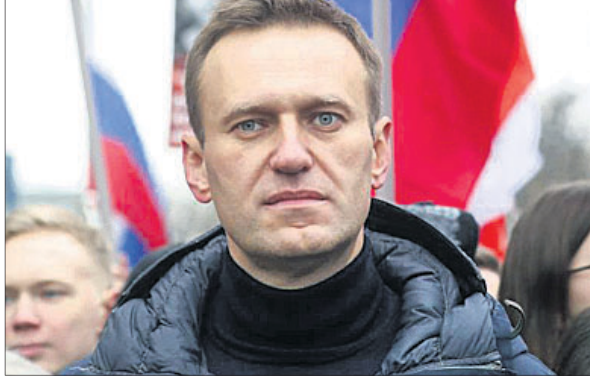
ଆଲେକ୍ସି ନଭଲନିଙ୍କ ସ୍ୱାସ୍ଥ୍ୟ ସଙ୍କଟାପନ୍ନ

୩ ସପ୍ତାହ ଧରି ଜେଲରେ ଅନଶନ କାରି ରଖିଥିବା ରୁଷ୍ଟ ରାଷ୍ଟ୍ରପତି ଭ୍ଲାଡିମିର ପୁଟିନଙ୍କ ବିରୋଧୀ ଦଳ ନେତା ଆଲେକ୍ସି ନଭଲନି(୪୪)ଙ୍କ ସ୍ୱାସ୍ଥ୍ୟାବସ୍ଥା ସଙ୍କଟାପନ୍ନ ରହିଛି। ସେ କୌଶସି ମୁହୂର୍ତ୍ତରେ ତାଙ୍କର ମୃତ୍ୟୁ ଘଟିପାରେ ବୋଲି ନଭଲନିଙ୍କ ଡକ୍ଟର କହିଛନ୍ତି। ଯୋଗଦାନ ତାଙ୍କୁ ମସ୍କୋରୁ ପ୍ରାୟ ୧୮୦ କିମି ଦୂର ଭ୍ଲାଡିମିରରେ କର୍ମଚାରୀ ପାଇଁ ଉଦ୍ଧୃଷ୍ଟ ହସ୍ପିଟାଲକୁ ଘ୍ନାନାଥର କରାଯାଇଥିବା ଜଣାପଡ଼ିଛି। ଖାଦ୍ୟଗ୍ରହଣ କରୁ ନ ଥିବା ନଭଲନିଙ୍କ ସ୍ୱାସ୍ଥ୍ୟରେ ତୀବ୍ର ଅବନତି ଘଟୁଥିବା ନେଇ ୨ ଦିନ ପୂର୍ବରୁ ତାଙ୍କ ଡାକ୍ତର ସୂଚନା ଦେଇଥିଲେ। ଘଟଣାରେ ଆମେରିକା ତୀବ୍ର ପ୍ରତିକ୍ରିୟା ରଖିଛି। ଜେଲରେ ନଭଲନିଙ୍କ ମୃତ୍ୟୁ ଘଟିଲେ ମସ୍କୋ ଏହାର ପରିଣାମ