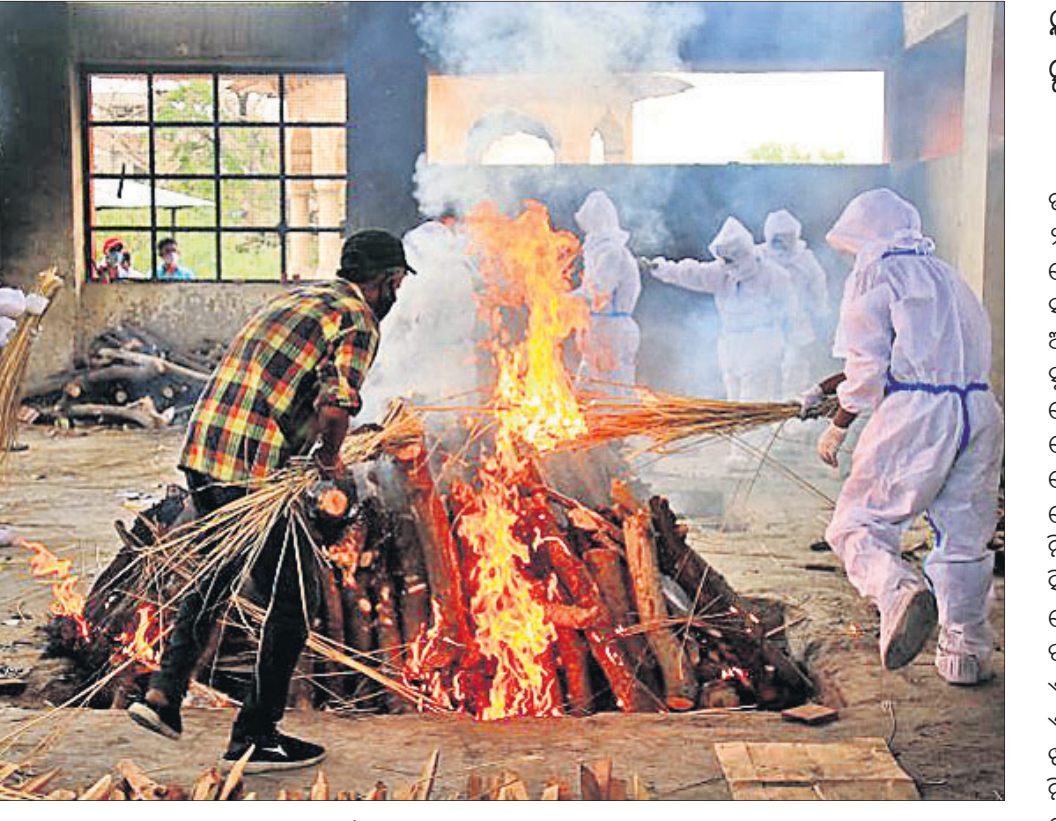
ଜୟପୁର: ଆଦର୍ଶ ନଗର ମୋକ୍ଷାମଣ୍ଡଳରେ ମୃତକଙ୍କ ପରିବାର ଲୋକେ ସୁରକ୍ଷାମୂଳକ ସୁଦ୍ ପିନ୍ଧି ଶେଷକୃତ୍ୟ ସମ୍ପନ୍ନ କରୁଛନ୍ତି।

ରାଞ୍ଚି, ୨୦୧୪: ଦ୍ରୁତ ସଂକ୍ରମଣକୁ ଅତ୍ୟାବଶ୍ୟକ ସେବା ଛାଡ଼ିଦେଲେ ଦୃଷ୍ଟିରେ ରଖି ଝାଡ଼ଖଣ୍ଡ ସରକାର ଅନ୍ୟ କାର୍ଯ୍ୟସବୁ ବନ୍ଦ ରହିବ। ରାଜ୍ୟରେ ଲକ୍ଷ୍ମୀଭଦ୍ର ଘୋଷଣା ଧର୍ମାନ୍ୱୟାନ ଖୋଲା ରହିବ ବୋଲି କହିଛନ୍ତି। ଏପ୍ରିଲ ୨୨ ସକାଳ ୬ଟାକୁ ଶ୍ରଦ୍ଧାଳୁଙ୍କ ପ୍ରବେଶକୁ ଅନୁମତି ମିଳିବ ନାହିଁ। କଟକଣାକୁ କଢ଼ାକଢ଼ି ପାଳନ ଲାଗୁ ହେବ ବୋଲି ମଙ୍ଗଳବାର କନିଷ୍ଠାମନ୍ତ୍ରୀ ହେମନ୍ତ ସୋରେନ ଘୋଷଣା କରାଯାଇଛି। ଏହି ସମୟରେ