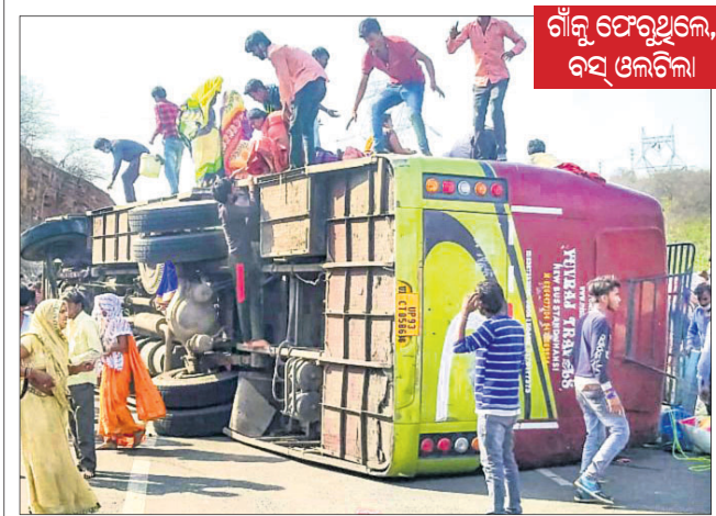
ଗାଁକୁ ଫେରୁଥିଲେ, ବସ୍ ଓଲଟିଲା। ଗତ ବର୍ଷ ଭଳି ପୁଣି ଘରପୁଅ ହେଲେଣି ପ୍ରବାସୀ ଶ୍ରମିକ। ବିଭିନ୍ନ ରାଜ୍ୟରେ ଲକ୍ଷ୍ମୀଭଦ୍ର ଓ କର୍ମ୍ମ ଭଳି କଟକଣା କାରି କରାଯିବା ପରେ କାଟିବା ହରାଇ ଘରକୁ ଫେରିବା ପାଇଁ ବ୍ୟସ୍ତ, ରେଳ ଷ୍ଟେସନରୁଦୂରରେ ହଜାର ହଜାର ସଂଖ୍ୟାରେ ଭିଡ଼ ଜମାଇଛି। ସେମାନଙ୍କ ଘର ବାହୁଡ଼ା ଦୁଃଖ ଏବେ ଦେଖିବାକୁ ମିଳିଛି। ବାହୁଡ଼ାବେଳେ ଦୁର୍ଘଟଣାର ଶିକାର ହୋଇ ୩ ଶ୍ରମିକଙ୍କ ଜୀବନ ଯାଇଛି ମଧ୍ୟପ୍ରଦେଶର ଗୁାଲିଅରରେ।

ଗୁାଲିଅର, ୨୦୧୪: ମଧ୍ୟପ୍ରଦେଶର ଚିକମଗଡ଼-ଛତ୍ରପୁର ରାସ୍ତାରେ ଯାଉଥିବାବେଳେ ଓଲଟି ପଡ଼ିଥିଲା। ଧାରଣ କ୍ଷମତାଠାରୁ ଅଧିକ ସଂଖ୍ୟାରେ ଯାତ୍ରୀ ସେଥିରେ ଲିଭାରେ ମଙ୍ଗଳବାର ଦୁର୍ଘଟଣାଗ୍ରସ୍ତ ହୋଇଛି। ଏଥିରେ ୩ ଶ୍ରମିକଙ୍କ ମୃତ୍ୟୁ ଘଟିଥିବାବେଳେ ୧୨ରୁ ନେଇ ଯାଉଥିବା ବନ୍ଦୁ ଡ୍ରାଇଭରଙ୍କ ସମେତ ସମସ୍ତ ଷ୍ଟାଫ୍ ମଦ୍ୟପାନ ଭରି କରାଯାଇଛି। ବସ୍‌ଟି ଦିଲ୍ଲୀକୁ ଯାଉଥିବା ଅଭିଯୋଗ ହୋଇଛି।