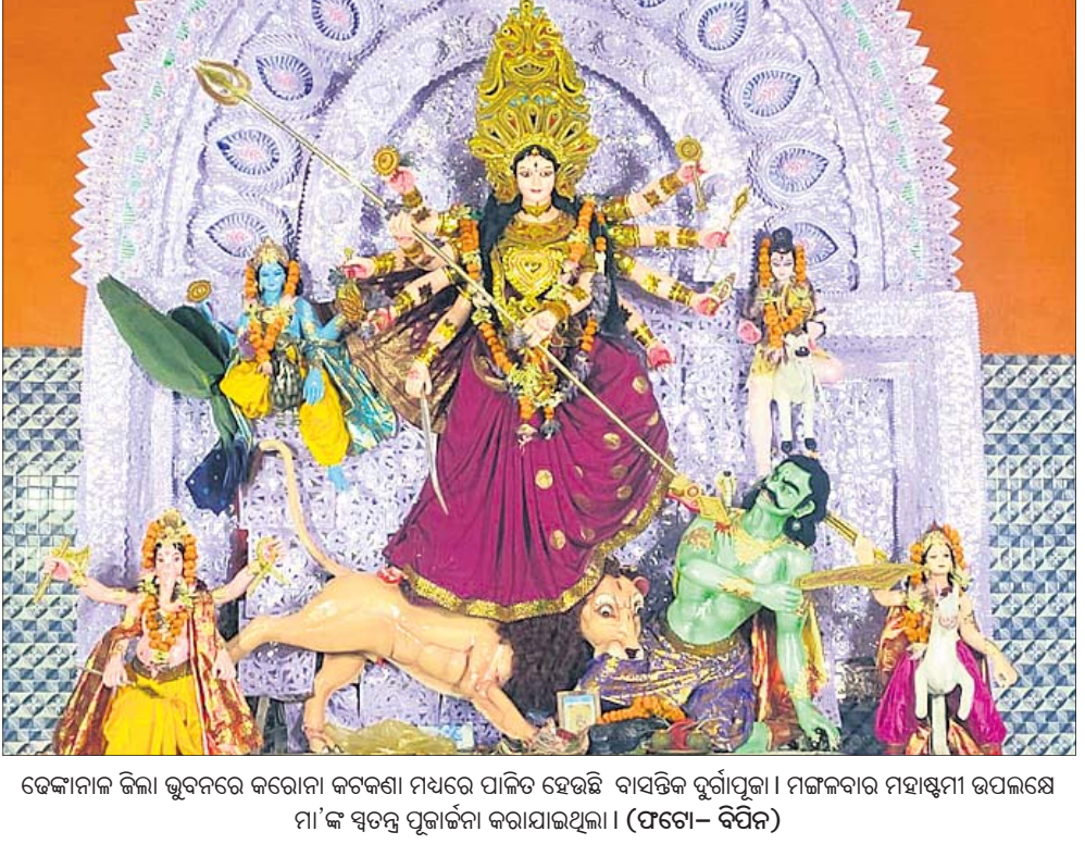
ଡେକାନାଲ ଜିଲ୍ଲା ଭୁବନେଶ୍ୱର କରୋନା କଟକଣା ମଧ୍ୟରେ ପାଳିତ ହେଉଛି ବାସନ୍ତିକ ଦୁର୍ଗାପୂଜା। ମଙ୍ଗଳବାର ମହାଷ୍ଟମୀ ଉପଲକ୍ଷେ ମା'ଙ୍କ ସ୍ୱତନ୍ତ୍ର ପୂଜାର୍ଚ୍ଚନା କରାଯାଇଥିଲା।