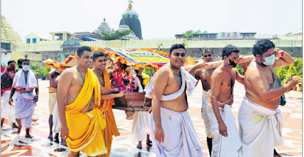
ଅଶୋକାଷ୍ଟମୀ ନୀତି ନିମନ୍ତେ ମଙ୍ଗଳାଙ୍କ ଦିନା ଭକ୍ତରେ ପୂଜା ଶ୍ରୀଲୋକନାଥଙ୍କୁ ଜଗନ୍ନାଥ ବଜ୍ର ପଠକୁ ବିଜେ କରାଯାଇଛି।

ଦେଡ଼ି ମାସରେ ୩୯୬୩ ଜଣଙ୍କ ଜୀବନ ଗଲାଣି ବାଲକାଟୀ, ୨୦୧୪(ଡି.ଏନ୍.ଏ.): ରାଜଧାନୀ ଉପକଣ୍ଠ କୁଆଖୀର ନଦୀ ଏବେ କନସର୍ଭେସନ୍ ପାଇଁ କାଳ ସଫୁଟ ହୋଇଛି।