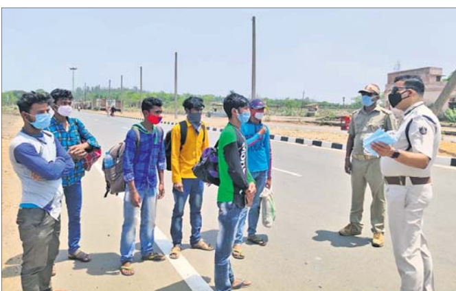
ବାହାର ରାଜ୍ୟରୁ ଆସିଥିବା ଯୁବକମାନଙ୍କୁ ଯୋଗ୍ୟ ମାସ ପହିଲା ପାଇଁ ବୁଧାଭଞ୍ଜ ସେମାନେ ଆରୁ-ପିଏଆର ଚେଷ୍ଟା କରାଯାଇଛି।

ମୟୂରଭଞ୍ଜ ଜିଲ୍ଲାରେ କରୋନା ସଂକ୍ରମଣ ବୃଦ୍ଧିପାଇଁ ଡେକାନାଲ ଅଫିସରେ କାର୍ଯ୍ୟକ୍ରମ ଚଳାଇବାକୁ ନିର୍ଦ୍ଦେଶ ଦିଆଯାଇଛି।