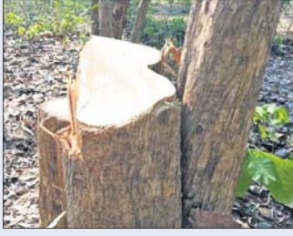
ଦୁର୍ଭିକ୍ଷମାନେ କାଟି ନେଇଥିବା ଶାଗୁଆନ ଗଛ।

କେହି ଦୁର୍ଭିକ୍ଷ କାଟି ନେଇଛି। ଉକ୍ତ ଗଛ ଗ୍ରାମରେ ମହେଶ୍ୱର ଖୁଲାରୁ ବ୍ୟକ୍ତିଗତ ଜମିରେ ଥିଲା।