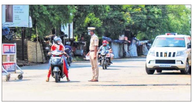
ଅନୁଗୋଳ ପୋଲିସ ପକ୍ଷରୁ ସହରରେ କୋଭିଡ଼ କଟକଣା ଯାଞ୍ଚ କରାଯାଇଛି।